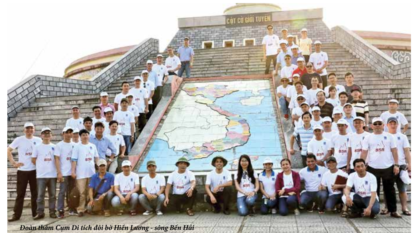
Đoàn thăm Cụm Di tích đồi bờ Hiền Lương - sông Bến Hải