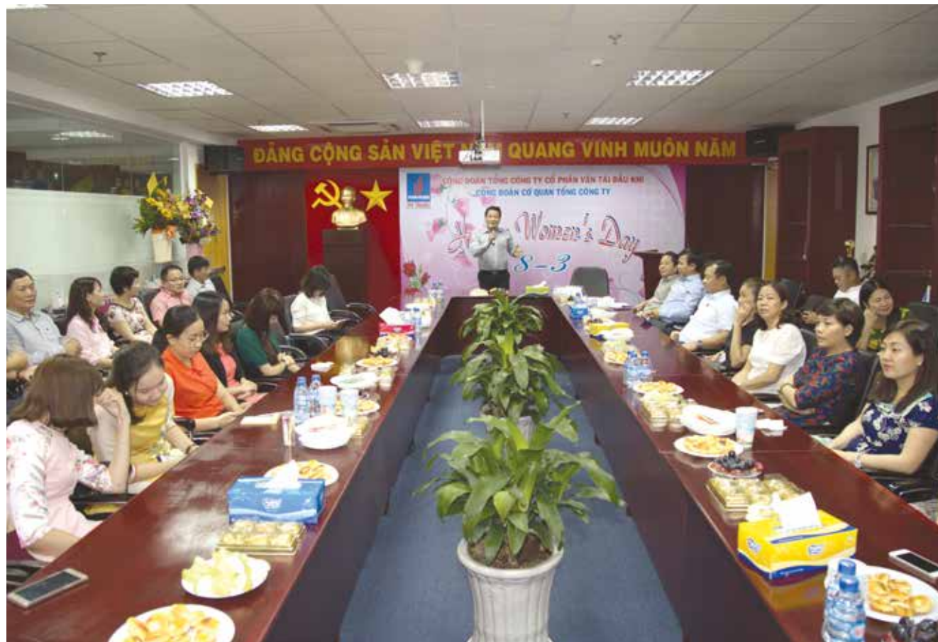
Nữ đoàn viên Công đoàn cơ quan Tổng công ty tại buổi họp mặt Ngày Quốc tế Phụ nữ 8/3

"Ngày hội Hoa Hồng" là tên gọi của buổi gặp mặt, chúc mừng nữ cán bộ, công nhân viên, người lao động (CBCNV-LĐ) thuộc các tổ Công đoàn Văn phòng, Công ty PSM, Công ty Phương Nam, Công ty Pacific... của Công đoàn Tổng công ty Cổ phần Vận tải Dầu khí (PVTRANS).