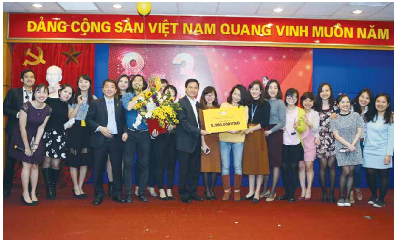
Trao giải Đặc biệt chương trình "Mùng 8 tháng 3", "Soái ca" thể hiện

Nhân kỷ niệm ngày Quốc tế Phụ nữ 8/3, Ban Nữ Công - Công đoàn PVcomBank đã tổ chức thành công chương trình "Mùng 8 tháng 3 - "Soái ca" thể hiện". Các CBCNV-LĐ nữ PVcomBank đã có một ngày được tôn vinh thật đẹp đầy ắp tiếng cười với những kỷ niệm thật đáng nhớ. Các "soái ca" PVcomBank đã cháy hết mình mang lại những món quà ý nghĩa và những phần trình diễn vô cùng ấn tượng và đặc sắc.