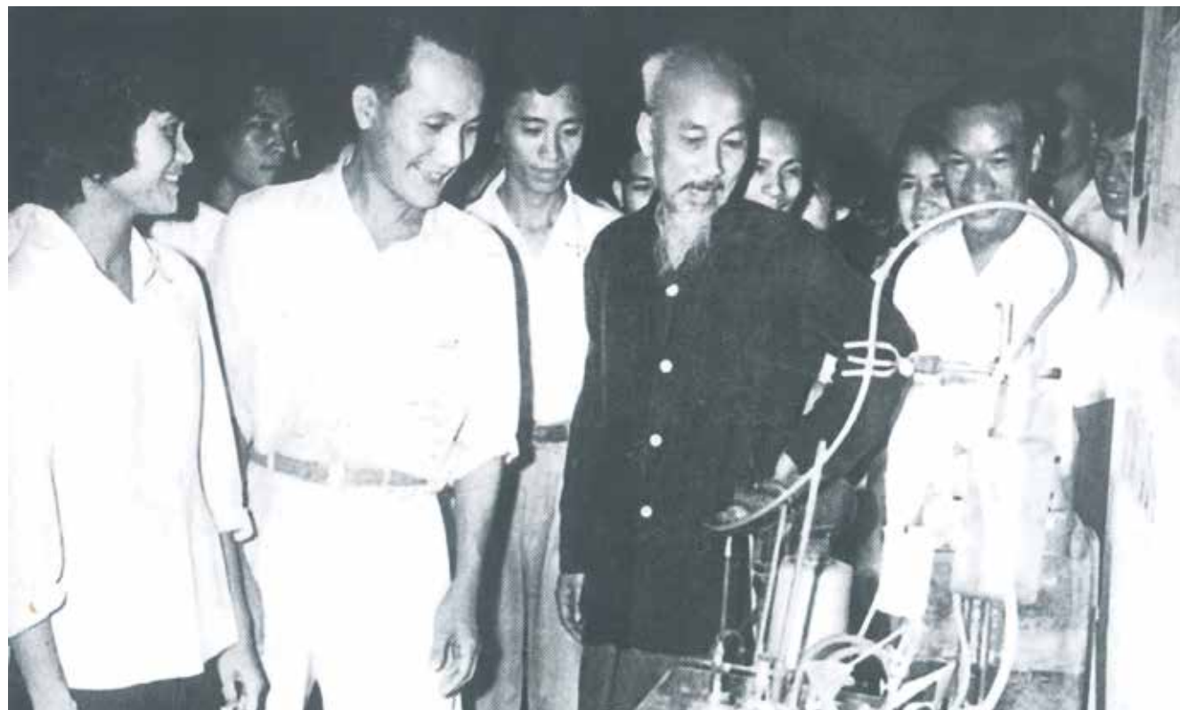
Bác Hồ đến thăm Triển lãm phong trào thi đua "Hai tốt" của ngành giáo dục

UVBTV, Trưởng Ban Tuyên giáo - Nữ công CĐ DKVN