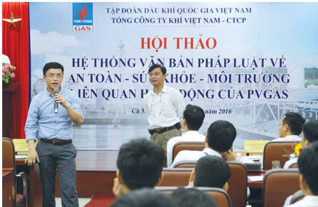
Trao đổi về An toàn - Sức khỏe - Môi trường tại PV GAS

Xác định yếu tố con người là quan trọng nhất trong quá trình xây dựng và phát triển doanh nghiệp, Tổng công ty Khí Việt Nam (PV GAS) luôn chú trọng công tác cán bộ, chăm lo người lao động với nhiều hình thức thiết thực.