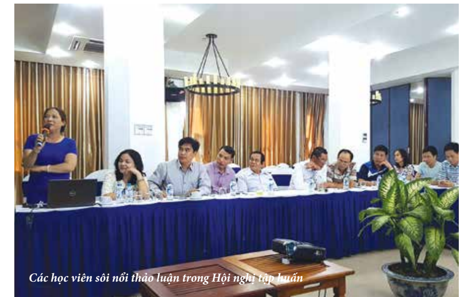
Các học viên sôi nổi thảo luận trong Hội nghị tập huấn

quy định của Tổng Liên đoàn Lao động Việt Nam, Công đoàn Dầu khí Việt Nam và Công đoàn PV Drilling.