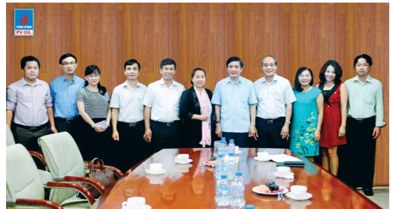
Đồng chí Bùi Văn Cường chụp ảnh lưu niệm với lãnh đạo và Công đoàn PV OIL