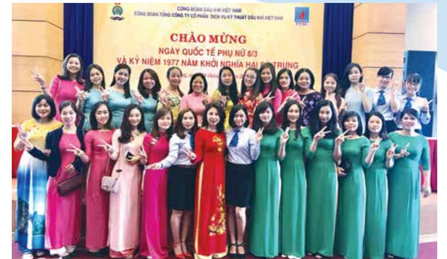
Đại biểu nữ tham dự 8/3 tại khu vực miền Trung