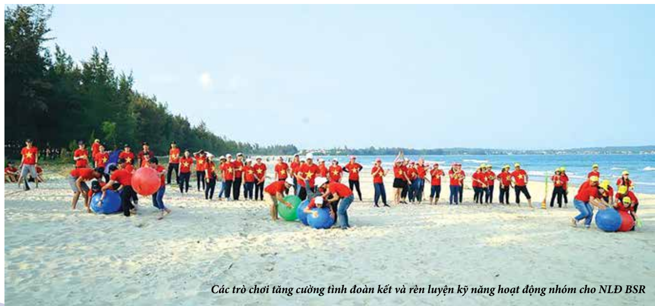
Các trò chơi tăng cường tinh đoàn kết và rèn luyện kỹ năng hoạt động nhóm cho NLD BSR

vượt kế hoạch năm 2017. Đội ngũ nữ CBCNV-LĐ đã có đóng góp quan trọng vào kết quả chung đó. Tại chương trình giao lưu, chị em BSR đã cùng nhau thể hiện tinh thần đoàn kết, sáng tạo, khéo léo, dẻo dai trong nhiều trò chơi tập thể rất ý nghĩa.