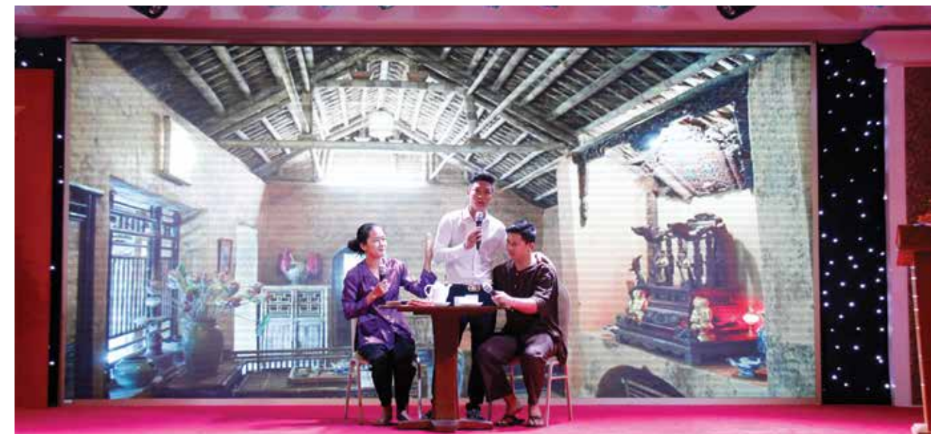
Tiểu phẩm Thiệp chúc mừng 8/3 với thông điệp "Tình mẹ"