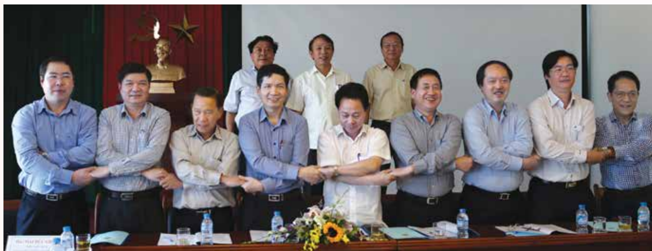
Đại diện 9 Công đoàn Tập đoàn và các Tổng công ty ký Giao ước thi đua năm 2017

9 Công đoàn Tập đoàn, Tổng công ty đã cùng nhau ký kết Bản giao ước thi đua năm 2017. Theo đó, tổ chức tuyên truyền, vận động CBCNV-LĐ trong Khối thực hiện tốt các chỉ thị, nghị quyết của Đảng, chính sách, pháp luật của Nhà nước, các quy định của bộ, ngành, tập đoàn, tổng công ty.