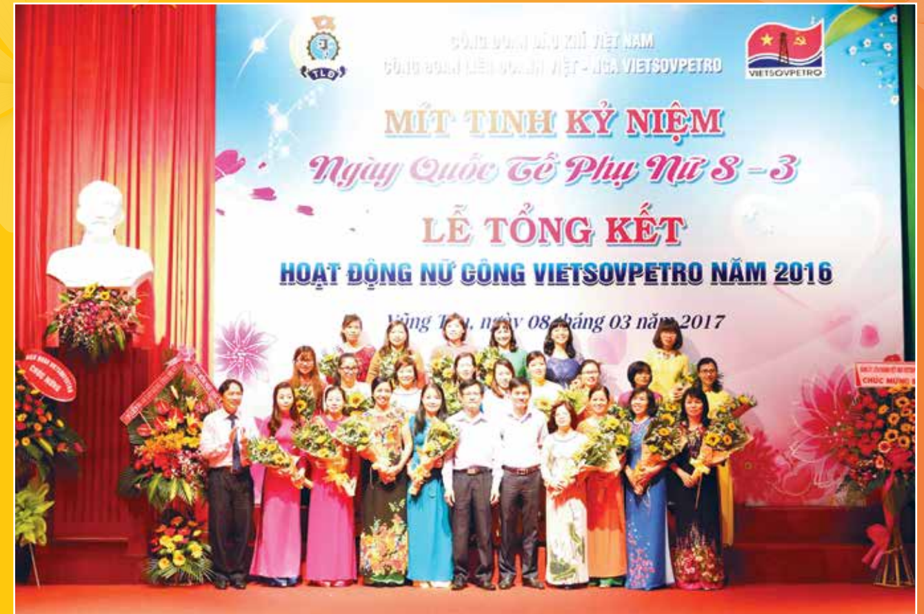
Lãnh đạo Vietsovpetro tặng hoa cho các Nữ công đạt danh hiệu "Hai giới" năm 2016

Bức xúc vì chồng quá khô khan, Mai trách móc: - Chồng người ta mua hoa tặng vợ chẳng cần lý do gì. Còn anh thì chả bao giờ tặng em một bông hoa nào cả, tại sao vậy? Chồng cô nhún vai: - Là do em chứ sao nữa. - Anh nói vậy là có ý gì chứ? Chồng cô thờ dài: - Tiền lương, tiền thưởng, của anh tất cả đều do em giữ hết. Làm gì còn đồng nào mà mua bông với chả hoa nữa. - !!!