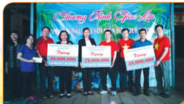
Công đoàn Vietsovpetro, Công đoàn PVEP và Công đoàn PVI trao hỗ trợ các hộ nghèo huyện đảo Lý Sơn thông qua Lãnh đạo UBND huyện