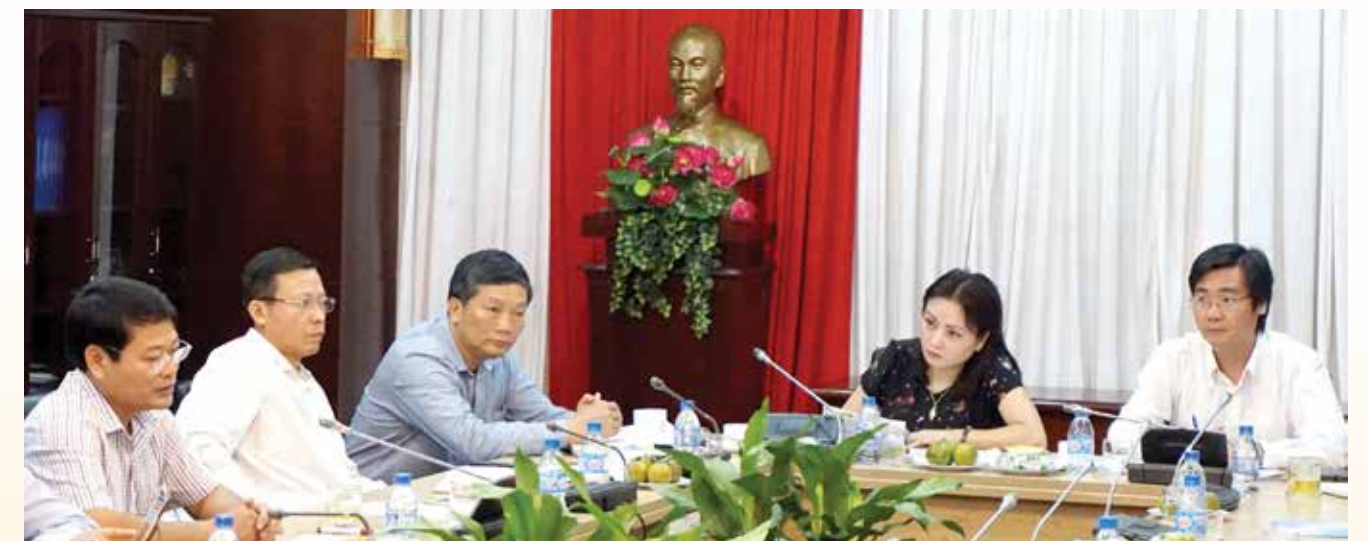
Giao ban công tác Công đoàn Quý I/2017 tại khu vực phía Nam