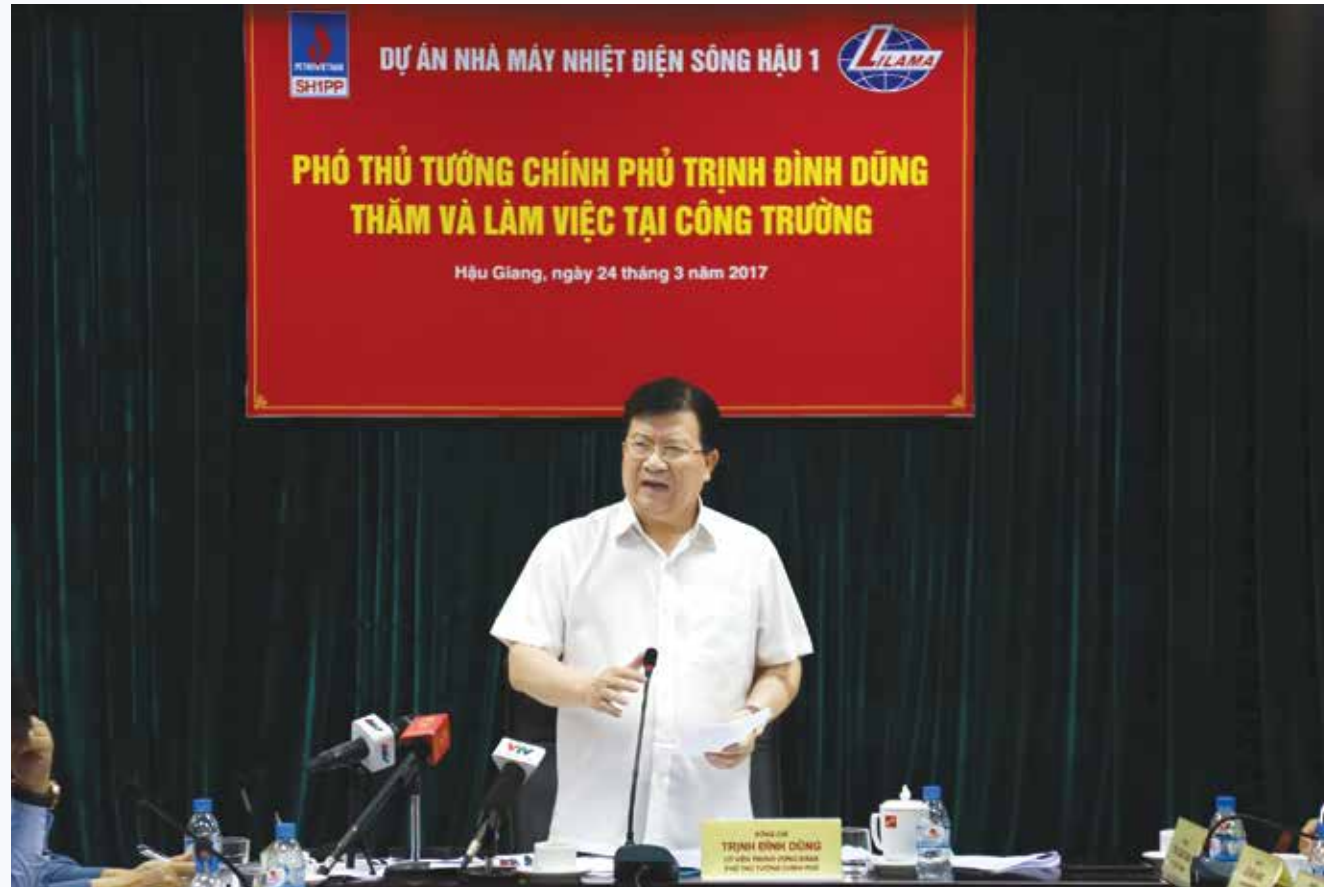
Phó Thủ tướng Trịnh Đình Dũng phát biểu chỉ đạo

Ngày 24/3, Đoàn công tác Chính phủ do Phó Thủ tướng Trịnh Đình Dũng đã có chuyến thăm, kiểm tra việc thi công tại Dự án Nhà máy Nhiệt điện Dầu khí Long Phú 1 (tỉnh Sóc Trăng) và Sông Hậu 1 (tỉnh Hậu Giang).