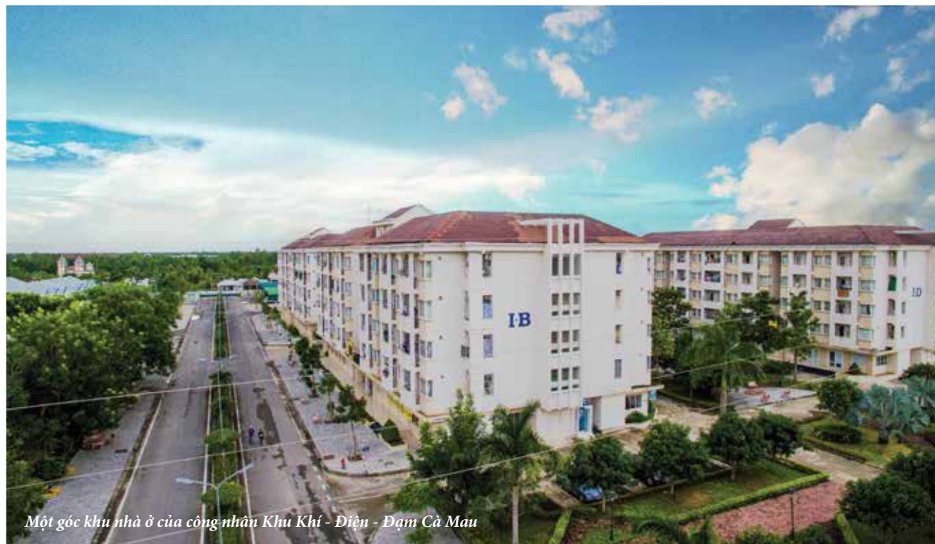
Một góc khu nhà ở của công nhân Khu Khí - Điện - Đạm Cà Mau

Việc triển khai đề án xây dựng các thiết chế phục vụ nhu cầu của công nhân lao động tại các khu công nghiệp, khu chế xuất là vấn đề trọng tâm trong công tác đổi mới hoạt động công đoàn Việt Nam trong thời kỳ đổi mới, tập trung hướng về người lao động (NLĐ), phục vụ, chăm lo tốt hơn quyền lợi thiết thực của NLĐ.