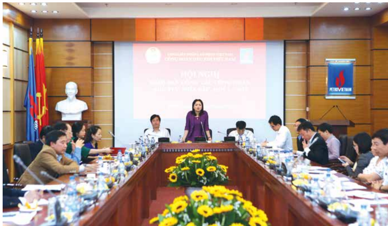
Toàn cảnh Hội nghị Giao ban công tác Công đoàn quý I/2017, khu vực phía Bắc

Trong hai ngày 21-22/3, Công đoàn Dầu khí Việt Nam tổ chức Hội nghị giao ban công tác Công đoàn quý I/2017.