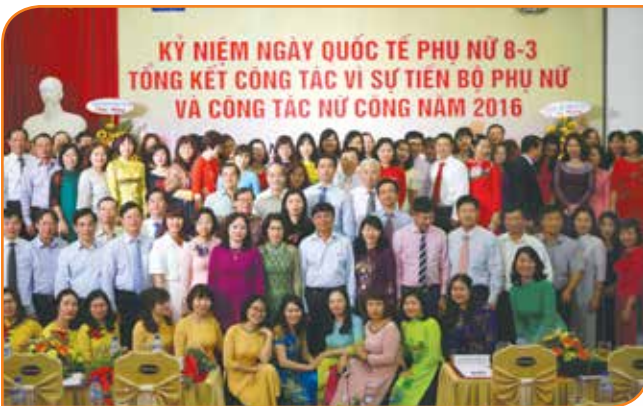
Các đ/c lãnh đạo Tổng LĐLĐVN, Hội LHPNVN, PVN, CĐ DKVN và lãnh đạo, đơn vị chụp ảnh lưu niệm cùng các đại biểu