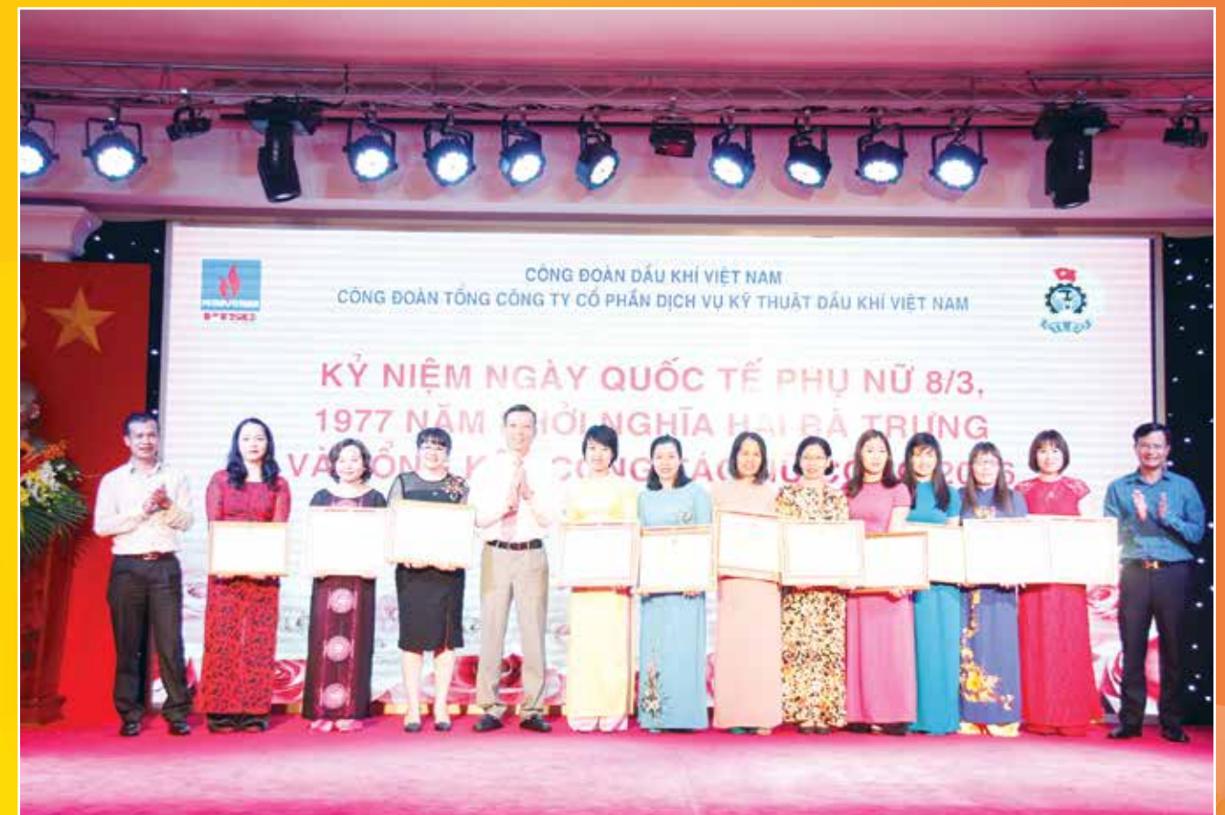
Lãnh đạo công đoàn Tổng Công Ty CP Dịch vụ và Kỹ thuật Dầu khí trao tặng Bằng khen cho gương "Phụ nữ Hai giới" 2016