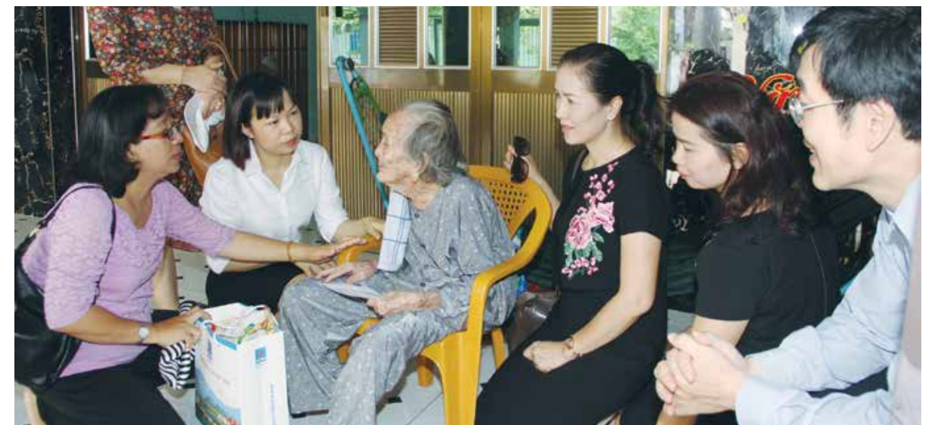
Công đoàn và Ban Nữ công PV GAS thăm hỏi Mẹ Việt Nam Anh hùng tại huyện Nhà Bè, TP. Hồ Chí Minh