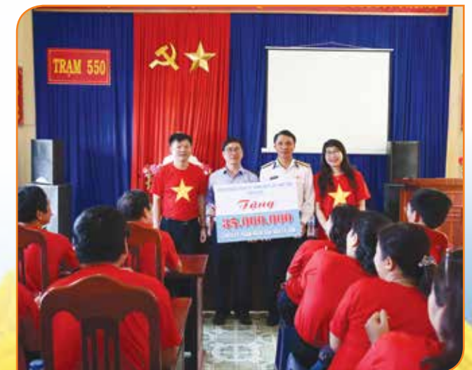
Các đơn vị trao hỗ trợ các hộ nghèo huyện đảo Lý Sơn thông qua Lãnh đạo UBND huyện