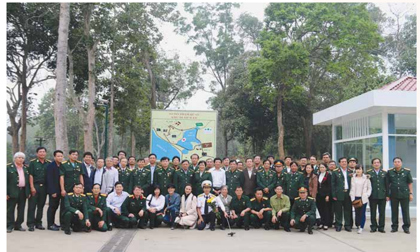
Hội CCB Tập đoàn DKVN chụp ảnh lưu niệm tại khu Di tích K9 - Đá Chông