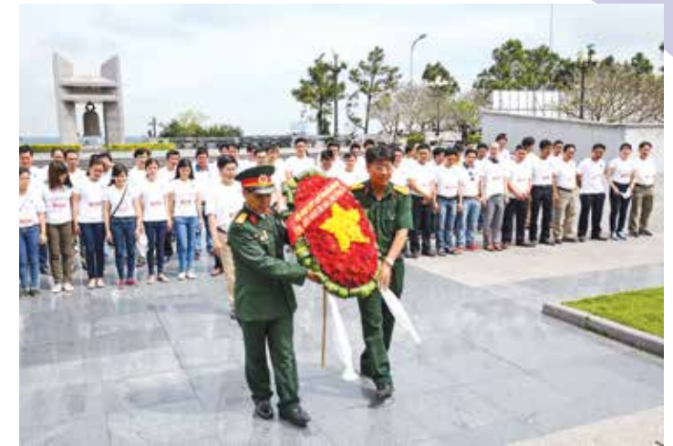
Đoàn dâng hương tại Nghĩa trang Liệt sĩ Quốc gia Đường 9