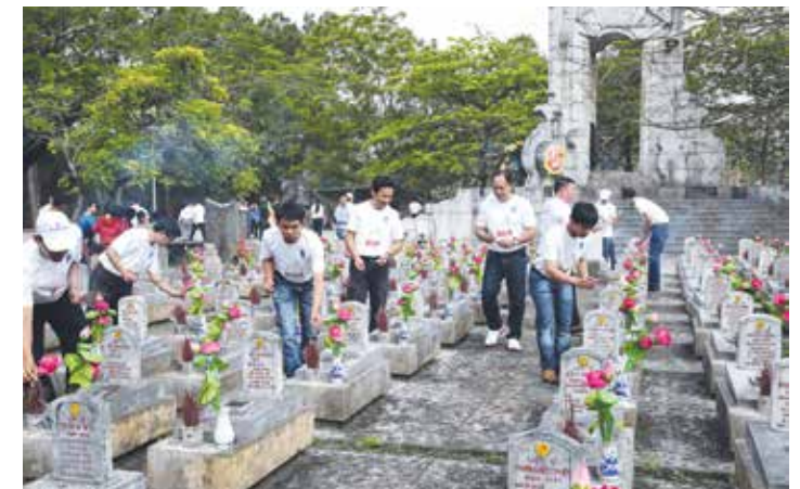
CBCNV-LĐ BSR thắp hương tưởng nhớ các anh hùng, liệt sĩ tại Nghĩa trang Trường Sơn