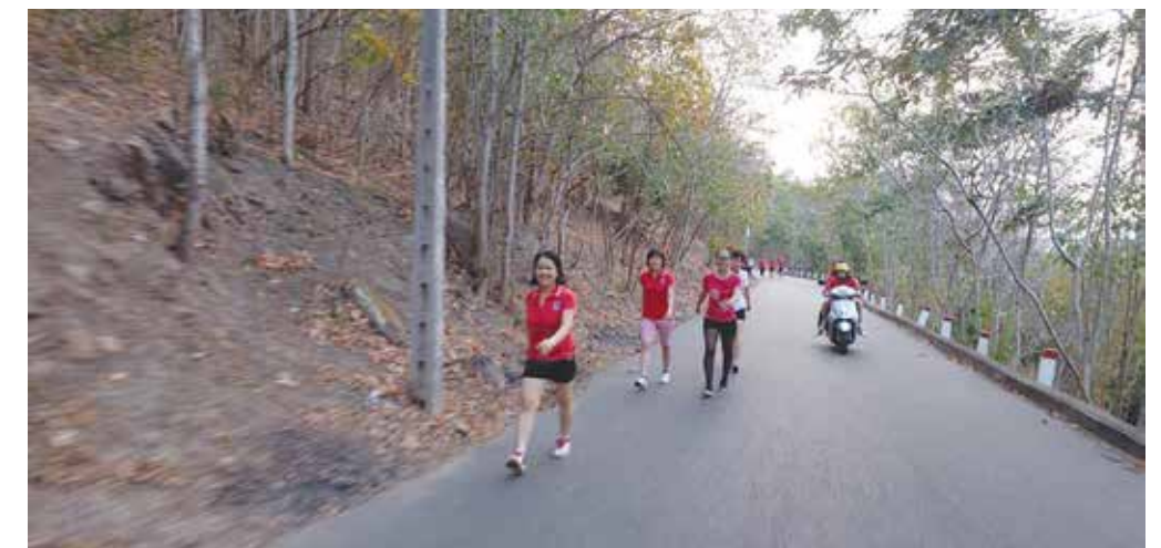
Những người dẫn đầu