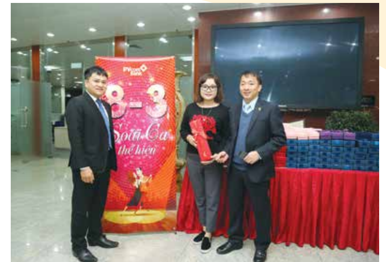
Đại diện Công đoàn PVcomBank chào đón và tặng quà cho các chị em trong ngày 8/3