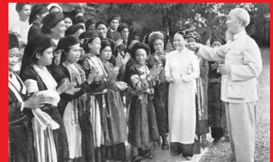
Đại biểu phụ nữ các dân tộc tỉnh Hà Giang về thăm Hà Nội vui mừng được gặp Chủ tịch Hồ Chí Minh (25/11/1965)