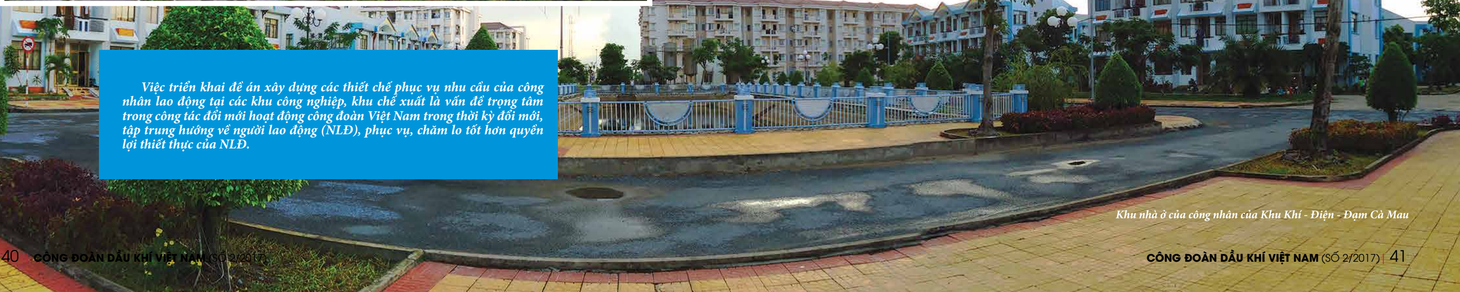
Khu nhà ở của công nhân của Khu Khí - Điện - Đạm Cà Mau