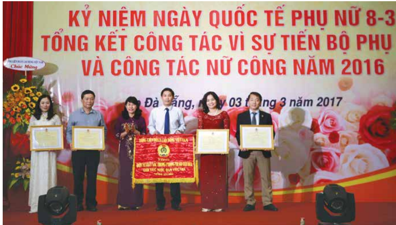
Lãnh đạo Tổng LĐLĐ VN trao Cờ và Bằng khen cho các tập thể, cá nhân xuất sắc

Lọc dầu Dung Quất. Đây là hoạt động thiết thực, nhằm giáo dục truyền thống và bồi đắp lòng tự hào của người lao động dầu khí nói chung, nữ đoàn viên nói riêng, tạo động lực để các đoàn viên công đoàn tiếp tục lao động, cống hiến nhiều hơn nữa cho sự phát triển của ngành, của đất nước.