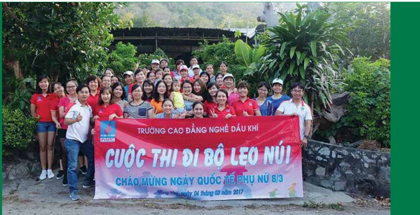
Nữ CBCNV PVMTC tham gia Cuộc thi đi bộ, leo núi chào mừng Ngày Quốc tế Phụ nữ 8/3

Trường Cao đẳng nghề Dầu khí đã tổ chức hội thi đi bộ, leo núi vào ngày 4/3/2017, tại chân núi Lớn, thành phố Vũng Tàu. Đây là hoạt động nhằm chào mừng Ngày Quốc tế Phụ nữ 8/3. Tham dự hội thi có đại diện Ban Giám hiệu, Công đoàn cơ sở và Đoàn Thanh niên cơ sở và gần 100 các VĐV nữ cùng đồng nghiệp thân, bạn bè, đồng nghiệp tới cổ vũ.