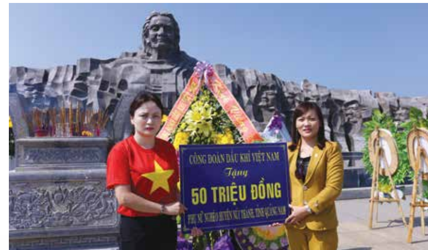
CĐ DKVN tặng 50 suất quà cho phụ nữ khó khăn huyện Núi Thành, tỉnh Quảng Nam