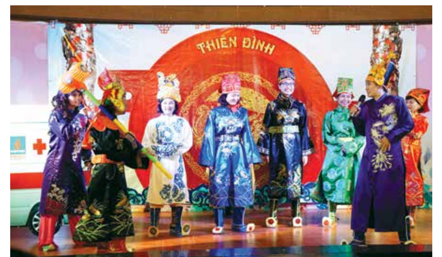
Tiểu phẩm “Táo Thánh Ba” của Ban Nữ công Nhà máy Đạm Phú Mỹ