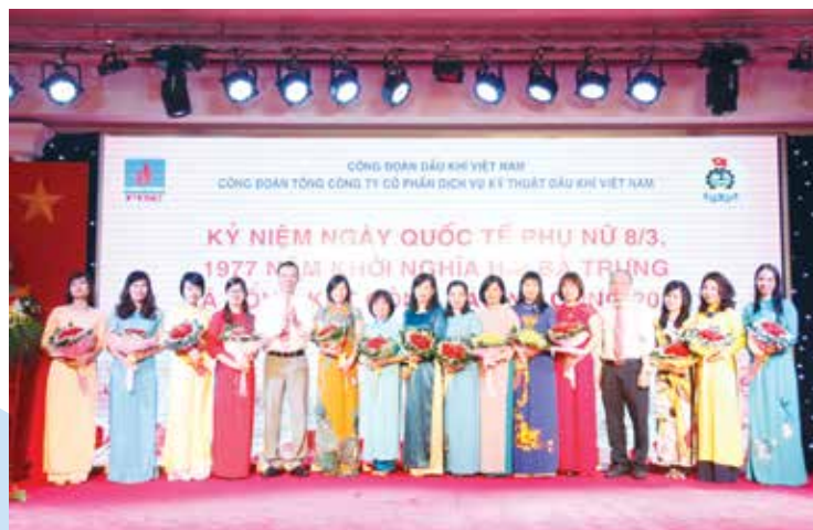
Lãnh đạo CĐ PTSC tặng hoa đại diện cho CBCNV-LĐ nhân ngày 8/3

Công đoàn Tổng công ty Cổ phần Dịch vụ kỹ thuật Dầu khí (PTSC) đã tạo điều kiện, hỗ trợ Ban Nữ công Công đoàn Tổng công ty tổ chức các hoạt động mít tinh ôn lại truyền thống Ngày Quốc tế Phụ nữ 8/3, Khởi nghĩa Hai Bà Trưng và truyền thống đấu tranh kiên cường, bất khuất của phụ nữ Việt Nam; tổng kết công tác nữ công và khen thưởng nữ CBCNV-LĐ đạt danh hiệu "Giỏi việc nước, đảm việc nhà năm 2016"; các hoạt động an sinh nội bộ; tổ chức các hội thi cắm hoa; thiết kế trình diễn thiệp chúc mừng 8/3 cùng các hoạt động giao lưu thiết thực và ý nghĩa tại ba khu vực Bắc, Trung, Nam.