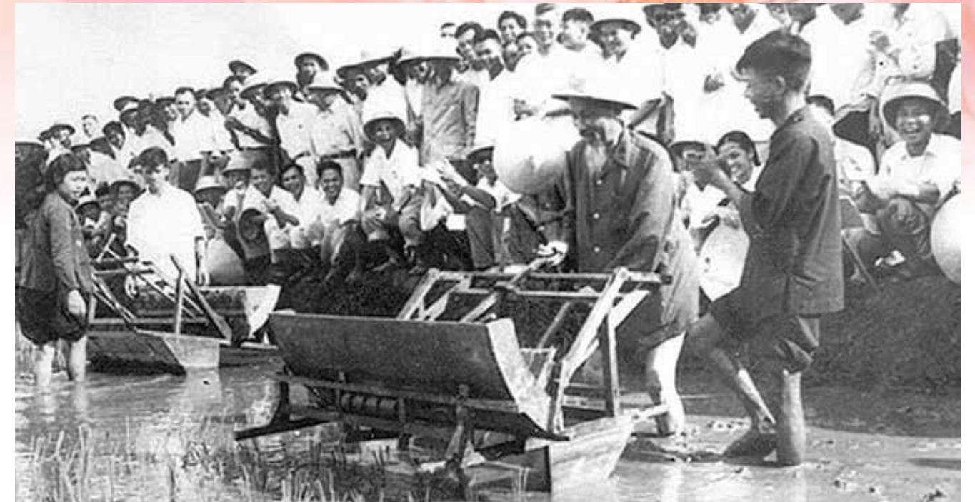
Bác Hồ với nông dân

Ngày 15/5/2016, Bộ Chính trị ra Chỉ thị 05-CT/TW về "Đẩy mạnh học tập và làm theo tư tưởng, đạo đức, phong cách Hồ Chí Minh", căn cứ vào các văn bản hướng dẫn của Tổng Liên đoàn Lao động Việt Nam (LĐLĐ VN), của Đảng ủy Tập đoàn, Công đoàn Dầu khí Việt Nam đã triển khai thực hiện, hướng dẫn các công đoàn trực thuộc quán triệt, thực hiện Chỉ thị 05-CT/TW, với những nội dung, mục đích yêu cầu cụ thể, thiết thực, phù hợp tình hình