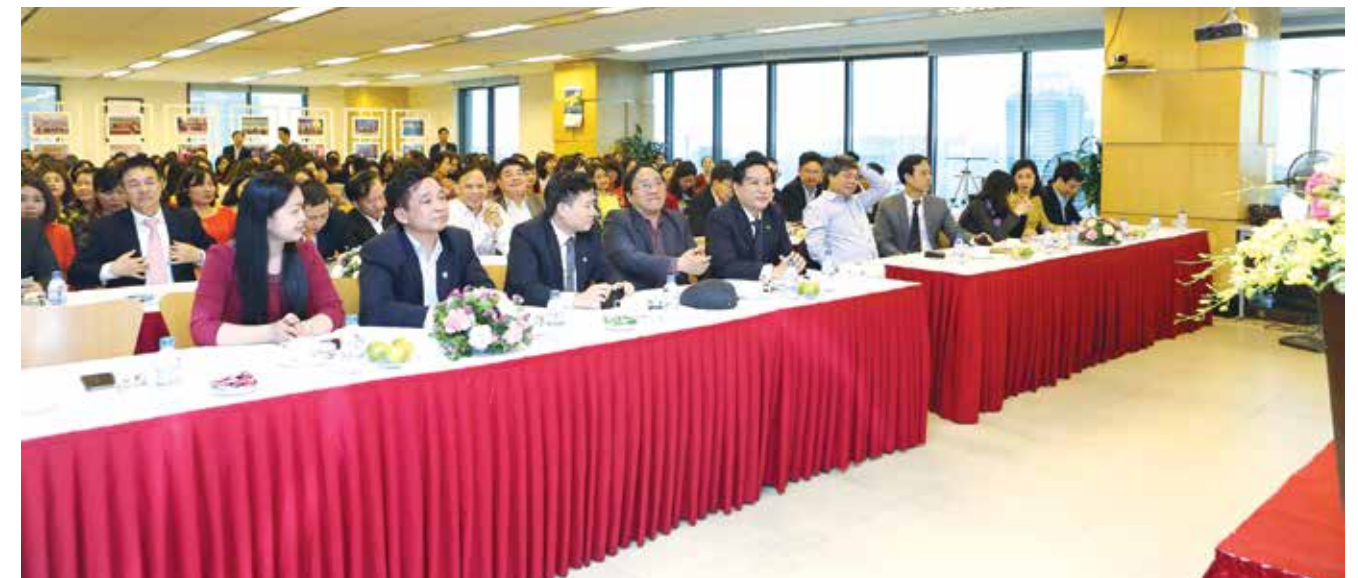
Toàn cảnh buổi gặp mặt Ngày Quốc tế Phụ nữ 8/3