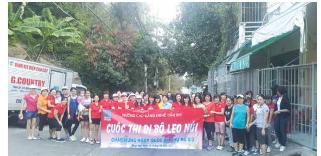
Chụp hình lưu niệm