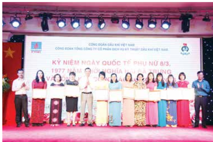
Lãnh đạo CĐ PTSC trao tặng Bằng khen "Giỏi việc nước - Đảm việc nhà" cho nữ CBCNV-LĐ