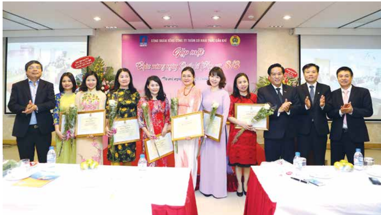
Lãnh đạo CĐ DKVN và lãnh đạo PVEP tặng hoa và Bằng khen cho các cá nhân tiêu biểu

Chiều ngày 8/3/2017 tại Văn phòng PVEP Hà Nội, Tổng công ty Thăm dò Khai thác Dầu khí (PVEP) đã tổ chức gặp mặt cán bộ, công nhân viên nữ Tổng công ty nhân dịp kỷ niệm 107 năm ngày Quốc tế Phụ nữ (8/3/1910 - 8/3/2017) dưới hình thức trực tuyến 2 đầu cầu Hà Nội và Thành phố Hồ Chí Minh