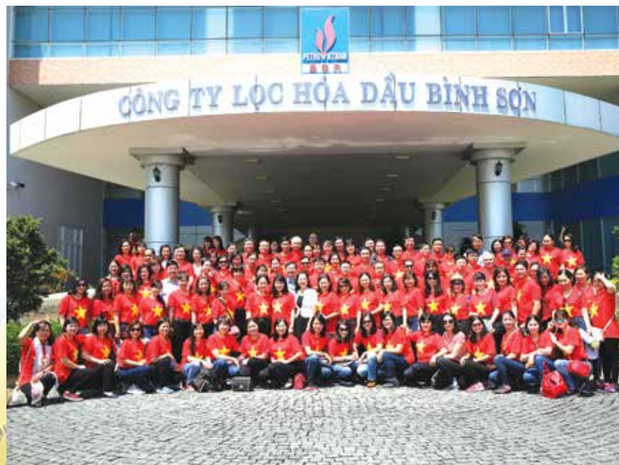
Đoàn đại biểu CĐ DKVN chụp ảnh lưu niệm tại Nhà máy Lọc dầu Dung Quất

Tiếp nối chương trình, đoàn công tác đã đến khánh thành và trao hai nhà "Mái ấm Công đoàn" tại huyện Bình Sơn và huyện Tư Nghĩa, tỉnh Quảng Ngãi. Số tiền hỗ trợ xây hai căn nhà này được trích từ nguồn Quỹ "Vì phụ nữ khó khăn" của CĐ DKVN và Quỹ tương trợ Dầu khí của Tập đoàn DKVN. Mỗi căn nhà