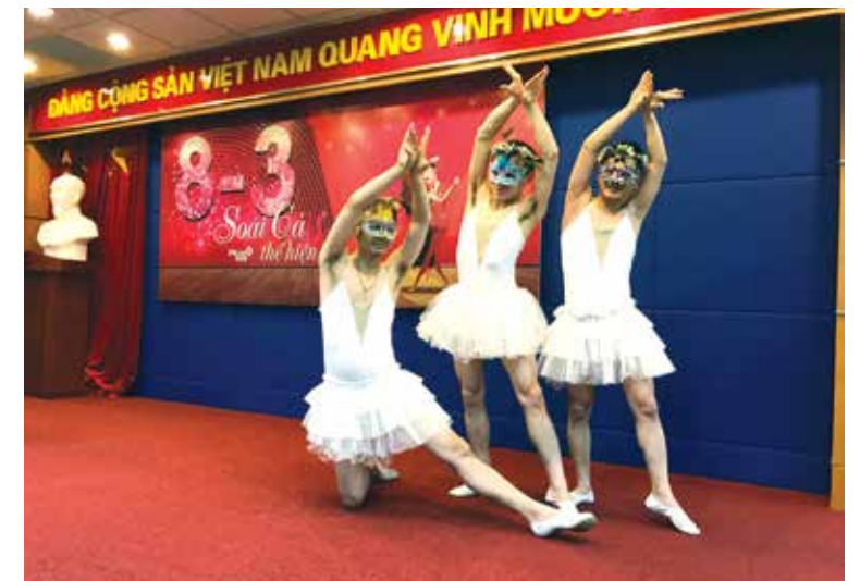
Tiết mục múa Hồ Thiên Nga do các soái ca PVcomBank thể hiện