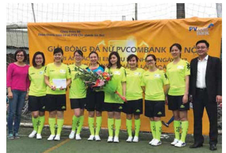
Trưởng Ban Nữ công trao giải cho đội đạt giải Nhì bóng đá nữ khu vực Hà Nội