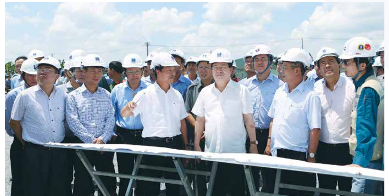
Phó Thủ tướng cùng đoàn công tác thị sát công trường Dự án Nhà máy Nhiệt điện Sông Hậu 1