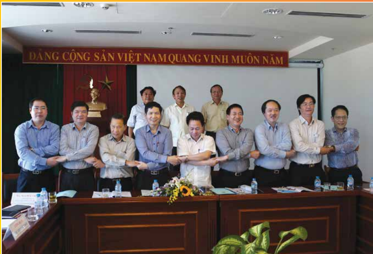
Đại diện 9 Công đoàn Tập đoàn, Tổng Công ty ký Giao ước thi đua