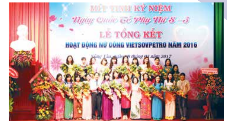
Lãnh đạo CĐ Vietsovpetro tặng hoa cho các cán bộ nữ công xuất sắc