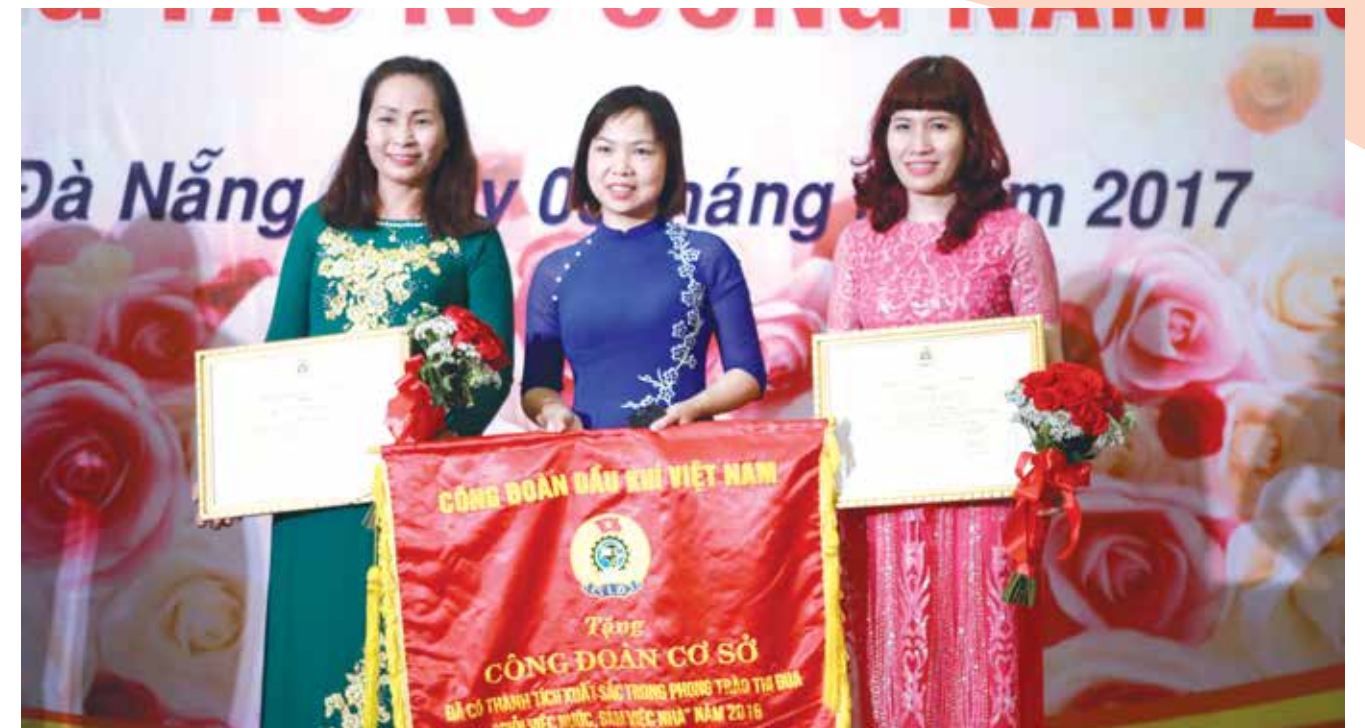
Phong trào nữ công PV GAS nhận được nhiều khen thưởng của Công đoàn DKVN

Tại trụ sở của PV GAS ở TP. Hồ Chí Minh, ngày 7/3, Ban Lãnh đạo, Công đoàn, Ban VSTBPN đã tổ chức gặp gỡ,