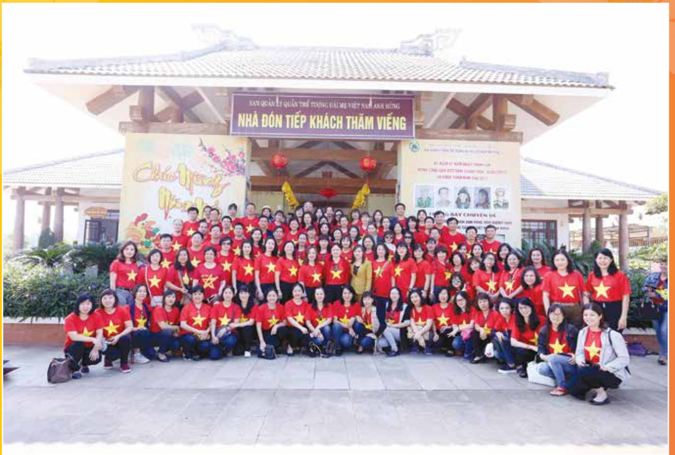
Đoàn đại biểu CD DKVN chụp ảnh tại Nhà lưu niệm - Khu quần thể tượng đài Mẹ Việt Nam Anh hùng