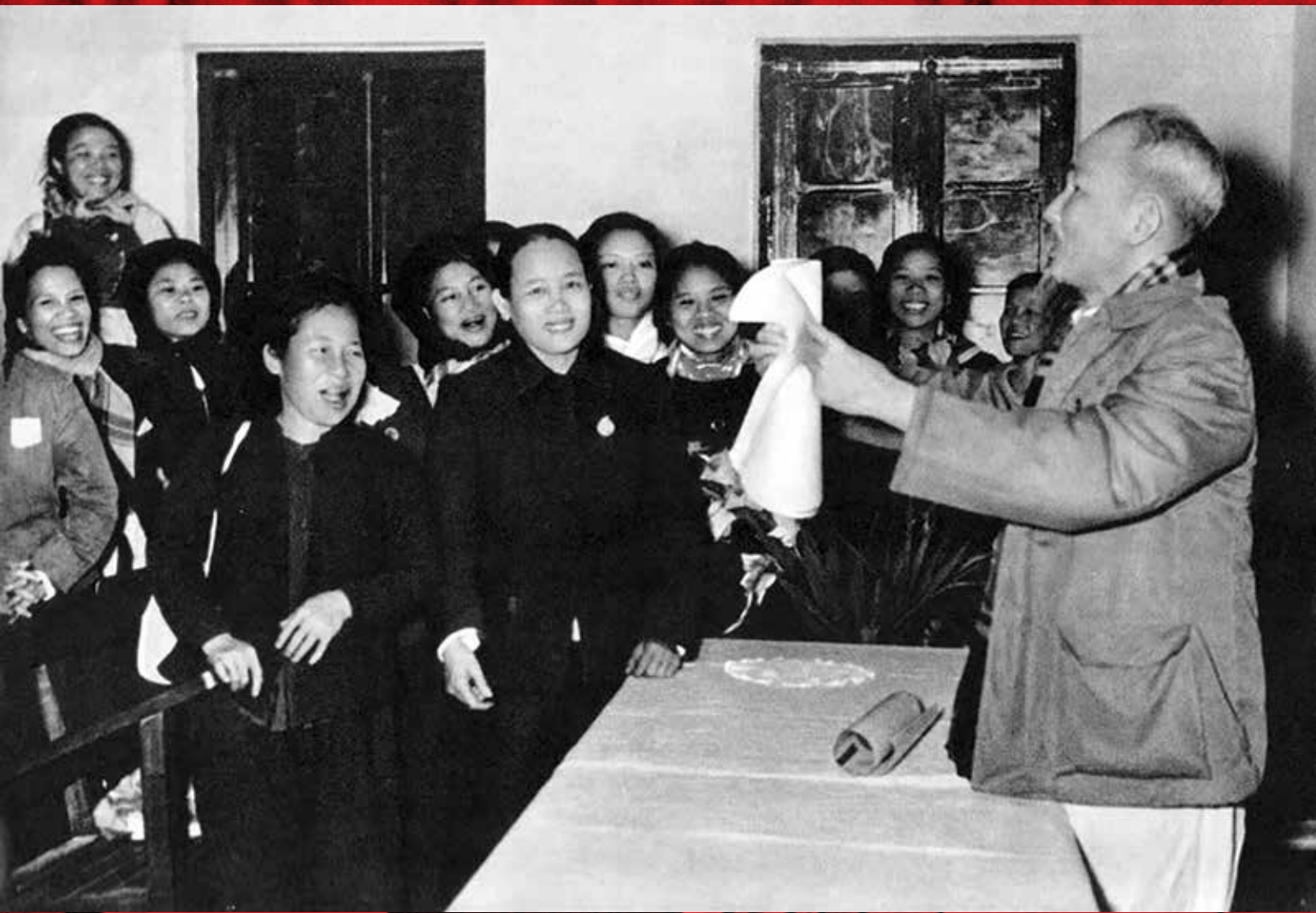
Chủ tịch Hồ Chí Minh thăm lớp học của chị em phụ nữ trên phố Hàng Than, Hà Nội (năm 1958)