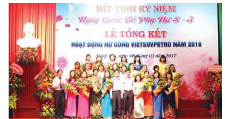
Lãnh đạo CĐ Vietsovpetro tặng hoa cho cán bộ nữ công đạt danh hiệu "Hai giỏi"