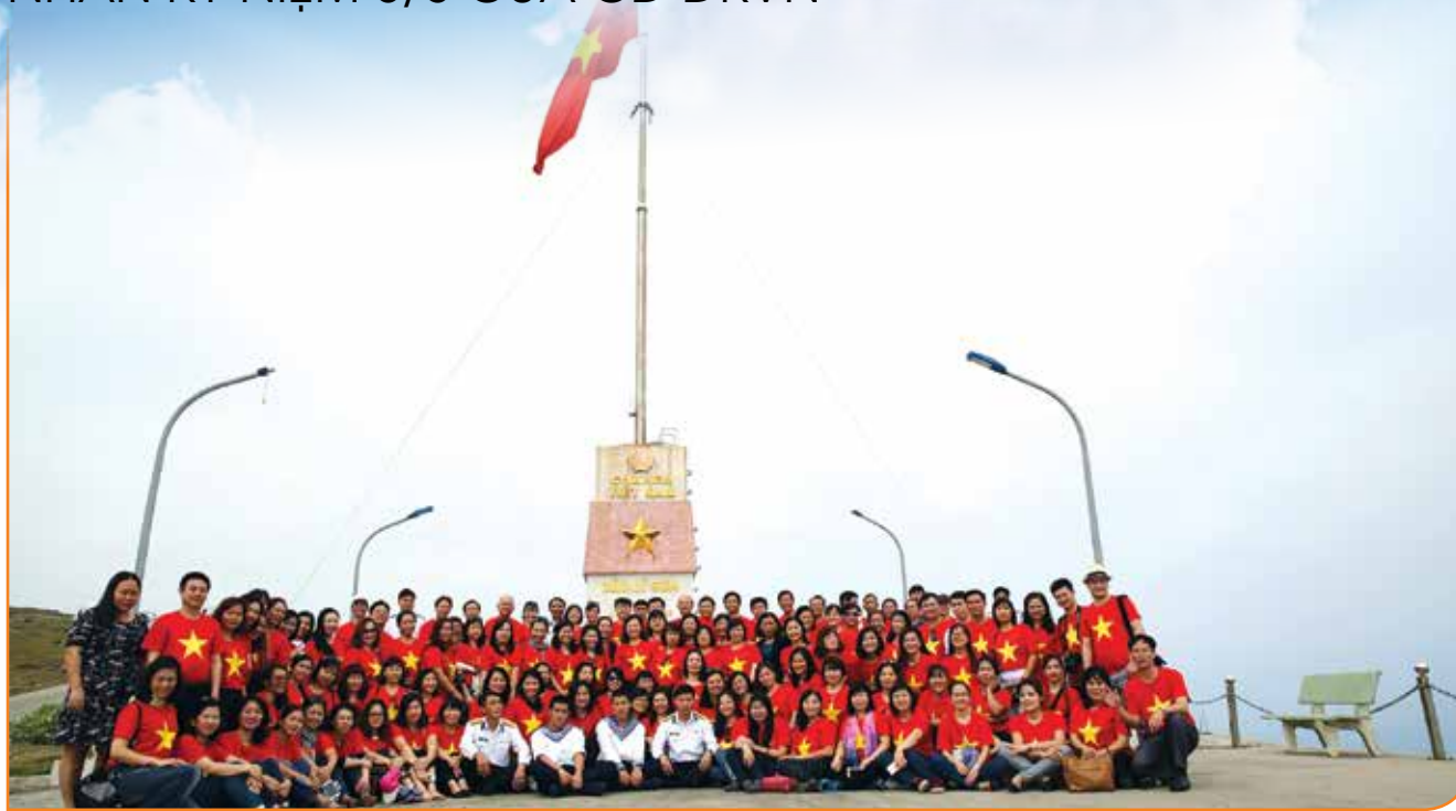
Đoàn đại biểu chụp ảnh lưu niệm dưới chân cột cờ trên đỉnh núi Thới Lới - Đảo Lý Sơn, tỉnh Quảng Ngãi