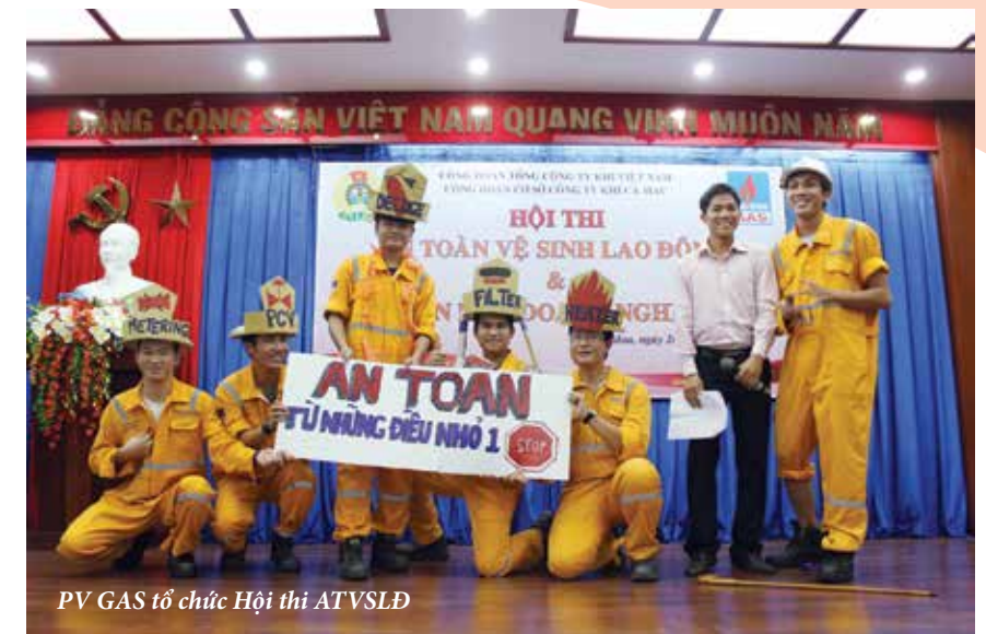
PV GAS tổ chức Hội thi ATVSLD

Về công tác chăm sóc sức khỏe cho NLĐ, hằng năm, PV GAS tổ chức khám sức khỏe định kỳ 1 lần/năm cho CBCNV-LĐ làm việc trong môi trường không có yếu tố độc hại và 2 lần/năm cho các đối tượng làm công việc nặng nhọc, độc hại, nguy hiểm và CBCNV-LĐ nữ. Việc khám sức khỏe định kỳ diễn ra ở những cơ sở y tế có uy tín, được đông đảo NLĐ hưởng ứng. Vì thế, tỷ lệ người tham gia rất cao, đạt trên 98% tổng số lao động của PV GAS. 100% CBCNV-LĐ làm việc trong môi trường độc hại được