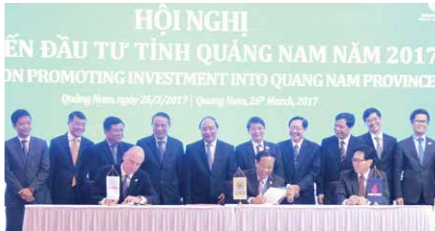
Thủ tướng Nguyễn Xuân Phúc cùng lãnh đạo các bộ, ngành Dầu khí chứng kiến Lễ ký kết Thỏa thuận hợp tác, đầu tư giữa PVN, Tập đoàn EXXON MOBIL và tỉnh Quảng Nam

Sáng 26/3, PVN, Exxon Mobil và tỉnh Quảng Nam đã ký kết thỏa thuận hợp tác đầu tư về Dự án Mỏ khí Cá Voi Xanh dưới sự chứng kiến của Thủ tướng Chính phủ Nguyễn Xuân Phúc.