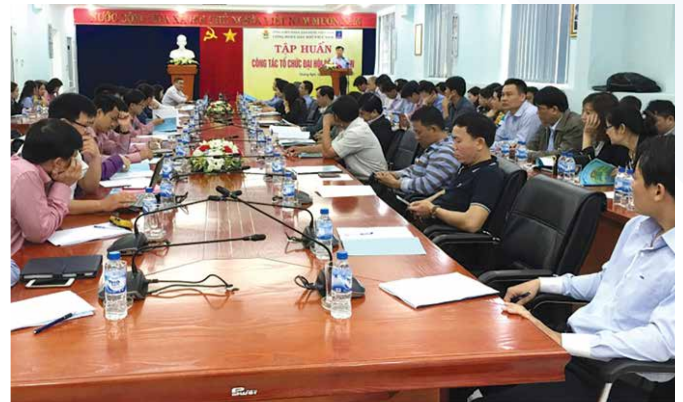
CĐ DKVN tập huấn công tác tổ chức Đại hội Công đoàn cơ sở tại 5 khu vực