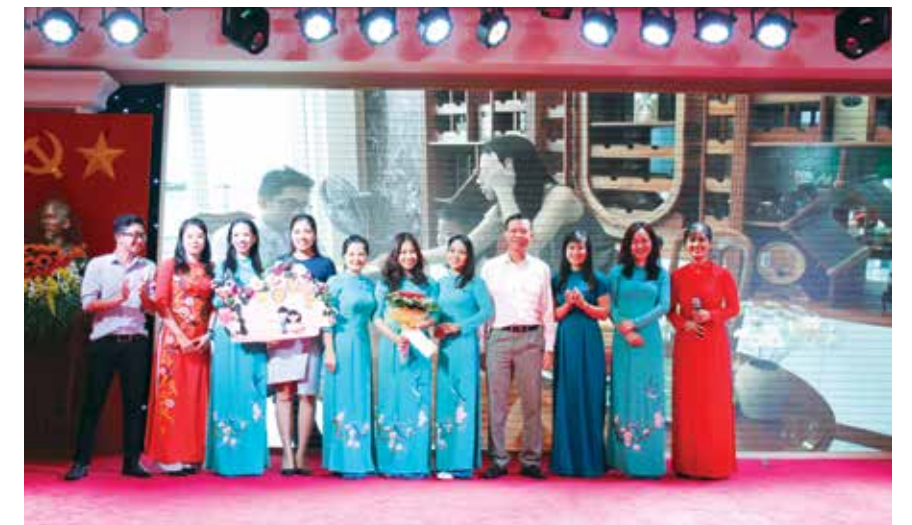
PTSC POS đạt giải ấn tượng trình diễn Thiệp chúc mừng 8/3 với thông điệp "Hãy quan tâm, chia sẻ với người phụ nữ bên cạnh bạn"