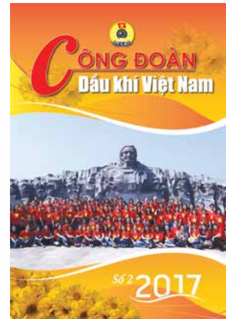
Đoàn đại biểu CĐ DKVN dâng hương tại Tượng đài Mẹ Việt Nam Anh hùng (huyện Núi Thành, tỉnh Quảng Nam)