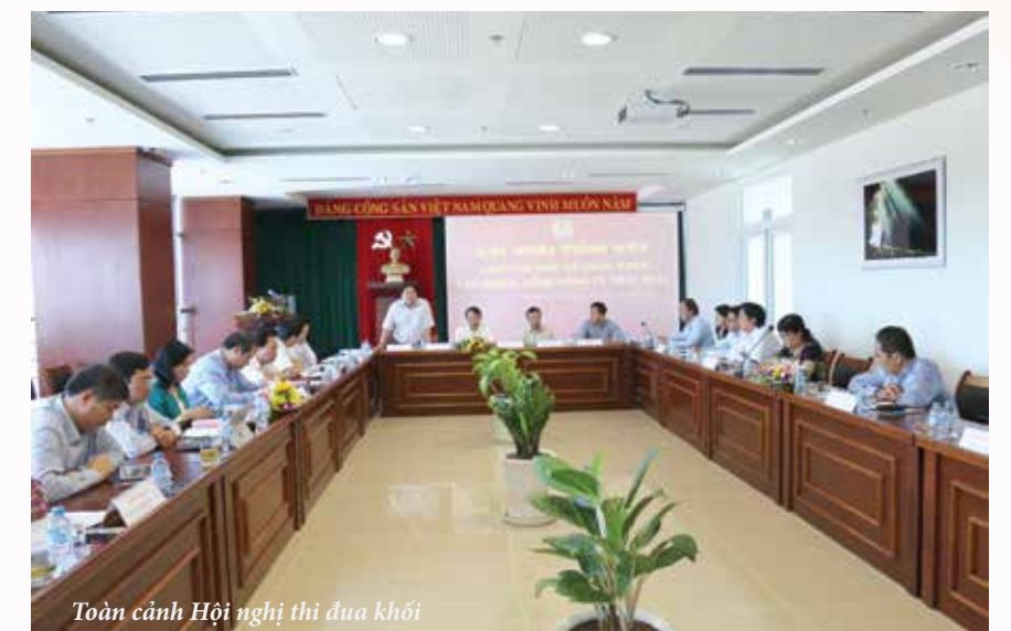
Toàn cảnh Hội nghị thi đua khối

Nhân dịp này, Hội nghị đã bầu Khối trưởng, Khối phó mới. Theo đó, CĐ Hàng không Việt Nam sẽ là khối trưởng; CĐ Dệt may Việt Nam là khối phó.