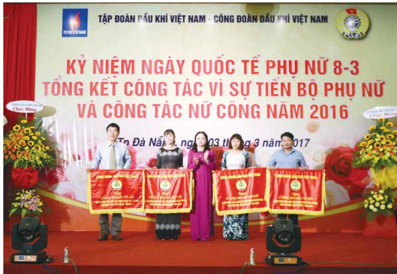
CĐ PV GAS là một trong 4 đơn vị được nhận Cờ thi đua của CĐ DKVN trong tổ chức thực hiện phong trào "Giỏi việc nước - Đảm việc nhà"

Công đoàn, Ban Vì sự tiến bộ phụ nữ (VSTBPN) và Ban Nữ công Tổng công ty Khí Việt Nam (PV GAS) đã phối hợp với Hội Liên hiệp Phụ nữ huyện Nhà Bè, TP. Hồ Chí Minh đến thăm tặng quà 4 Mẹ Việt Nam Anh hùng hiện đang