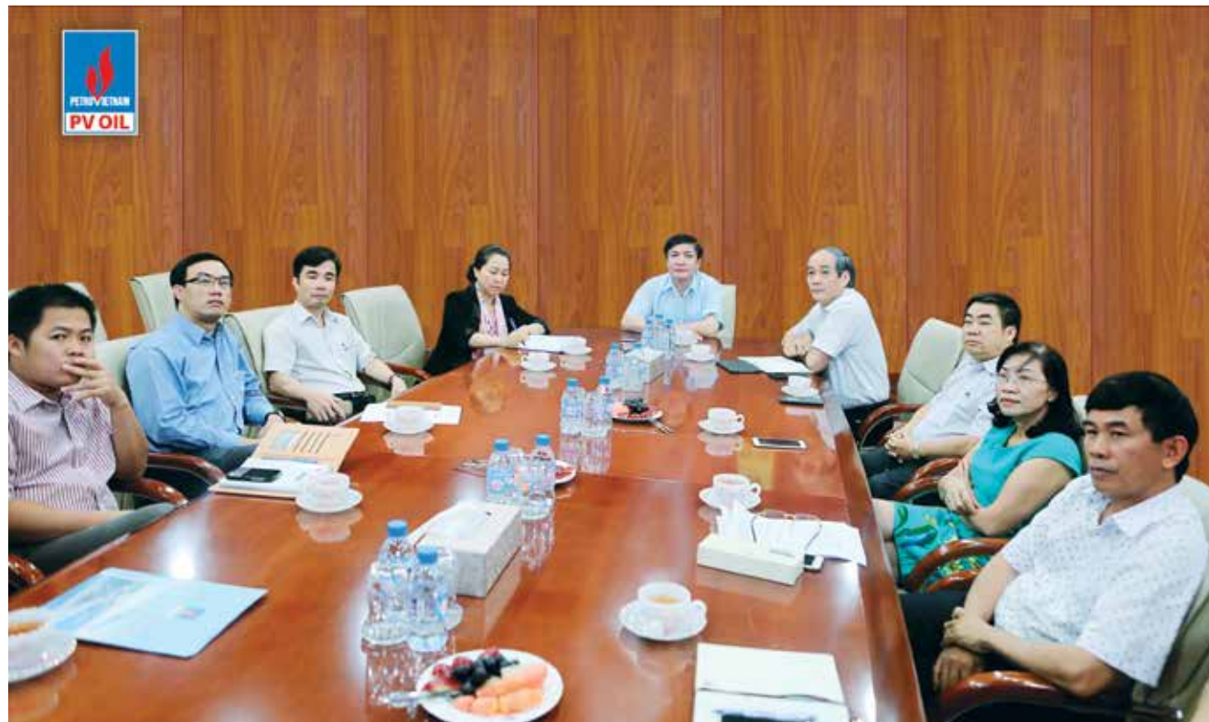
Ủy viên Trung ương Đảng, Chủ tịch Tổng LĐLĐ VN Bùi Văn Cường đến thăm và làm việc tại PV OIL