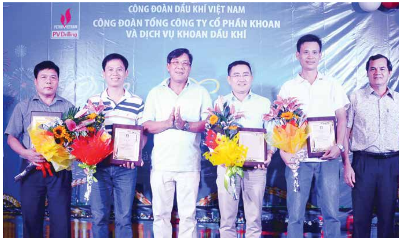
Lãnh đạo và Công đoàn PVD biểu dương các tập thể công đoàn cơ sở thành viên có thành tích xuất sắc trong hoạt động công đoàn

Từ ngày 10/3 đến 12/3 tại TP Đà Nẵng, Công đoàn Tổng công ty Cổ phần Khoan và Dịch vụ khoan Dầu khí (PV Drilling) tổ chức Hội nghị tập huấn cho hơn 40 cán bộ làm công tác công đoàn từ các Công đoàn cơ sở thành viên đến cán bộ công đoàn Tổng công ty. Lớp tập huấn đã trang bị cho các cán bộ làm công tác công đoàn những kỹ năng về công tác chính sách, pháp luật và hoạt động công đoàn; trao đổi và giải đáp các kiến nghị vướng mắc về công tác tài chính công đoàn.