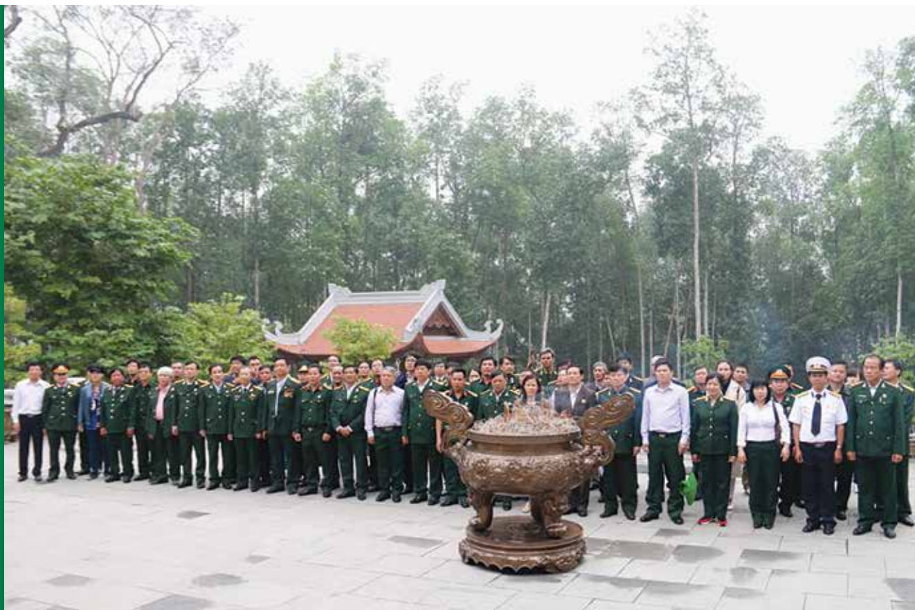
Đoàn thành kính dâng hương tưởng niệm Chủ tịch Hồ Chí Minh tại Khu Di tích K9 - Đá Chông

Nhân kỷ niệm 42 năm Ngày giải phóng miền Nam, thống nhất đất nước (30/4/1975 - 30/4/2017) và chào mừng Đại hội Cựu chiến binh các cấp nhiệm kỳ 2017-2022, ngày 11/3, Hội Cựu chiến binh Tập đoàn Dầu khí Việt Nam (Hội CCB Tập đoàn) đã tổ chức chuyến về nguồn tại Khu Di tích lịch sử Quốc gia đặc biệt Đền Hùng (tỉnh Phú Thọ) và Khu Di tích lịch sử K9 - Đá Chông (Ba Vì, Hà Nội).