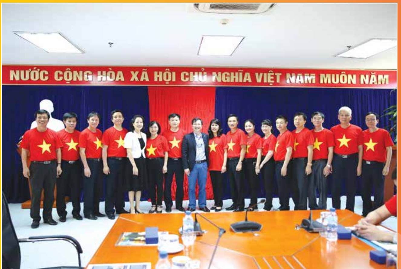
Đại diện lãnh đạo Tổng LĐLĐ VN, CD DKVN và lãnh đạo các đơn vị chụp ảnh lưu niệm với lãnh đạo BSR