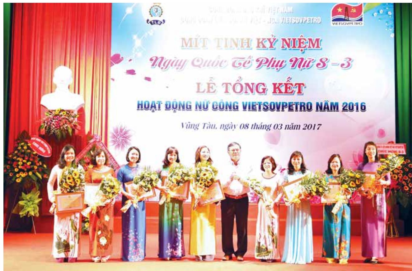
Đại diện Ban lãnh đạo Vietsovpetro tặng Giấy khen cho các Tập thể nữ công xuất sắc năm 2016

Nhân dịp kỷ niệm 107 năm Ngày Quốc tế phụ nữ 8/3, Ban Nữ công Vietsovpetro đã tổ chức Lễ kỷ niệm Ngày Quốc tế Phụ nữ 8/3 nhằm ôn lại truyền thống vẻ vang của phụ nữ thế giới nói chung, phụ nữ Việt Nam nói riêng và Tổng kết hoạt động Nữ công Vietsovpetro năm 2016.