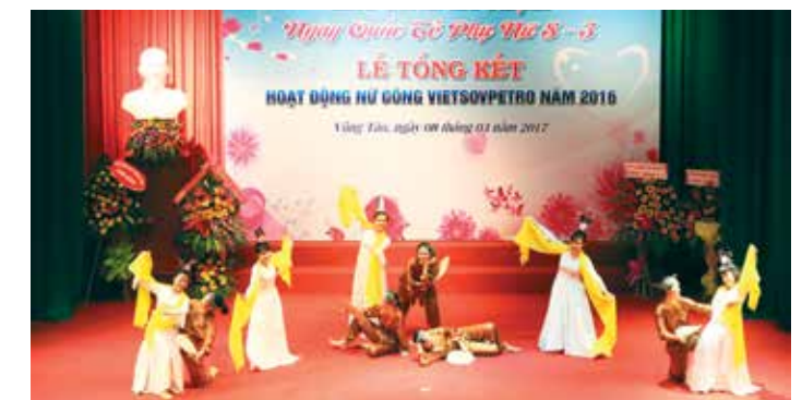
Tiết mục múa "Thằng Cuội" của Ban Nữ công Vietsovpetro

Hiện Vietsovpetro có 1.022 CBCNV-LĐ (chiếm khoảng 14,2%). Số Đảng viên nữ hiện nay là 223 người, chiếm 29,78%. Số cán bộ nữ giữ chức vụ từ trưởng, phó phòng, ban, bộ máy điều hành và các đơn vị cơ sở là 63 người. Cán bộ công đoàn nữ là 208/981 cán bộ công đoàn chiếm 21,2%. Ngày càng nhiều chị em giữ vị trí quan trọng trong chính quyền, tổ chức đoàn thể trong các đơn vị trực thuộc và thực hiện tốt vai trò của mình, hoàn thành tốt công tác chuyên môn, đóng góp một phần không nhỏ vào thành tích chung của đơn vị. Trong phong trào thi đua lao động sản xuất năm 2016 đã có 965 chị em đạt danh hiệu Lao động tiên tiến (đạt tỷ lệ: 97,46%); 119 chị là Chiến sĩ thi đua cấp cơ sở, 42 Chiến sĩ thi đua cấp ngành. Được sự quan tâm của Đảng ủy và Ban Tổng giám đốc, công tác bổ nhiệm cán bộ nữ của Vietsovpetro tiếp tục có chuyển biến, năm 2016 có 20 chị được bổ nhiệm và bổ nhiệm lại.