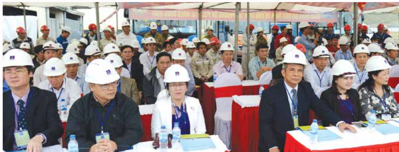
Các đại biểu tham dự Lễ phát động Tuần lễ Quốc gia ATVSLĐ-PCCN năm 2016 của ngành Dầu khí

Phó Ban phụ trách Ban Chính sách - Pháp luật CĐ DKVN