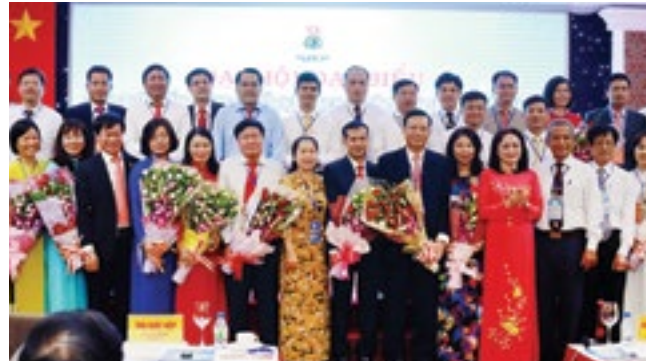
Các đồng chí lãnh đạo Tổng LĐLĐ VN và CĐ DKVN tặng hoa chúc mừng các đồng chí trúng cử vào Ban Chấp hành CĐ PTSC khóa VII

Trong bối cảnh Tập đoàn Dầu khí Việt Nam còn khó