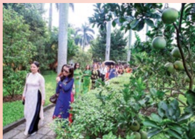
Đoàn cán bộ CĐ DKVN thăm Lăng Hồ Chủ tịch