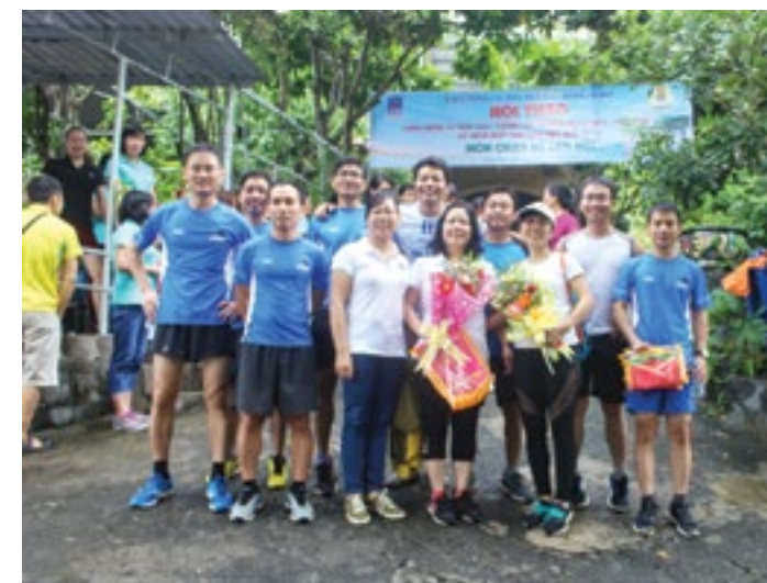
VĐV nam, nữ đoạt giải hội thi