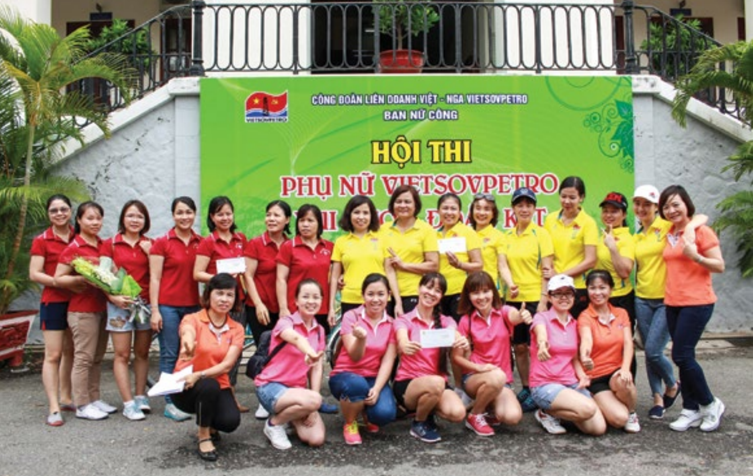
Nữ lao động Vietsovpetro chụp ảnh lưu niệm