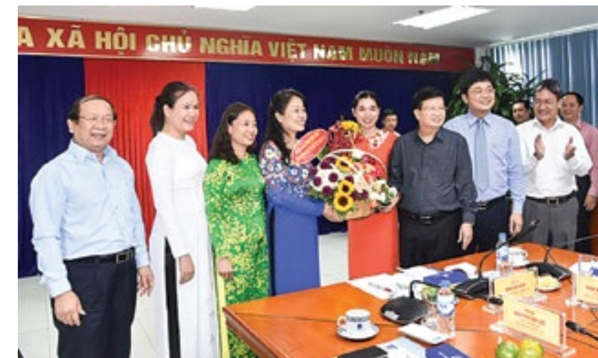
Phó Thủ tướng Trịnh Đình Dũng không quên tặng nữ CBCNV BSR những bó hoa tươi thắm nhân dịp kỷ niệm Ngày Phụ nữ Việt Nam

Phát biểu ghi nhận những thành công của BSR, Phó Thủ tướng Trịnh Đình Dũng nhấn mạnh: Trải qua những giai đoạn thăng trầm, khó khăn, gian khổ; đội ngũ cán bộ lãnh đạo, công nhân viên BSR luôn nỗ lực đưa nhà máy, công ty đạt được nhiều thành quả, mốc dấu quan trọng không chỉ cho ngành Dầu khí, mà còn cho kinh tế nước nhà. Có thể nói, Lọc dầu Dung Quất là trung tâm của Khu Kinh tế Dung Quất, là biểu tượng của nền kinh tế Quảng Ngãi và miền Trung. BSR là hình ảnh khẳng định