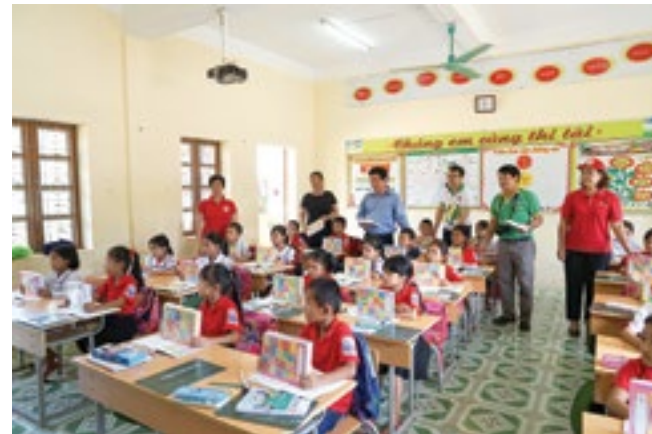
PVFCCo chia sẻ khó khăn với đồng bào bị thiệt hại do lũ quét tại Yên Bái, Sơn La

trong 2 ngày 11-12/9/2017, PVFCCo cùng đơn vị thành viên là PVFCCo North, thông qua Hội Chữ thập đỏ, đã tổ chức thăm hỏi, động viên, trao tặng những suất quà nghĩa tình với tổng số tiền hỗ trợ là 710 triệu đồng, nhằm chia sẻ những khó khăn, thiệt hại, mất mát mà đồng bào tại huyện Mù Cang Chải, tỉnh Yên Bái và huyện Mường La, tỉnh Sơn La đang phải đối mặt do trận mưa lũ lịch sử vừa qua. PVFCCo đã hỗ trợ cho 18 hộ gia đình có người thiệt mạng, mỗi hộ 10 triệu đồng; trao tặng cho 4 trường học, mỗi trường 7.000 cuốn vở với tổng giá trị 180 triệu đồng; hỗ trợ 350 triệu đồng cho 70 hộ gia đình có nhà sập hoàn toàn, mỗi hộ 5 triệu đồng. Hoạt động này đã thể hiện tinh thần tương thân tương ái của tập thể người lao động PVFCCo, những người luôn chia sẻ, động viên, góp phần giúp bà con vượt qua những khó khăn, mất mát do thiên tai gây ra để sớm ổn định cuộc sống và hoạt động sản xuất trở lại.