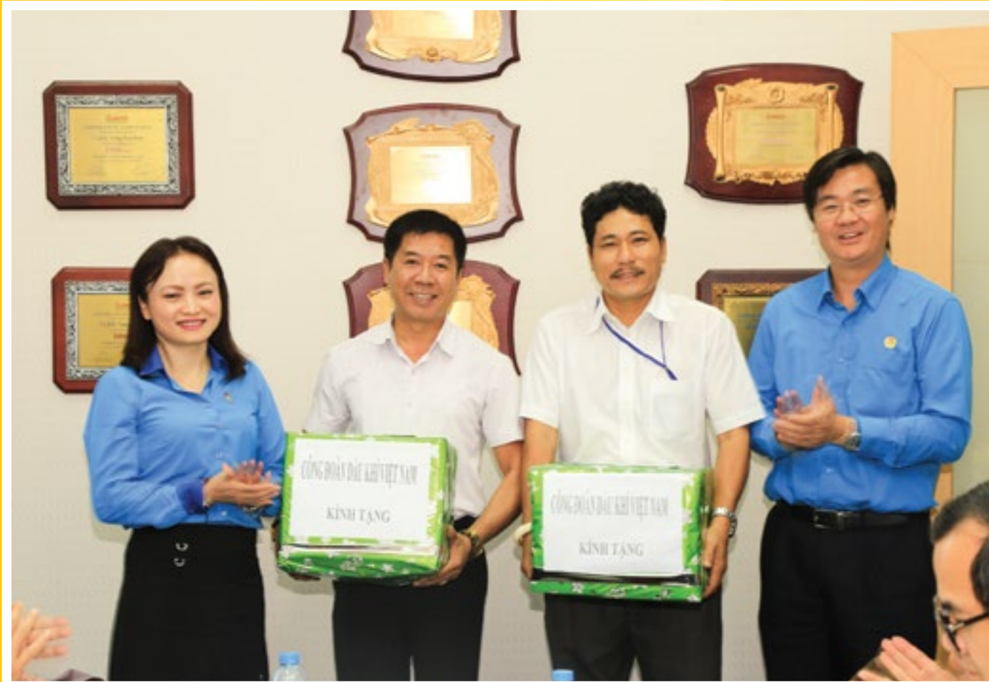
Đại diện Ban Thường vụ CĐ DKVND trao quà tặng cho đại diện 2 đơn vị CuuLong JOC và PVEP chi nhánh Vũng Tàu