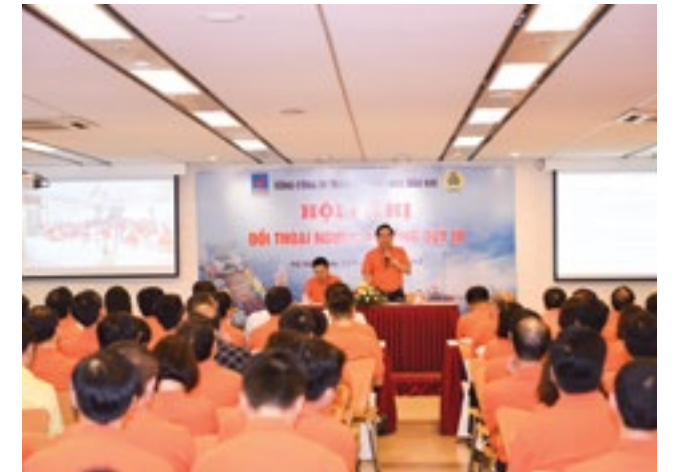
Toàn cảnh hội nghị

Những ý kiến tâm huyết được thẳng thắn nêu ra, cũng như những câu trả lời rõ ràng đi thẳng vào vấn đề