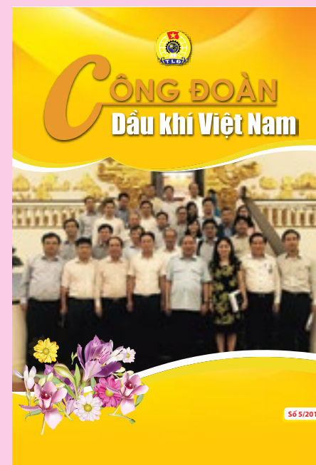
Thủ tướng Nguyễn Xuân Phúc với tập thể lãnh đạo PVN và các đơn vị Thành viên sau buổi làm việc ngày 12-10-2017