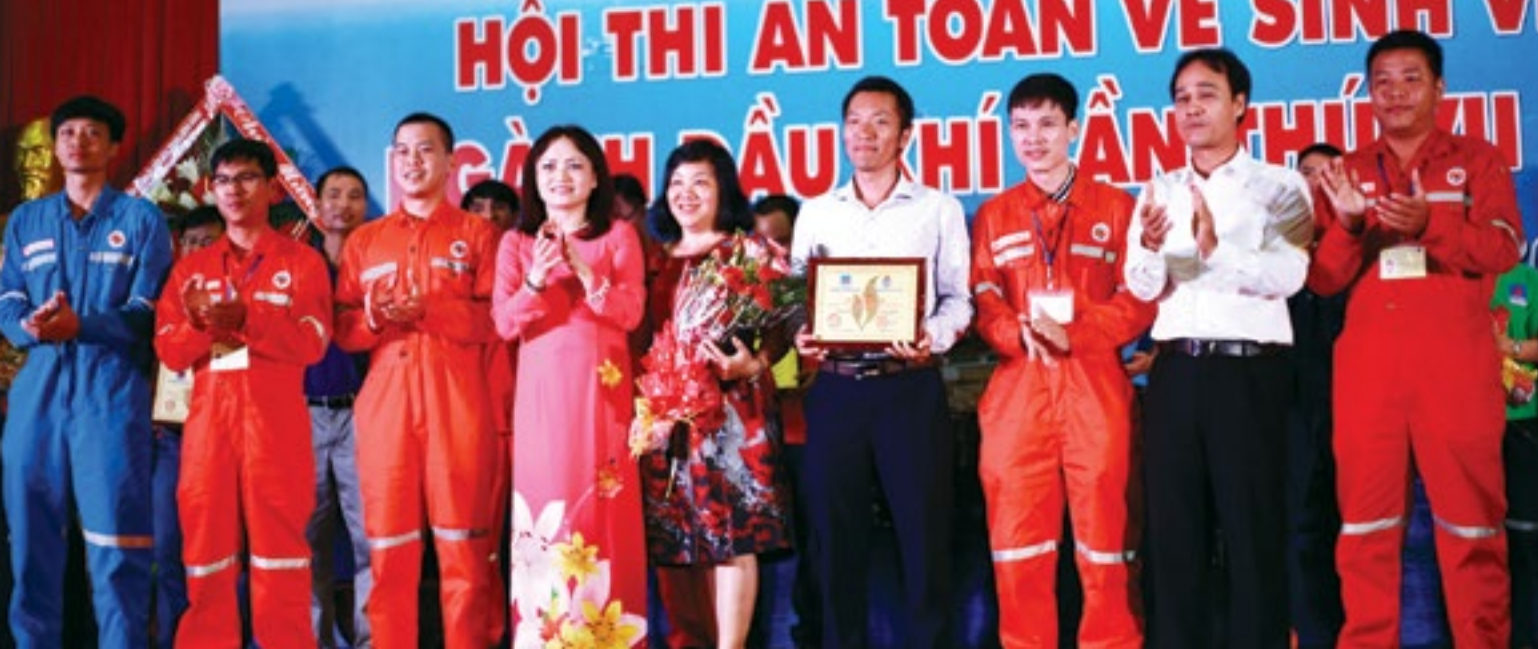
Lãnh đạo Tập đoàn DKVN và CĐ DKVN trao giải Đặc biệt cho đội thi Vietsovpetro