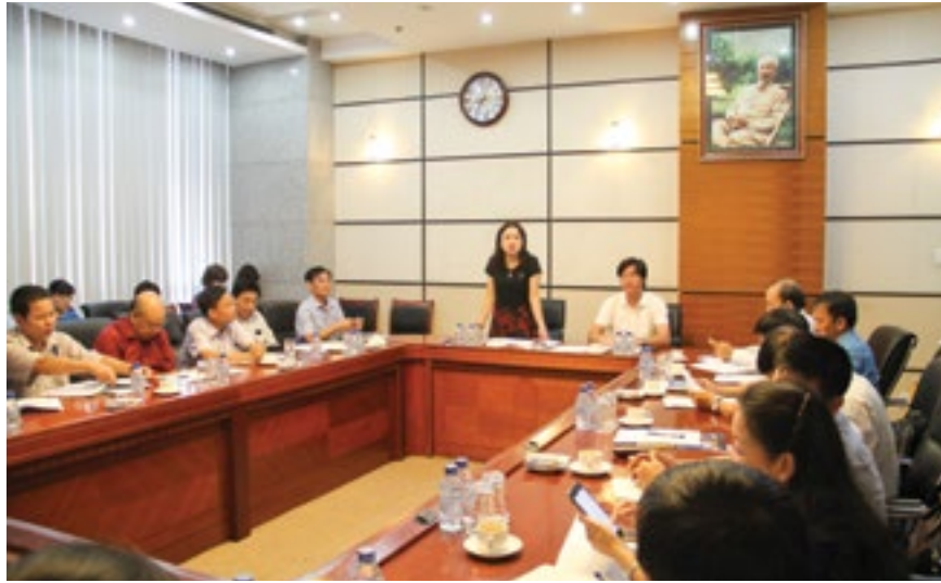
Hội nghị giao ban Quý III năm 2017, khu vực phía Bắc của CĐDKVN

huy truyền thống tốt đẹp của “Những người đi tìm lửa”: Nêu cao tinh thần trách nhiệm, giữ vững bản lĩnh chính trị, kiên định ý chí cách mạng, thắt chặt tình đoàn kết, chung sức đồng lòng, lao động hết mình để vượt qua mọi khó khăn, vì sự phát triển ổn định, bền vững của Tập đoàn Dầu khí Việt Nam.