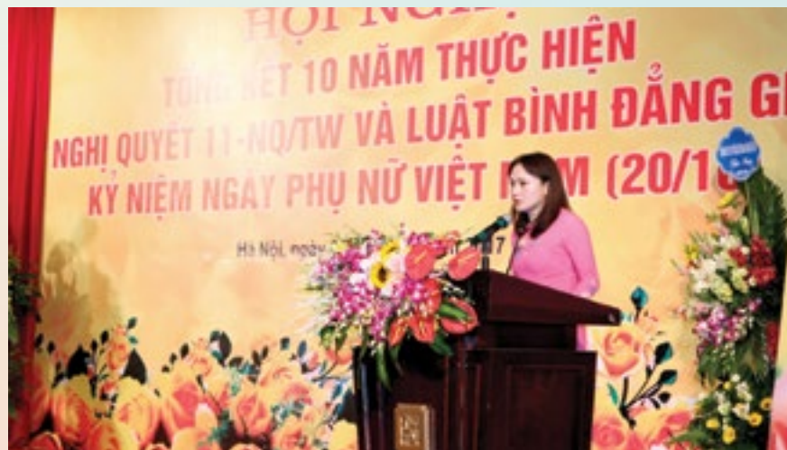
Chủ tịch CĐ DKVN phát biểu khai mạc hội nghị

Chương trình mang đến nhiều khiến thức bổ ích, sâu sắc về cuộc đời hoạt động cách mạng của Người. Đoàn cũng đến thăm Khu di tích Chủ tịch Hồ Chí Minh tại Phủ Chủ tịch là nơi sống và làm việc lâu nhất của Chủ tịch Hồ Chí Minh. Nơi đây cũng là nơi Chủ tịch Hồ Chí Minh đã qua đời. Sau khi Người qua đời, tất cả các di tích cùng với những tài liệu, hiện vật lưu niệm về Người đã