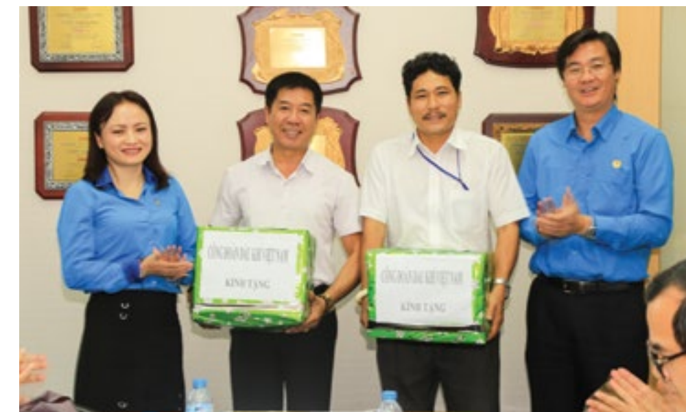
Đại diện Ban Thường vụ CĐ DKVN trao quà tặng cho đại diện 2 đơn vị Cuulong JOC và PVEP chi nhánh Vũng Tàu