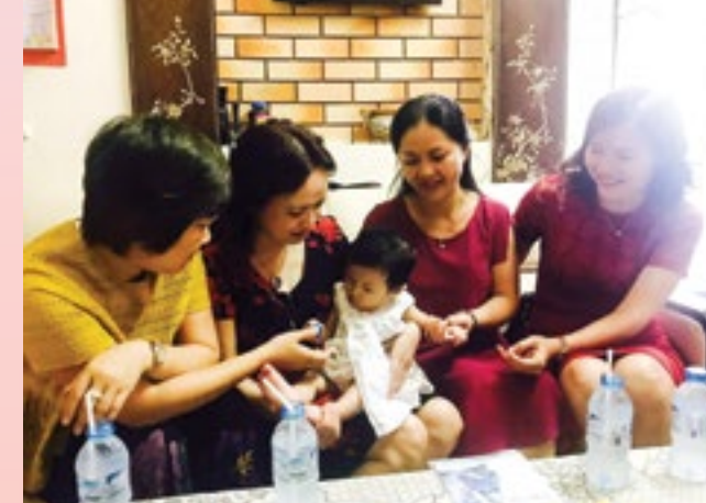
Lãnh đạo CĐ DKVN thăm hỏi gia đình nữ công nhân của Tổng công ty Dịch vụ tổng hợp Dầu khí thành phố Hồ Chí Minh