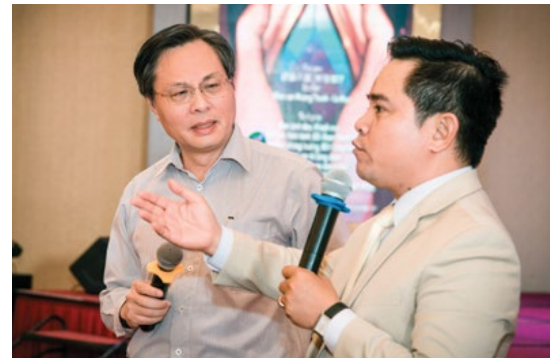
Lãnh đạo Tổng công ty tham gia chia sẻ tại diễn đàn "Giữ ấm ngọn lửa hạnh phúc gia đình"