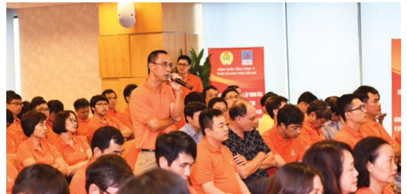
Người lao động PVEP đặt câu hỏi với ban lãnh đạo Tổng Công ty