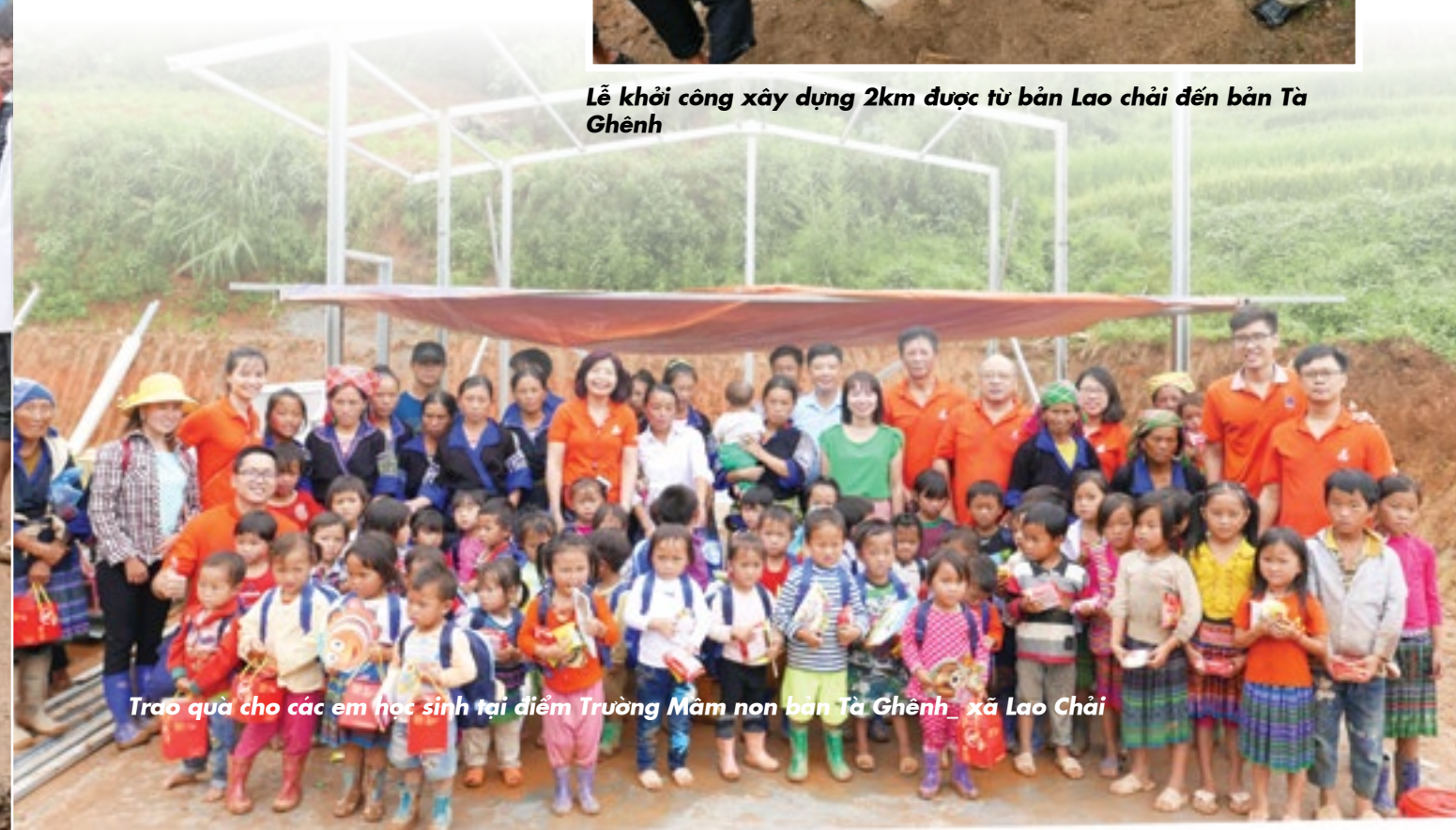
Trao quà cho các em học sinh tại điểm Trường Mầm non bản Tà Ghênh, xã Lao Chải