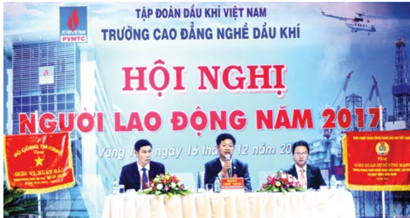
Hội nghị Người lao động năm 2017 của Trường Cao đẳng nghề Dầu khí