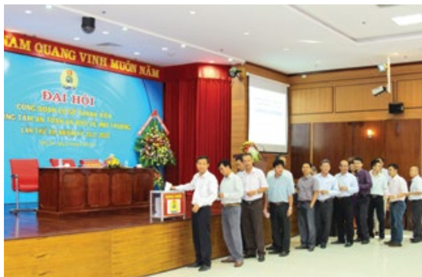
Các đại biểu bỏ phiếu bầu Ban Chấp hành nhiệm kỳ 2017-2022

Tại đại hội các đại biểu cũng tập trung thảo luận những vấn đề liên