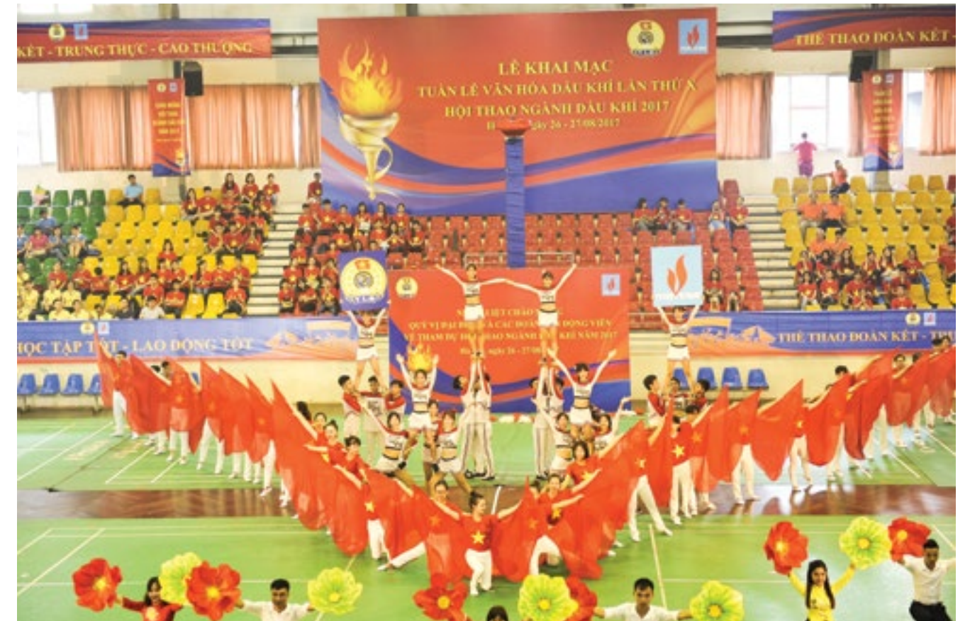
Lễ khai mạc Tuần lễ Văn hóa Dầu khí lần thứ X - 2017