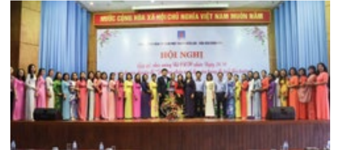
Lãnh đạo Công ty chụp ảnh lưu niệm với nữ CBCNV - LĐ tại hội nghị