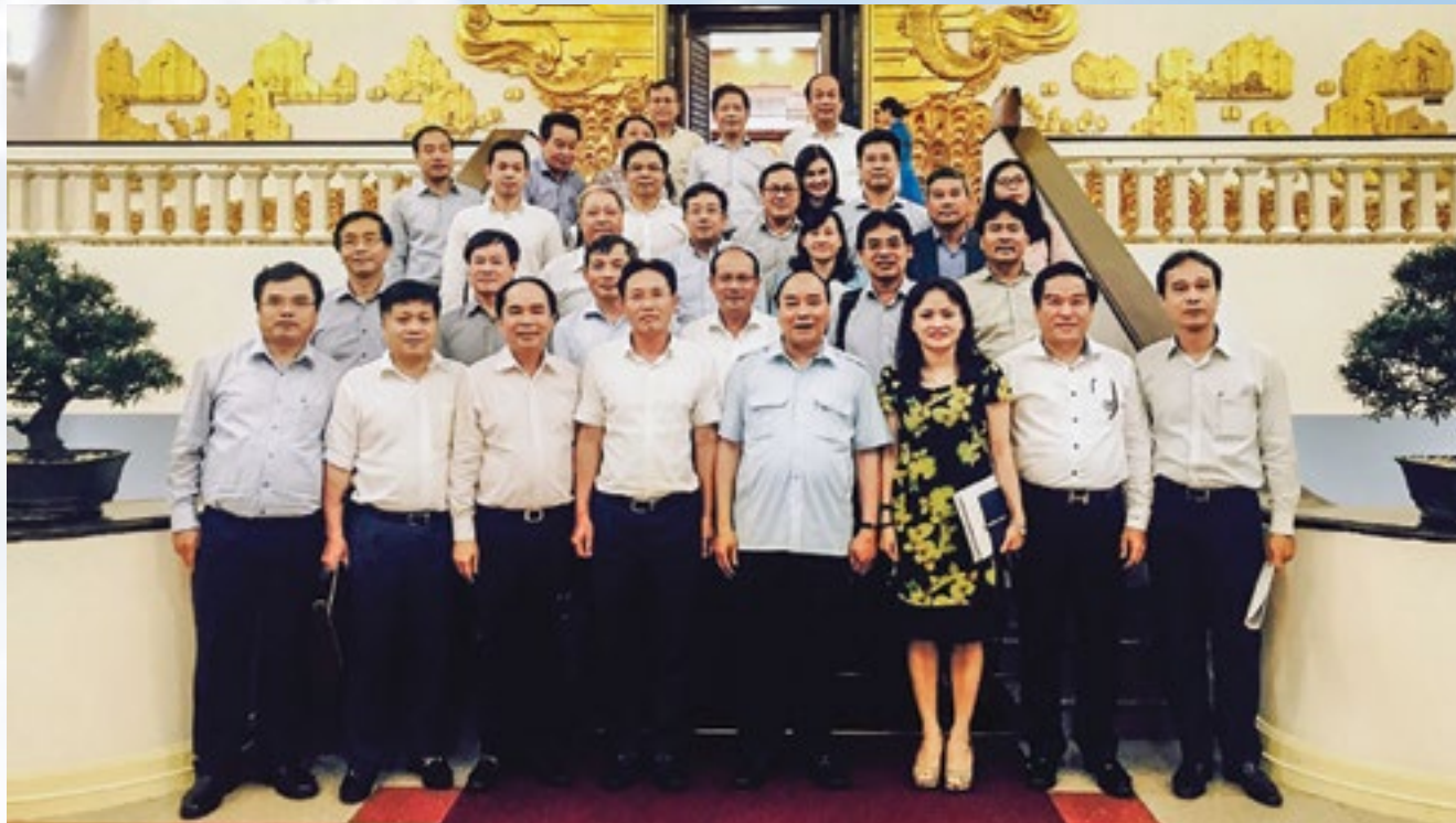
Thủ tướng Nguyễn Xuân Phúc với tập thể lãnh đạo PVN và các đơn vị Thành viên sau buổi làm việc ngày 12/10/2017