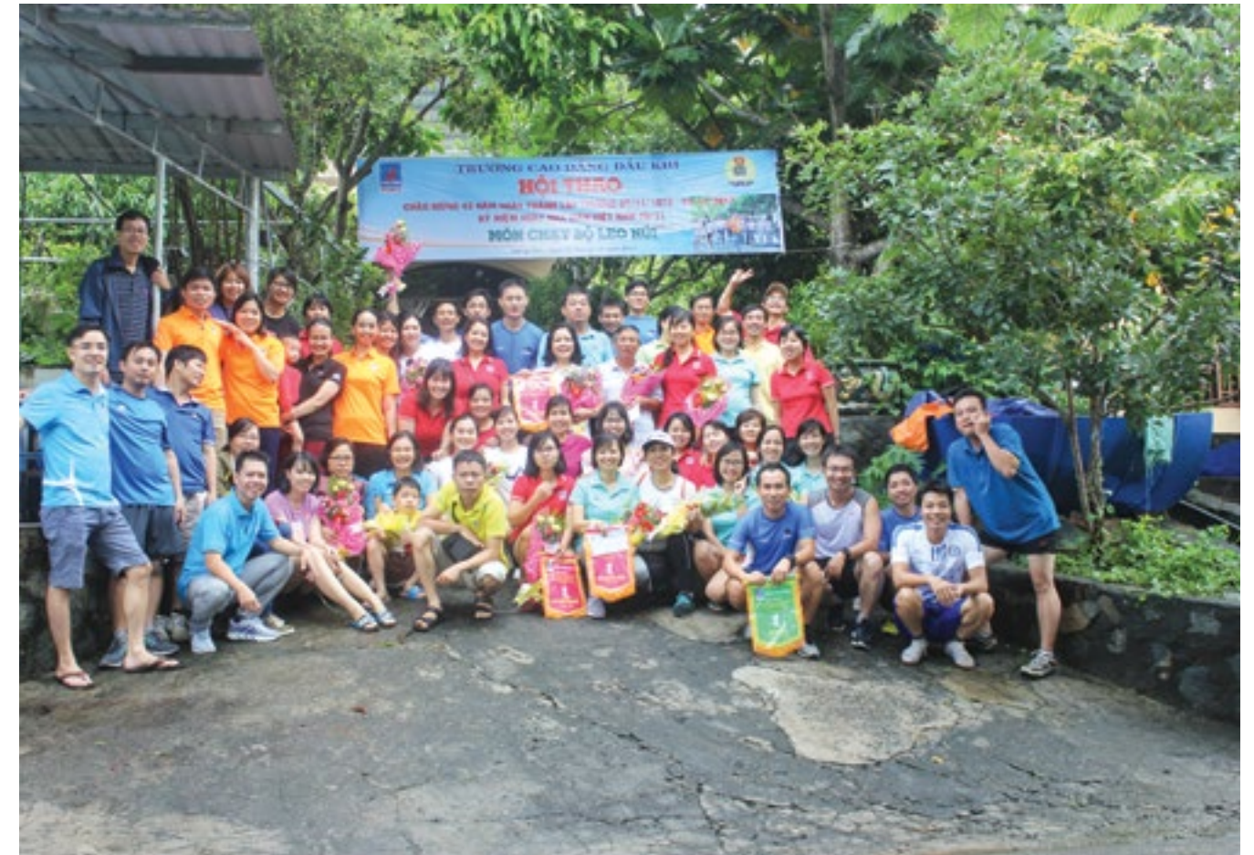
VĐV và cổ động viên hội thi

Dưới đây là một số hình ảnh về các hoạt động: