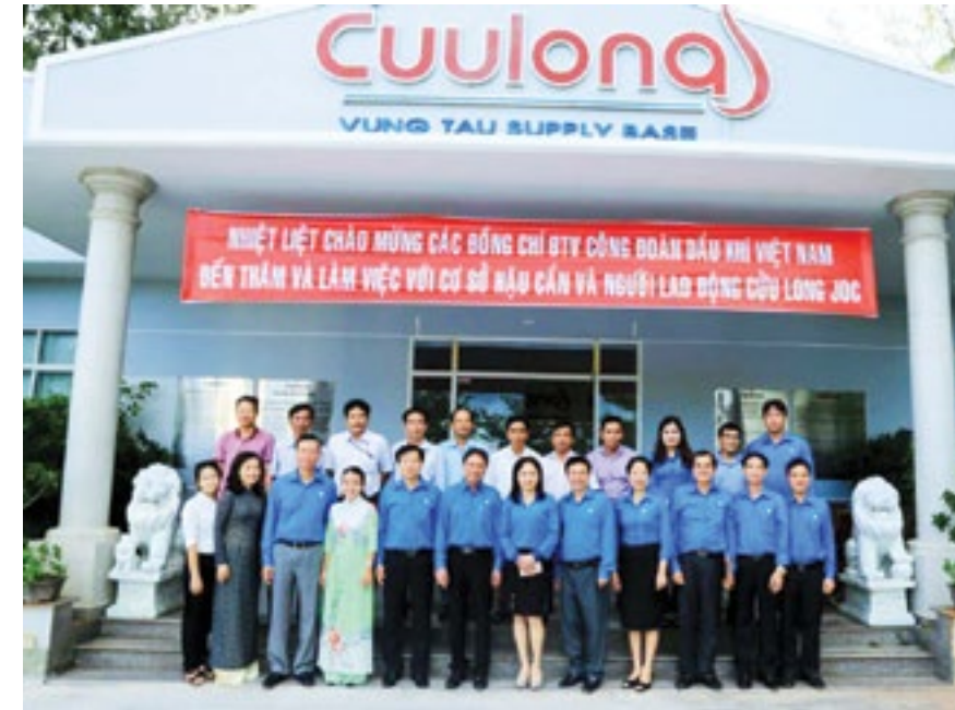
Ban Thường vụ CĐ DKVN chụp hình lưu niệm với người lao động của Cuulong JOC

Hội nghị Ban Thường vụ CĐ DKVN lần thứ 22 đã thông qua các báo cáo quý III, triển khai nhiệm vụ trọng