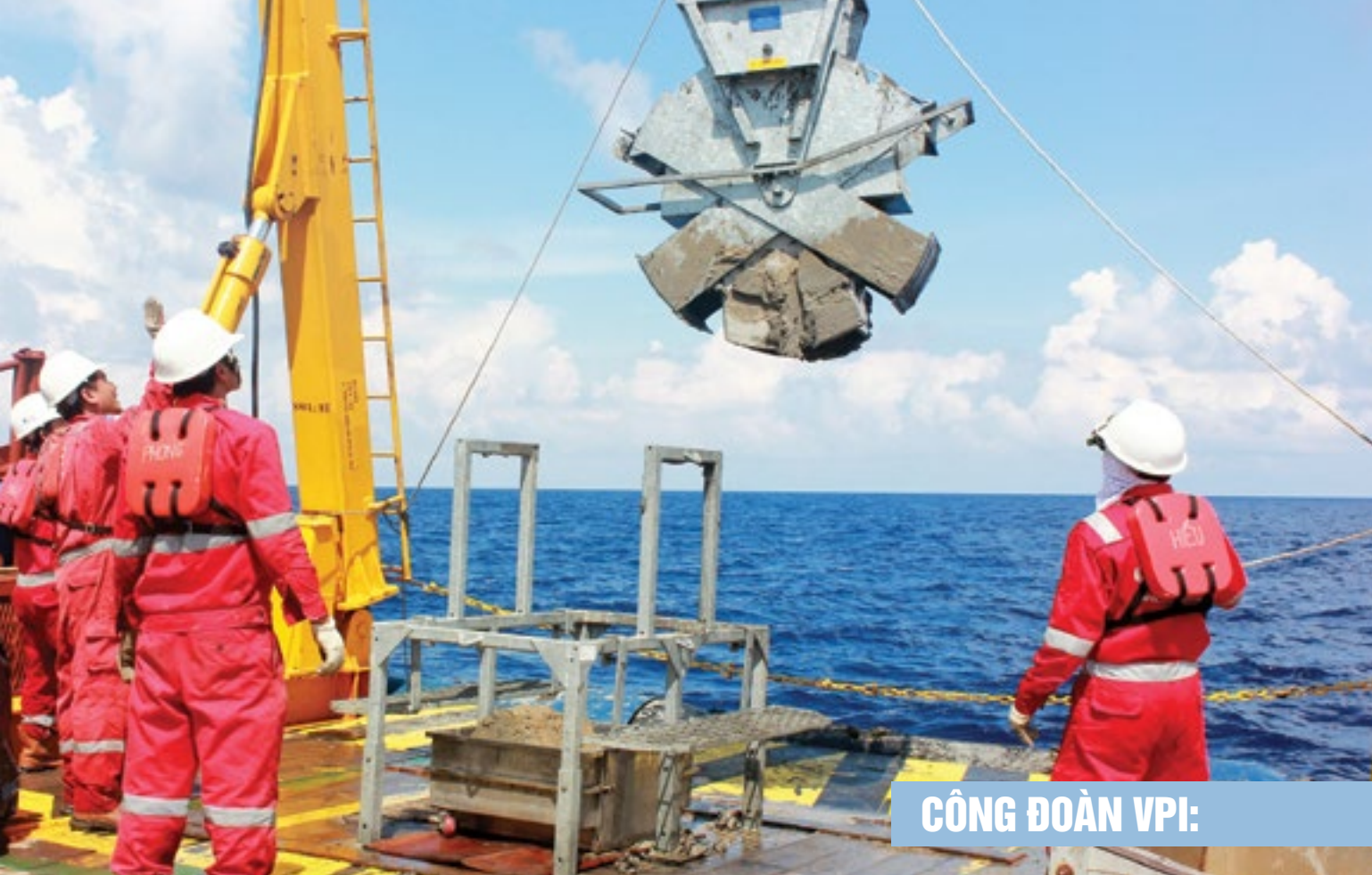
CÔNG ĐOÀN VPI: