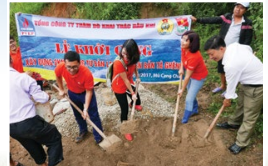
Lễ khởi công xây dựng 2km đường từ bản Lao Chải đến bản Tà Ghênh