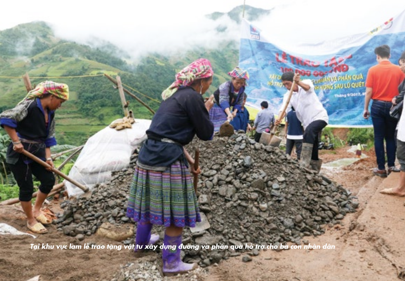
Tại khu vực làm lễ trao tặng vật tư xây dựng đường và phần quà hỗ trợ cho bà con nhân dân