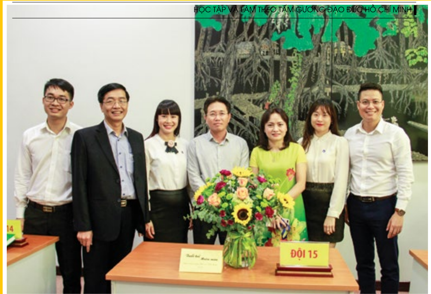
Lãnh đạo Tập đoàn DKVN và CĐ DKVN thăm các đội thi trong Hội thi cắm hoa nghệ thuật của CĐ Công ty Mẹ - PVN

Chàng rể hào hứng đáp: - Dạ, tại con cũng muốn giảm cân như bố mà! - !!!