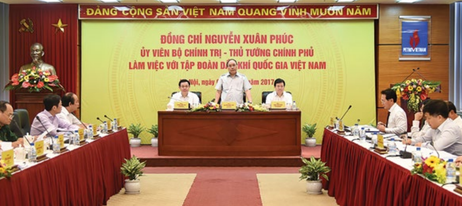
Đồng chí Nguyễn Xuân Phúc, Thủ tướng Chính phủ làm việc với Tập đoàn Dầu khí Quốc gia Việt Nam ngày 5/8/2017