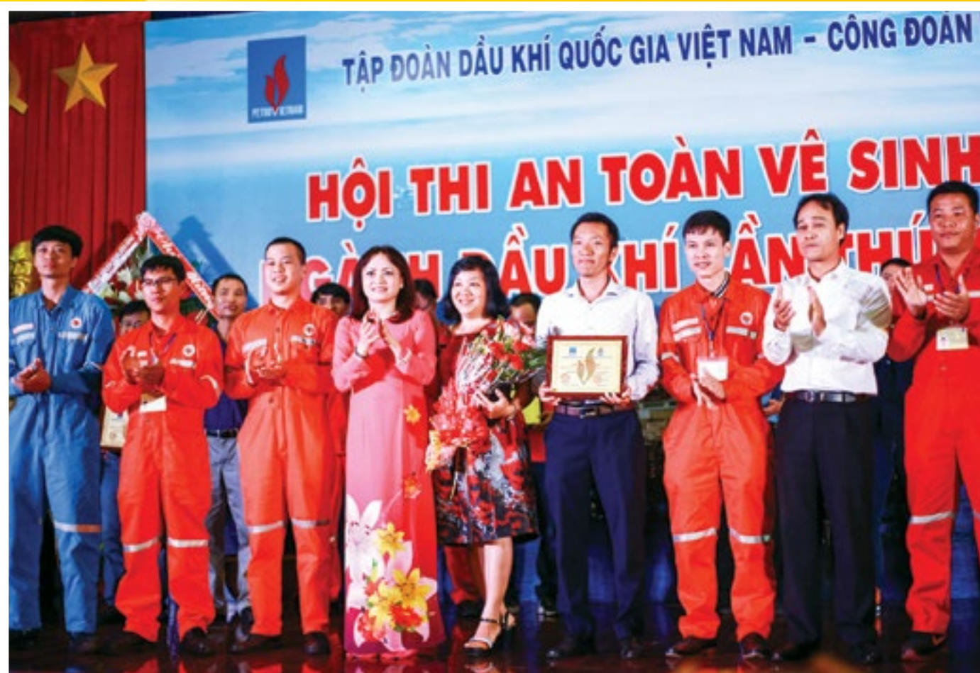
Lãnh đạo Tập đoàn DKVN và CĐ DKVN trao giải Đặc biệt cho đội thi Vietsovpetro