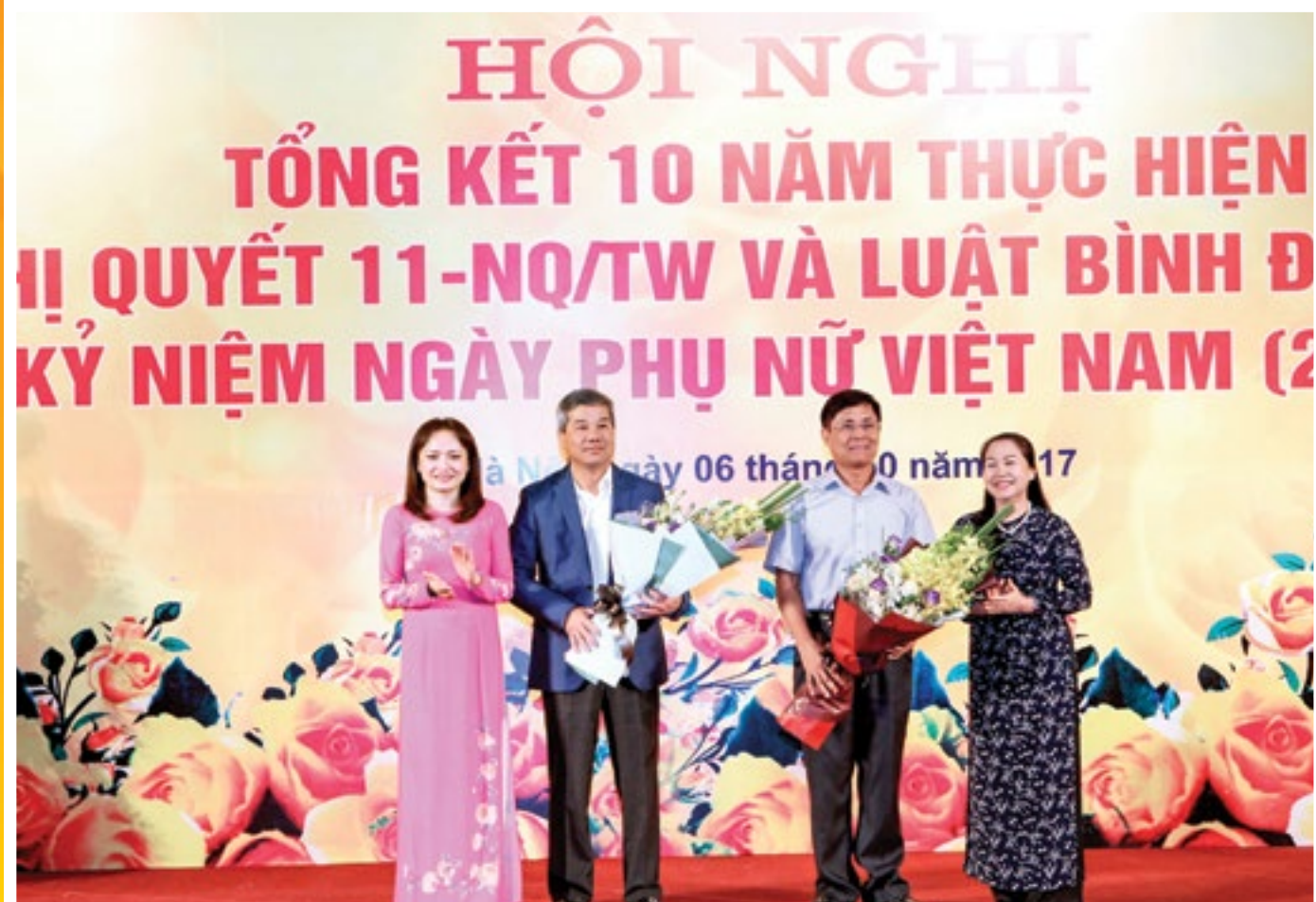
Lãnh đạo Tổng LĐLĐVN và Công đoàn DKVN tặng hoa lãnh đạo Tập đoàn DKVN