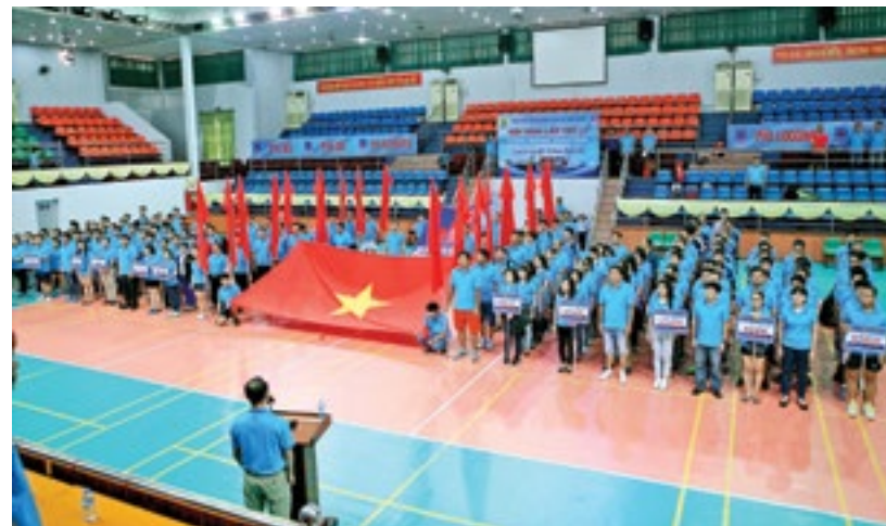
Lễ khai mạc Hội thao 2016

Trải qua 15 kỳ hội thao kể từ khi thành lập với nhiều hoạt động sôi nổi, Hội thao PV Drilling hàng năm không chỉ tiếp nối truyền thống văn hóa của ngành Dầu khí, mà còn có ý nghĩa không nhỏ trong việc xây dựng đời sống văn hóa cơ sở tại PV Drilling.