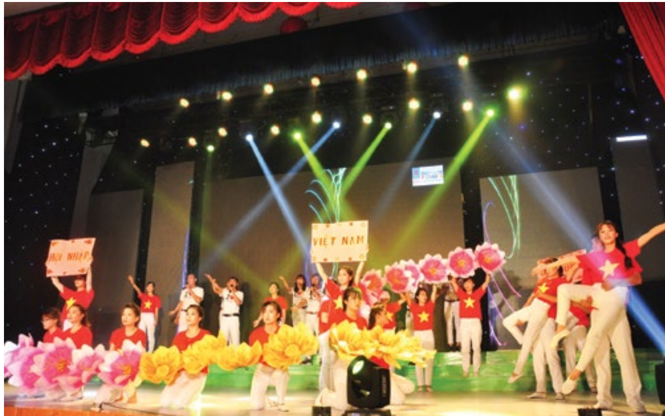
Các tiết mục trong Hội thi “Tiếng hát cho mùa bội thu”

Sắc” của đội Công ty CP Phân bón và Hóa chất Dầu khí Đông Nam Bộ (PVFCCo SE) hay tiết mục “Vượt biển” của đội Nhà máy Đạm Phú Mỹ 2... Tất cả các tiết mục đã thực sự làm thỏa mãn cả ban giám khảo cùng gần 500 khán giả đến xem và cổ vũ cho chương trình!