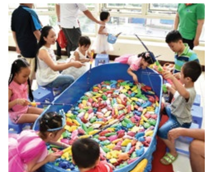
Một số hình ảnh tại “Đêm hội Trăng Rằm” PVFCCo 2017