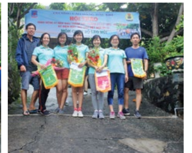
Niềm vui của cả đội (khoa Dầu Khí) khi có nhiều thành viên thi đấu thành công