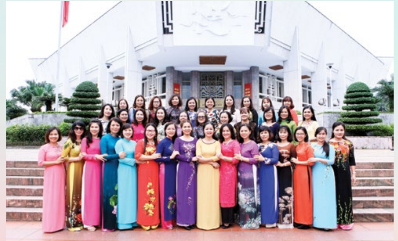
Các nữ cán bộ CĐ DKVN thăm Bảo tàng Hồ Chí Minh nhân Ngày Phụ nữ Việt Nam 2017