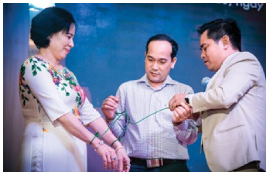
Các đồng chí lãnh đạo nhiệt tình chia sẻ và tham gia các hoạt động của diễn đàn.