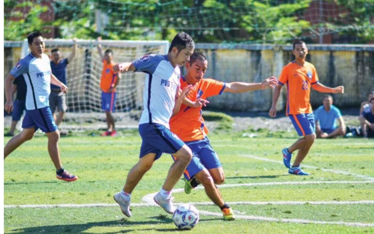
Thi đấu bóng đá tại Hội thao 2017

Năm 2017 là năm diễn ra Đại hội công đoàn các cấp. Vì vậy, Hội thao PV Drilling lần thứ 16 cũng là một sự kiện có ý nghĩa chào mừng Đại hội Công đoàn PV Drilling lần thứ VI nhiệm kỳ 2017 - 2022 tiến tới Đại hội VI Công đoàn Dầu khí Việt Nam. Để chuẩn bị tốt cho công tác tổ chức