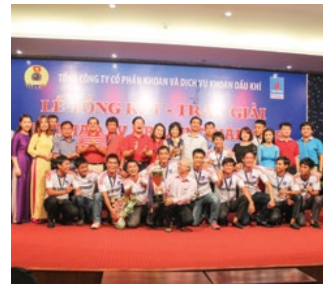
Trao giải Nhất toàn đoàn Hội thao 2015