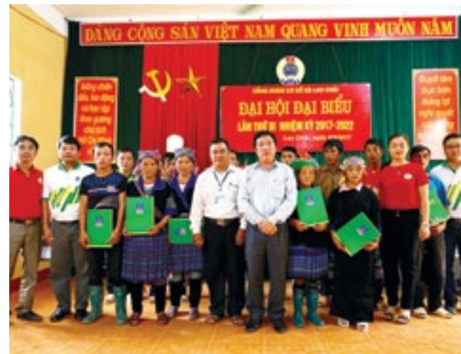
PVFCCo tặng quà cho các gia đình bị thiệt hại tại Hà Tĩnh và Quảng Bình

Bên cạnh việc tích cực đóng góp cho sự nghiệp trồng người, nâng cao chất lượng giáo dục tại địa phương,