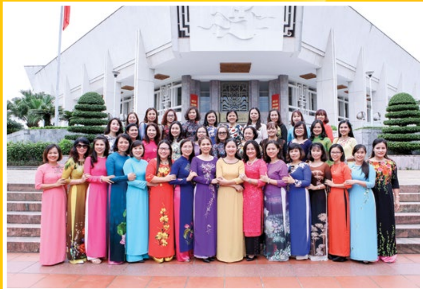
Các nữ cán bộ CĐ DKVN chụp ảnh lưu niệm nhân kỷ niệm Ngày Phụ nữ CÔNG ĐOÀN DẦU KHÍ VIỆT NAM (Số 5/2017) | 85