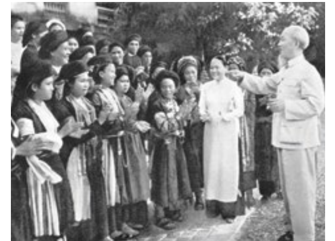
Đại biểu phụ nữ các dân tộc tỉnh Hà Giang về thăm Hà Nội vui mừng được gặp Bác Hồ (25/11/1965)

Hai là, lĩnh vực gia đình: Người phụ nữ phải vất vả nhiều trong công việc gia đình, như Lênin chỉ rõ: "Mặc dù có mọi luật lệ giải phóng phụ nữ, nhưng phụ nữ vẫn cứ là nô lệ trong gia đình vì công việc nội trợ linh tinh cứ đè nặng lên vai họ, làm cho họ nghệt thở mụ mẫm, nhọc nhằn, ràng buộc họ vào bếp núc, vào buồng con cái, lãng phí sức lực của họ vào một công việc cực kỳ tụn mồn, làm cho họ nhọc nhằn, gò bó". Và theo Bác Hồ thì việc giải