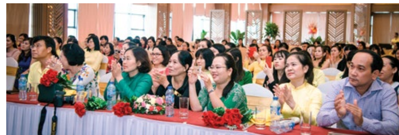
Diễn đàn chào mừng ngày Phụ nữ Việt Nam 20/10/2017 với chủ đề "Giữ ấm ngọn lửa hạnh phúc gia đình"

Qua diễn đàn chị em đã mang đến một cây yêu thương đầy màu sắc hạnh phúc, mang dấu ấn của sự bền chặt, vun đắp. Đó là sự nhắn gửi đến người thân, người chồng những thông điệp thiết thực, ý nghĩa cho hạnh phúc của các gia đình nhỏ.