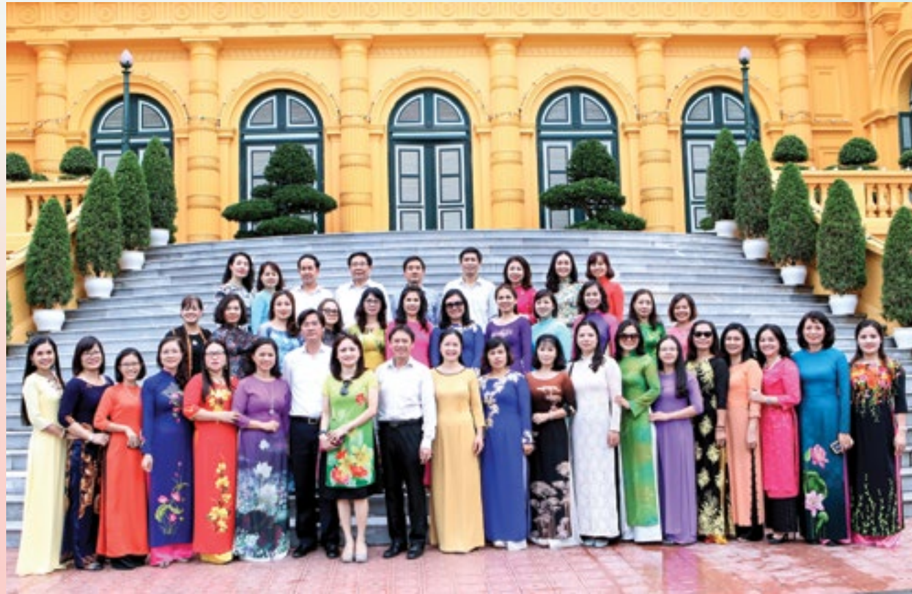
Đoàn cán bộ CĐ DKVN chụp hình lưu niệm tại Phủ Chủ tịch