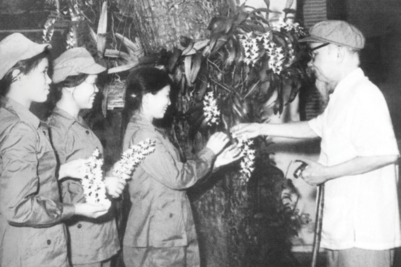
Bác Hồ tặng hoa cho 3 nữ dân quân Vĩnh Linh, Quảng Bình (24/9/1968) (Vĩnh Linh thuộc Quảng Bình)