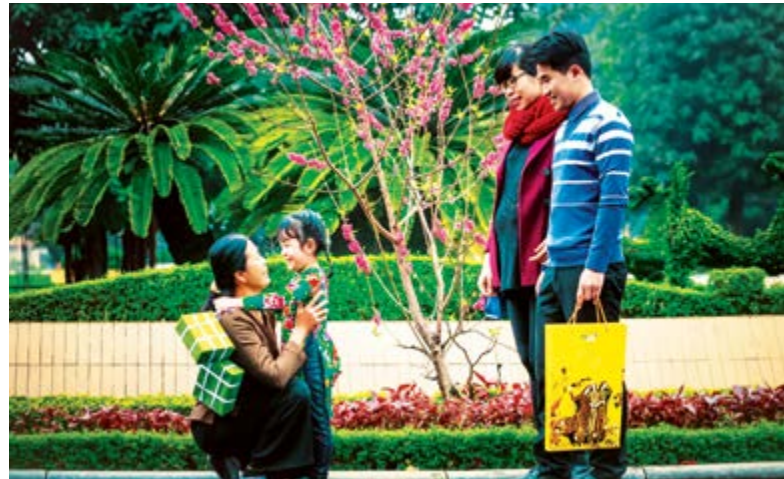
Mùa xuân yêu thương - bộ Ảnh đồng giải Nhất