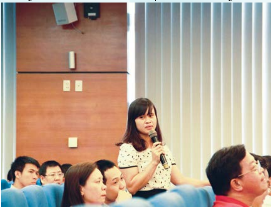
Cán bộ công đoàn PVGas tham gia thảo luận

Có thể nói việc tập huấn công tác chính sách pháp luật của CĐ DKVN đang ngày một thiết thực, học viên là những cán bộ công đoàn không chuyên nhưng ngày càng thấy hứng thú học tập từ các giảng viên có trình độ cao, kiến thức uyên bác. Mỗi đợt tập huấn không chỉ nâng cao, cập nhật kiến thức pháp luật cho cán bộ công đoàn mà còn khẳng định uy tín, trách nhiệm của những thủ lĩnh lao động tại các cơ sở, đơn vị của ngành Dầu khí Việt Nam. 🌸