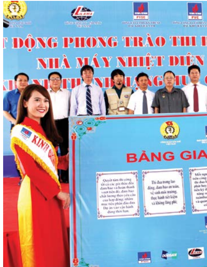
Đại diện Ban QLDA Điện lực Dầu khí SH1, Tổng thầu Lilama và các nhà thầu phụ ký kết Giao ước thi đua

Công đoàn Dầu khí Việt Nam phối hợp cùng Ban Quản lý Dự án (QLDA) Điện lực Dầu khí Sông Hậu 1, Tổng công ty Lắp máy Việt Nam (Lilama), Tổng công ty Dịch vụ Kỹ thuật Dầu khí Việt Nam (PTSC), Tổng công ty CP Xây lắp Dầu khí Việt Nam (PVC), Tập đoàn Doosan Hàn Quốc cùng tổ hợp các nhà thầu tư vấn, nhà thầu thi công đã phát động phong trào thi đua trên công trường Dự án Nhà máy Nhiệt điện (NMNĐ) Sông Hậu 1 nhân dịp khánh thành Cảng nhập thiết bị vào ngày 15/6/2016.