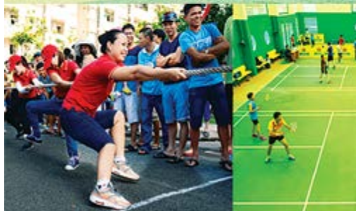
Khoảnh khắc gay cấn, hấp dẫn trong từng bộ môn thi đấu