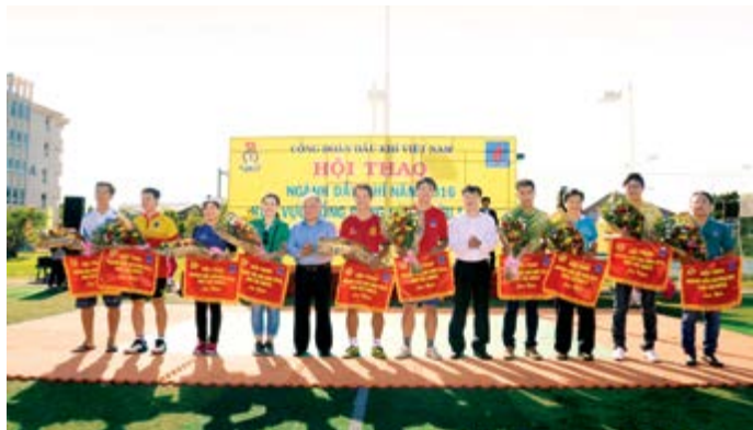
BTC trao Cờ lưu niệm cho các đơn vị tham dự hội thao