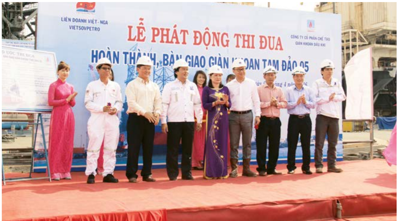
Lãnh đạo Tập đoàn DKVN và Lãnh đạo CĐ DKVN dự Lễ phát động thi đua hoàn thành, bàn giao Giàn khoan Tam Đảo 05

Công đoàn Dầu khí Việt Nam đã tích cực chủ trì và phối hợp chủ trì tổ chức tổ phong trào thi đua trên các dự án công trình trọng điểm Dầu