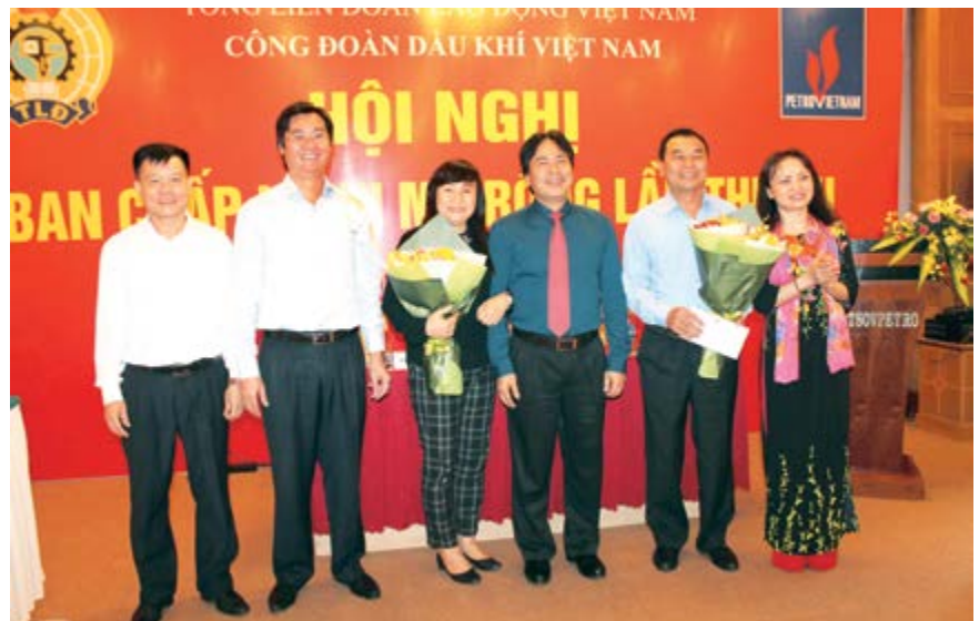
Lãnh đạo Tập đoàn và CĐ DKVN tặng hoa chia tay hai đồng chí trong BCH, BTV CĐ DKVN nghỉ hưu theo chế độ

Hội nghị đã thông qua Nghị quyết Hội nghị Ban Chấp hành khóa V mở rộng lần thứ XII, nhiệm kỳ 2013-2018 với sự nhất trí, đồng thuận của 100% đại biểu tham dự. 🌸