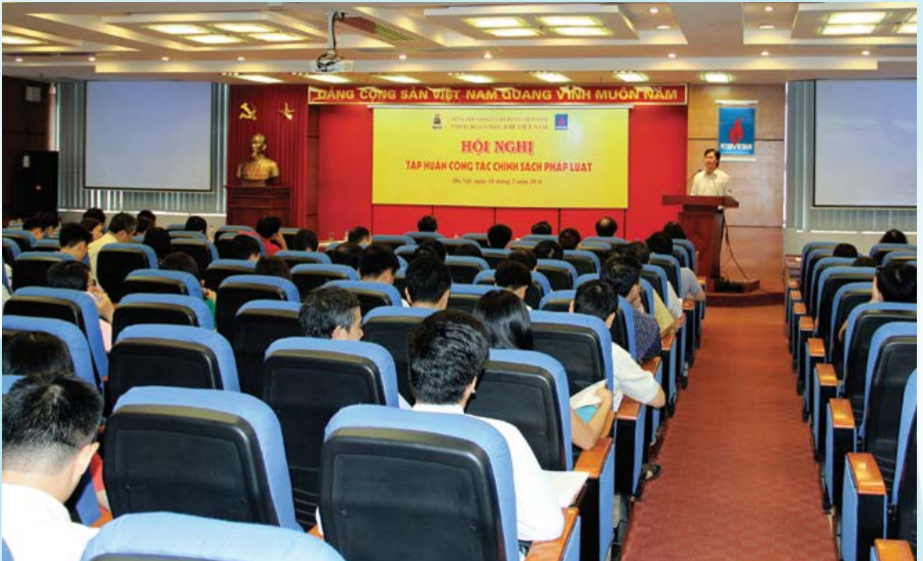
Toàn cảnh đợt tập huấn tập Chính sách pháp luật khu vực miền Bắc năm 2016