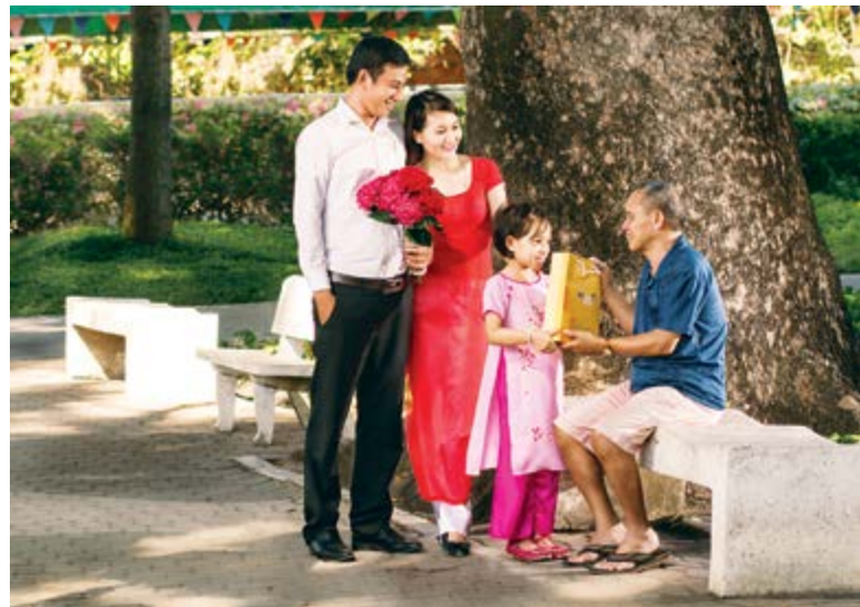
Mùa xuân yêu thương - bộ Ảnh đồng giải Nhất