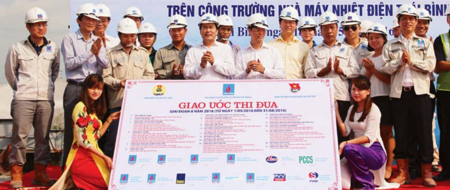
Các đơn vị ký Giao ước thi đua giai đoạn II (1/5/2016 - 31/8/2016)

TRÊN CÔNG TRƯỜNG NHÀ MÁY NHIỆT ĐIỆN THÁI BÌNH 2