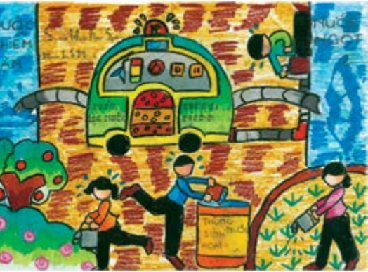
Máy lọc nước biển thành nước ngọt