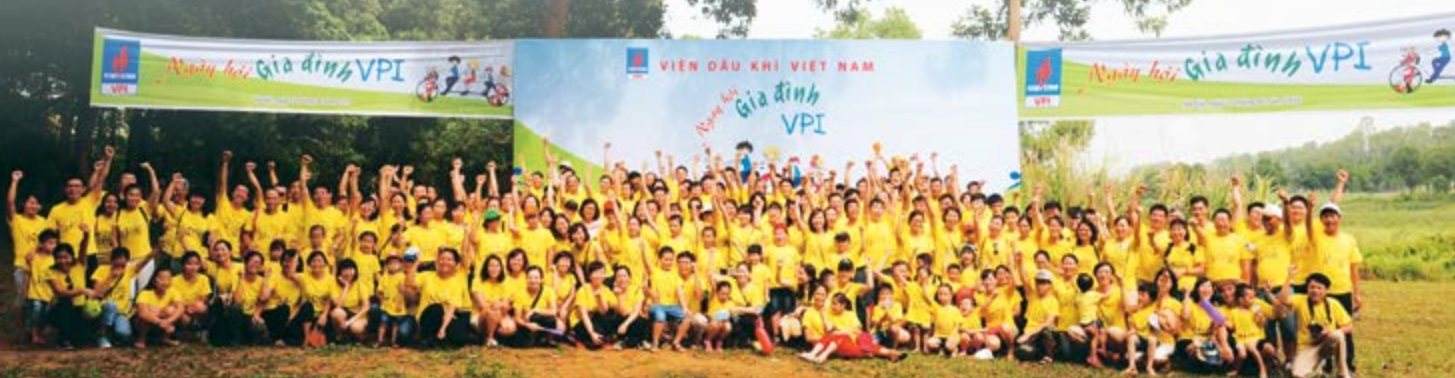
Ngày hội gia đình VPI truyền tải thông điệp “Yêu thương - Gắn kết - Vượt khó”.