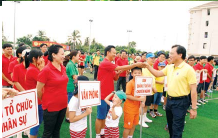
Toàn cảnh lễ khởi động chương trình rèn luyện sức khỏe