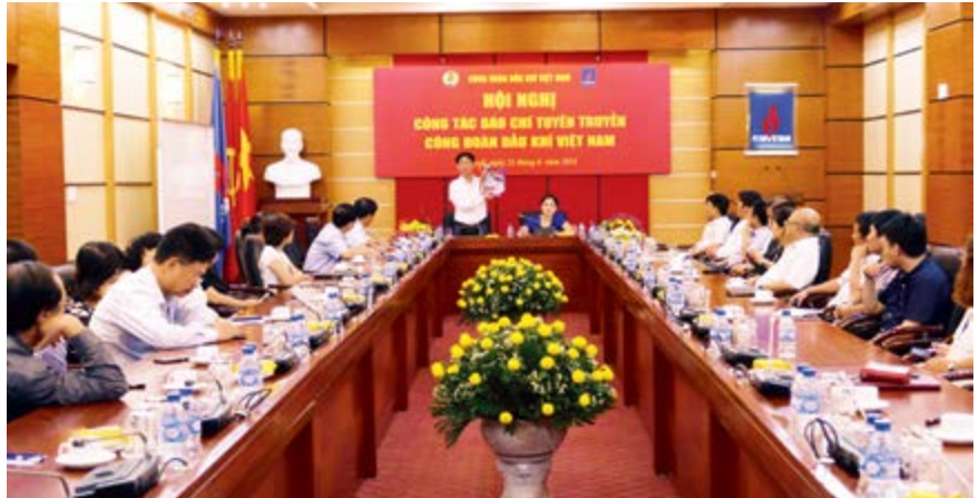
Toàn cảnh Hội nghị công tác báo chí tuyên truyền CĐ DKVN năm 2016

Bên cạnh đó, đồng chí cũng nhấn mạnh những điều còn hạn chế, còn tồn tại trong công tác thông tin công đoàn thông qua các ấn phẩm Tạp chí Công đoàn và website Công đoàn