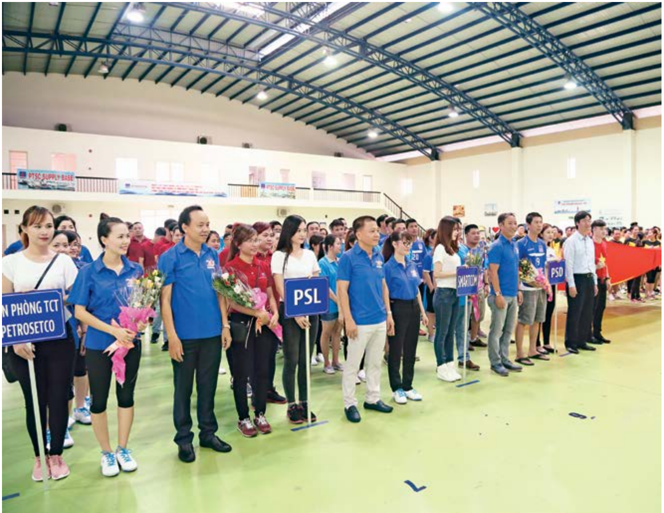
Lễ khai mạc hội thao của PETROSETCO