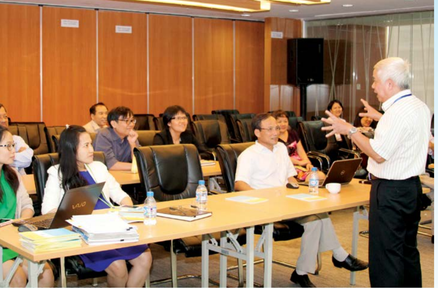
Toàn cảnh lớp học