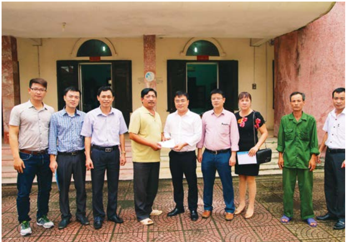
Công đoàn Ban QLDA thăm và tặng quà cho Quỹ bảo trợ người khuyết tật và trẻ mồ côi huyện Thái Thụy