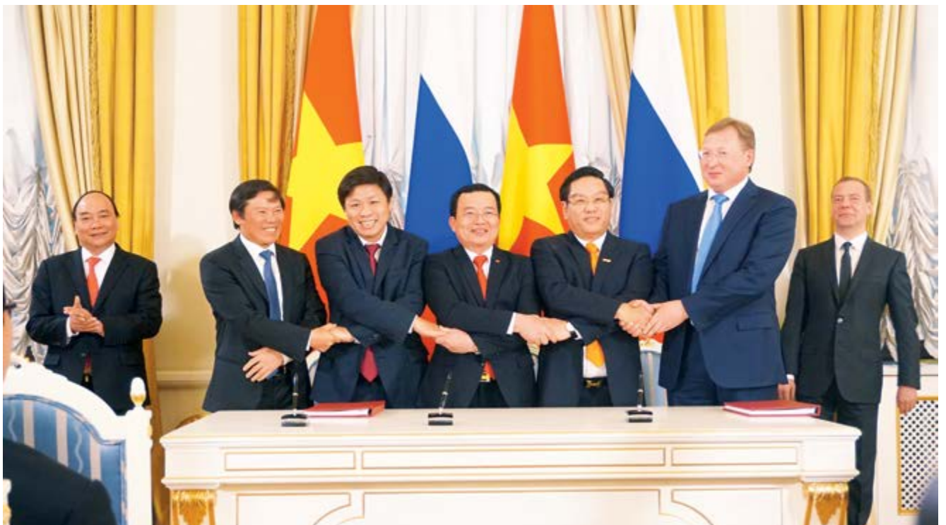
Lãnh đạo PVN, PVEP và Vietsovetro ký Hợp đồng phân chia sản phẩm dầu khí