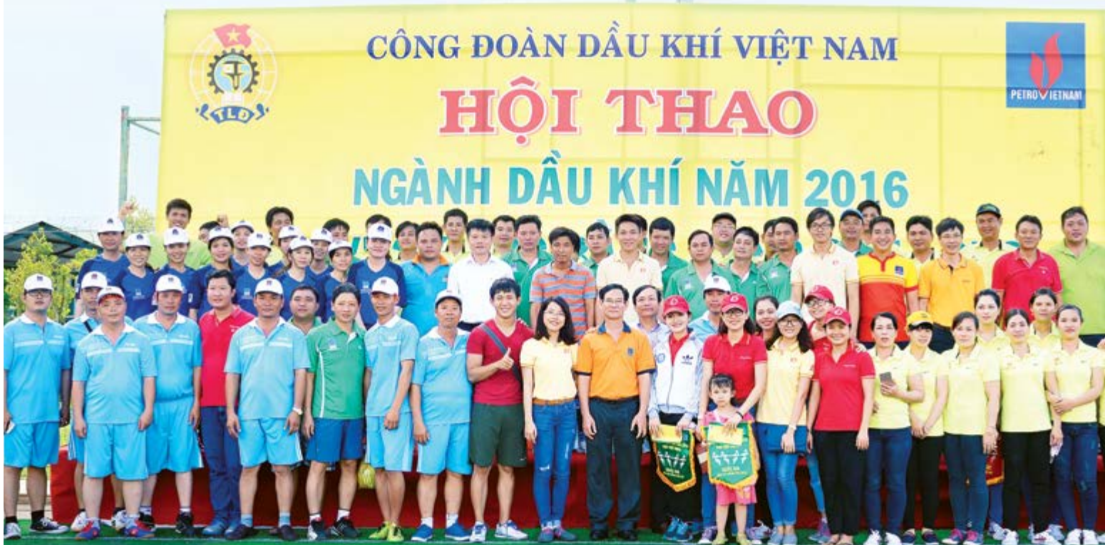
BTC cùng các vận động viên chụp ảnh lưu niệm