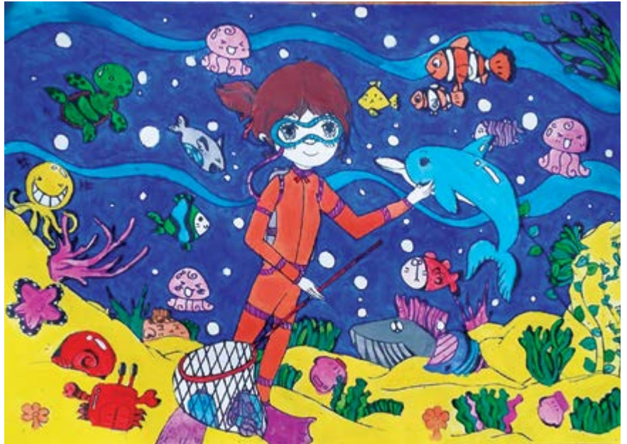
Em bảo vệ biển

G ia đình công đoàn viên sẽ chụp ảnh bức tranh của bé dự thi (từ 5-14 tuổi) và tự đăng tải, mời khán giả bình chọn bằng cách nhấn LIKE trên Microsite, LIKE và SHARE trên facebook PVcomBank. Ban Tổ chức sẽ chọn ra 15 bức tranh xuất sắc để tham dự Vòng Chung kết. Tại Vòng Chung kết, Ban Tổ chức sẽ chấm trực tiếp bức tranh dự thi của các bé để chọn ra 01 giải đặc biệt trị giá 10.000.000 VND và nhiều giải hấp dẫn khác, tổng giá trị giải thưởng lên tới 86.000.000 VND.