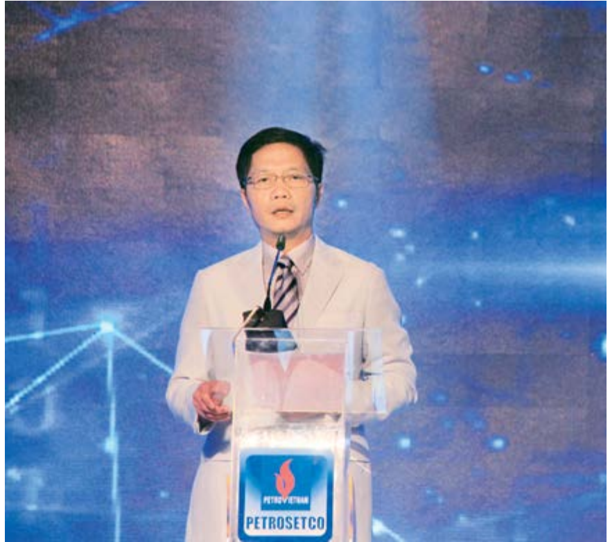
Bộ trưởng Bộ Công Thương Trần Tuấn Anh phát biểu chỉ đạo tại buổi lễ

Trong chặng đường 20 năm hình thành và phát triển, mặc dù phải đối mặt với rất nhiều khó khăn thách thức, thế nhưng với nhiệt huyết từ trái tim và bản lĩnh từ khối óc, PETROSETCO vẫn luôn vững bước trước mọi chông gai, đã, đang và sẽ luôn cam kết tiên phong trong mọi hành động để cung cấp chất lượng dịch vụ vượt trội, đảm bảo lợi ích tối ưu cho khách hàng, cho đối tác và người lao động. Điều