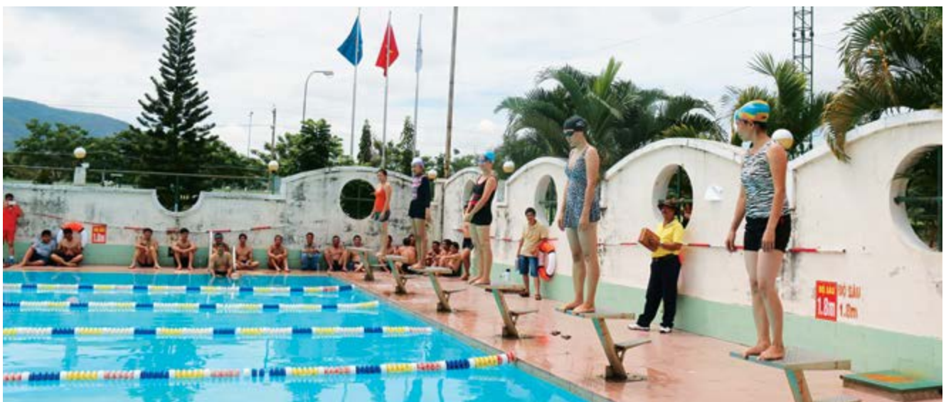
Hình ảnh các bộ môn thi đấu tại Hội thao PVFCCo