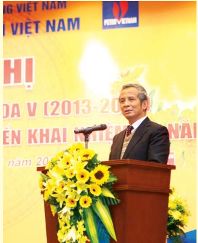
Đ/c Đặng Ngọc Tùng - Nguyên CT Tổng LĐLĐ VN tại một hội nghị của Công đoàn Dầu khí

PV: Những cam kết của Việt Nam trong TPP liên quan đến lao động và công đoàn không nằm ngoài những cam kết của Việt Nam khi tham gia vào ILO. Nhưng có lẽ việc thực