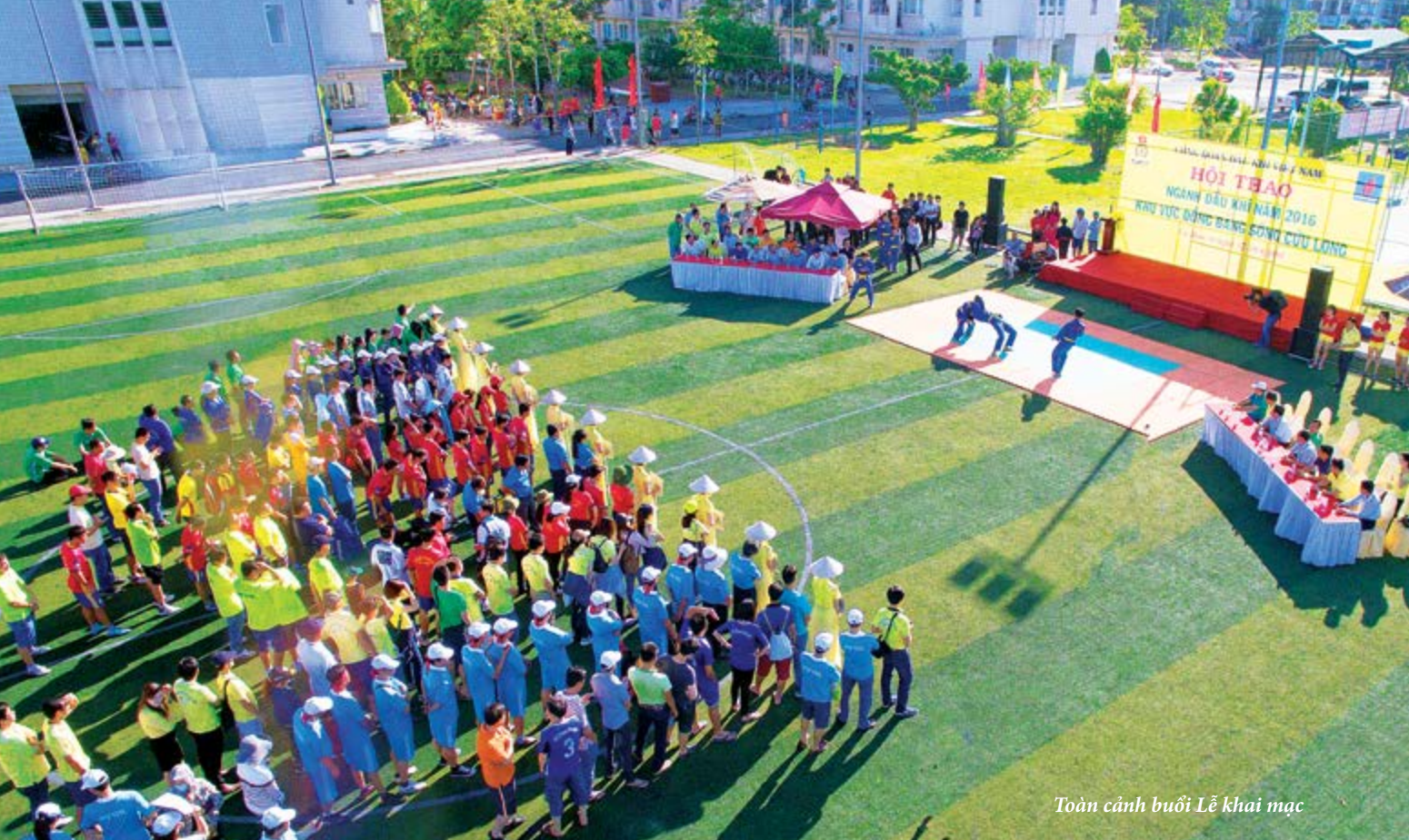
Toàn cảnh buổi Lễ khai mạc