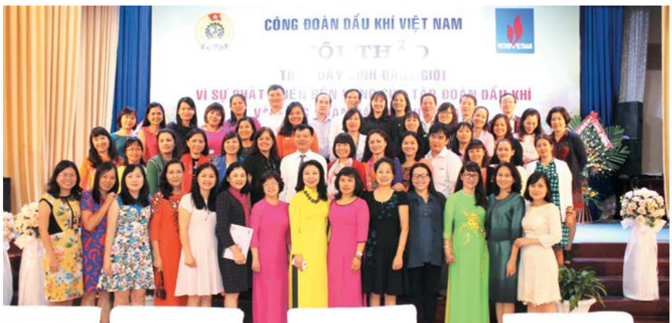
Lãnh đạo TLĐ LĐVN, Lãnh đạo CĐ DKVN chụp ảnh lưu niệm cùng các đại biểu