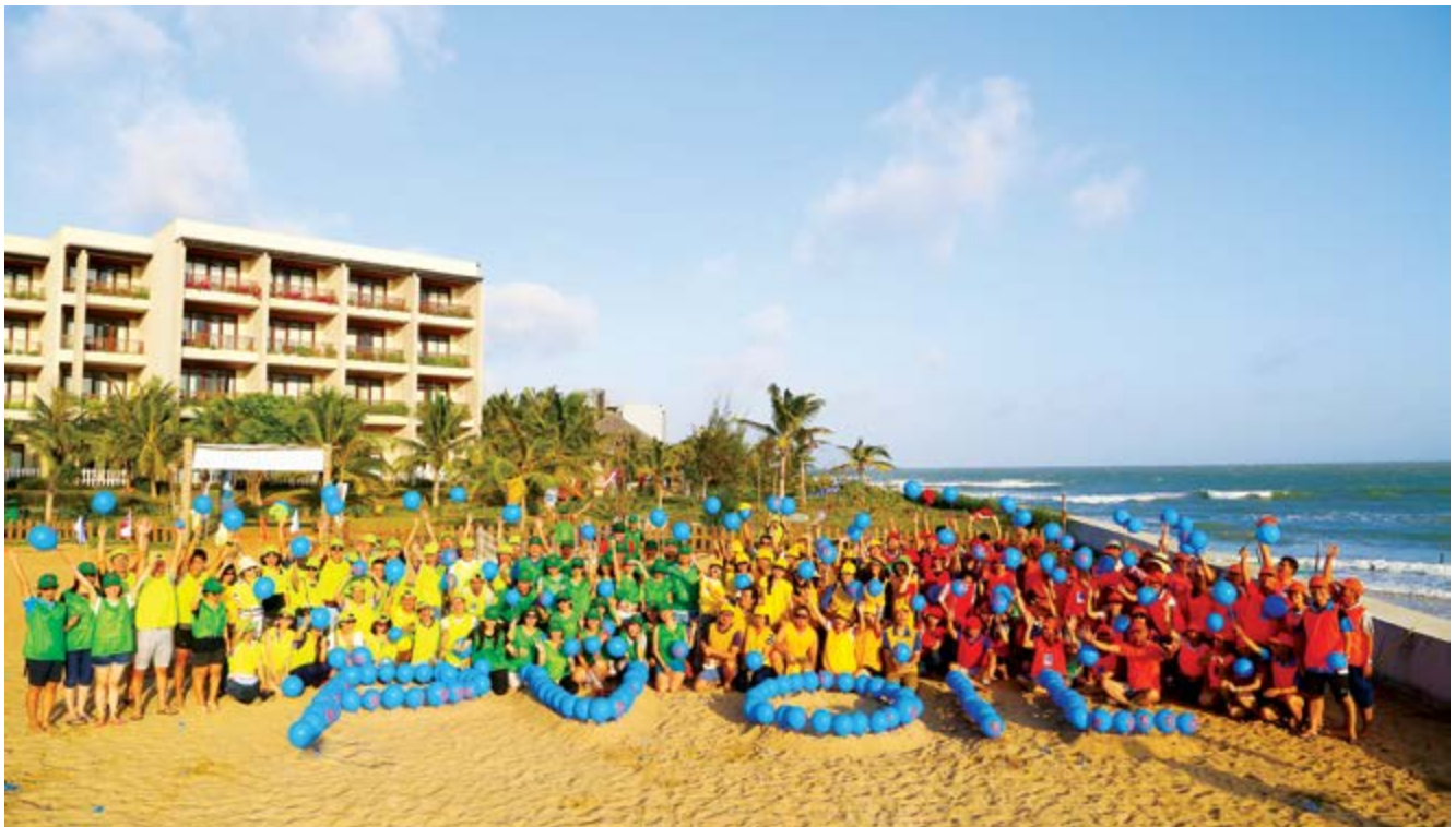
Teambuilding chào xuân 2016 của CBCNV-LĐ PV Oil

6 tháng cuối năm 2016, Công đoàn PV Oil sẽ tiếp tục đồng hành cùng TCT hoàn thiện các cơ chế chính sách đối với NLĐ, làm tốt nhiệm vụ phối hợp với chuyên môn đảm bảo giữ vững và phát huy thành quả đạt của tổ chức công đoàn. Thực hiện tốt chức năng bảo vệ quyền, lợi ích hợp pháp và chính đáng của NLĐ giai đoạn cổ phần hóa và phát triển TCT. 🌸