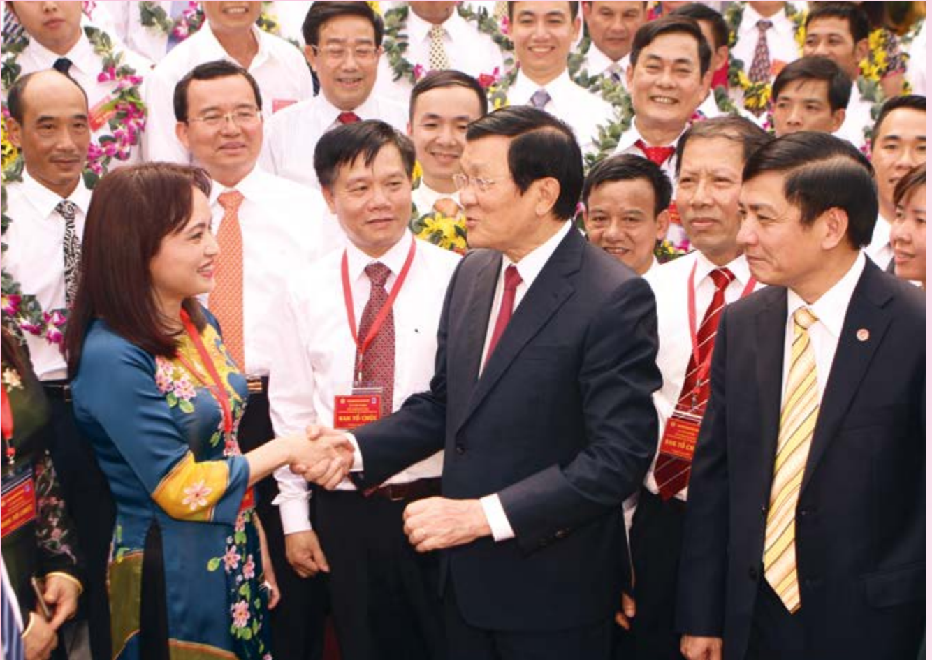
Nguyên Chủ tịch nước Trương Tấn Sang gặp gỡ lãnh đạo Tập đoàn Dầu khí Việt Nam và người lao động Dầu khí tiêu biểu năm 2015

quyền, đồng thuận với các quyết sách - đặc biệt là trong việc tái cơ cấu.