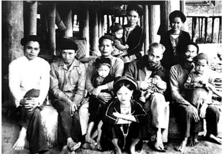
Bác Hồ thăm một gia đình đồng bào dân tộc Dao ở xã Mỹ Bằng, huyện Yên Sơn, tỉnh Tuyên Quang, năm 1952

Trong Lễ kỷ niệm 15 năm Ngày Gia đình Việt Nam (28/6/2001-28/6/2016) diễn ra tại Nhà hát Lớn Hà Nội, Thủ tướng Nguyễn Xuân Phúc đã khẳng định: “Đảng và Nhà nước ta luôn quan tâm và có nhiều chủ trương, chính sách để giữ gìn giá trị gia đình và tạo mọi điều kiện để các ngành, các cấp và mỗi cá nhân chăm lo xây dựng gia đình Việt Nam ấm no, hạnh phúc”. Đây chính là sự tiếp nối tư tưởng của Chủ tịch Hồ Chí Minh về giá trị của gia đình - tế bào của xã hội.