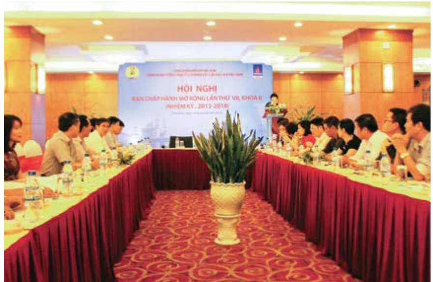
Toàn cảnh Hội nghị BCH mở rộng lần thứ VII, khóa II (Nhiệm kỳ 2013-2018)

đại diện cho CĐ DKVN tham dự chương trình của Đoàn Chủ tịch Tổng LĐLĐ VN và Bộ Tư lệnh Hải quân thăm huyện đảo Trường Sa và khánh thành Bệnh xá đảo Song Tử Tây. Tại đây, Công đoàn PVC đã trao tặng các cán bộ, chiến sĩ một phần quà trị giá 26.500.000 đồng bao gồm 1 dàn máy karaoke và 1 bộ máy tính - trích từ nguồn KPCĐ CĐ PVC và Công đoàn Công ty CP Kết cấu Kim loại và Lắp máy Dầu khí (PVC-MS).