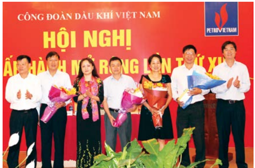
Lãnh đạo CĐ DKVN tặng hoa mừng sinh nhật các đồng chí trong BCH, BTV CĐ DKVN