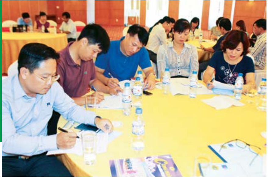
Các học viên nhóm 3 tập trung nghiên cứu chủ đề của mình

Tháng 6 vừa qua, tại TP Thái Bình, Công đoàn Tổng công ty cổ phần Xây lắp Dầu khí Việt Nam (Công đoàn PVC) đã tổ chức lớp tập huấn cho hơn 70 cán bộ Công đoàn trực thuộc Công đoàn Tổng công ty về vai trò của Công đoàn trong thời kỳ hội nhập kinh tế quốc tế - đặc biệt là chuẩn bị hội nhập TPP.