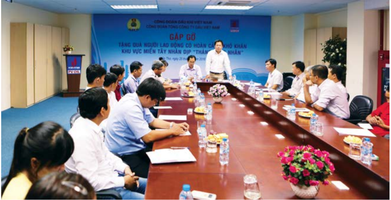
Công đoàn gặp gỡ tặng quà NLD PV Oil dịp Tháng Công nhân