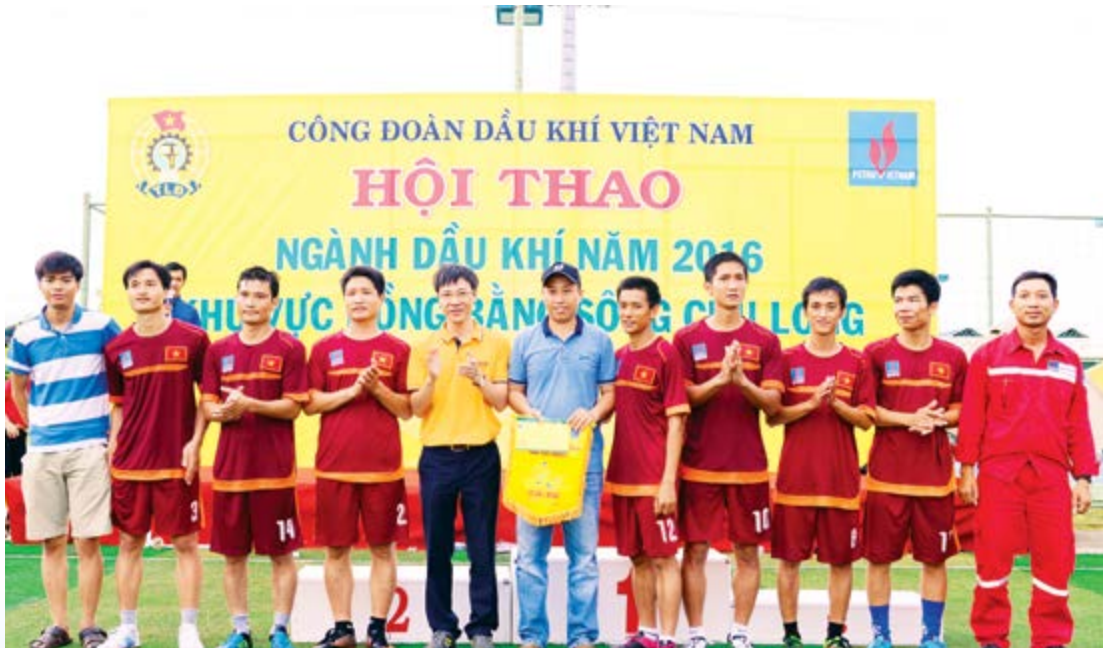
BTC trao giải cho các vận động viên xuất sắc nhất hội thao

Sau ba ngày tranh tài sôi nổi (từ 17/6 - 19/6) với chất lượng chuyên môn cao trên tinh thần học hỏi - giao lưu - trung thực - cao thượng, Hội thao ngành Dầu khí khu vực ĐBSCL năm 2016 đã để lại nhiều kỷ niệm đẹp và thắt chặt hơn tình đoàn kết giữa các CBCNV trong ngành Dầu khí. 🌸