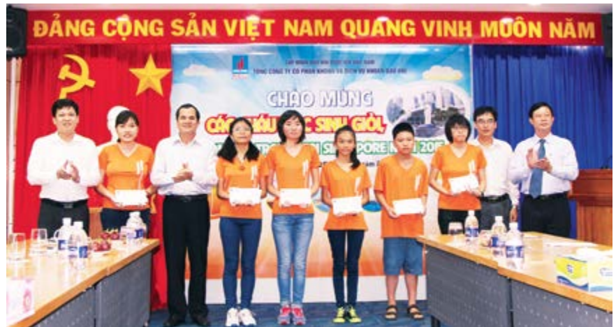
Chương trình giao lưu trại hè Singapore dành cho các cháu học sinh giỏi là con của CB-CNV PV Drilling được tổ chức thường niên từ năm 2011

chúng tôi vẫn còn được nằm trong diện nghỉ chờ việc. Không những vậy, Ban lãnh đạo, tổ chức công đoàn vẫn quan tâm chăm lo đời sống tinh thần cho người lao động bằng việc tổ chức những buổi gặp gỡ, và có những phần quà động viên chúng tôi trong thời điểm khó khăn nhất. Đó là một