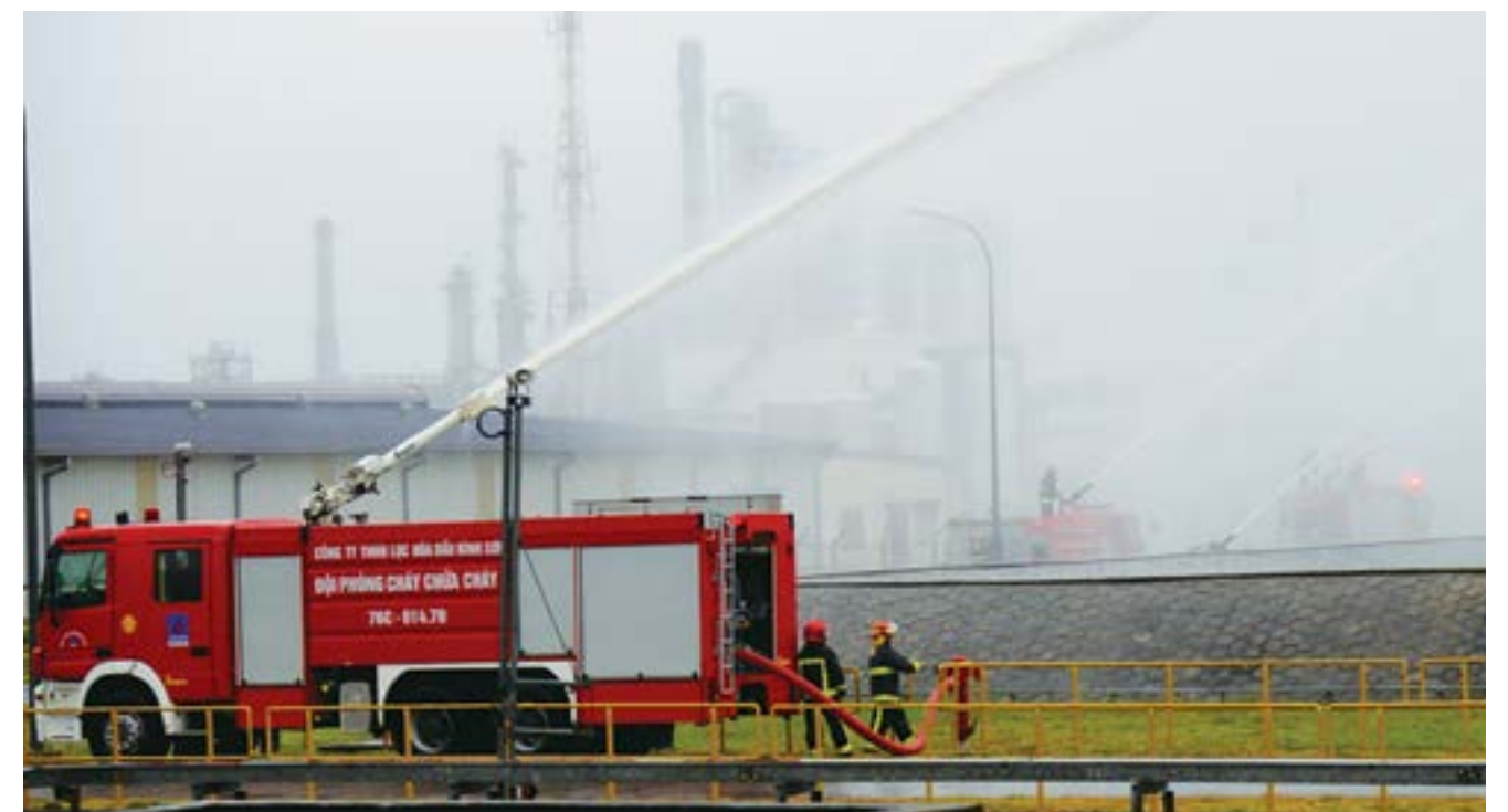
Diễn tập chữa cháy tại Nhà máy Lọc dầu Dung Quất

Việc phối kết hợp kiểm tra thường kỳ giữa công đoàn với chuyên môn là một trong những phương pháp hữu hiệu trong việc đẩy mạnh công tác AT-SK-MT, PCCC, khẳng định sự liên kết chặt chẽ, thống nhất hướng tới mục tiêu: tạo tính chuyên nghiệp, nề nếp trong việc thực hiện công tác ATVSLĐ, nâng cao ý thức của chuyên môn cũng như công đoàn các cấp, giảm thiểu tối đa rủi ro, chăm sóc tốt nhất cho người lao động, góp phần đẩy mạnh hoạt động sản xuất kinh doanh tại các đơn vị để xây dựng Tập đoàn Dầu khí Việt Nam ngày càng vững mạnh. 🌸