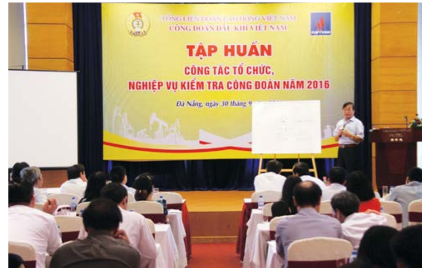
Toàn cảnh hội nghị tập huấn công tác tổ chức và nghiệp vụ kiểm tra năm 2016 của CĐ DKVN