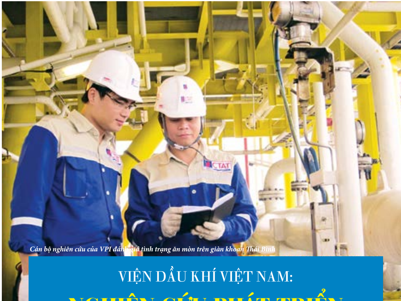
Cán bộ nghiên cứu của VPI đánh giá tình trạng ăn mòn trên giàn khoan Thái Bình