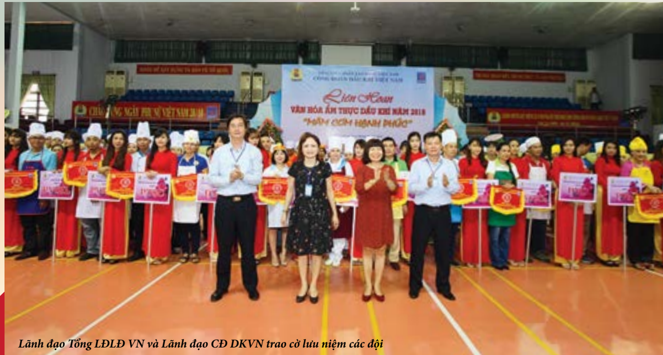
Lãnh đạo Tổng LĐLĐ VN và Lãnh đạo ĐKVN trao cờ lưu niệm các đội