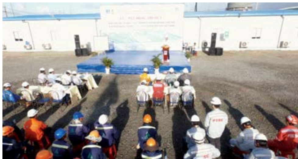
Phát động thi đua tại Dự án Nhà máy Xử lý khí Cà Mau 1