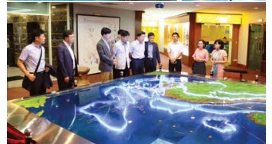
Đoàn đại biểu FKCU thăm phòng truyền thống của PVN