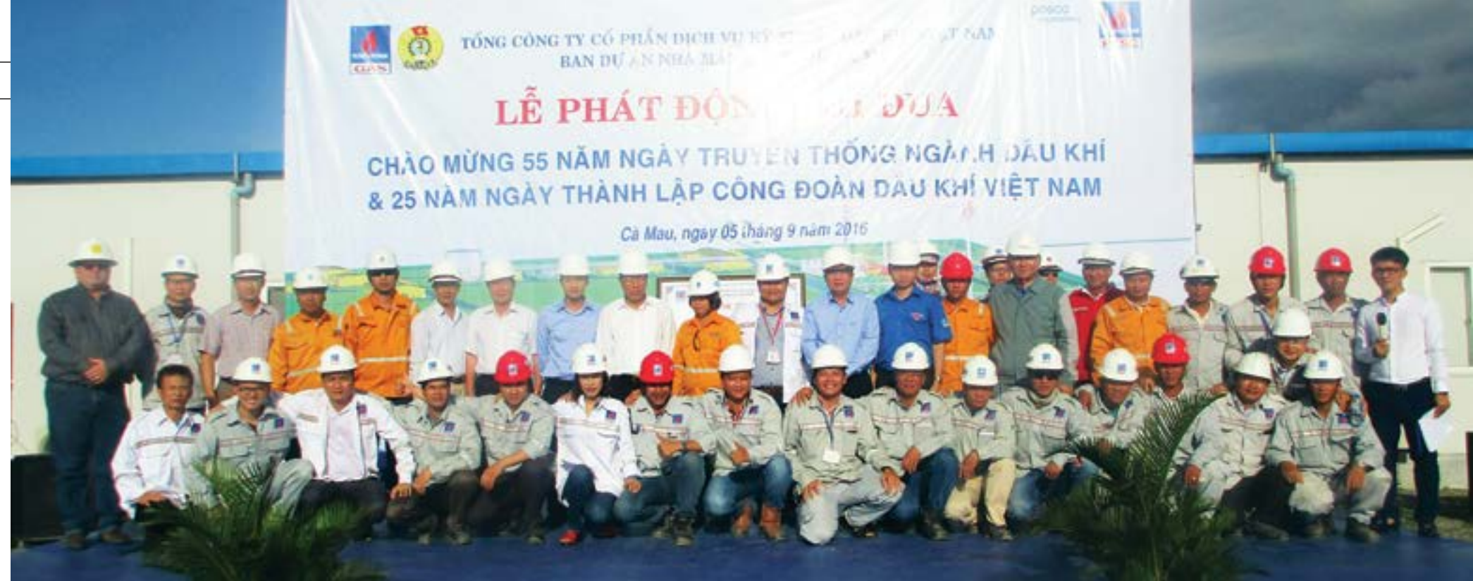
Phát động thi đua tại Dự án Nhà máy Xử lý khí Cà Mau 2

Thiết thực thi đua lập thành tích chào mừng 55 năm Ngày Truyền thống ngành Dầu khí (27/11/1961 - 27/11/2016) và 25 năm Ngày Thành lập Công đoàn Dầu khí Việt Nam (16/12/1991 - 26/12/2016), vào đầu tháng 9/2016 Công đoàn Tổng công ty CP Dịch vụ Kỹ thuật Dầu khí Việt Nam (PTSC) đã tổ chức Lễ phát động thi đua tại Dự án NPK/NH3 và Dự án Nhà máy Xử lý khí Cà Mau do PTSC đang thi công.