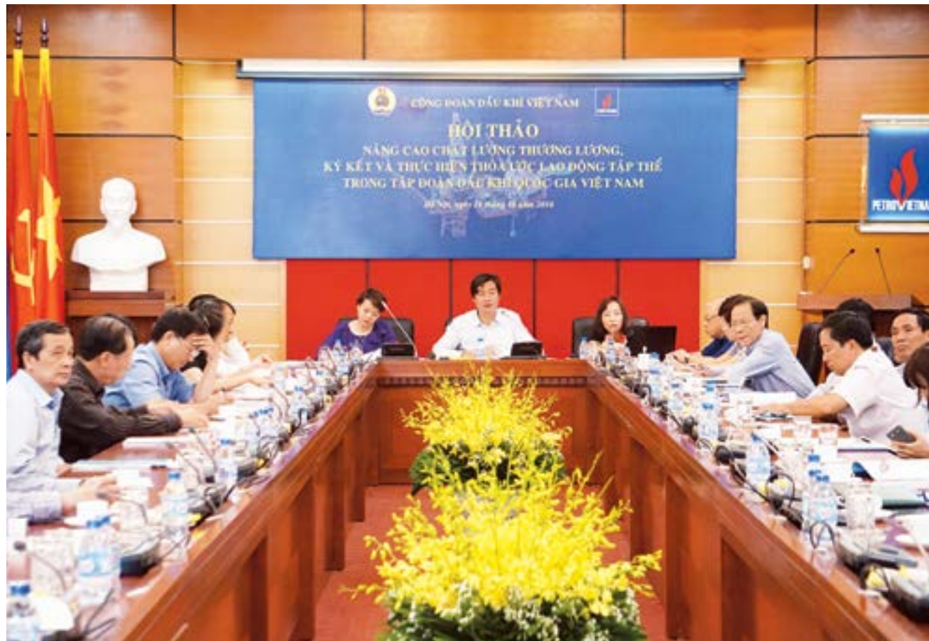
Toàn cảnh Hội thảo nâng cao chất lượng thương lượng, ký kết và thực hiện Thỏa ước lao động tập thể trong Tập đoàn