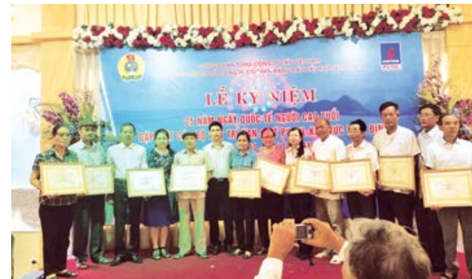
Trao biểu trưng mừng thọ cán bộ hưu trí PV OIL

Cũng tại buổi gặp gỡ, ngoài những tiết mục văn nghệ, bài nói chuyện chuyên đề về “Đời sống và sức khỏe” của các chuyên gia y tế, đại diện lãnh đạo và Công đoàn PV OIL cũng đã trao biểu trưng Mừng thọ của Tổng Giám đốc Tập đoàn Dầu khí Việt Nam cho các cán bộ 65, 75, 85 tuổi. 🌸