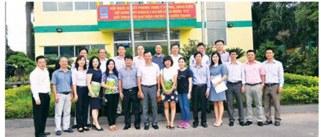
Đoàn công tác chụp hình lưu niệm tại với lãnh đạo Công ty PVFCCo Central