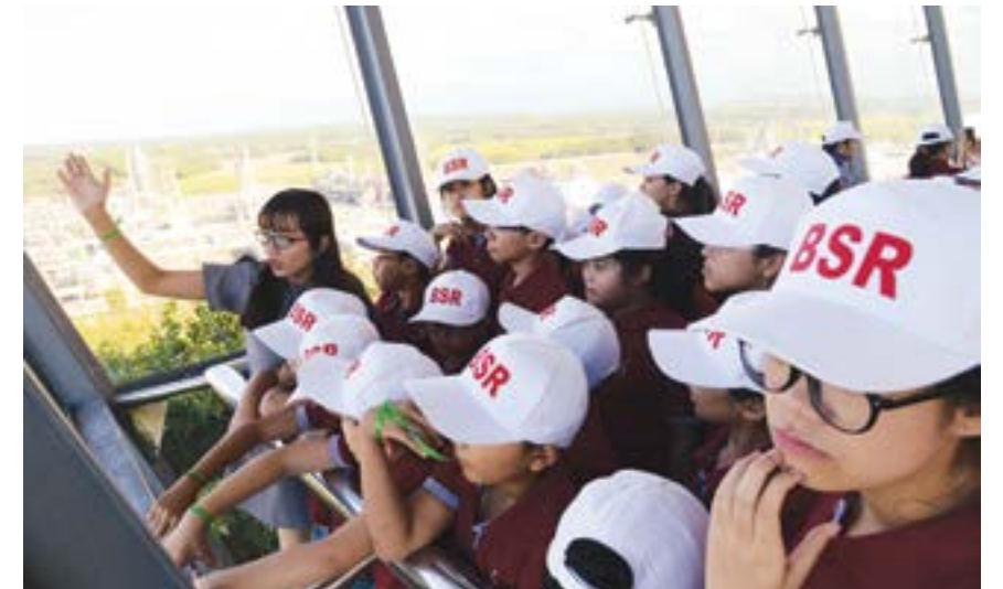
Các em học sinh giỏi tham quan Nhà máy Lọc dầu Dung Quất từ đài quan sát trên Đồi Cây Sấu

Trong thời gian qua, bắt nhịp với hoạt động sản xuất kinh doanh của nhà máy, Công đoàn BSR luôn thăm hỏi, quan tâm, chia sẻ đối với những khó khăn của NLD trong lúc hoạn nạn, gặp biến cố trong cuộc sống. Song song với việc trực tiếp tìm hiểu, cán bộ công đoàn còn làm việc với các bộ phận trực tiếp sản xuất để nắm bắt nhu cầu của NLD để kịp thời đề xuất, kiến nghị