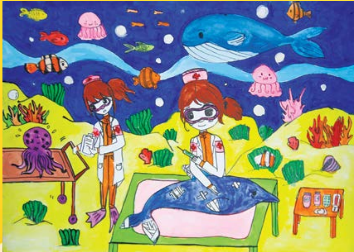
Giải đặc biệt: Bệnh viện Hải dương (Mai Thảo Phương)

Lễ trao giải cho các em tham gia & đạt giải tại Cuộc thi “Em vẽ ước mơ” đã diễn ra tại Phòng họp Hà Nội và 7 điểm cầu truyền hình Hồ Chí Minh, Cần Thơ, Nam Định, Bà Rịa - Vũng Tàu, Đà Nẵng, Đồng Tháp. Cuộc thi do Công đoàn và Marcom cùng phối hợp tổ chức thực hiện triển khai từ Ngày Quốc tế thiếu nhi (1/6/2016) đến 24/8/2016 với 2 giai đoạn: Bình chọn online trên microsite, facebook và thi trực tiếp trước sự chứng kiến của Ban Tổ chức, họa sĩ có chuyên môn.