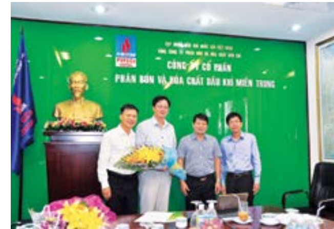
Thường trực Công đoàn PVFCCo tặng hoa chia tay các đồng chí thôi tham gia BCH

Đặc biệt, tại hội nghị đã diễn ra buổi đối thoại giữa đại diện BCH Công đoàn PVFCCo với đại diện Người Lao động, BCH Công đoàn và Tổ đối thoại của PVFCCo Central về những vướng mắc, những giải pháp thực hiện cũng như các mô hình nâng cao chất lượng hoạt động của tổ chức công đoàn, phong trào lao động, nâng cao chất lượng đời sống vật chất, tinh thần của CBNV. Qua đó, khơi dậy lòng tự hào và sự gắn bó của người lao động với hoạt động của công ty. Đây cũng là lần đầu tiên BCH Công đoàn PVFCCo đã có buổi thăm, làm việc, giao lưu và trực tiếp động viên tinh thần làm việc của người lao động PVFCCo Central. 🌸