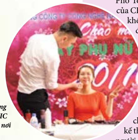
Chuyên gia hướng dẫn chị em PVEIC cách trang điểm nơi công sở

Năm mừng khuôn khổ chương trình còn có buổi nói chuyện chuyên đề “Nét đẹp nơi công sở”. Đây được xem là món quà đặc biệt dành cho các chị, em nữ PV EIC. Buổi nói chuyện đã đem lại không ít những lợi ích thiết thực cho chị, em những định hướng văn hóa doanh nghiệp, trên cơ sở kế thừa nét đẹp truyền thống vừa kết hợp yếu tố thời đại tạo nên người phụ nữ trẻ trung, đôn hậu, giỏi việc nước, đảm việc nhà. 🌸