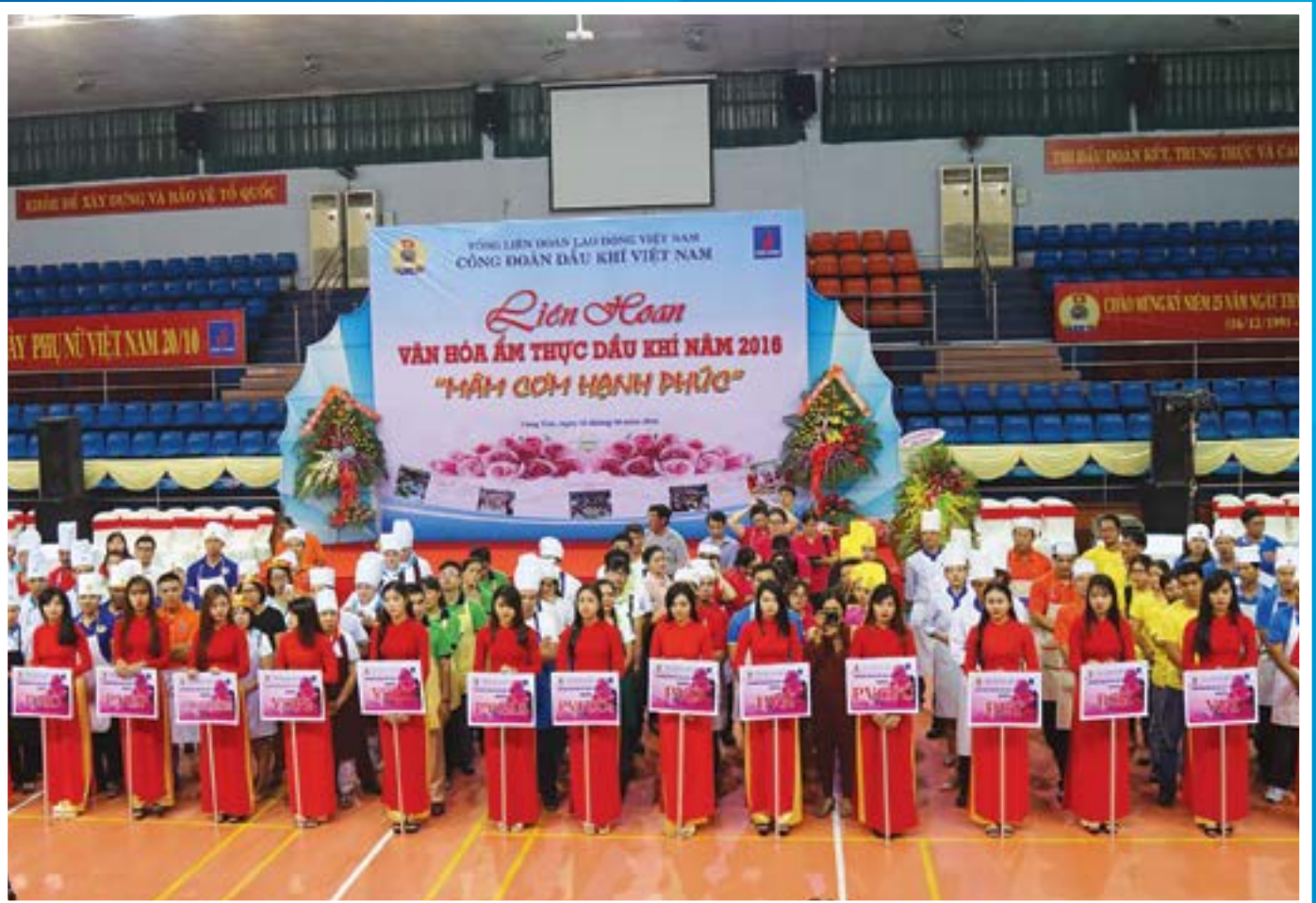
Lễ khai mạc Liên hoan Văn hóa ẩm thực Dầu khí năm 2016