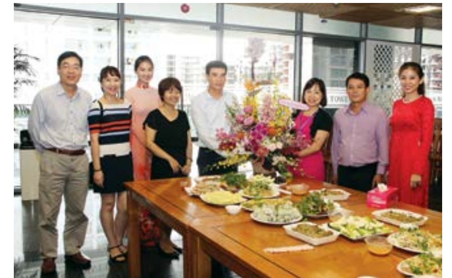
Lãnh đạo PV GAS tặng hoa chúc mừng nữ CBNV

làm 2 đoàn, các chị em KTA sẽ có dịp thưởng thức thắng cảnh của Đà Nẵng và Ninh Bình, cùng sinh hoạt tập thể và chia sẻ niềm vui bên nhau. Tại Công ty CP Phân phối Khí Miền Nam (KMN), đây cũng là dịp tổ chức cho một số chị em về nguồn tại Quảng Bình, thời gian từ ngày 21 đến 23/10. Bên cạnh chương trình sinh hoạt và tham quan như đã định, chị em đã thay mặt CBCNV KMN cũng tham gia thăm hỏi và tặng quà cho bà con vùng bị lũ lụt tại Quảng Bình và Hà Tĩnh, số tiền quyên góp từ tất cả những tấm lòng hảo tâm trong đơn vị. 🌸