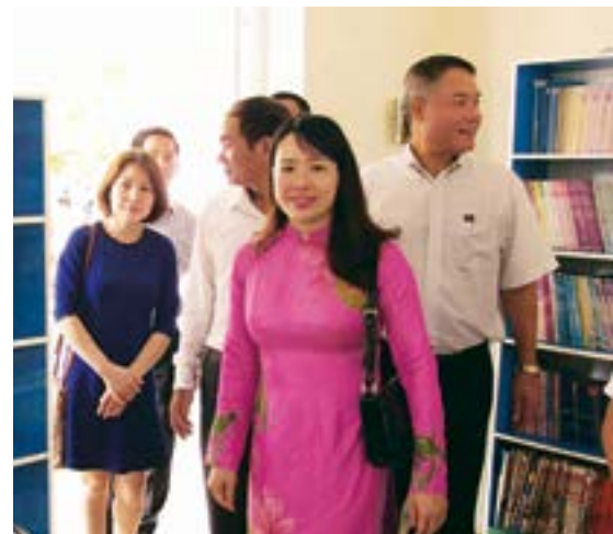
Các đại biểu tham quan thư viện nhà trường

Chia vui cùng thầy trò Trường Tiểu học xã Kim Lộc, đại diện ban lãnh đạo,