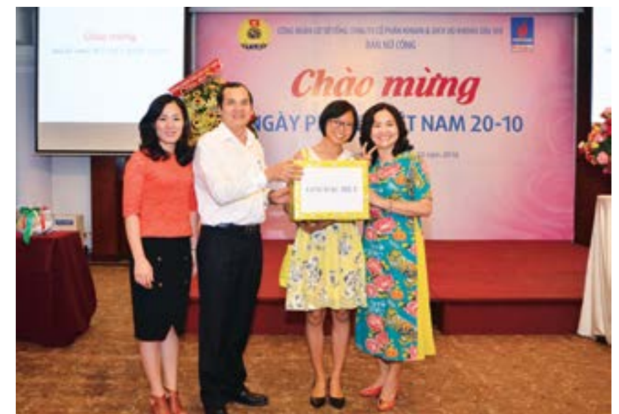
Trao giải đặc biệt Lucky draw