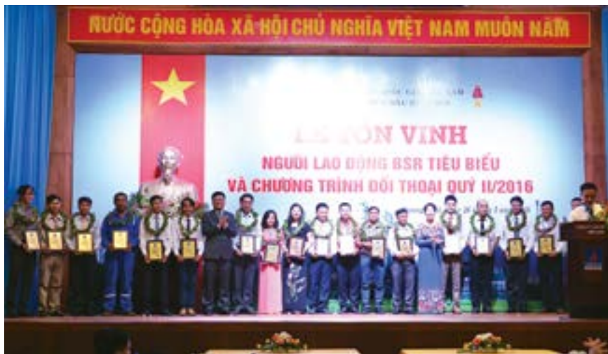
Gia đình CBCNV có thành tích xuất sắc trong công tác an toàn và lao động sản xuất tham quan NMLD Dung Quất

9 tháng đầu năm 2016, bằng tất cả tinh thần nhiệt huyết và cái tâm với các phong trào cũng như chăm lo chu đáo để CBCNV-LĐ được làm việc trong một môi trường xanh - sạch - đẹp, các điều kiện làm việc đều hiện đại và tiện ích, hệ thống tổ chức công đoàn từ cấp công ty đến các tổ công đoàn đã thật sự phát huy hiệu quả trong các hoạt động phong trào cũng như triển khai thiết thực công tác nắm bắt nhu cầu và tâm tư NLD.