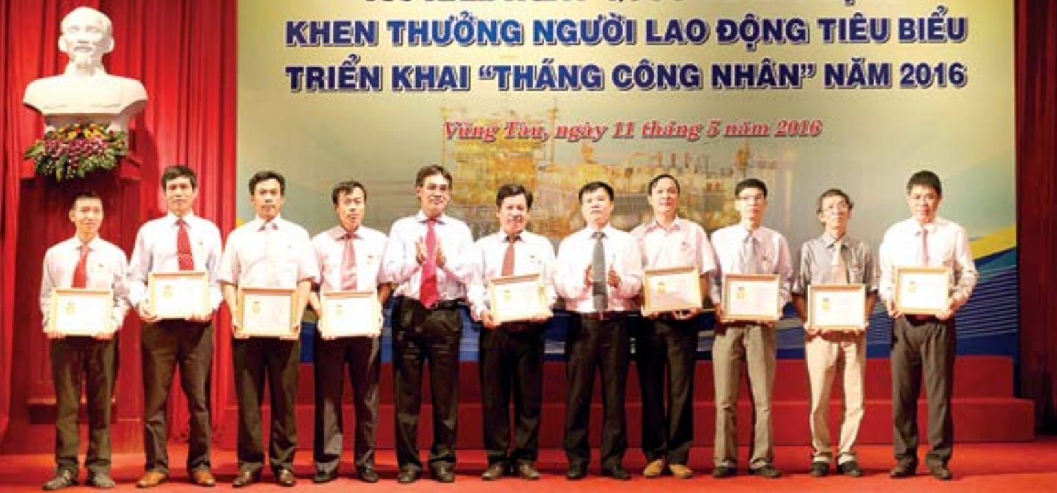
Lễ gắn biển Công trình thi đua trên giàn nén khí trung tâm - mô Bạch Hồ