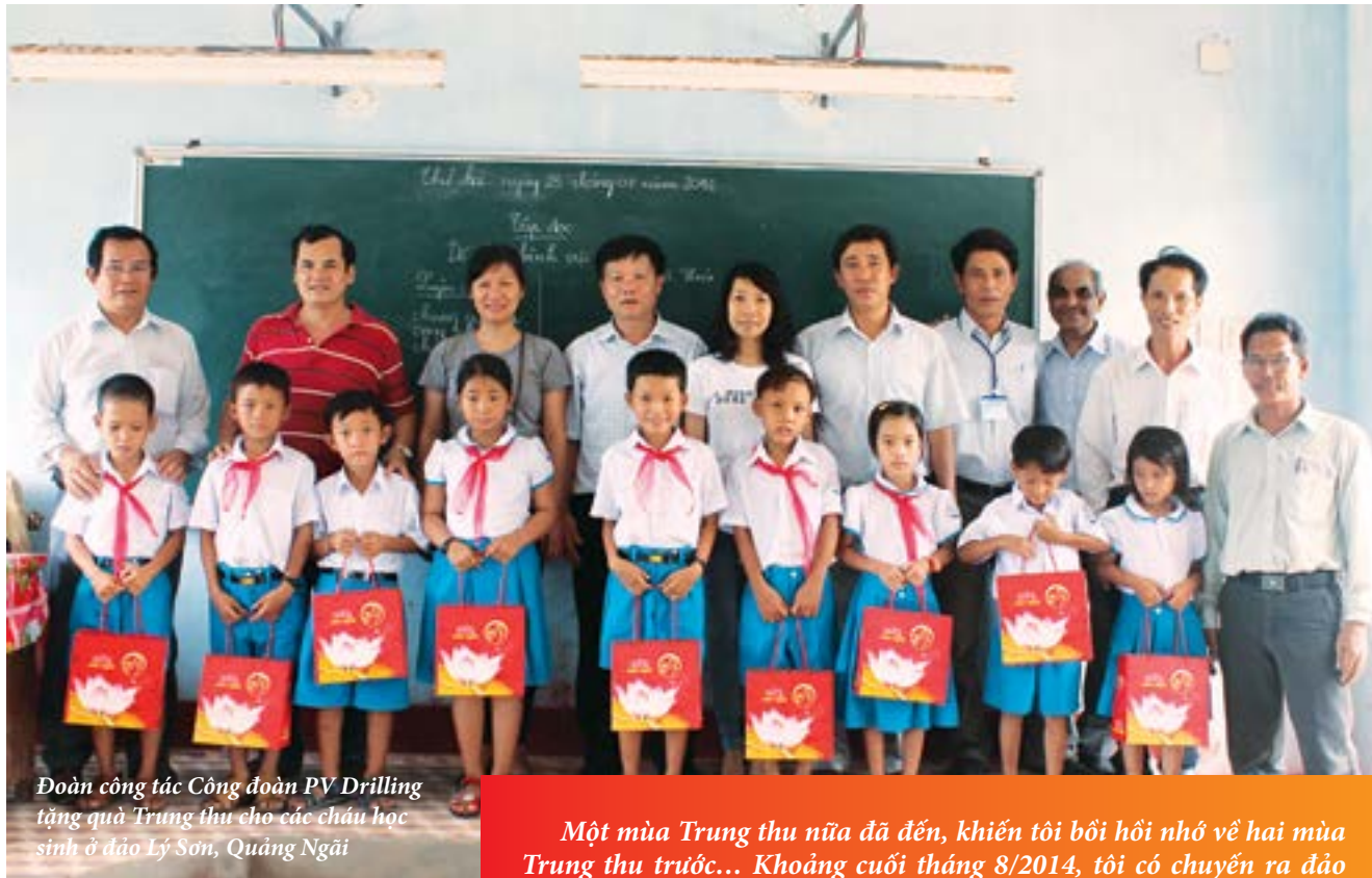
Đoàn công tác Công đoàn PV Drilling tặng quà Trung thu cho các cháu học sinh ở đảo Lý Sơn, Quảng Ngãi

Một mùa Trung thu nữa đã đến, khiến tôi bồi hồi nhớ về hai mùa Trung thu trước... Khoảng cuối tháng 8/2014, tôi có chuyến ra đảo Lý Sơn (Quảng Ngãi) cùng đoàn công tác của Công đoàn PV Drilling để tặng quà trung thu cho các cháu học sinh trên huyện đảo. Năm ấy, đảo Lý Sơn chưa có điện, cứ khoảng 23h là điện chạy bằng máy dầu tắt, cả huyện đảo ngủ sớm và thi thoảng trong những căn nhà nhỏ có ánh đèn dầu. Đó là một trong những chuyến công tác xã hội "Mang hạnh phúc đến những miền xa" của Công đoàn PV Drilling. Và trong bao năm qua, đã có rất nhiều chuyến công tác khác đến mọi miền đất nước, thấp lên những nụ cười hạnh phúc, với những mái trường mới được xây, ngôi nhà mới khang trang, những phần quà dành cho học sinh hiếu học.