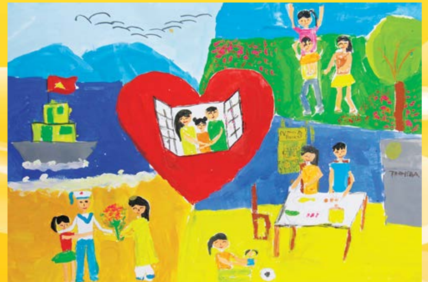
Mái ấm yêu thương cho chúng em (Mai Bảo Nguyên)