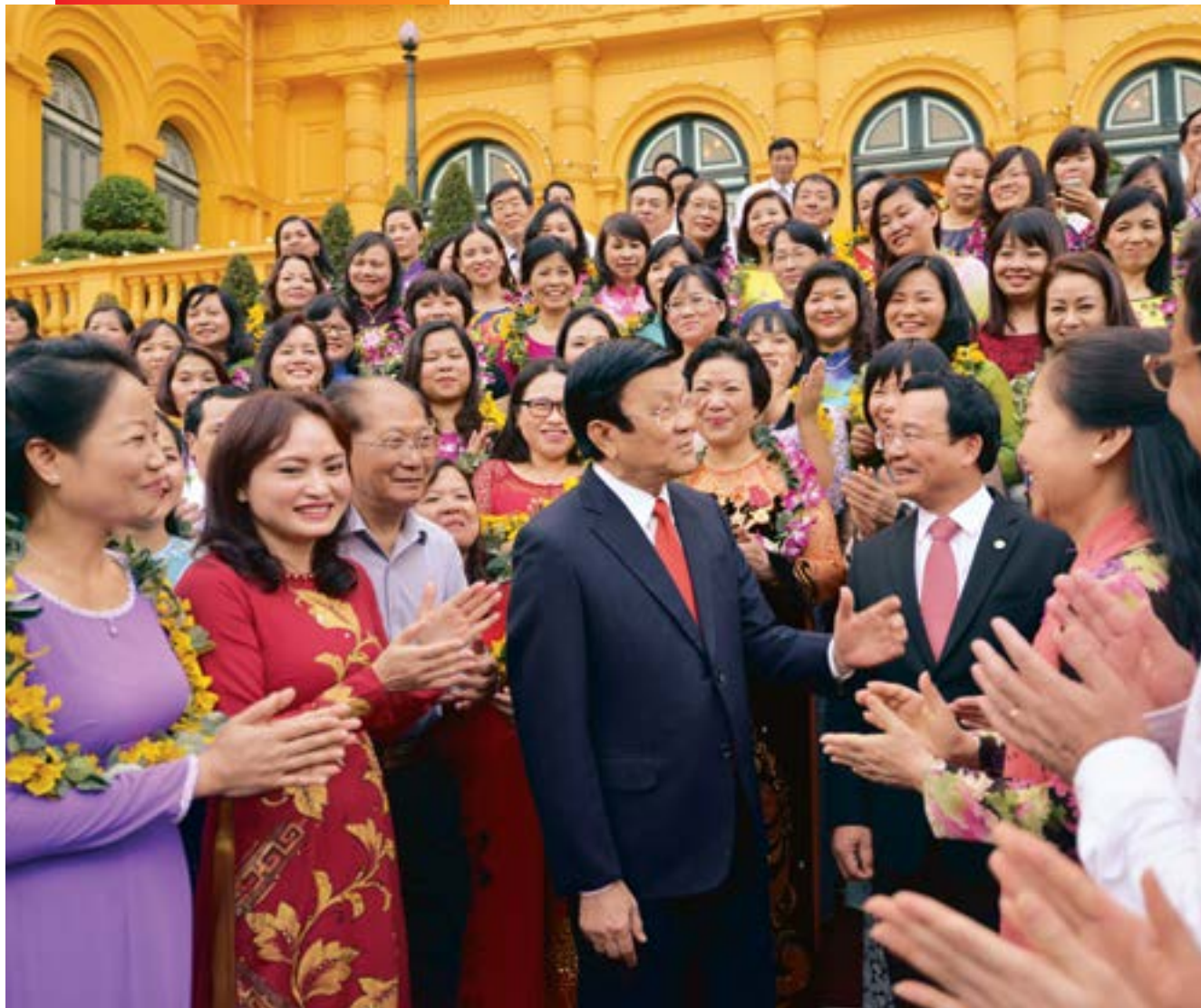
Chủ tịch nước chúc mừng những thành tích xuất sắc của nữ CNVCLĐ Dầu khí

Nhằm triển khai thực hiện Chương trình hành động bình đẳng giới quốc gia về bình đẳng giới (BDG) giai đoạn 2016-2020, PVN đã xây dựng và bắt đầu triển khai Kế hoạch hành động bình đẳng giới giai đoạn 2016-2020.