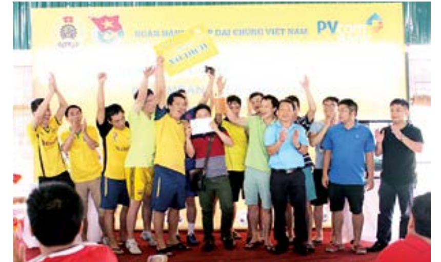
Công nhân thẻ - Vô địch Fair Play PVcomBank League 2016 khu vực Hà Nội

PVcomBank League 2016 năm thứ 6 đã chính thức khép lại với nhiều niềm vui, nhiều điều tốt đẹp còn đọng lại. Mười đội bóng đã xuất sắc đã làm nên một mùa giải thành công, cùng xây dựng đời sống tinh thần phong phú, đa dạng cho công đoàn viên sau những lo toan mưu sinh đời thường, áp lực chỉ tiêu kinh doanh. “Hạnh phúc không phải là đích đến, mà là chặng đường ta cùng nhau đi qua” - PVcomBank League 2016 đơn giản là niềm vui, gắn kết, là anh em một nhà. Chúng ta sẽ cùng chờ đợi PVcomBank League 2017 với phiên bản mới, hấp dẫn hơn mang đậm bản sắc PVcomBank. 🌸