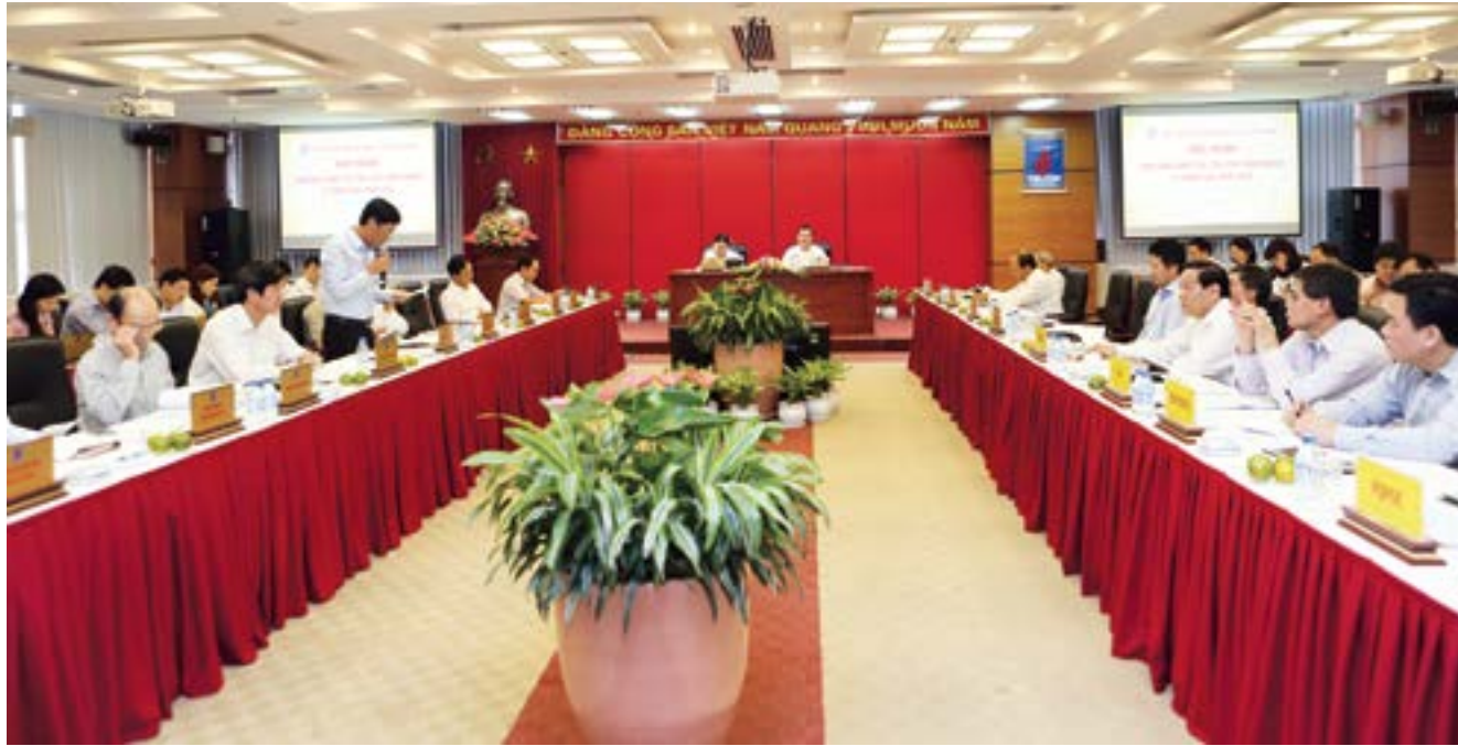
Toàn cảnh hội nghị