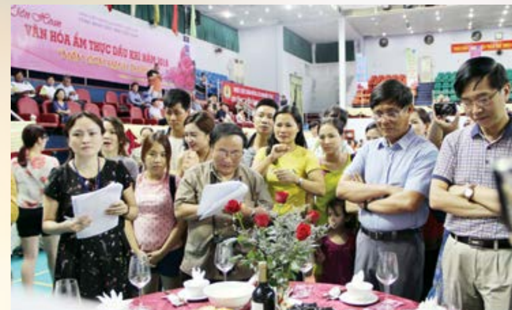
Ban Tổ chức tham quan và bình chọn mâm cơm của các đội

Mặc dù thời tiết oi và nóng, nhưng với tinh thần trách nhiệm cao, bằng tất cả tình cảm của mình, các đội dự thi đã hăng hái trong các phần việc của mình với tinh thần đồng đội rất cao, cẩn mẫn, khéo léo để hoàn thành những món ăn độc đáo về tên gọi, phong phú về thể loại, hấp dẫn sáng tạo trong cách trình bày, khoa học trong cơ cấu dinh dưỡng (như các món “Phượng hoàng ấp trứng”, “Tôm hoàng hậu”, “Kinh ngư quây sóng”, “Lẩu xum vầy”, “Súp mùa thu Hà Nội”, “Bún sợi nhớ sợi thương”, “Ngọt ngào mùa lũ”...). Bên cạnh đó, những người tham gia liên hoan còn có cơ hội chứng kiến tài năng và trình độ ẩm thực của các bạn Nga - những vị khách vô cùng nhiệt tình ngay từ ngày đầu khi nhận được lời mời dự thi. Tham dự cuộc thi năm nay, những người bạn trời Âu này cử cả Trưởng Ban điều hành đội nấu, làm tất cả những món ngon nhất, đặc trưng nhất của 1 mâm cỗ đón tết cổ truyền của người Nga. Và cũng không thể không nhắc tới mâm tiệc của đội thi đến từ LĐLĐ BR-VT đã thể hiện rất sâu sắc tình đoàn kết gắn