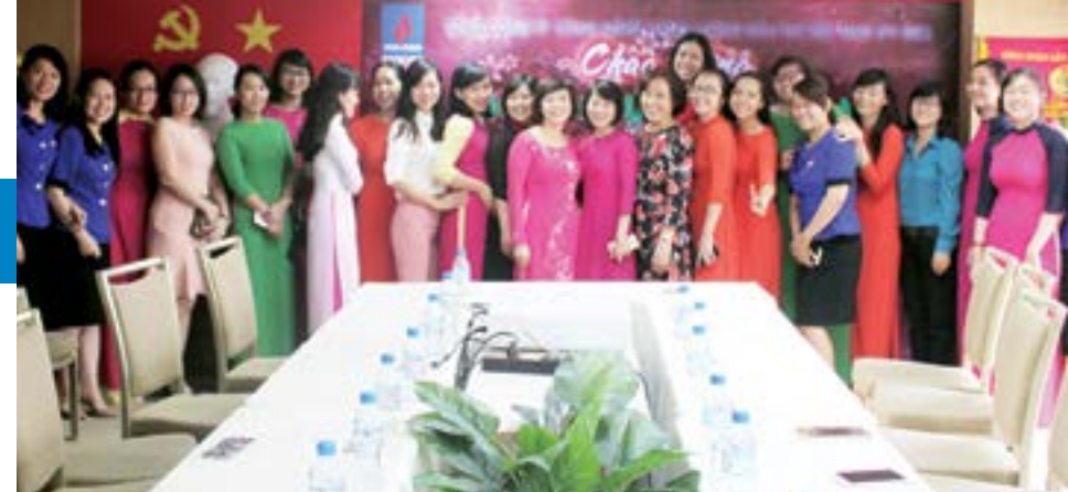
Nữ CBCNV Tổng công ty Công nghệ Năng lượng Dầu khí Việt Nam chụp ảnh lưu niệm

Hòa chung cùng với niềm vui, niềm phấn khởi tự hào trong Ngày Phụ nữ Việt Nam, được sự quan tâm và tạo điều kiện của lãnh đạo Tổng công ty Công nghệ Năng lượng Dầu khí Việt Nam (PV EIC), Ban Nữ công - BCH Công đoàn Tổng công ty PV EIC đã tổ chức buổi gặp mặt nhằm tôn vinh chị em phụ nữ nhân ngày 20/10.