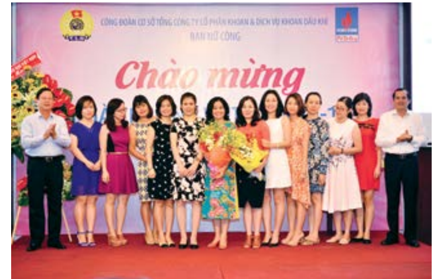
Lãnh đạo tặng hoa

Khép lại chương trình là phần liên hoan ẩm thực “Chợ quê” và rút thăm trúng thưởng. Những món ăn mang đậm chất quê do chính tay chị em ở các đơn vị chuẩn bị đã góp phần mang lại một không khí rất vui nhộn cho buổi gặp mặt. 🌸