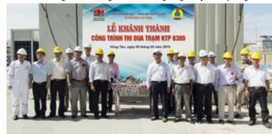
Trao tặng Bằng Lao động sáng tạo cho các cá nhân nhân dịp “Tháng Công nhân 2016”

Có thể nói, sự tham gia nhiệt tình, trách nhiệm và sự hỗ trợ, tạo điều kiện của Công đoàn sẽ tiếp tục là động lực quan trọng để mỗi CBCNV-LĐ Vietsovpetro phát huy tinh thần lao động cần cù, sáng tạo, từng bước vượt qua khó khăn trong bối cảnh hiện nay, phấn đấu hoàn thành và hoàn thành xuất sắc kế hoạch sản xuất kinh doanh của đơn vị năm 2016. 🌸