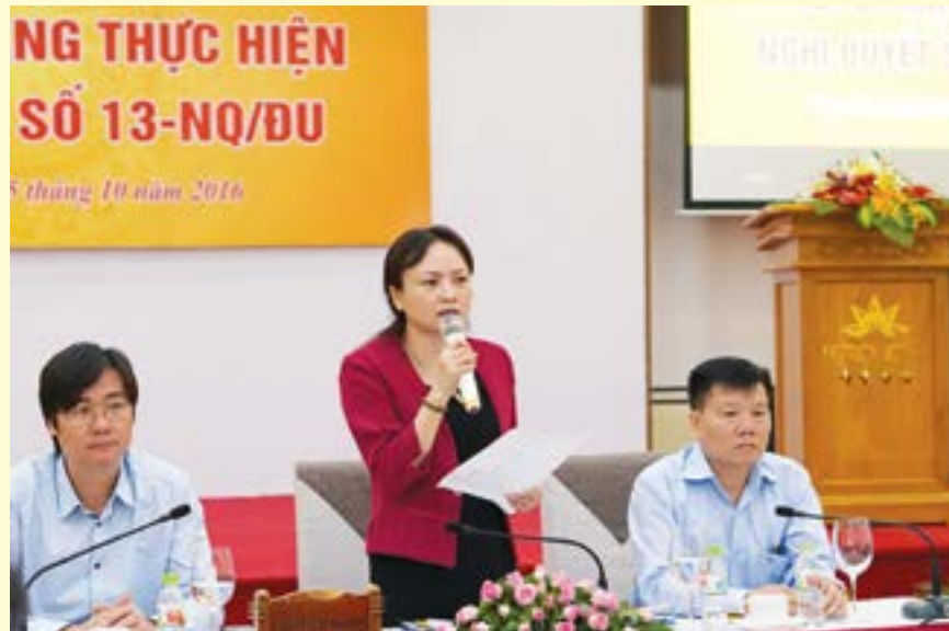
Đoàn chủ tịch điều hành hội nghị

Để góp phần nâng cao hiệu quả các hoạt động sản xuất kinh doanh, củng cố mọi tiềm lực để Tập đoàn phát triển bền vững, có năng lực cạnh tranh tốt hơn và có cơ hội phát triển cao hơn, đảm bảo thực hiện thắng lợi mục tiêu chiến lược phát triển ngành Dầu khí Việt Nam và Chiến lược phát triển Tập đoàn Dầu khí Quốc gia Việt Nam (PVN) đến năm 2025 và tầm nhìn đến năm 2035, Công đoàn Dầu khí Việt Nam đã tăng cường công tác chỉ đạo, ban hành các chương trình, kế hoạch để triển khai thực hiện Nghị quyết số 13-NQ/ĐU của Đảng ủy Tập đoàn đến các công đoàn trực thuộc. Chỉ đạo các cấp công đoàn tổ chức các hoạt động lồng ghép, gắn kết với việc thực hiện các nghị quyết, chương trình hành động, nhiệm vụ công tác, kế hoạch sản xuất kinh doanh của đơn vị. Kết quả có 100% các Công đoàn trực