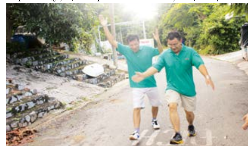
VĐV Thẩm - Viên "vừa đi đường - vừa kể chuyện"