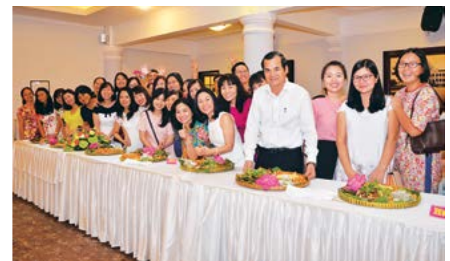
Liên hoan ẩm thực Chợ quê