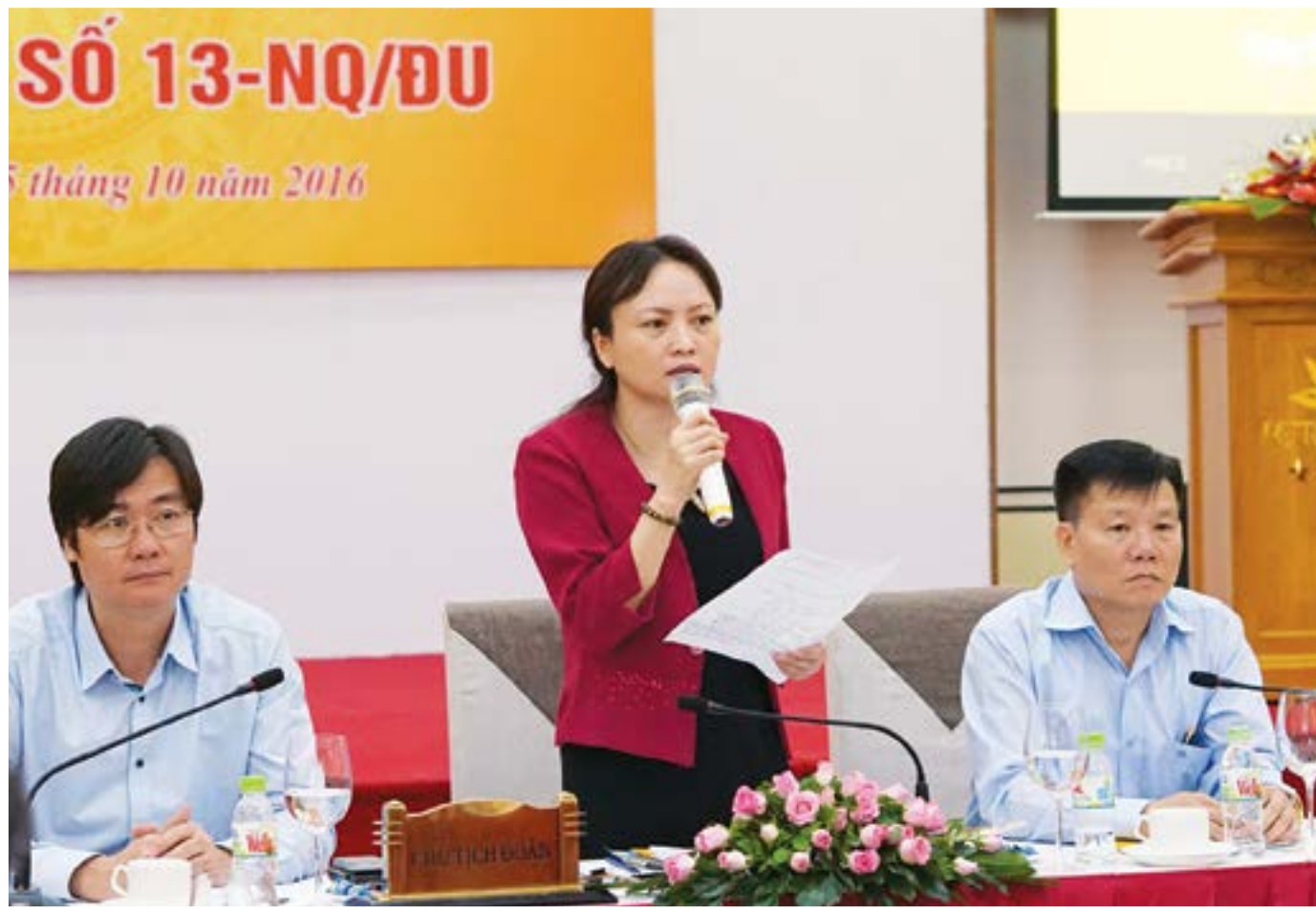
Đoàn Chủ tịch điều hành Hội nghị Sơ kết 9 tháng đầu năm thực hiện Nghị quyết số 13-NQ/ĐU của Đảng ủy Tập đoàn và Tổng kết 5 năm thực hiện Quy chế phối hợp chỉ đạo hoạt động giữa CĐ DKVN với LĐLĐ tỉnh Bà Rịa - Vũng Tàu, năm 2011 - 2016