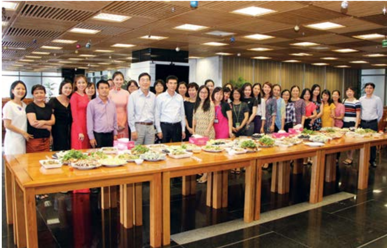
Buổi gặp gỡ nhân Ngày 20/10 tại trụ sở của PV GAS ở Thành phố Hồ Chí Minh