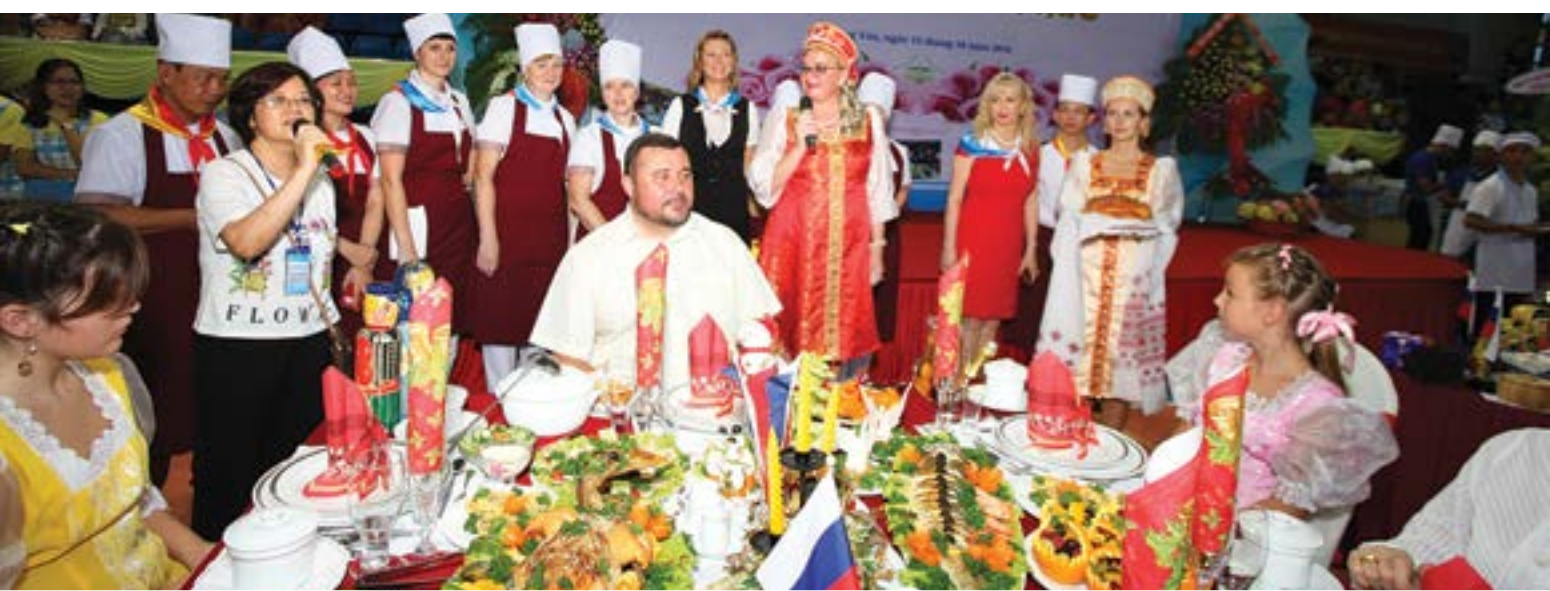
Mâm cơm đón tết cổ truyền của người Nga do Công đoàn Phía Nga tại Vietsovpetro thực hiện