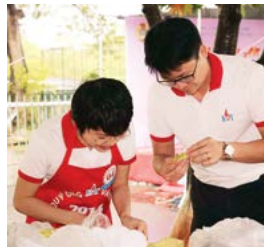
Nam giới PV GAS Vũng Tàu vào bếp nấu ăn

phục vụ các chị em. Cuộc thi được Công đoàn và Đoàn thanh niên KVT phối hợp tổ chức. Sau hơn hai