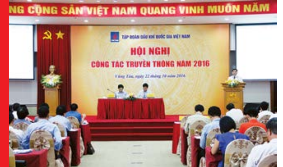
Toàn cảnh hội nghị

Ngày 22/10, Tập đoàn Dầu khí Việt Nam (PVN) tổ chức Hội nghị Công tác truyền thông năm 2016 nhằm thống nhất và nâng cao hơn nữa tính hiệu quả của công tác thông tin tuyên truyền, đề ra phương hướng tuyên truyền tích cực, kịp thời xử lý khi có khủng hoảng truyền thông cũng như tăng cường quảng bá thương hiệu và hình ảnh của ngành Dầu khí trong cộng đồng.