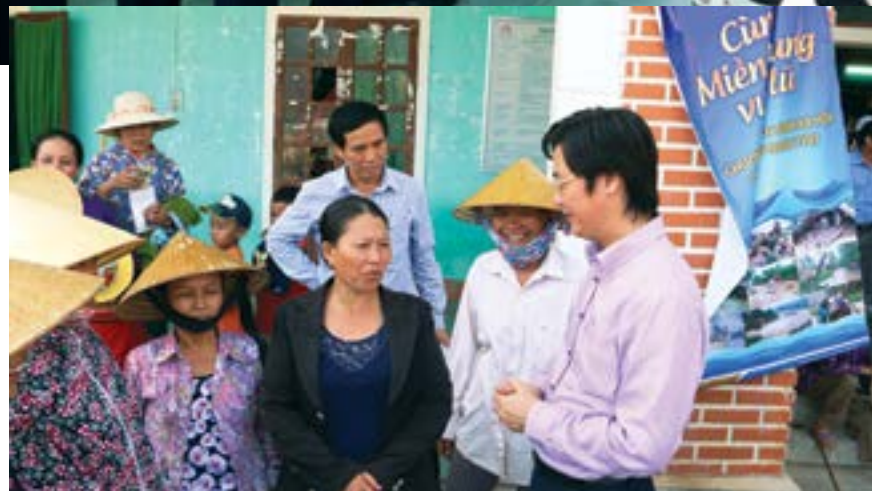
Đoàn công tác CĐ DKVN trao quà, chia sẻ sự mất mát với bà con xã Quảng Trung