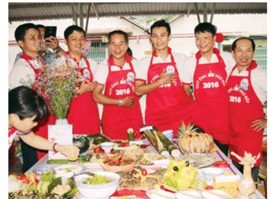
"Quý ông KVT" vào bếp