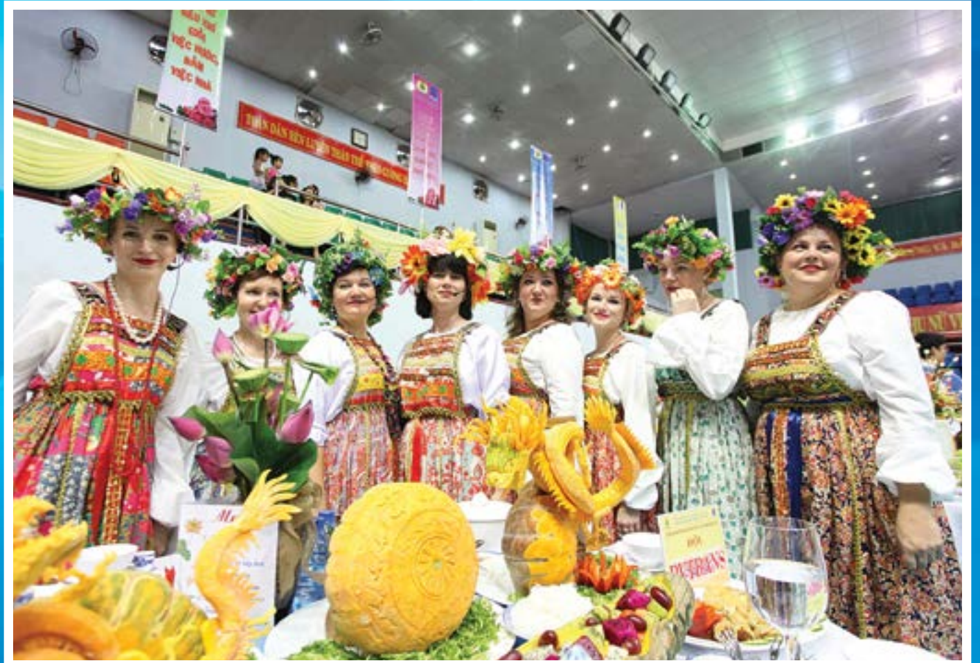
Đội thi Phía Nga - Vietsovpetro trong Liên hoan Văn hóa ẩm thực Dầu khí năm 2016