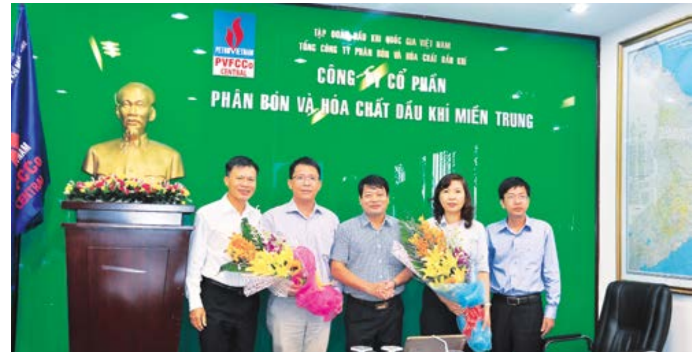
Thường trực Công đoàn PVFCCo tặng hoa chúc mừng các đồng chí mới được bổ sung vào BCH