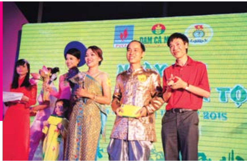
Lễ khởi động Dự án Tái tạo Văn hóa doanh nghiệp tại PVCFC

Thấu hiểu được nỗi vất vả của những NLĐ phải làm việc nơi vùng đất cực Nam xa xôi của Tổ quốc, ngay từ những ngày đầu thành lập, BCH CĐ PVCFC đã đặc biệt quan tâm đến việc trang bị tốt nhất có thể các tiện nghi làm việc cho NLĐ. Ngày hôm nay, PVCFC có thể tự hào là một đơn vị luôn thực hiện tốt các chế độ phúc lợi cho NLĐ về môi trường làm