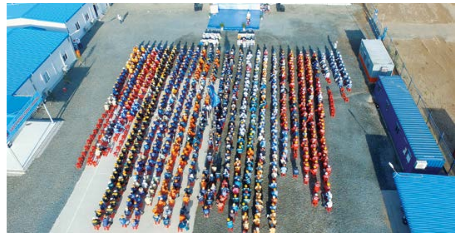
Phát động thi đua tại Dự án Nhà máy Xử lý khí Cà Mau 3

nhau ký "Bản giao ước thi đua chào mừng 55 Ngày Truyền thống ngành Dầu khí và 25 năm Ngày Thành lập Công đoàn Dầu khí Việt Nam" thể hiện quyết tâm một lòng cùng nhau thực hiện thành công dự án không chỉ ở hạng mục đăng ký thi đua mà ở tất cả các hạng mục khác, không chỉ trong thời gian phát động thi đua mà xuyên suốt thời gian 6 tháng hướng đến hoàn thiện bản giao dự án. 🌸