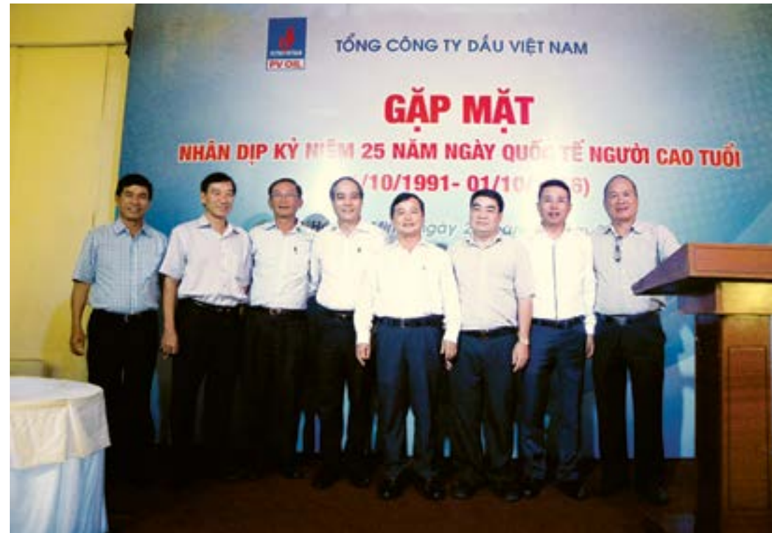
Ban Lãnh đạo PV OIL chụp hình lưu niệm với cán bộ hưu trí