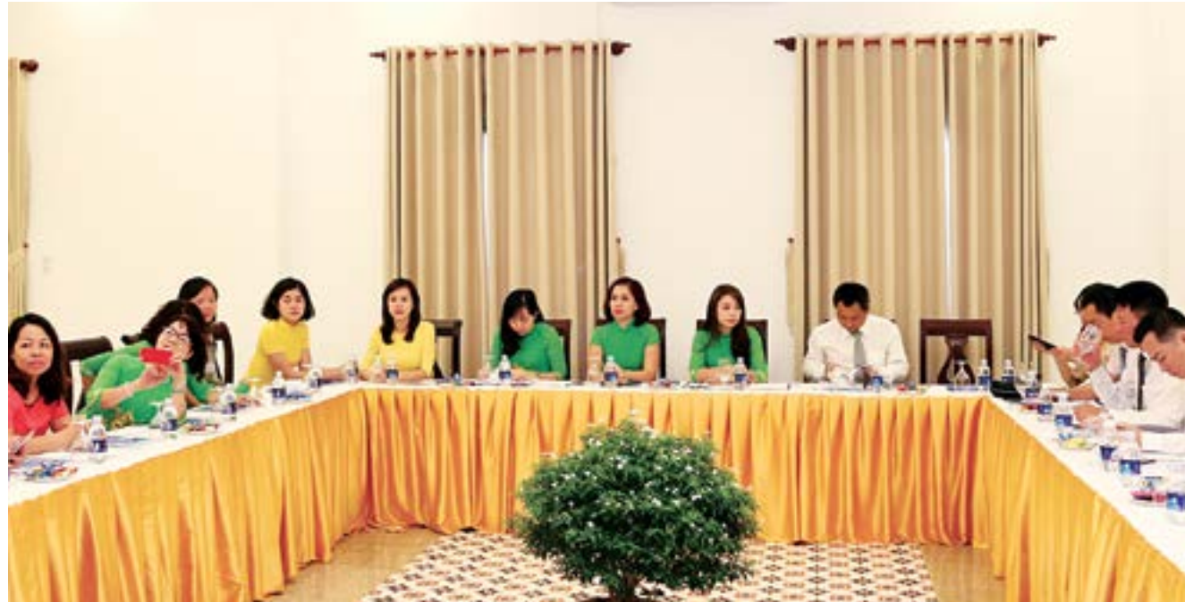
Kỳ họp thứ X, nhiệm kỳ 2012-2017