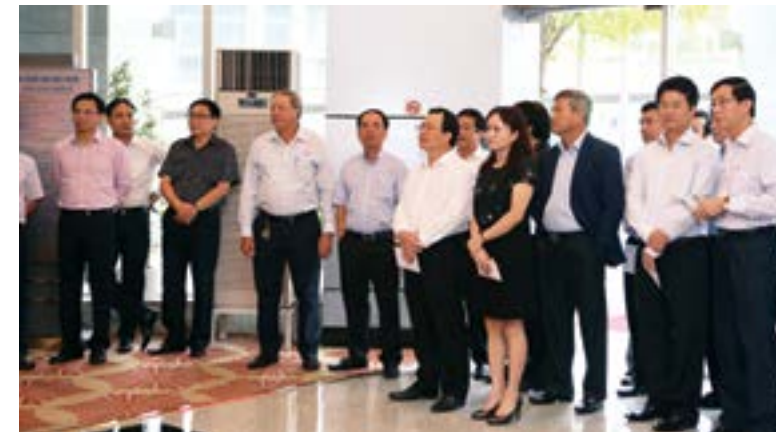
CBCNV - LĐ Tập đoàn tham gia quyền góp