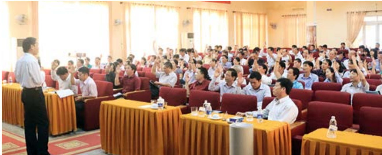
Đại biểu và cán bộ công đoàn các cấp tham gia khóa học