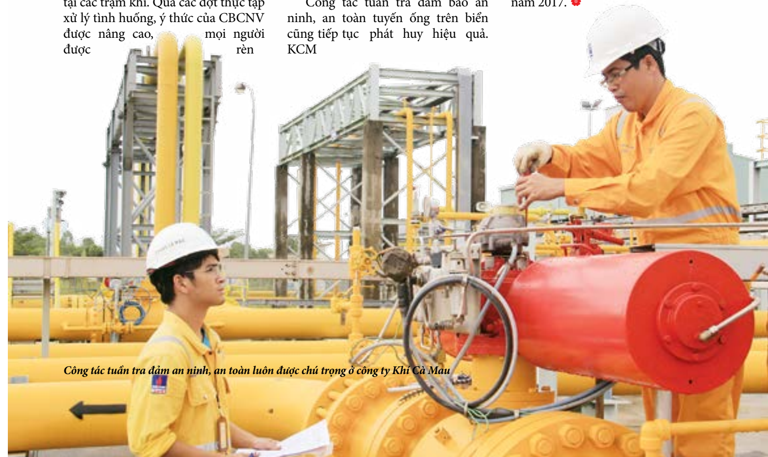
Công tác tuần tra đảm bảo an ninh, an toàn luôn được chú trọng ở công ty Khí Cà Mau

Trong thời gian tới, nhằm phát huy những kết quả đạt được, KCM tiếp tục duy trì công tác an ninh, điều độ và phối hợp vận hành, đảm bảo cấp khí an toàn, liên tục cho các hộ tiêu thụ, đảm bảo hoàn thành mục tiêu được PV GAS giao; Tiếp tục công tác giám sát, đảm bảo an toàn tuyệt đối cho con người, tài sản, môi trường, đặc biệt là các đầu việc liên quan đến công tác thi công, đấu nối với Nhà máy Xử lý Khí Cà Mau; Triển khai chương trình nâng cao văn hóa an toàn trong toàn công ty; Hoàn thành xây dựng bộ khung hệ thống quản lý để sẵn sàng tiếp nhận Nhà máy Xử lý Khí Cà Mau khi đi vào vận hành chính thức vào năm 2017. 🌸