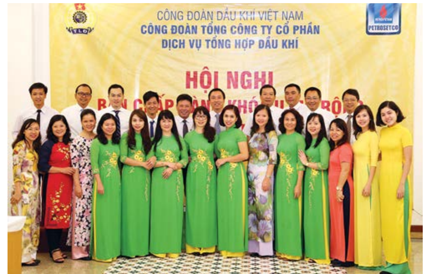
Ban Chấp hành nhiệm kỳ 2012 - 2017 chụp ảnh lưu niệm

Hội nghị BCH mở rộng kỳ họp thứ X, nhiệm kỳ 2012-2017 Công đoàn PETROSETCO nhận được sự nhất trí cao của các đại biểu và đã kết thúc thành công với Nghị quyết được thông qua vào lúc 11h30 cùng ngày. 🌸