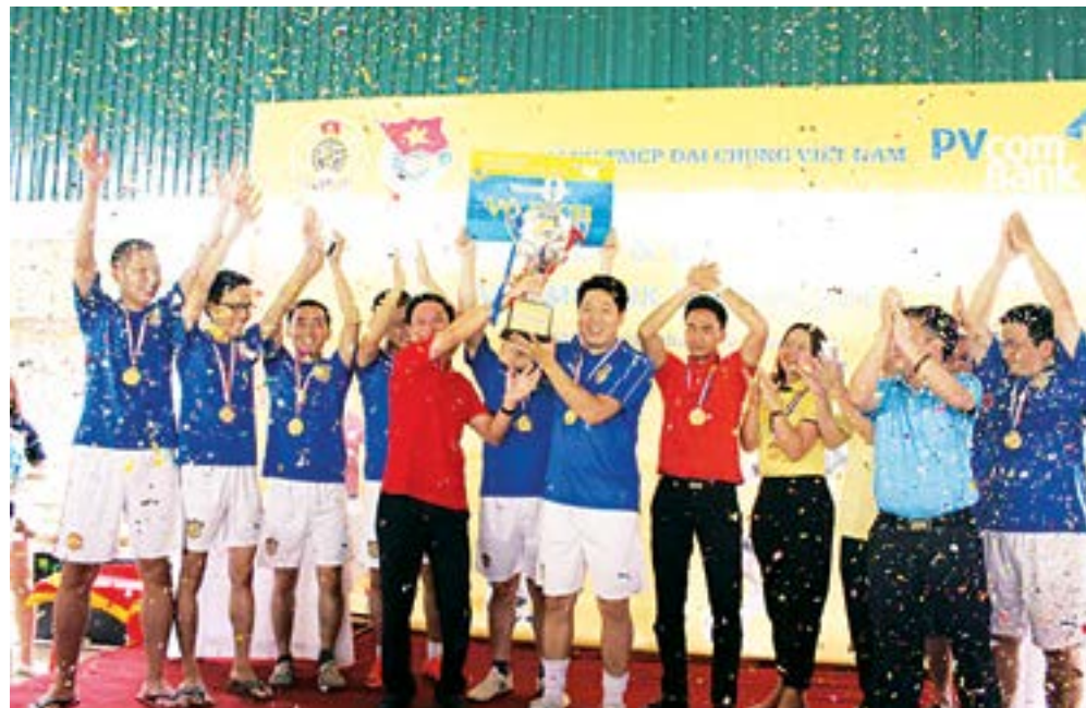
PVCB Hà Nội - Vô địch thành tích PVcomBank League 2016 khu vực Hà Nội