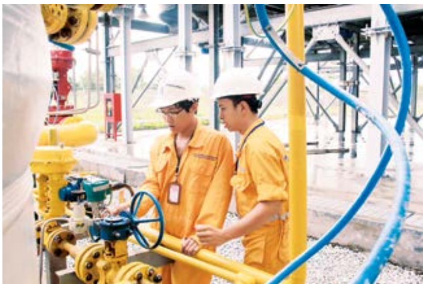
Các công nhân Công ty Khí Cà Mau luôn đảm bảo an toàn trong vận hành công trình khí

và trong 6 tháng đầu năm 2016, công ty có 2 near-miss. Các vụ việc này đều được kịp thời xử lý, không gây ảnh hưởng tới con người, tài sản, môi trường, không gây ảnh hưởng tới quá trình cấp khí cho các hộ tiêu thụ. Mặc dù vậy, tất cả các vụ việc đều được công ty tiến hành điều tra, xác định nguyên nhân gốc và đưa ra các biện pháp xử lý khẩn cấp cũng như lâu dài. Sau khi điều tra, các bộ phận thực hiện phổ biến cho CBCNV liên quan nhằm rút kinh nghiệm và ngăn ngừa sự việc lặp lại.