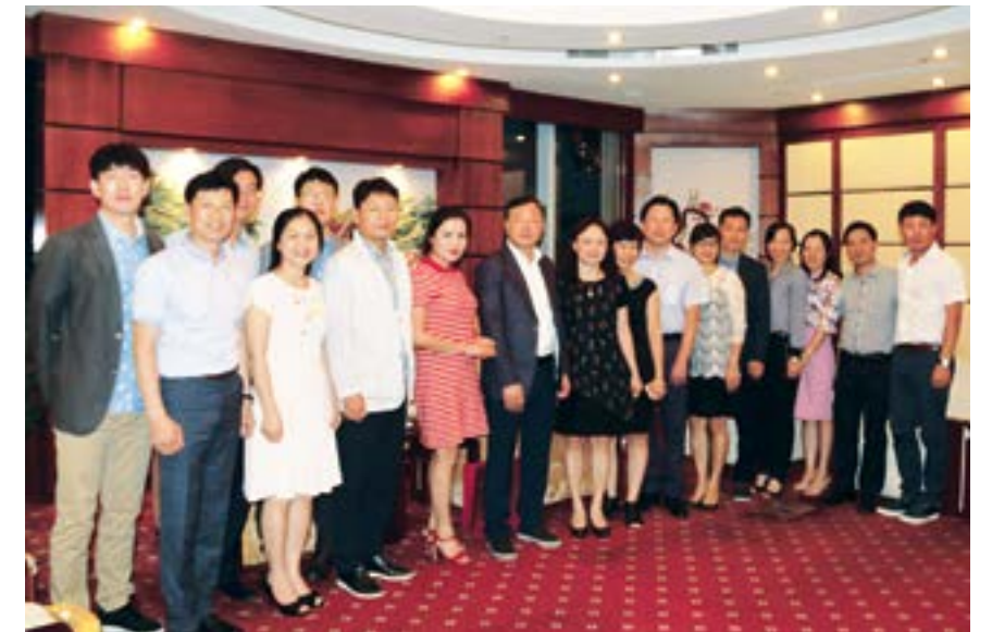
Hai đoàn chụp ảnh lưu niệm

Tiếp đó, đoàn công tác sẽ có buổi tham dự Liên hoan âm thực CĐ DKVN tại thành phố Vũng Tàu vào ngày 15/10/2016. 🌸