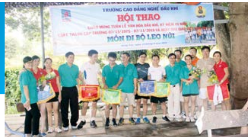
Các VĐV đoạt giải

Cuối tháng 9 vừa qua, tại chân núi Lớn, thành phố Vũng Tàu, Công đoàn Trường Cao đẳng nghề Dầu khí đã tổ chức hội thi đi bộ, mở đầu Hội thao hưởng ứng Tuần lễ Văn hóa Dầu khí, chào mừng 41 năm Ngày Thành lập trường 07/11/1975 - 07/11/2016 và Kỷ niệm Ngày Nhà giáo Việt Nam 20/11.