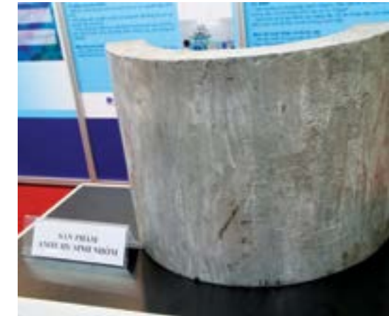
Sản phẩm "Anode hy sinh hợp kim nhôm" do Trung tâm Ứng dụng và Chuyển giao Công nghệ (CTAT) thuộc VPI nghiên cứu chế tạo

Trong quý IV/2016, VPI tập trung triển khai các giải pháp nhằm đảm bảo chất lượng, tiến độ các đề tài/nhiệm vụ/hợp đồng nghiên cứu khoa học công nghệ; đẩy mạnh công tác đăng ký bản quyền, sáng chế, giải pháp hữu ích. Đồng thời, VPI tăng cường công tác tư vấn lập, thẩm định các dự án dầu khí; xây dựng hệ thống quản trị doanh nghiệp; quản lý khai thác, phân chia sản phẩm;