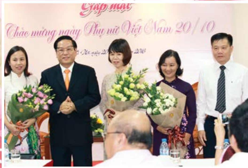
CBNV nữ tiêu biểu của PVEP