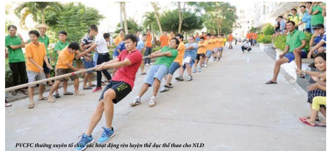
PVCFC thường xuyên tổ chức các hoạt động rèn luyện thể dục thể thao cho NLĐ

Phát huy những thành tựu đã đạt được, thời gian tới, BCH CĐ PVCFC cùng toàn thể NLĐ sẽ tiếp tục phát huy những truyền thống, đoàn kết, đồng tâm vượt qua khó khăn thách thức để thực hiện thắng lợi nhiệm vụ chính trị, chuyên môn và nhiệm vụ công tác; góp phần xây dựng tổ chức Công đoàn, xây dựng Công ty Cổ phần Phân bón Dầu khí Cà Mau ngày càng phát triển vững mạnh. 🌸