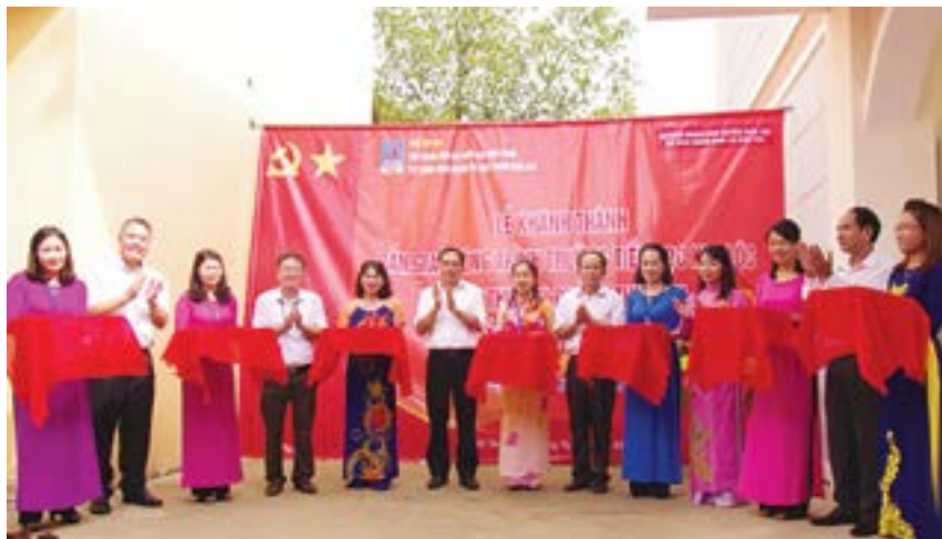
Lễ cắt băng khánh thành và bàn giao Trường Tiểu học xã Kim Lộc