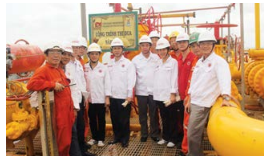
Lễ khánh thành và gắn biển Công trình thi đua chào mừng “Tháng Công nhân năm 2015”

Có được kết quả trên trước hết là bởi có sự chỉ đạo sát sao của Đảng ủy và Ban Tổng giám đốc, cùng những hoạt động tích cực của Hội đồng Sáng kiến - Sáng chế Vietsovpetro cũng như Hội đồng Sáng kiến - Sáng chế các đơn vị thành viên và sự động viên, hỗ trợ tích cực của tổ chức Công đoàn phía Việt Nam trong Vietsovpetro. Chính sự động viên và hỗ trợ bằng vật chất cũng như tinh thần từ phía công đoàn đã tạo động lực to lớn, khơi nguồn ý tưởng và phát huy tính sáng tạo cho mỗi cá nhân và đơn vị mạnh dạn đăng ký sáng kiến. Cụ thể, đối với mỗi một giải pháp đăng ký sẽ được công đoàn hỗ trợ 1 triệu đồng, đối với mỗi sáng kiến được công nhận, công đoàn