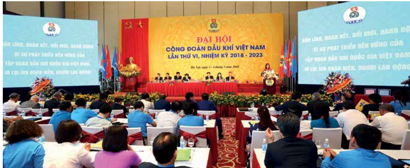
Toàn cảnh ĐH CĐ DKVN lần thứ VI

“làn sóng đổi mới” từ cách mạng công nghiệp 4.0 hay những hiệp định thương mại mà Việt Nam tham gia, ngay từ năm 2017, CĐ DKVN đã tổ chức nhiều buổi tọa đàm, hội thảo... nhằm định hướng hoạt động công đoàn trong thời kỳ mới đầy thách thức, giúp các công đoàn cơ sở có “kim chỉ nam” để triển khai các hoạt động linh hoạt, phù hợp với tình hình mới và thực tế đơn vị. Và những hoạt động này thực sự đã mang lại hiệu quả, khi có rất ít trường hợp khiếu kiện vượt cấp, hầu như không có trường hợp sa thải do tình hình kinh tế khó khăn... các đơn vị đều phối hợp chặt chẽ với tổ chức công đoàn nhằm đảm bảo việc làm, thu nhập của người lao động tùy thuộc tình hình cụ thể của đơn vị, điều này khiến công đoàn viên, người lao động thêm tin tưởng, thông cảm, gắn bó và cống hiến cho đơn vị.