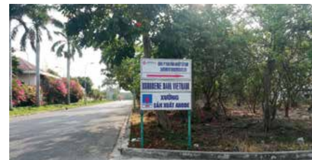
Xưởng sản xuất anode hy sinh của VPI tại Khu công nghiệp Đông Xuyên, Thành phố Vũng Tàu

Về định hướng nghiên cứu và phát triển khoa học