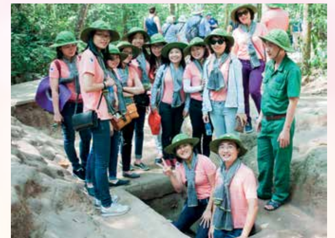
Ban Nữ công, Ban Quản lý Khí Đông Nam bộ tổ chức chuyến về nguồn cho cán bộ nữ tại Khu di tích lịch sử Địa đạo Củ Chi - TP.HCM

Cũng trong dịp này, Công đoàn cơ sở Công ty CP Phân bón và Hóa chất Dầu khí Tây Nam Bộ đã tổ chức buổi họp mặt và tọa đàm với chủ đề "Tâm lý học và triết lý theo Yoga - 05 nguyên nhân gây stress và cách chữa lành theo Yoga".