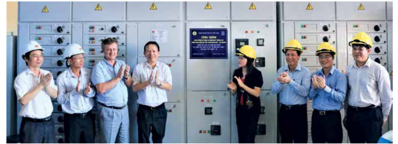
Lễ gắn biển công trình thi đua chào mừng 25 năm Ngày thành lập Công đoàn Dầu khí Việt Nam

nhiều hình thức đổi mới khác nhau như đăng tải các bài viết trên trang tin công đoàn trong website nội bộ của Vietsovpetro; trang fanpage Công đoàn Vietsovpetro trên mạng xã hội Facebook; thông qua các hội nghị, đại hội công đoàn và đặc biệt là thông qua các buổi đối thoại định kỳ với sự tham gia đầy đủ của BCH Công đoàn và đại diện của NLĐ các đơn vị... Đến nay, tuyệt đại đa số người lao động đã ổn định tư tưởng, yên tâm công tác, đã thấu hiểu, chia sẻ và ủng hộ các chính sách của đơn vị.