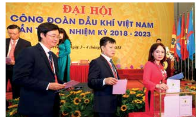
Đại biểu bầu BCH CĐ DKVN khóa VI

Để có được kết quả đáng khích lệ ấy, là nhờ sự nỗ lực hết mình, trách nhiệm, tâm huyết của tập thể cán bộ công đoàn các cấp và cán bộ chuyên trách thuộc các phòng/ban chuyên môn của CĐ DKVN. Từ xây dựng văn bản, quy chế, đến hỗ trợ nhân lực, vật lực giúp các công đoàn cơ sở hoàn thành công tác tổ chức ĐH Công đoàn, bầu ra BCH khóa mới có tính kế thừa, đảm bảo yêu cầu về chất