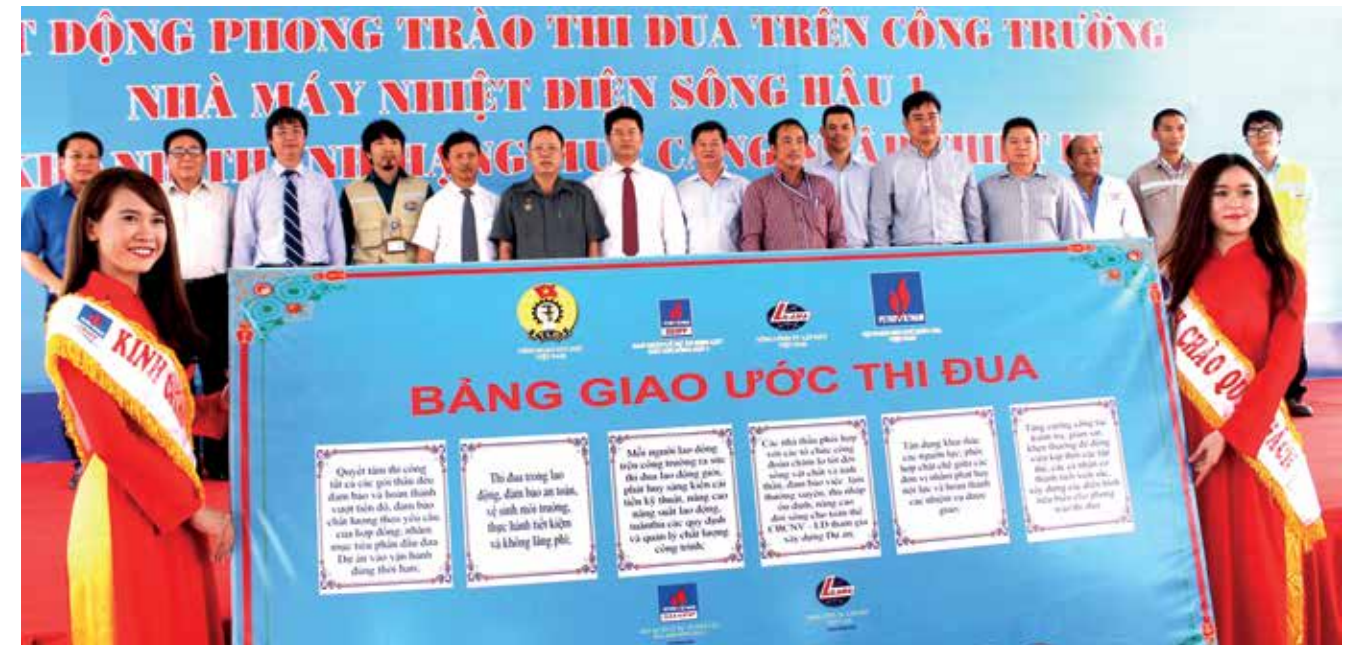
Lễ ký kết giao ước thi đua trên công trường Sông Hậu 1

Đẩy mạnh phong trào thi đua trên các công trình trọng điểm là một trong những đặc thù của ngành Dầu khí. Ngành Dầu khí đảm trách nhiều công trình trọng điểm trên cả nước. Chính vì vậy, công tác đẩy mạnh thi đua trên các công trình trọng điểm được CĐ DKVN cùng các cấp công đoàn trong toàn Tập đoàn đã triển khai hết sức có hiệu quả. Trong 5 năm qua, CĐ DKVN đã phối hợp phát động phong trào thi đua trên 50 công trình/dự án của ngành, trong đó tiêu biểu là các dự án: Nhà máy Lọc dầu Dung Quất; Nhà máy Nhiệt điện Vũng Áng 1; Nhà máy Nhiệt điện Thái Bình 2; Biển Đông 1; Nạo vét lần đầu các công trình biển Nhà máy Lọc hóa dầu Nghi Sơn... và trên 30 công trình/dự án do công đoàn các cấp tổ chức phát động đã mang lại những kết quả thiết thực nhất. CĐ DKVN đã phối hợp với các đơn vị có công trình/dự án để thành lập các "Ban chỉ đạo