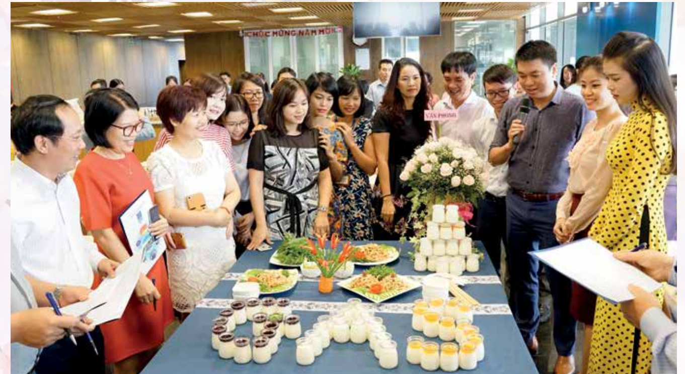
Các đội thi trong cuộc thi Món ngon 8/3

Bên cạnh các hoạt động tôn vinh phụ nữ, công tác từ thiện, an sinh xã hội được Công đoàn và Ban Nữ công, Đoàn Thanh niên DVK triển khai với nhiều nội dung: tặng quà cho 40 hộ dân nghèo ở phường Thắng Nhì và Rạch Dừa (Vũng Tàu) với trị giá 200 nghìn đồng/phần; tặng quà cho Hội Người mù tỉnh BR-VT với tổng trị giá 5 triệu đồng; thăm hỏi cán bộ nữ công PV GAS bị bệnh, thăm hỏi và quyên góp từ thiện cho trường hợp kỹ sư DVK có