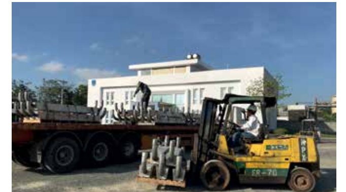
VPI bàn giao 85 tấn anode cho Vietsovpetro sử dụng để bảo vệ chống ăn mòn cho chân đế giàn CTC1, mỏ Cá Tầm