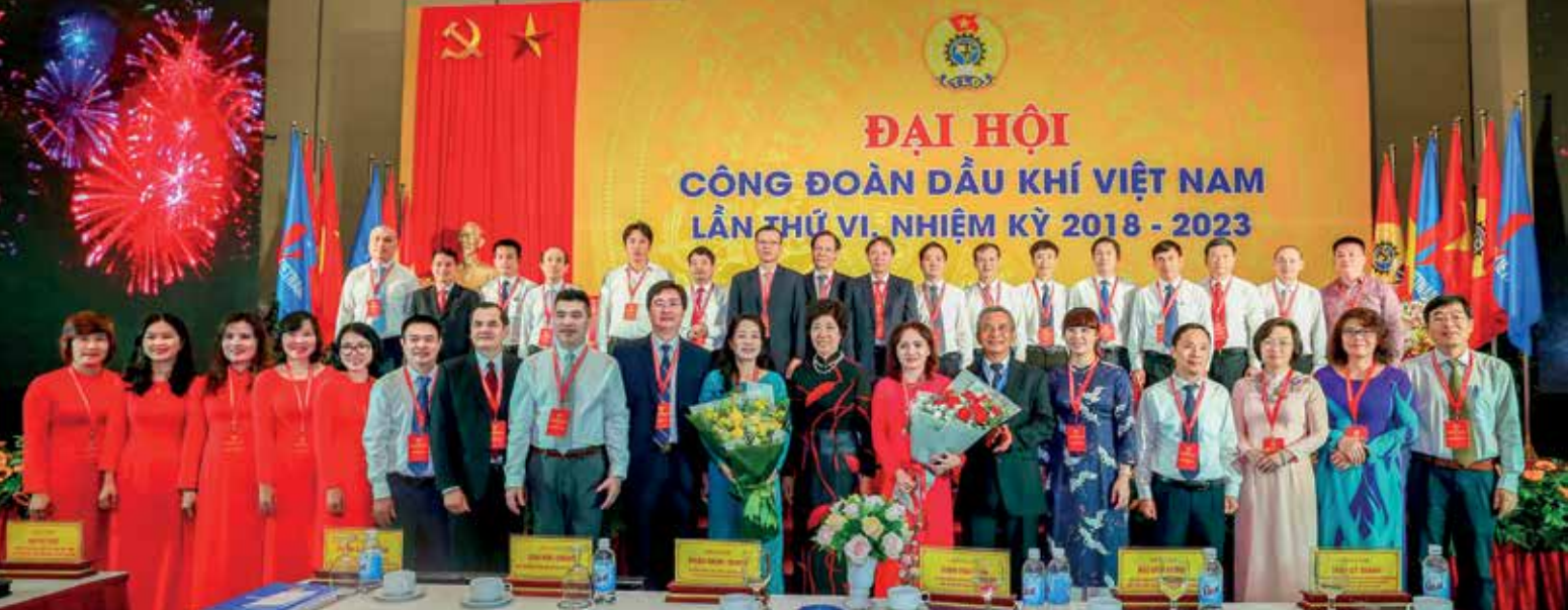
Ban Chấp hành CĐ DKVN khóa VI ra mắt Đại hội