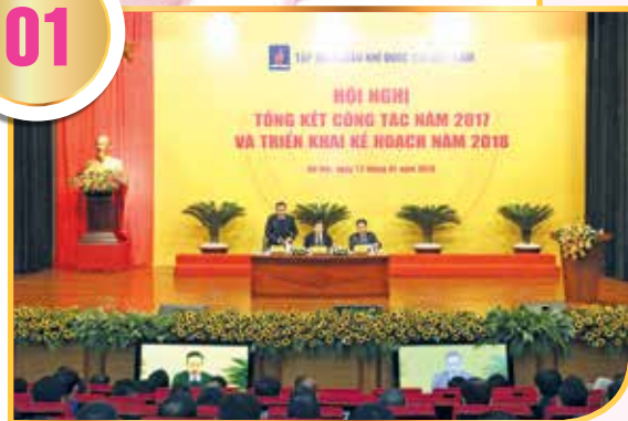
Toàn cảnh Hội nghị Tổng kết sản xuất kinh doanh năm 2017, triển khai nhiệm vụ năm 2018 của Tập đoàn Dầu khí Việt Nam

Trong bối cảnh kinh tế thế giới có nhiều biến động, thương mại sụt giảm mạnh, tăng trưởng toàn cầu thấp, giá dầu thô suy giảm, tình hình Biển Đông phức tạp, công tác tìm kiếm thăm dò khai thác dầu khí, các dự án lọc hóa dầu, nhiệt điện than gặp nhiều khó khăn, nhưng Thường trực, Ban Thường vụ, Ban Chấp Công đoàn Dầu khí Việt Nam (CD DKVN) đã phát huy trí tuệ tập thể, tinh thần đoàn kết nội bộ, đổi mới trong công tác quản lý, năng động, sáng tạo chỉ đạo các sự kiện, động viên gần 60 nghìn đoàn viên công đoàn và người lao động (NLĐ) quyết tâm vượt qua thách thức, nỗ lực phấn đấu hoàn thành kế hoạch sản xuất kinh doanh của Tập đoàn giai đoạn từ 2013 - 2017 với tổng doanh thu hơn 3.019 nghìn tỷ đồng, nộp ngân sách nhà nước 676,3 nghìn tỷ đồng; hằng năm ngành Dầu khí đóng góp cho ngân sách quốc gia khoảng 20% tổng thu ngân sách nhà nước, góp phần to lớn vào sự phát triển bền vững của Tập đoàn Dầu khí Quốc gia Việt Nam.