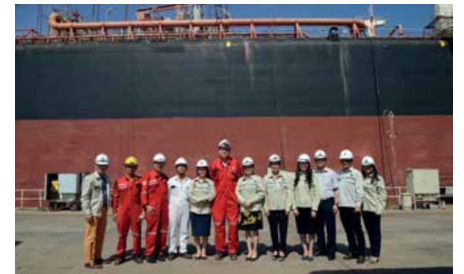
Đoàn chụp lưu niệm với các cán bộ, chuyên gia và công nhân tại công trường