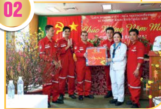
Tặng quà tết cho người lao động tại giàn khoan 2018

Thực hiện tốt công tác chăm lo đời sống, đại diện, bảo vệ quyền, lợi ích hợp pháp, chính đáng của đoàn viên, NLĐ. Hằng năm, Tập đoàn và CD DKVN luôn chăm lo Tết cho đoàn viên, NLĐ, chỉ đạo các cấp công đoàn chủ động phối hợp với người sử dụng lao động xây dựng kế hoạch tổ chức chăm lo tết với nhiều hoạt động ý nghĩa, phong phú, thiết thực: Hàng nghìn NLĐ khó khăn, thu nhập thấp, lao động thuộc diện chính sách được CD DKVN, Tập đoàn DKVN hỗ trợ tặng quà Tết Sum vầy. Cùng với việc thăm hỏi, tặng quà trong dịp Tết Nguyên đán, hầu hết các đơn vị thành viên đều chi lương bổ sung để thưởng cho NLĐ với mức bình quân khoảng 1 tháng lương (10 triệu đồng/người). Tổng số tiền chăm lo Tết giai đoạn 2013 - 2018 khoảng 217,74 tỷ đồng (Năm 2014: 15 tỷ đồng; năm 2015: 21,8 tỷ đồng; năm 2016: 22,24 tỷ đồng; năm 2017: 22,7 tỷ đồng; năm 2018: 46 tỷ đồng).