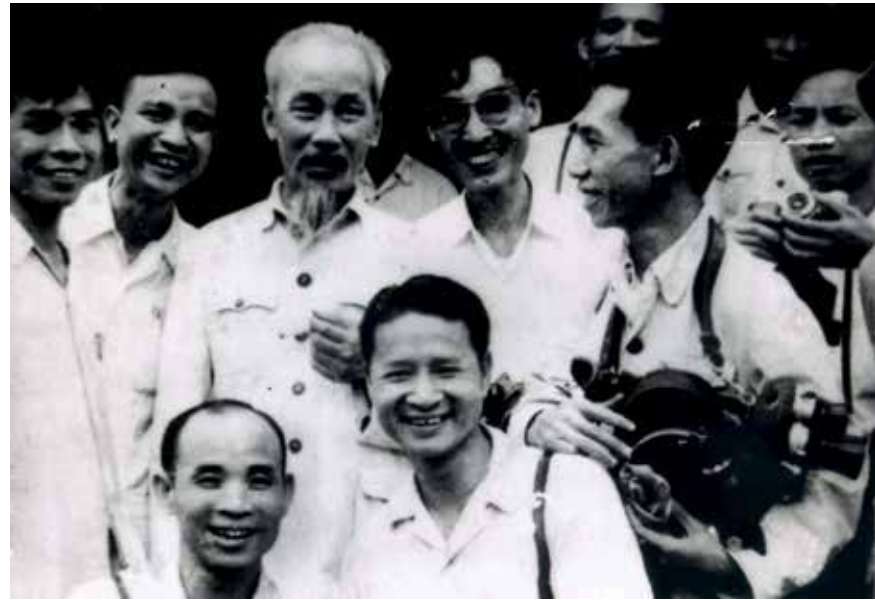
Bác Hồ thăm và nói chuyện với các nhà báo năm 1960

Chủ tịch Hồ Chí Minh - lãnh tụ vĩ đại, một danh nhân văn hóa, Người còn là nhà báo tài ba, uyên bác và có tay nghề xuất sắc. Bác sử dụng ngòi bút tinh luyện, xuất chúng của mình như một vũ khí sắc bén, trở thành “đòn xoay chế độ”, và theo Bác “cán bộ báo chí cũng là chiến sĩ cách mạng. Cây bút, trang giấy là vũ khí sắc bén của họ”.