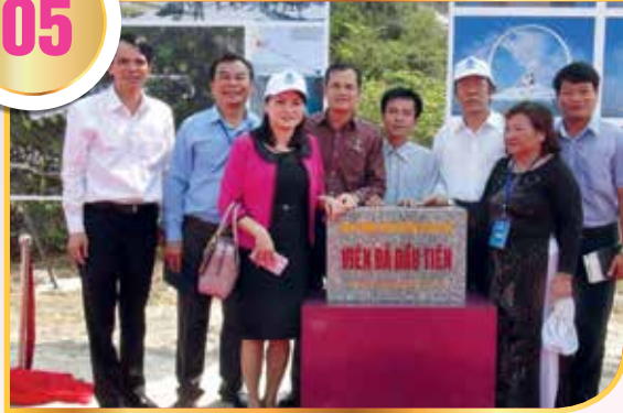
Công đoàn Dầu khí Việt Nam góp đá xây dựng Khu Tưởng niệm chiến sĩ Gạc Ma

CĐ DKVN và công đoàn các cấp đã tích cực phối hợp với Tập đoàn Dầu khí Việt Nam triển khai tích cực chương trình an sinh xã hội trong và ngoài ngành Dầu khí, tăng cường tuyên truyền để bồi đắp và khơi dậy tinh thần tương thân, tương ái, nghĩa tình của NLĐ Dầu khí đối với cộng đồng xã hội: Ủng hộ đồng bào bị bão lụt; trao tặng quà các đối tượng chính sách; thăm hỏi các gia đình thương binh liệt sĩ, hỗ trợ cho các trung tâm thương bệnh binh nặng; ủng hộ trẻ em tàn tật, người già, người nghèo vùng sâu, vùng xa; ủng hộ Quỹ Tấm lòng Vàng do Tổng Liên đoàn phát động với số tiền gần 30 tỷ đồng; hỗ trợ cho CNLĐ khó khăn, bệnh hiểm nghèo, tai nạn lao động, bệnh nghề nghiệp hơn 13 tỷ đồng; hỗ trợ Chương trình hướng về biển đảo, xây dựng Khu Tưởng niệm chiến sĩ Trường Sa, Khu Tưởng niệm nghĩa sĩ Gạc Ma, xây dựng bệnh xá cho huyện đảo Trường Sa... với tổng số tiền gần 28 tỷ đồng.