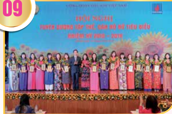
Hội nghị Tuyên dương Tập thể, cá nhân Nữ công xuất sắc nhiệm kỳ V (2013 - 2018)

Đẩy mạnh công tác nữ công, đáp ứng nhu cầu phát triển không ngừng của đội ngũ nữ CNLĐ Dầu khí. Chỉ đạo các công đoàn trực thuộc tích cực nắm bắt tình hình việc làm, thu nhập, đời sống, nguyện vọng của nữ CNLĐ. Tham gia ý kiến đưa vào TULĐTT một số nội dung có lợi hơn cho lao động nữ so với luật định như: chế độ hỗ trợ nữ trong thời gian nghỉ sinh con; nữ và chồng con của nữ LĐ ốm đau hoạn nạn; tổ chức khám bệnh thêm 1 lần chuyên khoa so với nam giới; hỗ trợ nghỉ mát; chăm sóc sắc đẹp; hàng năm tham gia các đoàn kiểm tra việc thực hiện chính sách, pháp luật có liên quan đến lao động nữ tại các đơn vị. Tổ chức Chương trình tuyên dương khen thưởng nhân rộng các tập thể, cá nhân xuất sắc, tổ chức cho nữ CNLĐ thăm Phủ Chủ tịch và yết kiến Chủ tịch nước, tham gia chương trình thăm và gặp gỡ lãnh đạo Quốc hội, cùng nhiều hoạt động ý nghĩa: Hành trình tri ân Mẹ Việt Nam Anh hùng tại tỉnh Quảng Nam; hành trình hướng về biển đảo quê hương. Ngày 15/3/2018, Công đoàn Dầu khí Việt Nam tổ chức Hội nghị Tuyên dương Tập thể, cá nhân Nữ công xuất sắc nhiệm kỳ V (2013 - 2018)