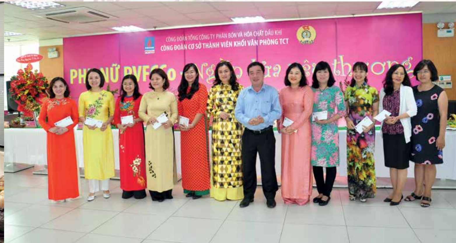
Lãnh đạo Tổng Công ty PVFCCo tặng thưởng các cá nhân có thành tích xuất sắc trong phong trào "Hai giới" năm 2017

niềm vui chung của Ngày thành lập Tổng Công ty DMC (8/3/1990 - 8/3/2018). Trải qua 28 năm xây dựng và phát triển đến nay, Tổng Công ty DMC đã và đang khẳng định vai trò của một trong những thành viên "gạo cội" của Tập đoàn Dầu khí Việt Nam trong các lĩnh vực sản xuất, kinh doanh các loại hóa chất, hóa phẩm và cung cấp các dịch vụ hóa kỹ thuật công nghiệp phục vụ ngành dầu khí và các ngành công nghiệp khác. Mỗi CBCNV luôn cảm thấy tự hào khi được là một thành viên của gia đình DMC.