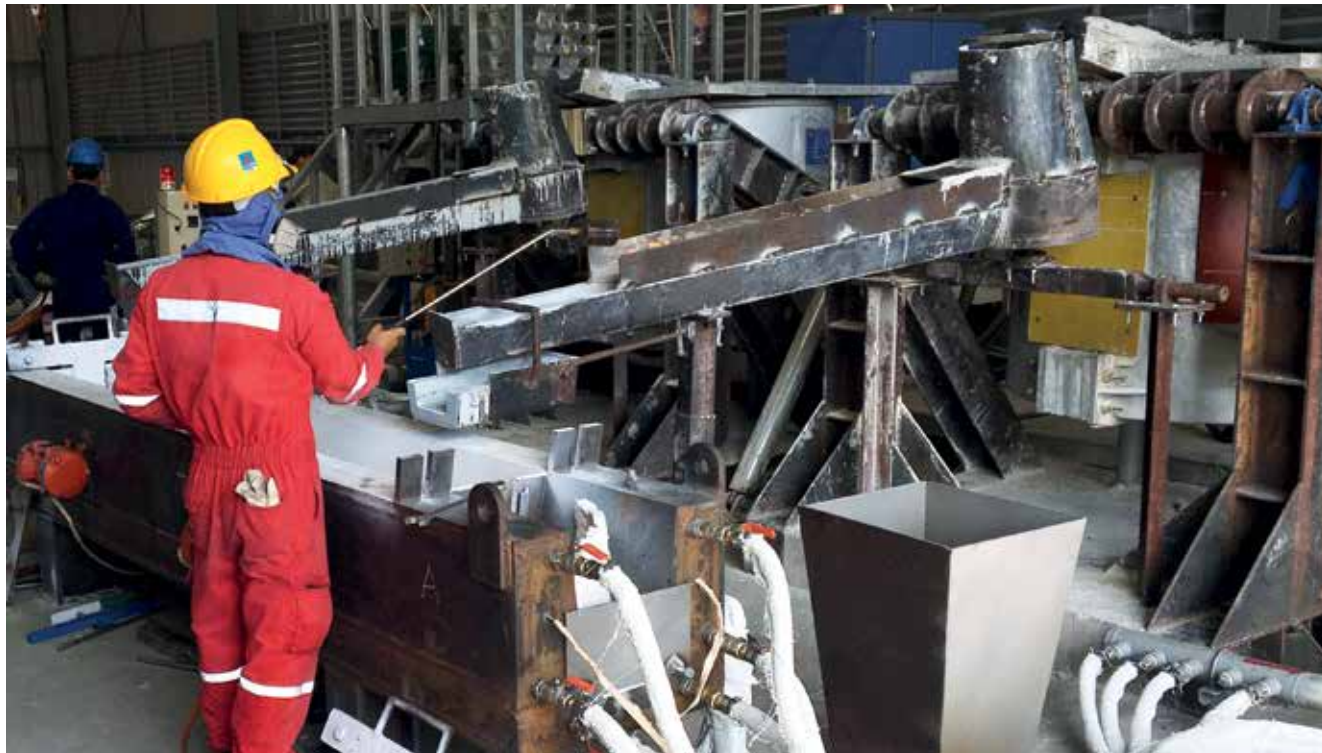
Sản phẩm anode được VPI sản xuất tại Khu công nghiệp Đông Xuyên, tỉnh Bà Rịa - Vũng Tàu