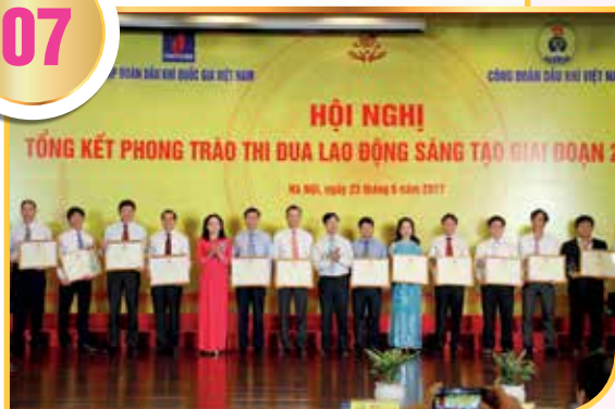
Tổng kết phong trào thi đua lao động sáng tạo giai đoạn 2012 - 2017

Tổ chức hiệu quả các phong trào thi đua yêu nước trong đoàn viên và NLĐ, góp phần hoàn thành thắng lợi nhiệm vụ sản xuất, kinh doanh của Tập đoàn; tuyên dương, nhân rộng điển hình tiên tiến, các danh hiệu tiêu biểu của CĐ DKVN, các danh hiệu thi đua, hình thức khen thưởng của Nhà nước, Bộ, ngành được thực hiện bài bản, thường xuyên, đồng bộ với 4 khâu: Phát hiện - bồi dưỡng - tổng kết - nhân rộng điển hình tiên tiến, tạo sự lan tỏa mạnh mẽ trong đội ngũ NLĐ. Đẩy mạnh Phong trào thi đua yêu nước trong đoàn viên, NLĐ; Phong trào thi đua "Xanh - sạch - đẹp, bảo đảm ATVSLĐ"; Phong trào thi đua lao động sáng tạo, phát huy sáng kiến, cải tiến kỹ thuật nhằm nâng cao năng suất - chất lượng - hiệu quả; Phong trào thi đua tại các dự án, công trình trọng điểm; Phong trào thi đua "Giỏi việc nước, đảm việc nhà"; "Phụ nữ tích cực học tập, lao động sáng tạo, xây dựng gia đình tiến bộ, hạnh phúc" trong nữ lao động Dầu khí; Phong trào thi đua phục vụ sự nghiệp CNH, HĐH nông nghiệp và phát triển nông thôn gắn với cuộc vận động cả nước chung sức xây dựng nông thôn mới.