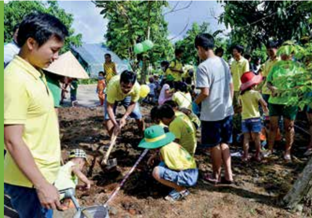
Công đoàn PVCFC tổ chức hoạt động "Bé trồng cây" nhân Ngày Quốc tế Thiếu nhi 1/6

Trong những năm qua, Công ty CP Phân bón Dầu khí Cà Mau (PVCFC) đã 2 lần được vinh danh trong bảng xếp hạng "Doanh nghiệp vì người lao động", khẳng định là một doanh nghiệp luôn không ngừng cải thiện môi trường làm việc, quan tâm chăm lo đời sống vật chất, tinh thần của CBCNV, xây dựng môi trường văn hóa doanh nghiệp lành mạnh. Đóng góp vào thành quả chung đó có vai trò quan trọng của tổ chức công đoàn.