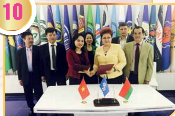
Công đoàn Dầu khí Việt Nam và Công đoàn Công nghiệp Hóa chất, Than và Dầu khí Belarus ký hợp tác

Công tác đối ngoại tiếp tục được nâng cao và mở rộng nhằm nâng cao vị thế, vai trò của tổ chức công đoàn, đẩy mạnh hội nhập quốc tế và đạt được nhiều thành tựu quan trọng. Trong nhiệm kỳ V, CĐ DKVN đã thăm và làm việc với công đoàn các nước: Nga, Belarus, Uzbekistan; Nhật, Hàn Quốc, Ấn Độ, Na Uy và tham dự Đại hội Công đoàn Công nghiệp và sản xuất toàn cầu (IndustriALL) tại Brasil, Đại hội Công đoàn Singapore, Đại hội Công đoàn Dầu khí Na Uy, Hội nghị Phụ nữ thế giới tại Áo... Ký thỏa thuận hợp tác với Công đoàn Công nghiệp Hóa chất, Than và Dầu khí Belarus. Đồng thời, CĐ DKVN đã đón tiếp và làm việc với các công đoàn năng lượng và dầu khí: Ba Lan, Tây Ban Nha, Cuba, Hàn Quốc, Triều Tiên, Nhật Bản, Áo, IndustriALL, IndustriALL khu vực châu Á - Thái Bình Dương. CĐ DKVN cũng đã phối hợp với Tổng Liên đoàn tiếp đón và làm việc với các chuyên gia về quan hệ lao động của IndustriALL; tổ chức các hoạt động, hội thảo, các buổi làm việc, tập huấn trong và ngoài nước nhằm chia sẻ kinh nghiệm hoạt động công đoàn, cơ chế chính sách đối với đoàn viên và NLĐ.