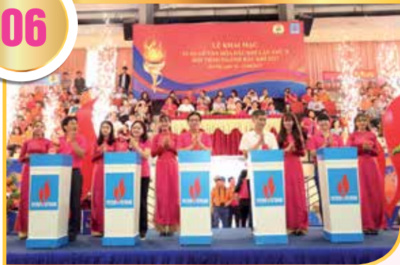
Khai mạc Tuần lễ Văn hóa Dầu khí năm 2017 tại Hà Nội

Tổ chức Hội diễn văn nghệ "Tiếng hát những người đi tìm lửa", hội thao tại các khu vực được tổ chức nhân dịp Tuần lễ Văn hóa Dầu khí hàng năm; Các hoạt động văn hóa thể thao tiếp tục được duy trì và phát triển tốt. Lãnh đạo Tập đoàn và các đơn vị trong ngành đều quan tâm, ủng hộ đến phong trào, xem đây là một trong những hoạt động không thể thiếu trong việc nâng cao đời sống tinh thần, tăng cường tinh đoàn kết gắn bó, nâng cao thể lực cho NLĐ và là tiêu chí quan trọng trong việc đánh giá công tác xây dựng đời sống văn hóa cơ sở. Các hoạt động này đã được các công đoàn trực thuộc vận dụng triển khai sáng tạo bằng rất nhiều hoạt động cụ thể và thu hút được trên 5.000 lượt CBCNLĐ tham gia, góp phần quan trọng vào việc xây dựng đội ngũ NLĐ có năng lực trình độ, có phẩm chất đạo đức lối sống, tư tưởng chính trị vững vàng, góp phần thực hiện thắng lợi Nghị quyết của Đảng về "tiếp tục xây dựng giai cấp công nhân Việt Nam trong thời kỳ đẩy mạnh CNH, HĐH đất nước".