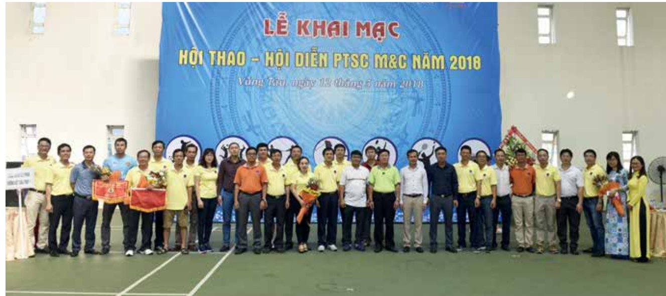
Ban lãnh đạo chụp hình lưu niệm cùng các VĐV