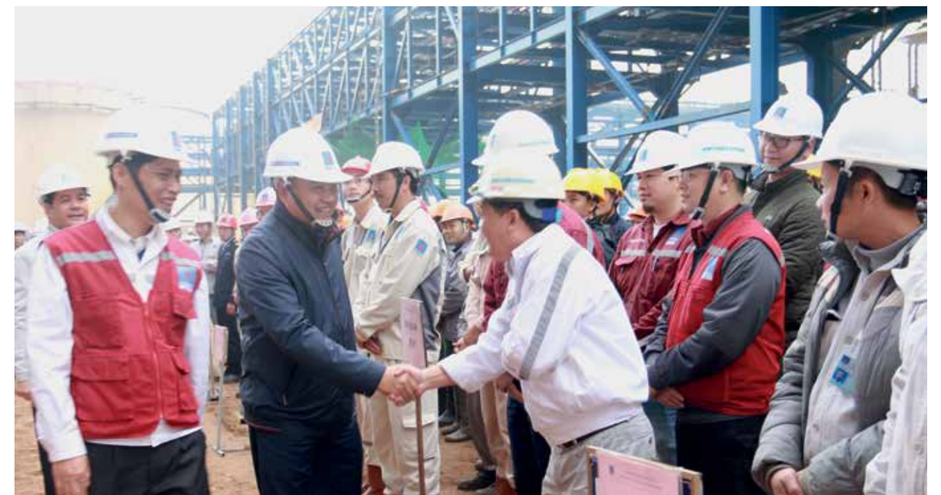
Chủ tịch HĐTV PVN Trần Sỹ Thanh làm việc tại dự án NMNĐ Thái Bình 2

Để chuẩn bị cho một nhiệm kỳ mới đầy thách thức bởi những nhiệm vụ lớn lao của Tập đoàn và yêu cầu, mong muốn ngày càng cao của người lao động, đòi hỏi Công đoàn Dầu khí Việt Nam cần phải khắc