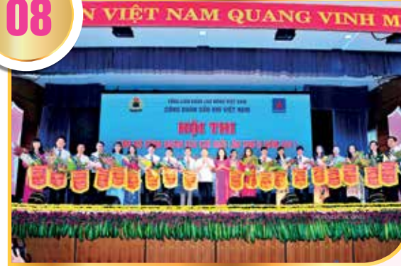
Hội thi Cán bộ công đoàn giỏi 2017

Đẩy mạnh công tác nâng cao chất lượng và hiệu quả hoạt động của đội ngũ cán bộ công đoàn, nâng cao trình độ, kỹ năng nghề nghiệp của đoàn viên và NLĐ. Chú trọng quan tâm đến công tác đào tạo, bồi dưỡng, tập huấn cán bộ công đoàn, hàng năm, CĐ DKVN đã tổ chức các lớp tập huấn ở các khu vực về chính sách pháp luật, công tác nữ công, công tác tuyên giáo, công tác tổ chức, tài chính, hoạt động ủy ban kiểm tra và thực hành phần mềm kế toán công đoàn; tổng số lượt cán bộ công đoàn các cấp tham dự tập huấn, bồi dưỡng từ năm 2013 đến nay là 8.048 lượt người, tổng số kinh phí cho công tác tập huấn, bồi dưỡng cán bộ công đoàn là 10,7 tỷ đồng. Trong giai đoạn 2013 - 2017, đã có tổng số 120 cá nhân được Tổng Liên đoàn xét khen thưởng Kỷ niệm chương "Vì sự nghiệp xây dựng tổ chức công đoàn", trong đó có 107 cá nhân công tác trong tổ chức công đoàn và 13 cá nhân có công đóng góp xây dựng tổ chức công đoàn.