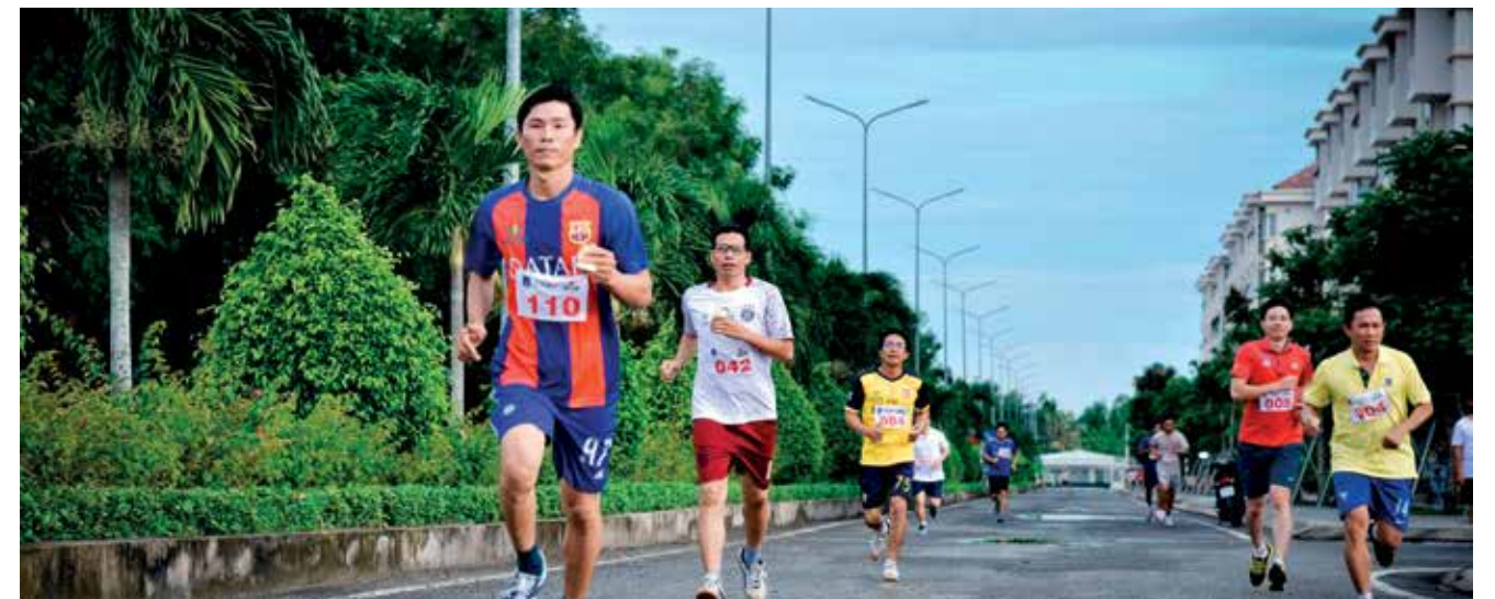
CBCNV hào hứng tham gia kỳ kiểm tra thể lực diễn ra hàng Quý của Công ty