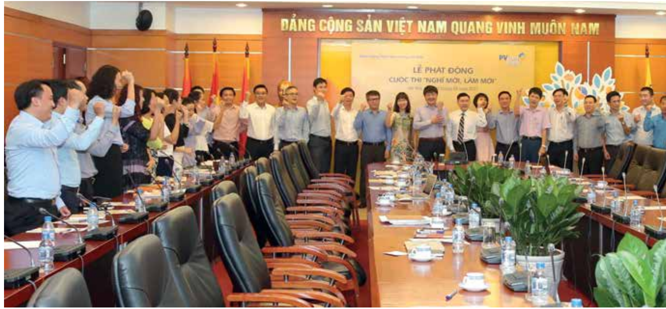
Công đoàn cùng Ban lãnh đạo ngân hàng phát động cuộc thi "Nghĩ mới làm mới" năm 2017