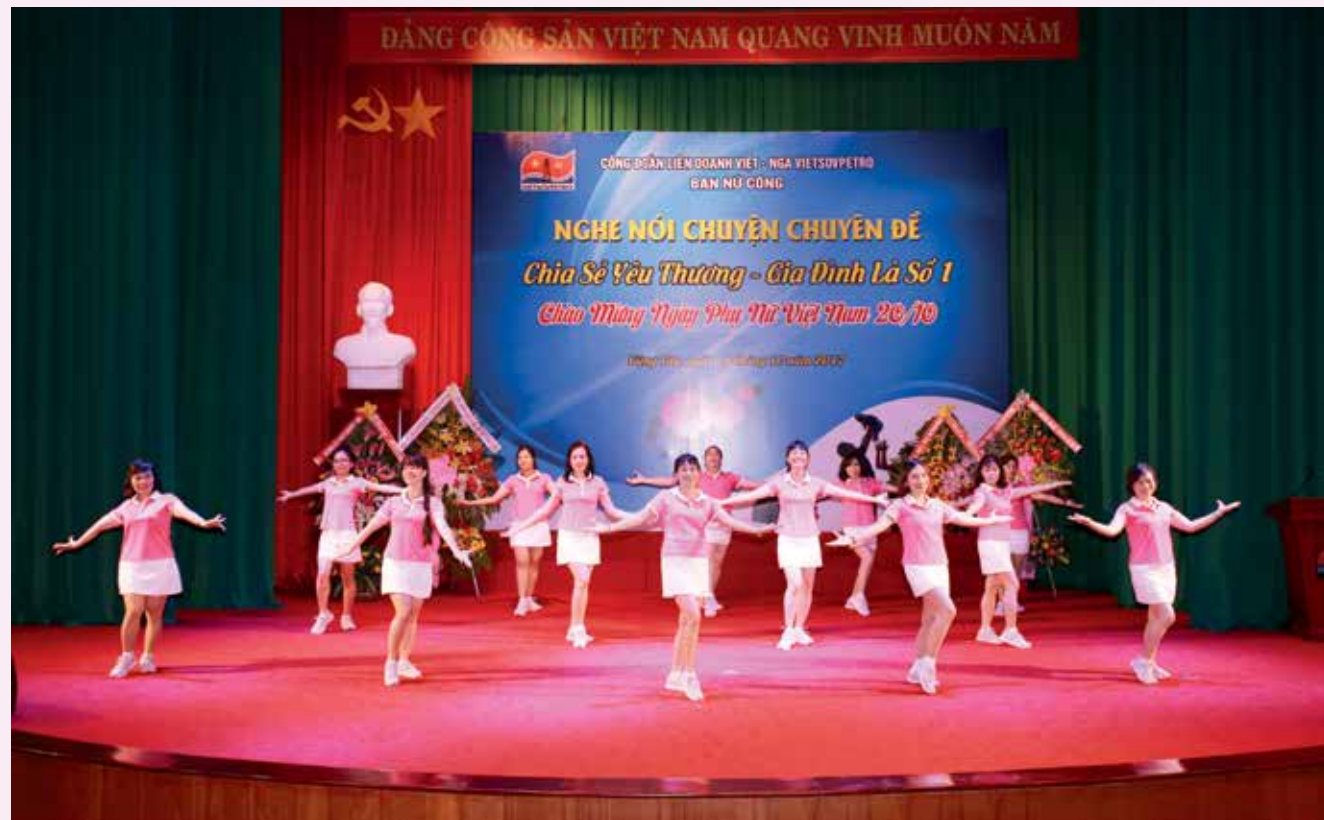
Tiết mục Dancing của Ban Nữ công VSP trong buổi nghe nói chuyện chuyên đề nhân ngày Phụ nữ Việt Nam 20/10

Phong trào nữ công tại Liên doanh Dầu khí Việt - Nga Vietsovpetro đã thực sự góp phần tạo nên một tập thể nữ xuất sắc, tiêu biểu, giữ vai trò là ngọn cờ đầu trong phong trào lao động nữ của ngành Dầu khí Việt Nam.