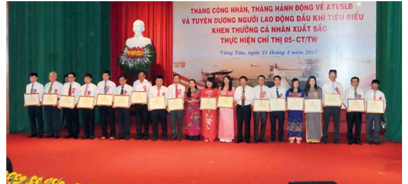
Trao Bằng khen cho các tập thể thực hiện xuất sắc Chỉ thị 05-CT/TW

Không những vậy, CĐ DKVN cũng đã kịp thời tuyên dương, khen thưởng những cá nhân, tập thể có thành tích xuất sắc. Đây là những tấm gương điển hình, có phẩm chất đạo