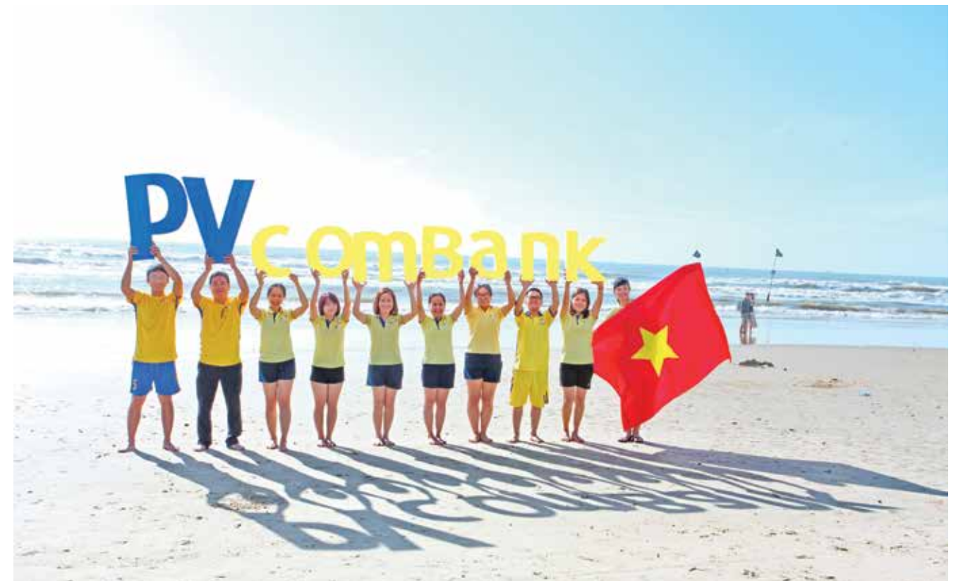
Cuộc thi Ảnh khoảnh khắc gia đình PVcomBank