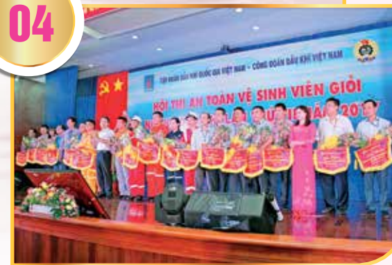
Khai mạc Hội thi An toàn vệ sinh viên giỏi năm 2017 tại Vũng Tàu

CD DKVN tổ chức Hội thi Cán bộ Công đoàn Dầu khí giỏi; chương trình thi online Tìm hiểu về tổ chức công đoàn và ngành Dầu khí, Cuộc thi hành trình Văn hóa Petrovietnam, Hội thi văn hóa ẩm thực Dầu khí. Phối hợp với Tập đoàn tổ chức tốt Hội thi An toàn vệ sinh viên giỏi, Hội thi tay nghề Dầu khí, Hội thi sáng tạo kỹ thuật Dầu khí để tuyên truyền, phổ biến rộng rãi đến NLĐ Dầu khí các văn bản, chính sách, pháp luật của Nhà nước về công tác ATVSLĐ. Mỗi hội thi đã trở thành ngày hội văn hóa lớn của những an toàn viên, của NLĐ toàn ngành, làm cho văn hóa an toàn trong ngành được gần gũi hơn, thiết thực hơn, gắn với quyền lợi, nghĩa vụ của NLĐ. Hội thi tạo thành một phong trào quần chúng rộng rãi, có sức lan tỏa mạnh mẽ, nâng cao ý thức trách nhiệm của NLĐ, người sử dụng lao động trong công tác ATVSLĐ, góp phần bảo vệ quyền và lợi ích hợp pháp, chính đáng của NLĐ, nâng cao hiệu quả hoạt động SXKD của đơn vị và Tập đoàn.