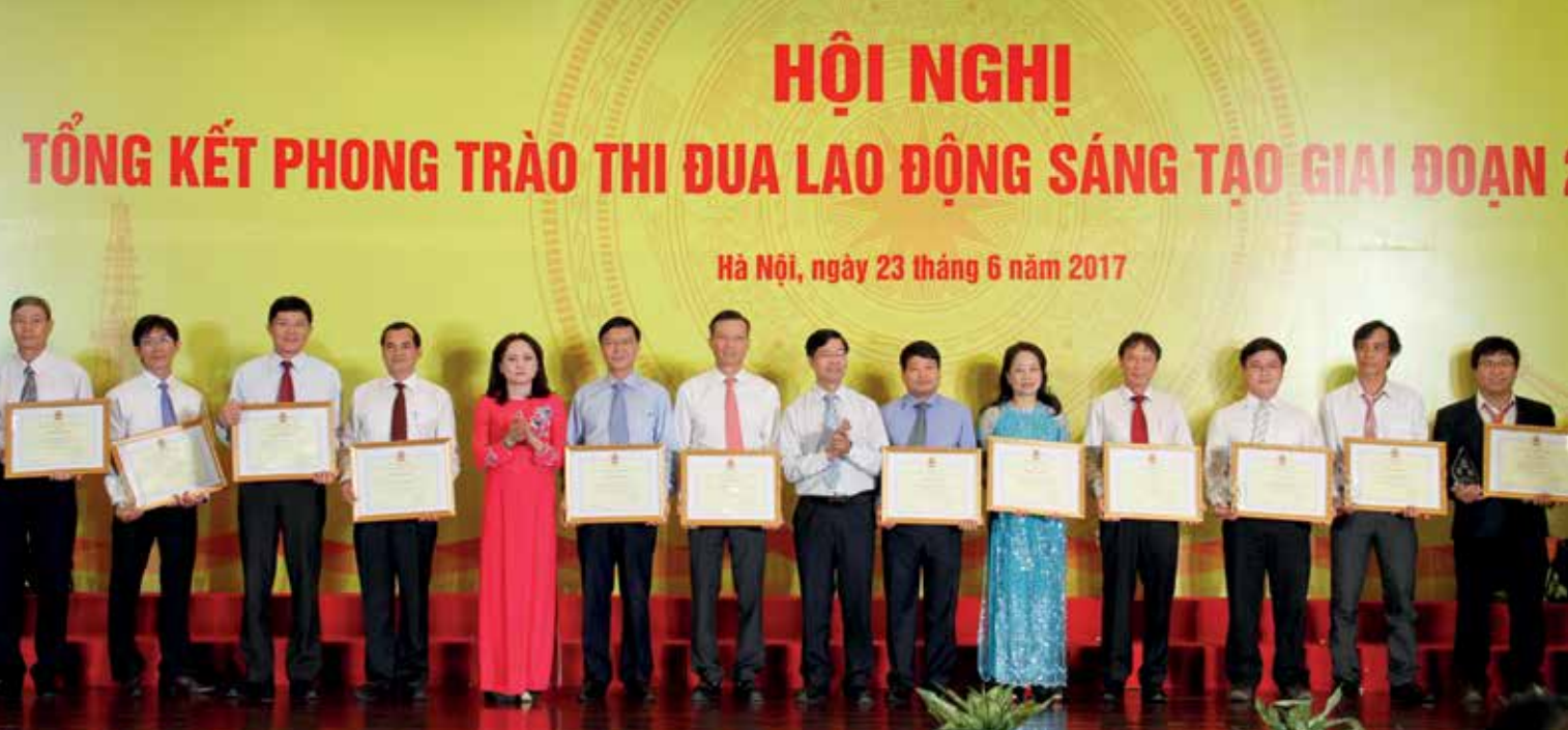
Các đơn vị trực thuộc CD DKVN nhận bằng khen của Tổng Liên đoàn LĐVN trong phong trào LĐST giai đoạn 2012 - 2017

lao động sáng tạo trong ngành Dầu khí đã đạt được những kết quả thật đáng khích lệ, chỉ tính riêng trong 5 năm (2012 - 2017), đã có gần 2.000 đề tài, sáng kiến/giải pháp được công nhận và được áp dụng vào sản xuất kinh doanh thuộc các lĩnh vực: Tìm kiếm thăm dò - khai thác dầu khí; Hóa - chế biến dầu khí; Nhiệt và cơ khí chế tạo; Công nghệ thông tin - tự động hóa - điện tử... với tổng giá trị làm lợi ước tính hàng nghìn tỷ đồng mỗi năm. Trong đó, có 2 công trình được trao tặng Giải thưởng Hồ Chí Minh, 1 Giải thưởng Nhà nước về KHCN và 4 sản phẩm được vinh danh "Tự hào trí tuệ lao động Việt Nam". Các đơn vị đã có nhiều sáng kiến tiêu biểu như VSP, PTSC, PVD, PVEP, PV GAS, PVFCCo, BSR...