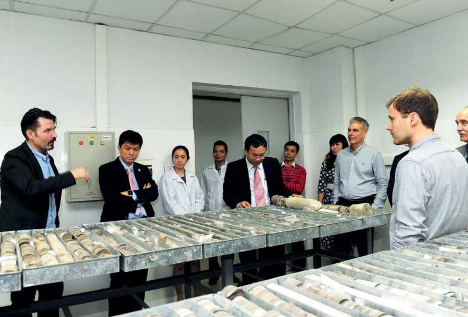
Các chuyên gia của Cục Địa chất Đan Mạch và Greenland thăm kho lưu trữ mẫu của VPI