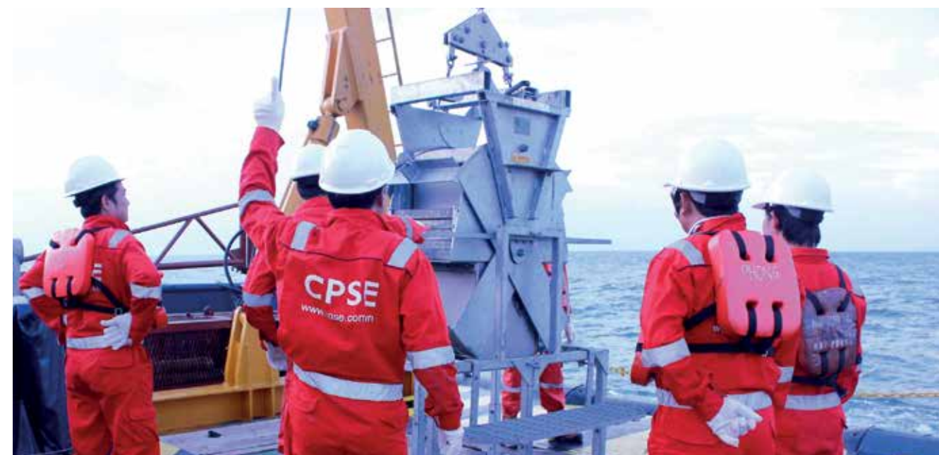
Cán bộ nghiên cứu của VPI khảo sát lấy mẫu môi trường ở khu vực nước sâu

Trong điều kiện còn nhiều khó khăn, Công đoàn VPI đã phối hợp với các tổ chức trong hệ thống chính trị đã thực hiện tốt công tác an sinh xã hội với các hoạt động cụ thể, thiết thực. Từ đầu năm 2018 đến nay, VPI đã đến thăm hỏi, động viên và tặng quà cho 200 gia đình có hoàn cảnh khó khăn tại xã Lũng Vân, huyện Tân Lạc, tỉnh Hòa Bình và ấp 5, xã Mã Đà, huyện Vĩnh Cửu, tỉnh Đồng Nai. Đồng thời, VPI đã trao học bổng “Trí tuệ Dầu khí Việt Nam” cho 20 em học sinh nghèo vượt khó.