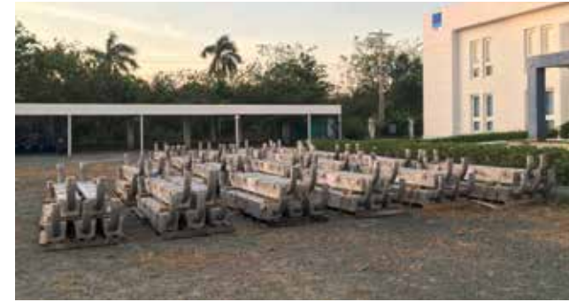
Sản phẩm anode của VPI được tổ chức kiểm định quốc tế Det Norske Veritas (DNV) đánh giá đạt chất lượng theo tiêu chuẩn quốc tế DNV RP B401

Anode hy sinh hợp kim nhôm do VPI nghiên cứu, chế tạo và được sản xuất tại Khu công nghiệp Đông Xuyên, tỉnh Bà Rịa - Vũng Tàu. Số lượng anode hy sinh được cung cấp cho Vietsovpetro đợt này là 212 sản phẩm, khối lượng 410kg/sản phẩm, với kích thước 244cm x 25,2cm x 24cm. Sản