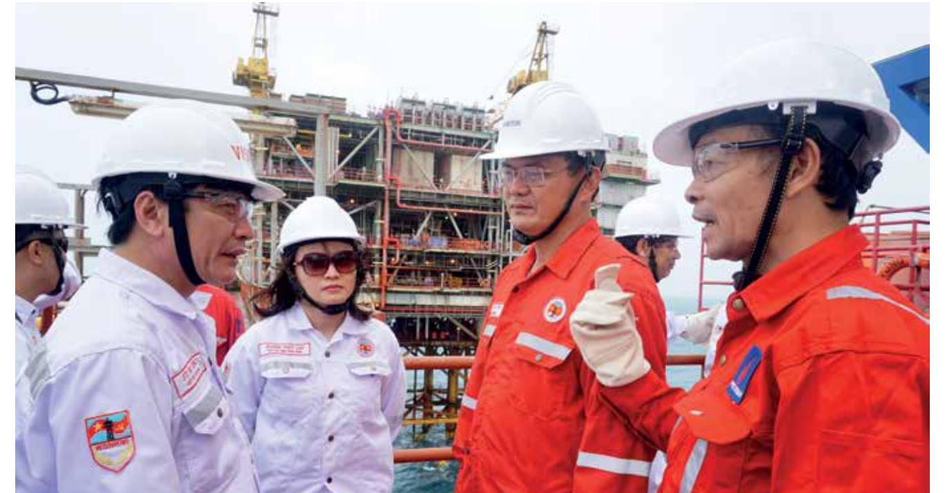
Chủ tịch Tổng LĐLĐ Việt Nam Bùi Văn Cường và Chủ tịch CĐ DKVN Nghiêm Thùy Lan thăm Giàn CNTT-3

Trong 5 năm tới, dự báo tình hình sẽ còn nhiều thay đổi. Tình hình quốc tế diễn biến phức tạp, khó lường; cuộc cách mạng công nghiệp 4.0 có tác động sâu sắc đến đời sống thế giới, mở ra nhiều cơ hội nhưng cũng đặt ra nhiều thách thức đối với các