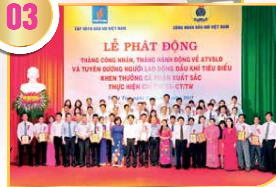
Khai mạc Lễ phát động Tháng Công nhân và Tháng Hành động về ATVSLĐ năm 2017 tại Vũng Tàu

Tổ chức Lễ phát động Tháng Công nhân và Tháng Hành động về ATVSLĐ, hướng dẫn các công đoàn trực thuộc triển khai nhiều hoạt động ý nghĩa, đặc biệt là trong tháng cao điểm - Tháng năm. Chỉ đạo các công đoàn trực thuộc sáng tạo tổ chức nhiều hoạt động lồng ghép, hướng về NLĐ thông qua việc tổ chức phát động phong trào thi đua lao động sáng tạo, sáng kiến, sáng chế, cải tiến kỹ thuật; tổ chức tuyên dương khen thưởng "Người lao động Dầu khí tiêu biểu". Phối hợp với Tập đoàn tổ chức các hoạt động hưởng ứng "Tuần lễ Quốc gia ATVSLĐ-PCCN" và Tháng hành động về ATVSLĐ, PCCN. Đây là điểm nhấn trong chuỗi các hoạt động hướng tới công tác ATVSLĐ. Nội dung phát động bám sát chủ đề và hướng dẫn Tổng Liên đoàn LĐVN, các bộ, ban, ngành phù hợp với tình hình thực tiễn của Tập đoàn. Hằng năm các hoạt động thăm hỏi, hỗ trợ công nhân khó khăn luôn được đặc biệt quan tâm với chủ đề rất thiết thực. Trong 5 năm, CD DKVN đã tổ chức thăm, hỏi tặng quà cho 5.000 người khó khăn, bị tai nạn lao động, bệnh nghề nghiệp với số tiền trên 5 tỷ đồng.