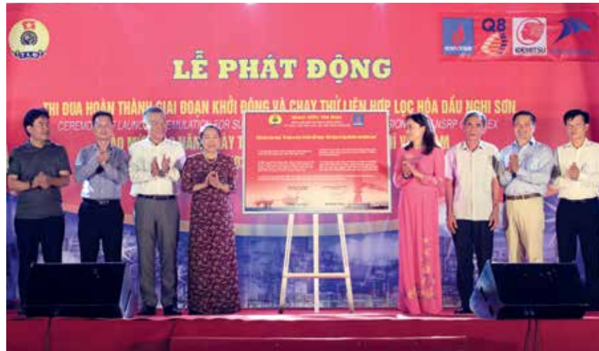
Ký kết Giao ước thi đua tại Công ty Lọc Hóa dầu Nghi Sơn năm 2017

Với phong trào thi đua lao động sáng tạo, trong 5 năm đã xuất hiện hàng nghìn đề tài, sáng kiến, giải pháp với giá trị làm lợi hàng chục nghìn tỉ đồng và các lợi ích xã hội khác. Nhiều đơn vị duy trì có hiệu quả các phong trào thi đua thường xuyên, tập trung vào các nội dung chính "Phát huy sáng kiến, cải tiến kỹ thuật, hợp lý hóa sản xuất, bảo đảm an toàn vệ sinh lao động (ATVSLĐ), phòng chống cháy nổ" và cụ thể hóa các nhiệm vụ, chuyên đề, bằng những khẩu hiệu hành động quyết tâm như: "Lao động sáng tạo, năng suất cao hơn, chất lượng cao hơn", "Chất lượng và dịch vụ là yếu tố quyết định tạo nên thương hiệu cho doanh nghiệp". Việc tổ chức phong