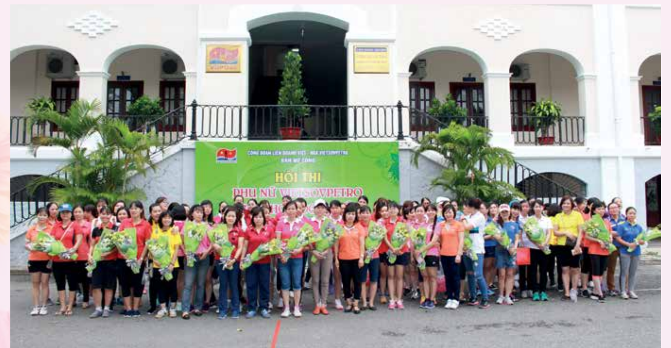
Hội thi Phụ nữ Vietsovpetro năm 2017

Với số lượng 987 cán bộ nữ, trong đó có trình độ trên đại học là 72 người; trình độ đại học là 452 người; cao đẳng, trung cấp là 157 người; công nhân kỹ thuật 67 người và lao động phổ thông khoảng 400 người.