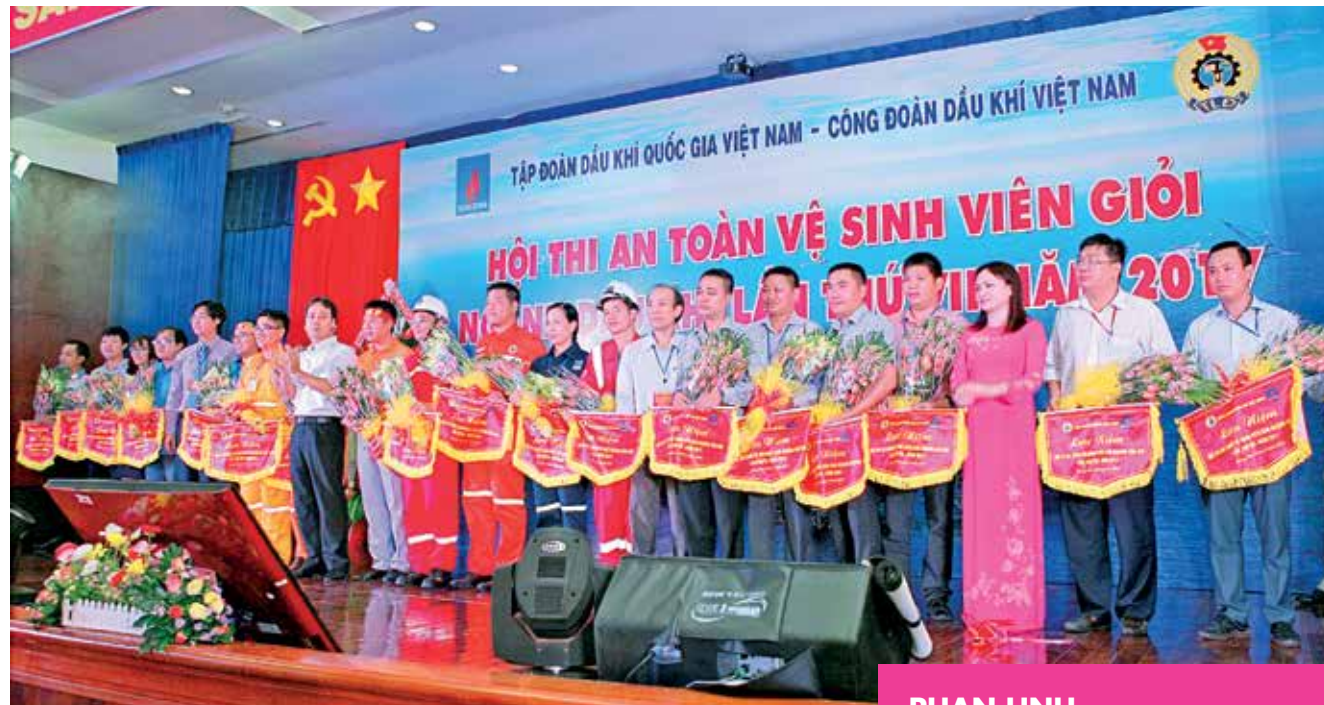
CD DKVN tổ chức Hội thi An toàn Vệ sinh viên giỏi - 2017