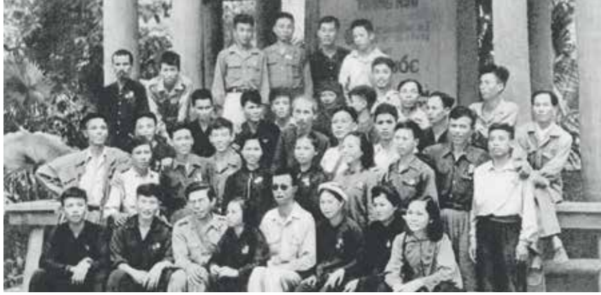
Bác Hồ với các đại biểu Đại hội Anh hùng, chiến sĩ thi đua và cán bộ gương mẫu toàn quốc lần thứ nhất tại Kim Bình (5/1952)

Sau khi Ban Chấp hành Trung ương ra Chỉ thị phát động phong trào thi đua ái quốc và xác định: “... mục đích thi đua ái quốc là làm sao cho kháng chiến mau thắng lợi, kiến thiết chóng thành công”, nhân kỷ niệm 1.000 ngày kháng chiến (Ngày Nam Bộ kháng chiến 23/9/1945), ngày 11/6/1948 Chủ tịch Hồ Chí Minh ra “Lời kêu gọi thi đua ái quốc”.