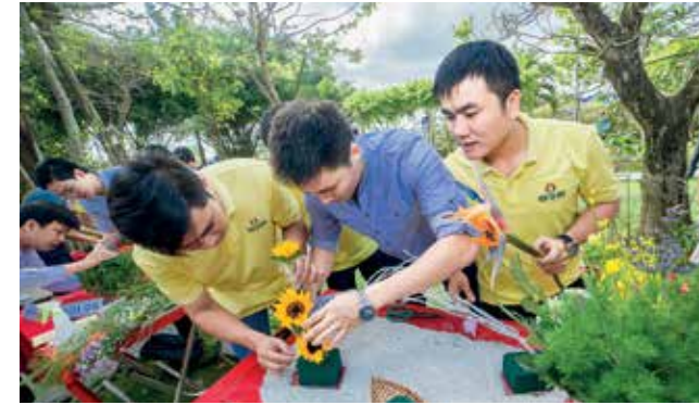
Công đoàn PVCFC tổ chức cuộc thi cắm hoa nhân ngày Quốc tế Phụ nữ 8/3

Không chỉ chăm lo tốt đời sống vật chất, văn hóa tinh thần cho NLĐ, tổ chức công đoàn cũng thường xuyên quan tâm, tìm hiểu tâm tư, tình cảm của NLĐ để kịp thời giải quyết những mâu thuẫn nhằm xây dựng tình đoàn kết của các thành viên trong đơn vị; chăm lo lợi ích thiết thực cho đoàn viên và NLĐ bằng việc thường xuyên tổ chức thăm hỏi NLĐ có hoàn cảnh khó khăn, thực hiện tốt việc thăm hỏi hiếu hỷ cho NLĐ; tổ chức lại bếp ăn tập thể tại căng tin nhà công vụ và nhà máy một cách phù hợp, đảm bảo chất lượng và vệ sinh an toàn thực