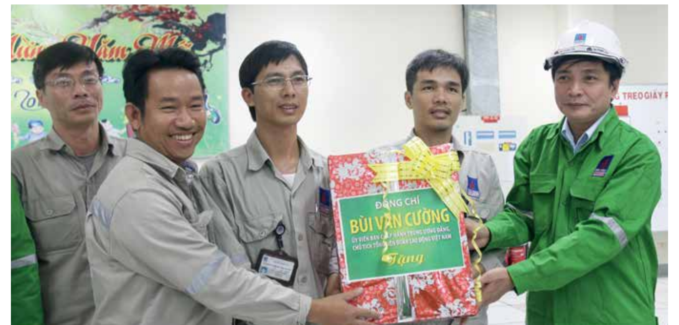
Chủ tịch Tổng LĐLĐ Việt Nam Bùi Văn Cường tặng quà cho tập thể NLĐ Nhà máy Đạm Phú Mỹ