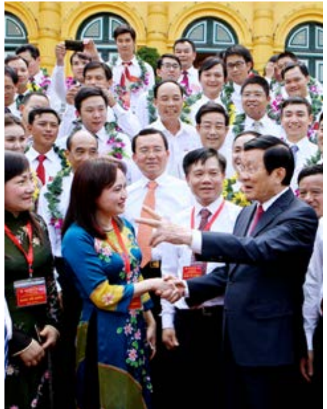
Chủ tịch nước Trương Tấn Sang gặp gỡ lãnh đạo Tập đoàn Dầu khí Việt Nam và người lao động Dầu khí tiêu biểu năm 2015

Có thi đua là phải có khen thưởng, để vinh danh những người lao động dầu khí xuất sắc, tạo sự lan tỏa rộng khắp, tiếp thêm động lực để người lao động phấn đấu lập thành