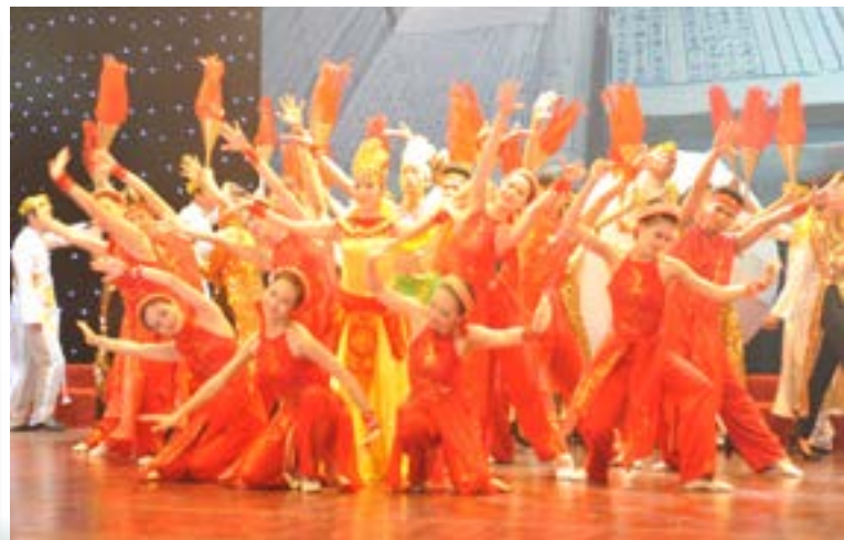
Các tiết mục tham gia Hội diễn "Tiếng hát những người đi tìm lửa" luôn được đầu tư để đạt chất lượng nghệ thuật cao