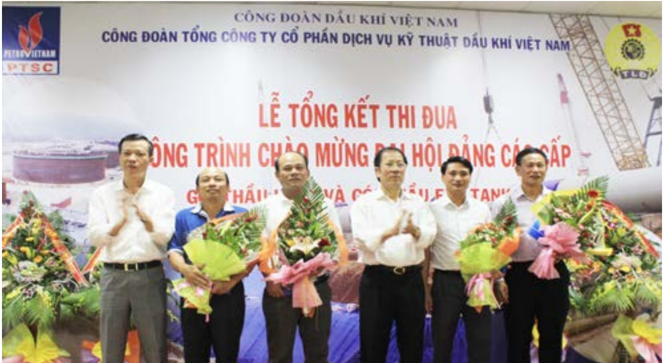
Công đoàn Tổng công ty PTSC thăm hỏi động viên và tặng quà các đơn vị đang thi công tại dự án

trọng và thực hiện chuyên nghiệp, đáp ứng được toàn bộ các yêu cầu của Tổng thầu.