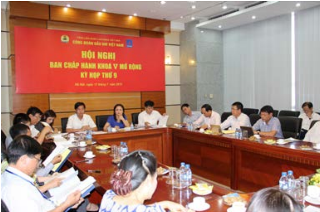
Hội nghị Ban Chấp Hành khoá V mở rộng, kỳ họp thứ 9 vừa diễn ra tại Hà Nội ngày 17/7/2015

Hội nghị lần thứ 9 Ban Chấp hành Công đoàn Dầu khí Việt Nam (khoá V) được diễn ra trong không khí vui mừng, phấn khởi của toàn thể CBCNVLD ngành Dầu khí, đang tích cực thi đua lao động sản xuất, thiết thực lập nhiều thành tích, chào mừng Đại hội Đảng bộ Tập đoàn lần thứ II, tiến tới Đại hội đại biểu toàn quốc lần thứ XII của Đảng; chào mừng 70 năm Cách mạng Tháng Tám, Quốc khánh mừng 2 tháng 9; kỷ niệm 40 năm ngày thành lập Tập đoàn Dầu khí Quốc gia Việt Nam, chào mừng Đại hội Thi đua yêu nước trong công nhân, viên chức, lao động ngành Dầu khí lần thứ II, tiến tới Đại hội Thi đua yêu nước toàn quốc lần thứ IX và kỷ niệm 86 năm ngày thành