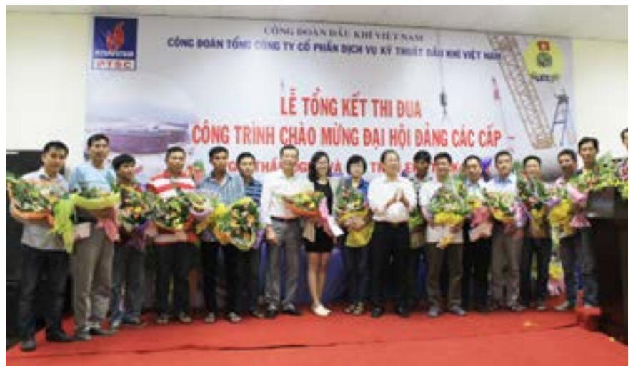
Công đoàn Tổng công ty PTSC khen thưởng các tập thể, cá nhân có thành tích trong phong trào thi đua

Cũng trong chương trình, CĐ TCT đã tổ chức thăm hỏi động viên, tặng quà người lao động của 4 đơn vị là Công ty CP Cảng DVĐK Tổng hợp PTSC Thanh Hóa; Gói thầu B2 của PTSC M&C; Công ty CP Dịch vụ Bảo vệ An ninh Dầu khí; Chi nhánh Tổng công ty - Ban Dự án Nhiệt điện Long Phú đang làm việc ngày đêm trên công trường dự án trọng điểm của Quốc gia. 🌸