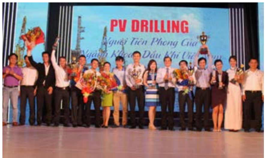
Lãnh đạo TCT và công đoàn TCT tặng cúp cho các đội đạt giải Nhất, Nhì, Ba toàn đoàn