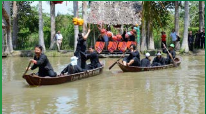
CBCNV tham gia trò chơi "Tát nước bắt cá" trong ngày Hội gia đình

Mặc dù đây là lần đầu tiên Công đoàn PVFCCo tổ chức chương trình hoạt động chào mừng Ngày gia đình Việt Nam nhưng đã thu hút sự tham gia đông đảo của hơn 60 gia đình có vợ, chồng làm việc tại PVFCCo. Các cặp vợ chồng đã tranh tài ở hai nội dung gồm thi đấu cầu lông và nhảy bao bố với các lứa tuổi khác nhau. Chương trình giao lưu đã diễn ra hết sức sôi nổi, vui vẻ nhưng cũng không kém phần quyết liệt và đã để lại những ấn tượng sâu sắc trong mỗi thành viên tham dự. Đây cũng là thông điệp về giá trị mái ấm và cùng nhau vượt qua sóng gió để có một gia đình hạnh phúc. 🍀