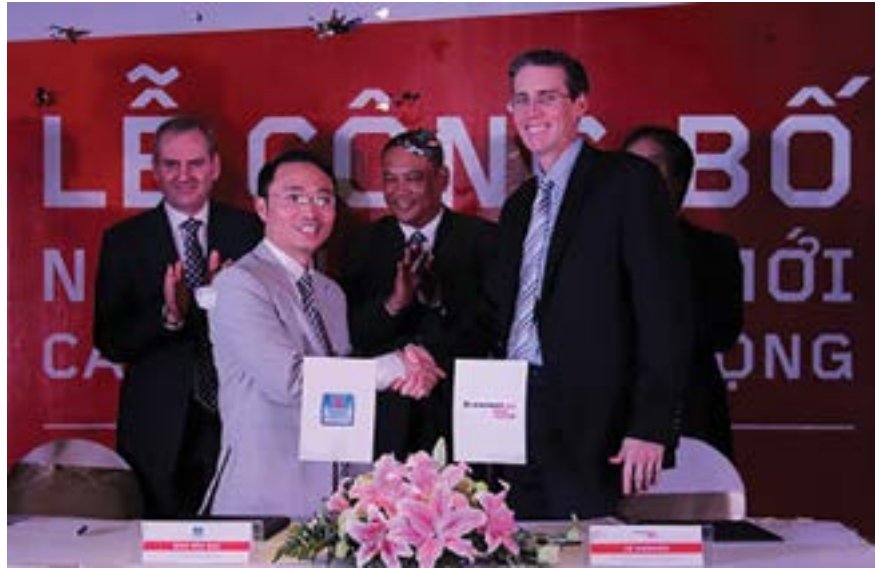
Tháng 11/2014 PSD trở thành nhà phân phối chính thức của điện thoại di động Lenovo tại thị trường Việt Nam

vào thời điểm 2009, với hàng loạt kế hoạch, phương án tái cấu trúc, sắp xếp lại cơ cấu doanh nghiệp được triển khai và thực thi. Cụ thể, về công tác tổ chức, PET định hình lại các mảng hoạt động dịch vụ, Tổng công ty bổ sung thêm một số mảng hoạt động mới như quản lý khai thác tài sản, cung ứng vật tư thiết bị chuyên ngành dầu khí, đồng thời cơ cấu lại một số mảng hoạt động cũ hoạt động chưa thực sự hiệu quả. Bên cạnh đó, PET thực hiện sáp nhập các đơn vị trực thuộc nhằm nâng cao tính linh hoạt trong quản lý. Về công tác nhân sự, nhiều vị trí lãnh đạo cao cấp của PET đã được thay thế và bổ nhiệm mới. Việc tái cấu trúc này đã tạo nên những thay đổi quan trọng để Tổng công ty ngày càng hoạt động hiệu quả hơn.