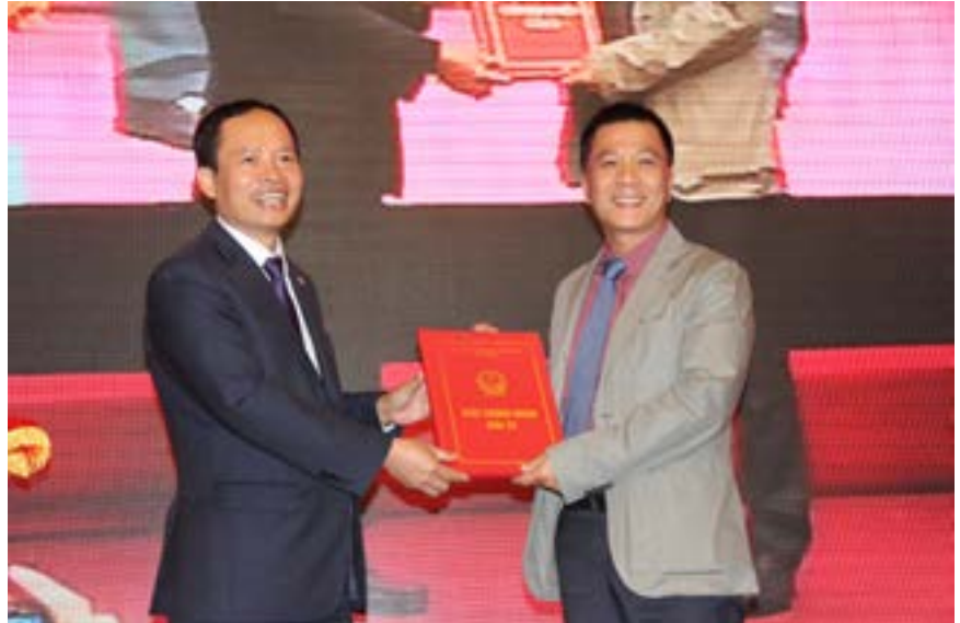
Tháng 10/2014, Petrosetco được trao giấy chứng nhận đầu tư dự án Khu nhà ở và dịch vụ phục vụ Liệp hợp Lọc hóa dầu Nghi Sơn

Không thể phủ nhận rằng, sự dẫn đầu trong các mảng dịch vụ của PETROSETCO nhiều năm qua, có một phần đóng góp từ nhân quan kinh doanh thực tế của người đứng đầu doanh nghiệp. Lãnh đạo PETROSETCO đã đặt mục tiêu trở