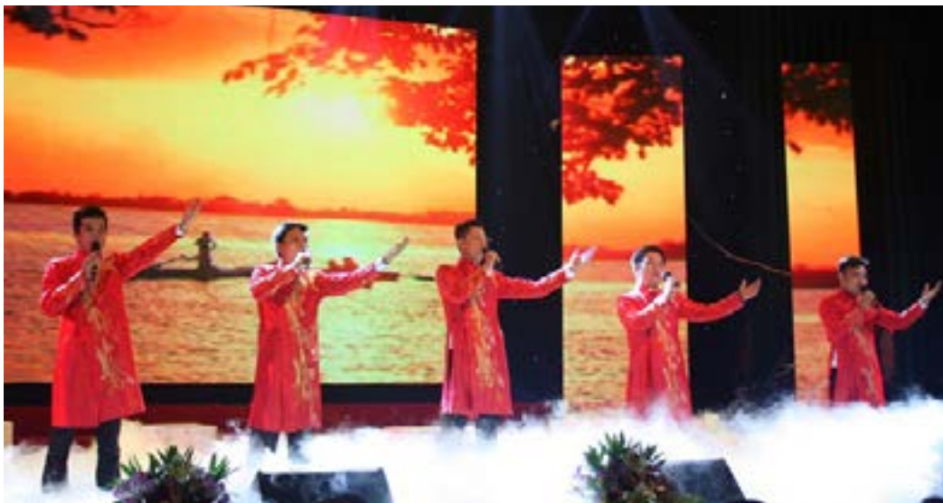
Tốp ca Nam của PVOIL Hà Nội biểu diễn ca khúc “Hồng Hà tự khúc”