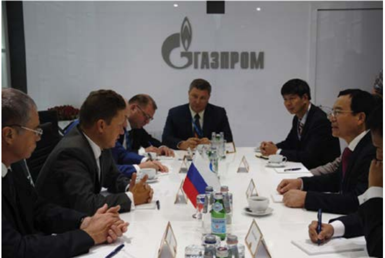
Đoàn công tác của Tập đoàn Dầu khí Việt Nam làm việc với Gazprom