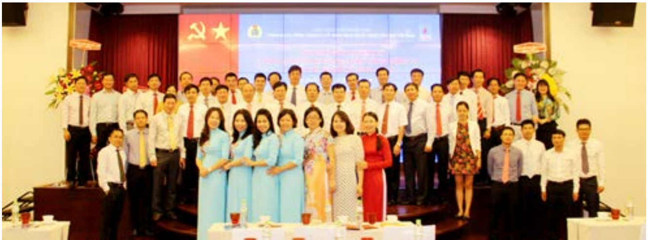
CBCNV PTSC tham dự Hội nghị giữa nhiệm kỳ Ban chấp hành Công đoàn TCT khoá VI nhiệm kỳ 2012 - 2017

Thông qua đại biểu Đại hội, Ban Chấp hành đã gửi lời cảm ơn tới toàn thể NLĐ của TCT đã thi đua lao động sản xuất hoàn thành xuất sắc mọi nhiệm vụ của TCT trong những năm qua, đồng thời kêu gọi phát huy thành tích SXKD đã đạt được, phát huy truyền thống Anh hùng tiếp tục thực hiện nhiệm vụ để thực thắng lợi Nghị quyết Đại hội Đại biểu CĐ TCT PTSC khóa VI, nhiệm kỳ 2012 - 2017. 🌸