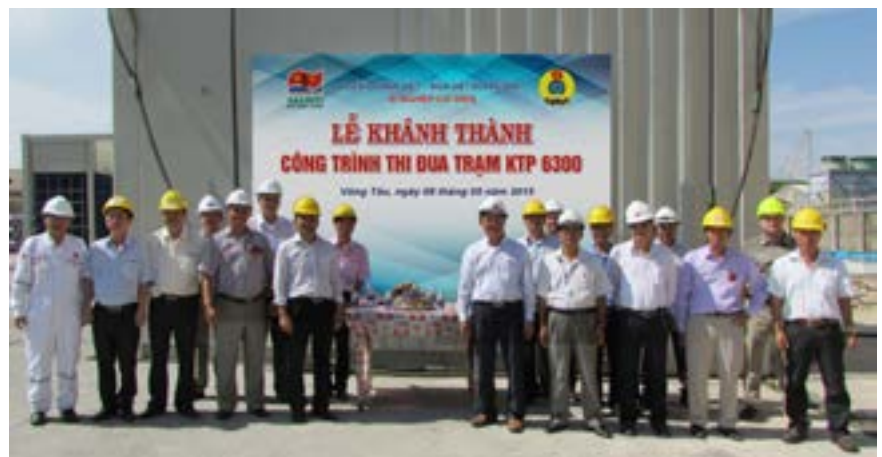
Lễ khánh thành công trình thi đua chào mừng Đại hội Đảng các cấp.

Đảng các cấp từ cơ sở, Đảng bộ Vietsovpetro, Đảng bộ Tập đoàn Dầu Khí Việt Nam, đồng thời triển khai cuộc vận động “Hiến kế đổi mới cơ chế, chính sách tạo động lực phát triển Tập đoàn và Đất nước”. Trong 6 tháng đầu năm 2015, hòa chung không khí thi đua lao động sản xuất của Người lao động Dầu khí toàn Tập đoàn, các tổ chức Công đoàn, Đoàn thanh niên Cộng sản Hồ Chí Minh, Hội Cựu chiến binh Vietsovpetro đã phối hợp phát động và tổ chức nhiều phong trào thi đua yêu nước sôi nổi lập thành tích chào mừng Đại hội đại biểu Đảng bộ các cấp, tiến tới Đại hội đại biểu lần thứ X Đảng bộ Vietsovpetro. Đảng bộ Vietsovpetro đã đề ra 5 nhiệm vụ chính và các giải pháp cụ thể để thực hiện trong nhiệm kỳ 2015 - 2020. Tiếp tục phát huy truyền thống, Công đoàn Vietsovpetro sẽ tổ chức sớm việc tuyên truyền kết quả Đại hội, quyết tâm biến các Nghị quyết của Đại hội thành chương trình hành động cụ thể, theo chức năng, vai trò và nhiệm vụ. Song song với việc lao động tích cực, xây dựng Vietsovpetro phát triển bền vững, công đoàn sẽ tiếp tục vận động đoàn viên đóng góp ý kiến cho các đồng chí đảng viên, cho các tổ chức đảng, phối hợp xây dựng văn hóa Vietsovpetro đoàn kết, hữu nghị, kỷ cương, chuyên nghiệp, chung sức, đồng lòng thực hiện thành công mục tiêu tổng quát của Đại hội Đảng bộ Vietsovpetro khóa X để ra, góp phần nâng cao thương hiệu, uy tín của Vietsovpetro, chăm lo và nâng cao đời sống vật chất và tinh thần cho người lao động. 🌸