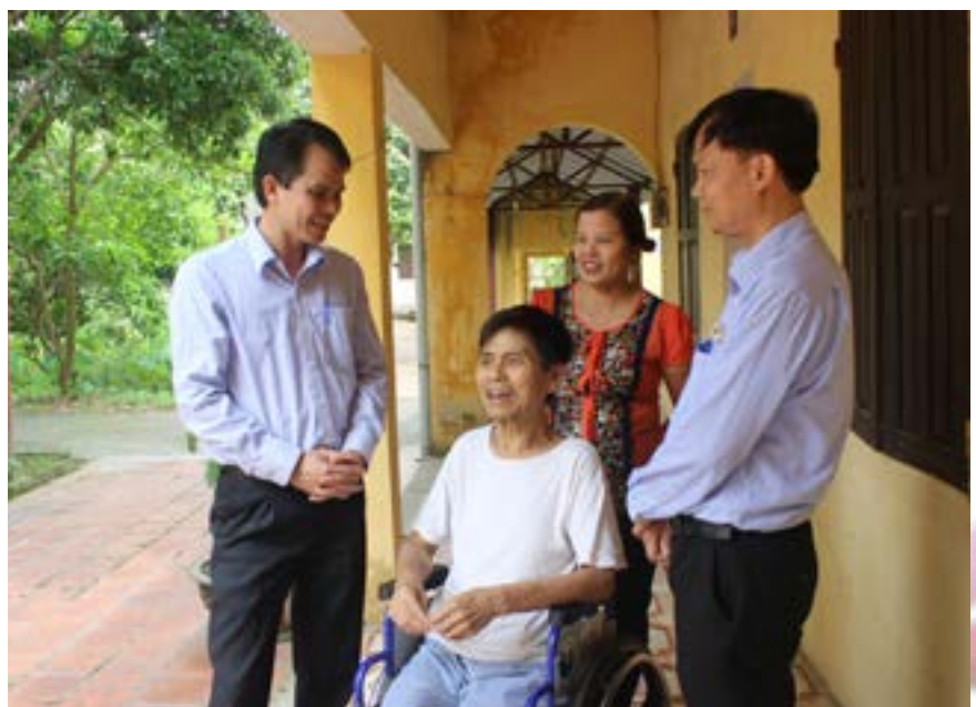
Cán bộ CĐ DKVN và cán bộ Hội CCB TD DKQG thăm hỏi thương bệnh binh tại Trung tâm Điều dưỡng Thương bệnh binh Lạng Giang

của Đảng ủy Tập đoàn DKQG Việt Nam, lãnh đạo BCH Hội CCB Tập đoàn, Công đoàn Dầu khí Việt Nam tới các đồng chí thương bệnh binh đang điều trị tại Trung tâm; đồng chí cũng khẳng định sự hy sinh của những người lính trên các chiến trường năm xưa là vô giá, không gì bù đắp được. Dầu vậy, những hoạt động tri ân của những người dầu khí chính là tấm lòng, sự kính trọng trước những đóng góp to lớn cho sự nghiệp đấu tranh giải phóng dân tộc của các thương, bệnh binh. Đồng thời là mong muốn chia sẻ một phần nỗi đau của các thương bệnh binh cùng gia đình; là lời cầu chúc các thương bệnh binh sức khỏe tốt, tiếp tục làm những tấm gương sáng cho thế hệ trẻ hôm nay và mai sau. 🌸