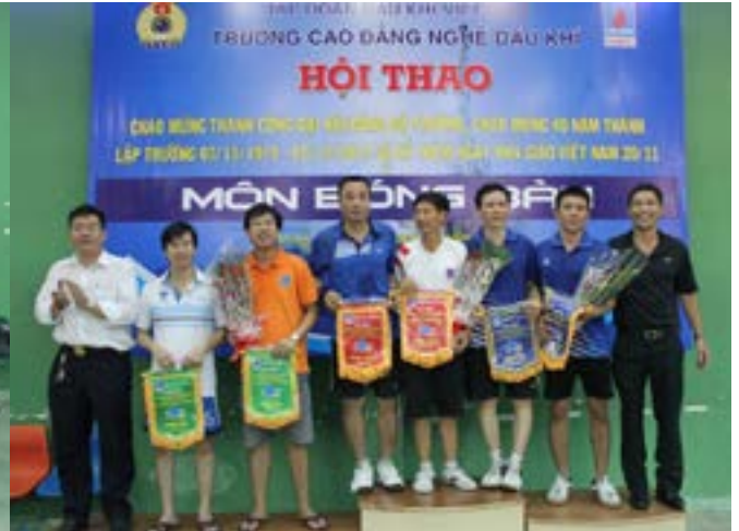
Lãnh đạo CĐCS trường chụp ảnh cùng các VĐV đoạt giải đôi nam