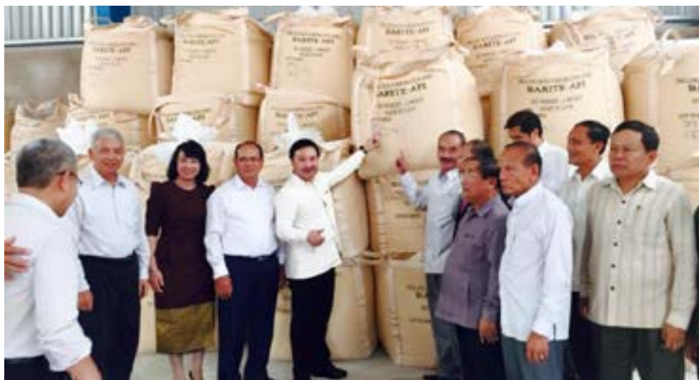
Các đại biểu tham quan khu vực chứa sản phẩm Barite tại Nhà máy

Ngày 19/6/2015, tại huyện Vilabouly, tỉnh Savannakhet (CHDCND Lào), Liên doanh DMC - VTS đã tổ chức lễ khánh thành và chính thức đi vào hoạt động nhà máy sản xuất Barite. Đây là kết quả hợp tác giữa Tổng công ty Dung dịch khoan và Hóa phẩm Dầu khí (DMC) và Tập đoàn VTS của CHDCND Lào.