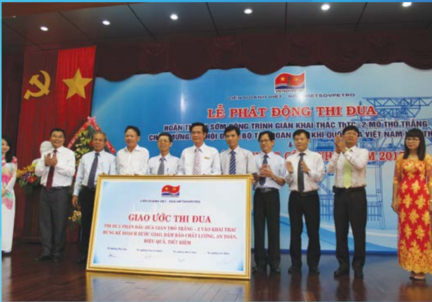
Lễ phát động Thi đua Hoàn thành sớm công trình giàn khai thác ThTC-2 Mô Thở Trắng của Vietsovpetro