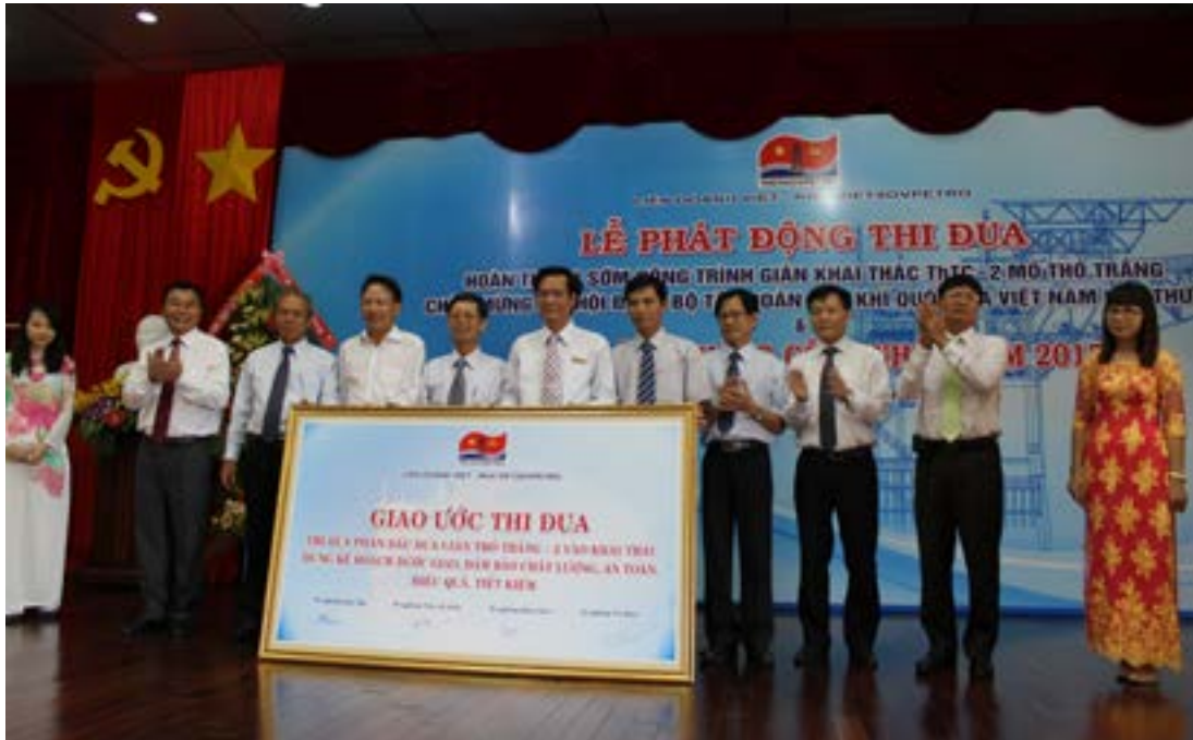
Lễ phát động thi đua công trình chào mừng Đại hội Đảng bộ TĐ DKQGVN