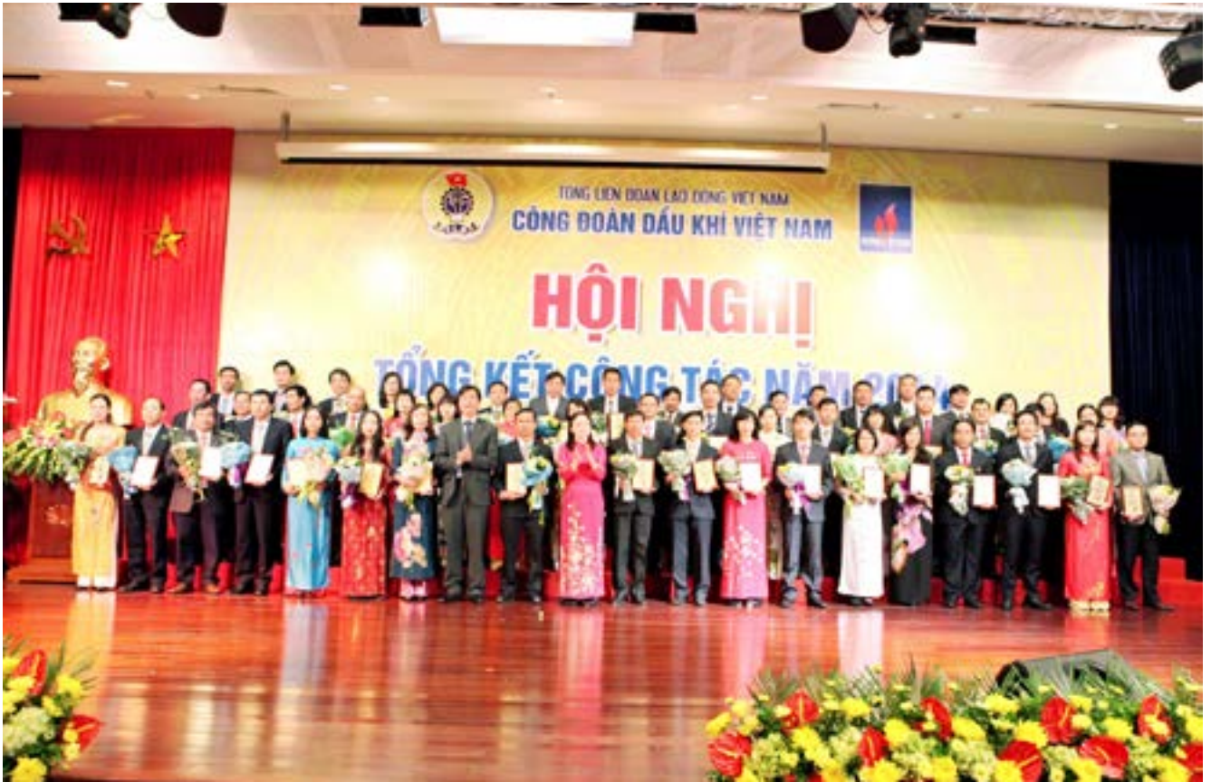
Lãnh đạo CĐ DKVN trao biểu tượng cho Cán bộ công đoàn tiêu biểu năm 2014

Trong giai đoạn 5 năm (2010 - 2015), Công đoàn Dầu khí Việt Nam đã lãnh đạo, chỉ đạo các cấp Công đoàn trong toàn ngành tổ chức thực hiện có hiệu quả các phong trào thi đua và công tác khen thưởng; đẩy mạnh việc tuyên truyền, vận động, động viên CNVCLĐ tích cực hưởng ứng các phong trào thi đua yêu nước do Tổng Liên đoàn Lao động Việt Nam, Tập đoàn Dầu khí Việt Nam và Công đoàn Dầu khí VN phát động.