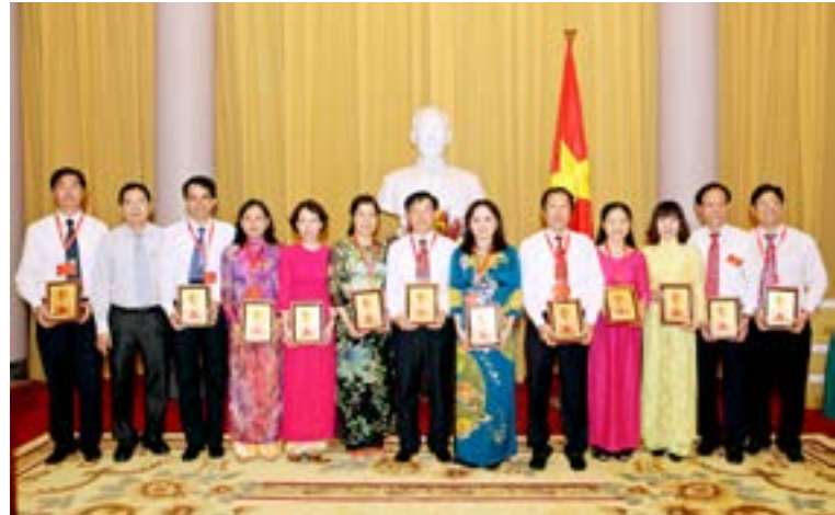
Cán bộ Công đoàn Dầu khí Việt Nam nhận quà tặng của Chủ tịch nước Trương Tấn Sang tại buổi tiếp kiến ngày 18/5/2015

Chặng đường phát triển phía trước vẫn còn nhiều khó khăn, thử thách cần phải vượt qua, đội ngũ cán bộ Công