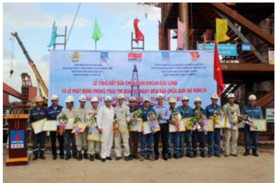
Lễ phát động thi đua 180 ngày đêm sửa chữa giàn khoan Đại Hùng 01 của DQS

Thông qua phong trào thi đua đã động viên được đông đảo CNVCLĐ tham gia thực hiện thắng lợi nhiệm vụ chính trị của từng đơn vị góp phần thực hiện thắng lợi các mục tiêu phát triển của Tập đoàn Dầu khí Quốc gia Việt Nam; tham gia xây dựng tổ chức cơ sở Đảng, đơn vị các cấp ngày càng trong sạch vững mạnh. Qua đó khẳng định rõ vai trò nòng cốt của tổ chức Công đoàn trong việc vận động CNVCLĐ hưởng ứng các phong trào thi đua. Đồng thời đã thực sự trở thành nhân tố tích cực, là động lực thúc đẩy sự phát triển bền vững của Tập đoàn Dầu khí Quốc gia Việt Nam. 🌸