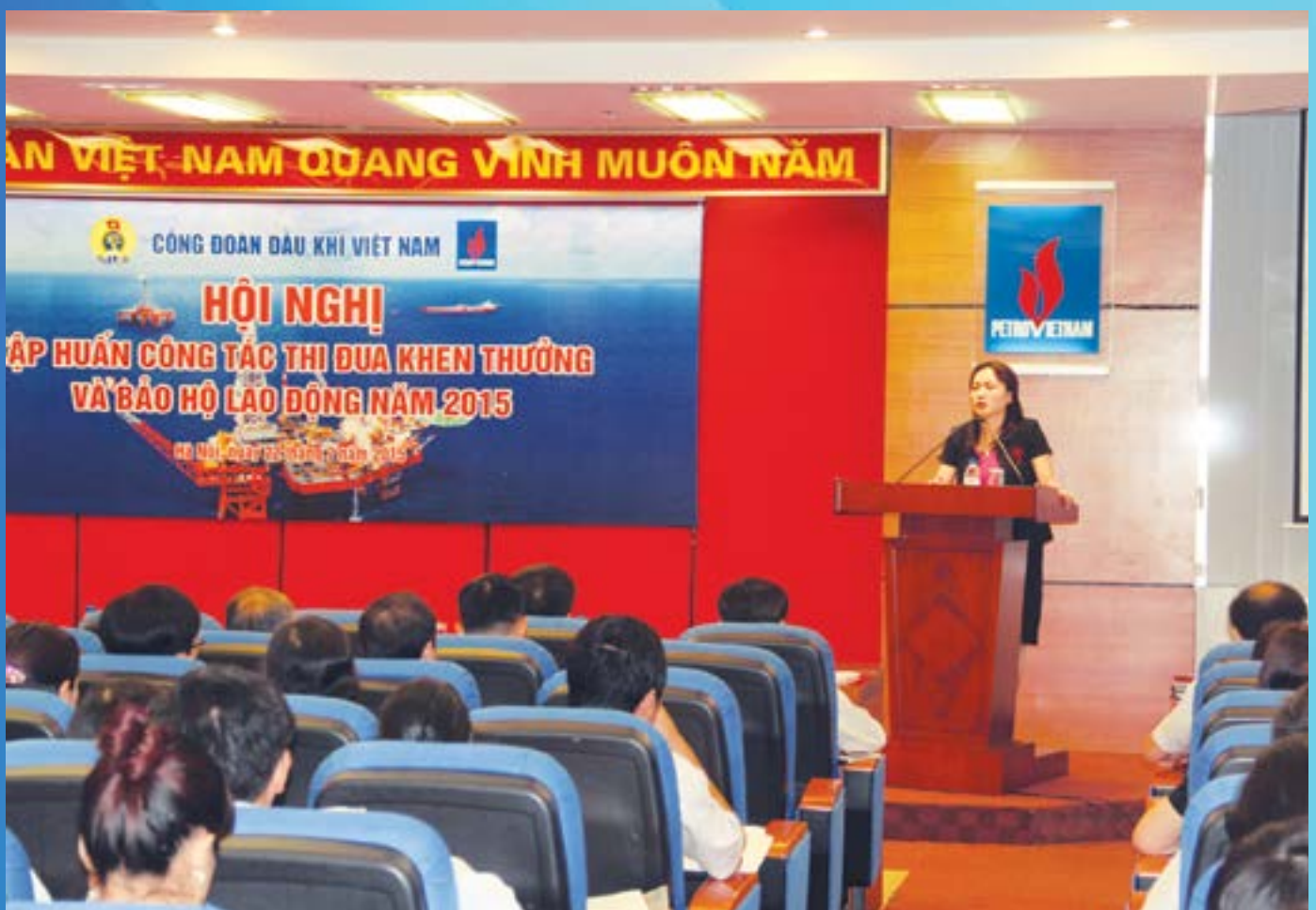
Toàn cảnh Hội nghị Tập huấn công tác Thi đua khen thưởng và Bảo hộ Lao động năm 2015