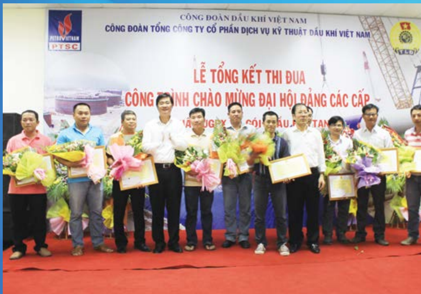
CĐ DKVN tặng Bằng khen cho các cá nhân của hai dự án thuộc TCT CP Dịch vụ Kỹ thuật Dầu khí Việt Nam (PTSC)