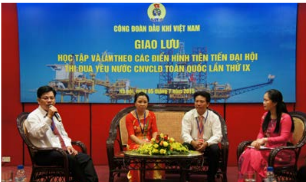
Phân giao lưu với các điển hình tiên tiến

Cũng trong khuôn khổ buổi gặp mặt các đại biểu đã đi tham quan phòng Truyền thống ngành Dầu khí và nhận quà lưu niệm từ Công đoàn Dầu khí Việt Nam. 🌸