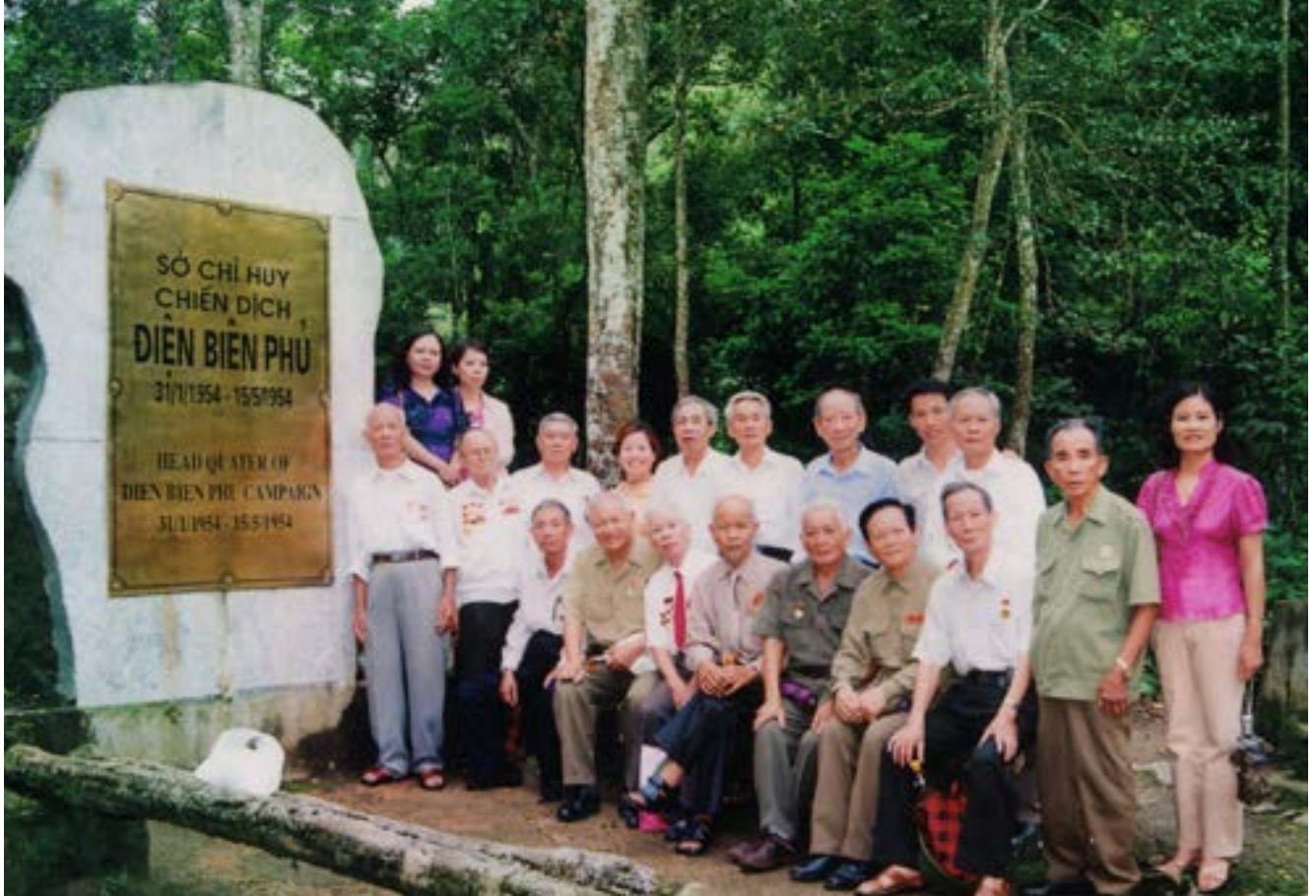
Đoàn cán bộ của TD DKVN cùng các cán bộ hưu trí đã từng là Chiến sỹ Điện Biên chụp ảnh lưu niệm