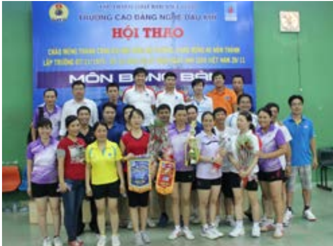
Các VĐV bóng bàn chụp hình lưu niệm