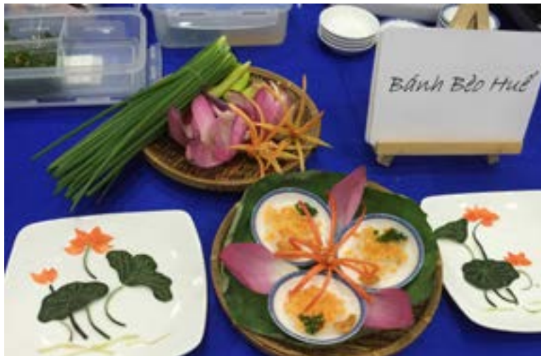
Tác phẩm đạt giải Nhất tại Hội thi

Như thế, niềm vui và trách nhiệm đối với phong trào sẽ là những người đồng hành của một hội thi tròn đẹp và hấp dẫn mang đậm hương vị quê nhà, ghi nhận những bàn tay PV GAS khéo léo và tràn ngập mến thương. 🌸