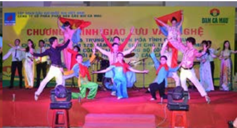
Một số hình ảnh ghi lại tại đêm giao lưu