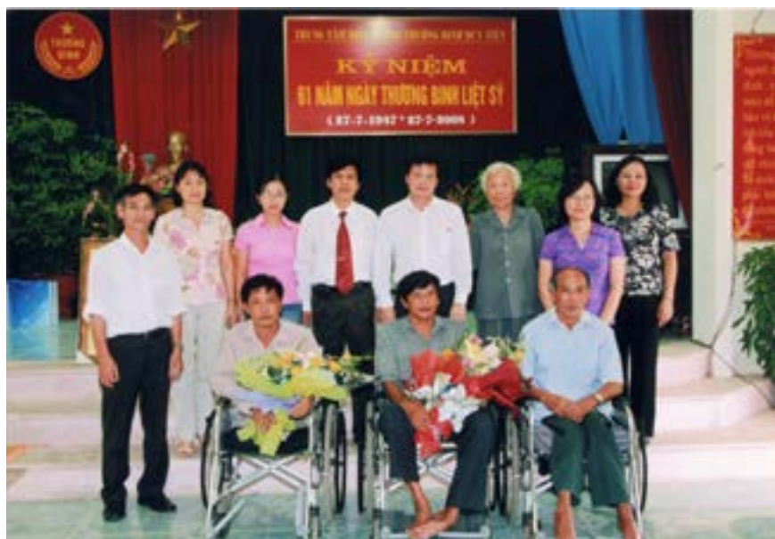
Đoàn cán bộ của Tập đoàn - CĐDK tặng quà 27/7 tại Duy Tiên, Hà Nam