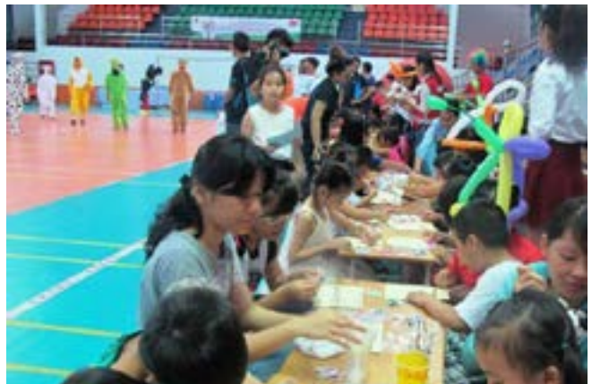
Các hoạt động trong Ngày hội gia đình Vietsovpetro năm 2015