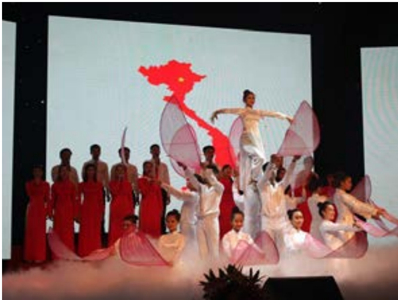
Tiết mục mở màn của PVOIL Hà Nội “Đất nước hôm nay”

hiện được tinh thần Một PV OIL vượt khó, hiệu quả và trách nhiệm để mang đến hội diễn những tiết mục văn nghệ nhiều màu sắc! Nhiều diễn viên từ sau Hội diễn này chắc chắn sẽ ngày càng yêu thích ca hát hơn và mang lòng nhiệt tình, tâm huyết đó hòa quyện vào chính công việc hàng ngày của mình! Cũng từ Hội diễn này, CĐ TCT sẽ lựa chọn các giọng ca xuất sắc từ các đơn vị để chuẩn bị chương trình tham gia Hội diễn "Những người đi tìm lửa" năm 2015 của ngành Dầu khí chào mừng kỷ niệm 40 năm Ngày Thành lập ngành và tiến tới chào mừng Đại hội Đại biểu Đảng bộ Tập đoàn dầu khí Việt Nam lần thứ II. 🌸