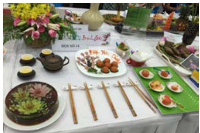
Tác phẩm ấn tượng tại Hội thi