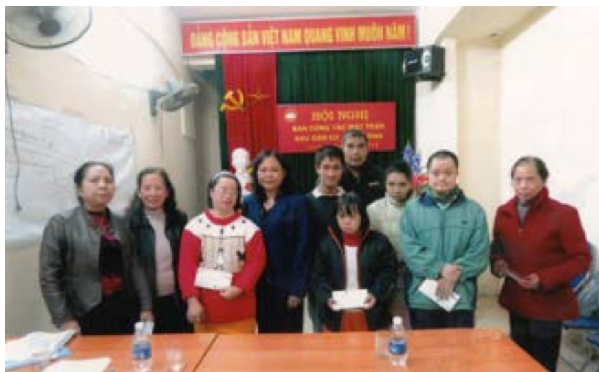
Tặng quà các cháu bị chất độc Dioxin - Phường Láng Hạ - Quận Ba Đình - Hà Nội

Với tất cả những tình cảm trân trọng và lòng biết ơn sâu sắc của những người làm Dầu khí nhằm động viên, chia sẻ, xoa dịu bớt những nỗi đau, những mất mát về thể xác cũng như những mất mát về tinh thần của các thương binh, gia đình liệt sĩ và các mẹ Việt Nam Anh hùng. Chúng tôi mong muốn và hy vọng với những việc làm trên của ngành Dầu khí, của những người lao động Dầu khí sẽ còn rất nhiều những tổ chức, cá nhân cùng nhau quan tâm và chia sẻ để cuộc sống của các gia đình chính sách ngày càng tốt hơn. 🌸