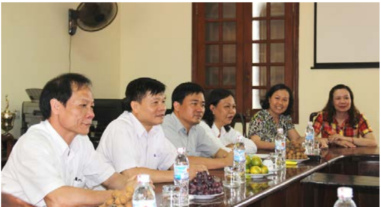
Đoàn công tác CĐ DKVN làm việc với CĐ DMC

- Định kỳ hằng năm sơ kết đánh giá kết quả thực hiện Chương trình “Mái ấm Công đoàn Dầu khí Việt Nam” báo cáo Đảng ủy Tập đoàn và Tổng Liên đoàn; đồng thời biểu dương khen thưởng các tập thể, cá nhân có thành tích xuất sắc trong quá trình thực hiện. Đồng thời xem xét điều chỉnh Điều kiện được hỗ trợ nhằm hỗ trợ kịp thời các đối tượng có hoàn cảnh khó khăn về nhà ở. 🌸