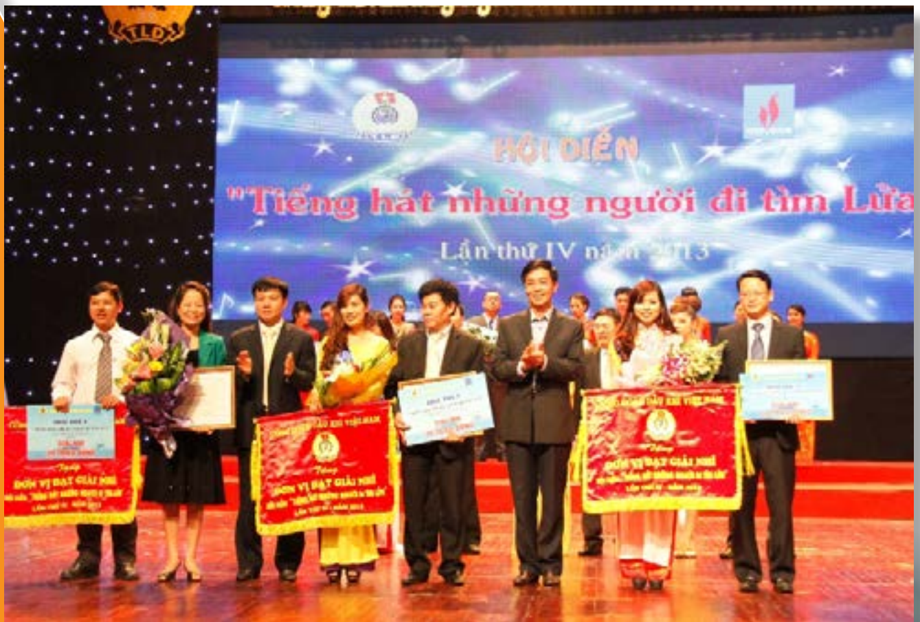
Lãnh đạo TĐ DKQGVN và Đại diện Đ DKVN trao giải tại Hội diễn "Tiếng hát những người đi tìm lửa" lần thứ IV năm 2013

UVTV, Trưởng Ban Tuyên giáo Nữ công Đ DKVN