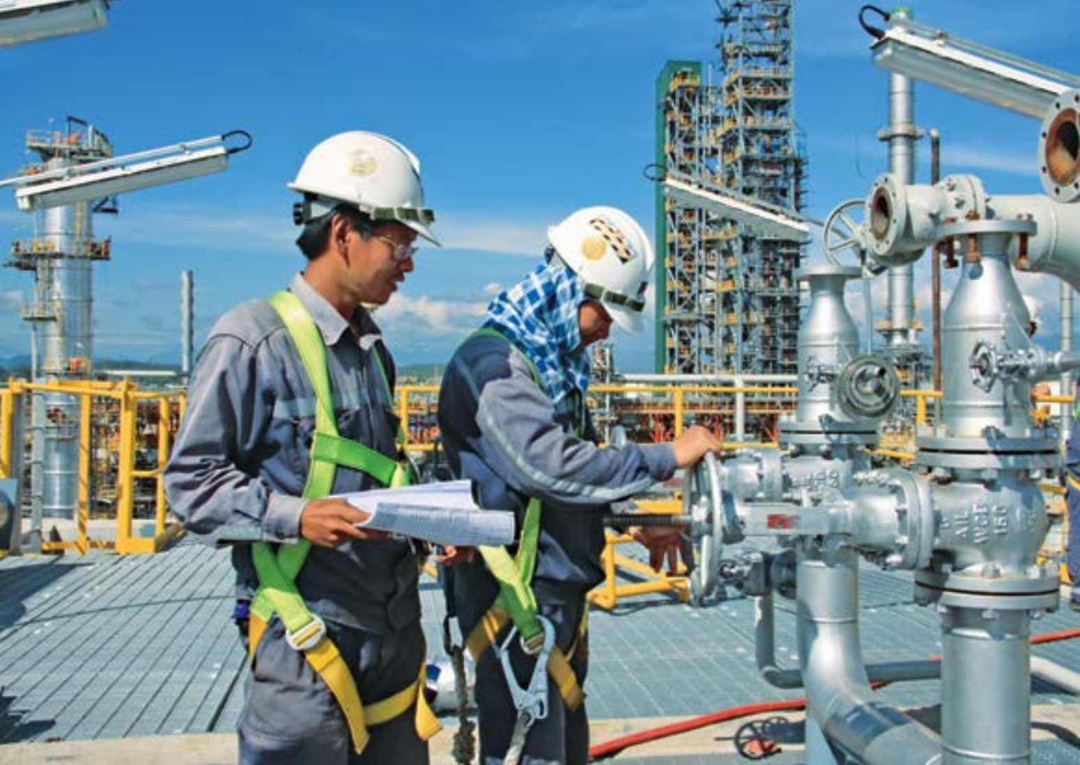
Công nhân đang kiểm tra thiết bị ở BSR