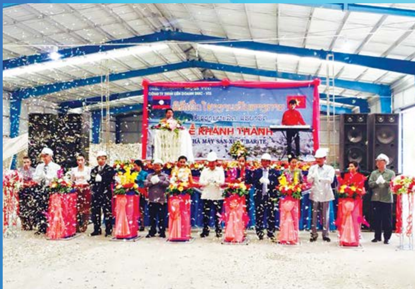
Lễ Khánh thành Nhà máy sản xuất Barite của TCT DMC và Tập đoàn VTS tại Lào