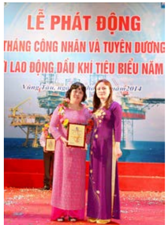
Lãnh đạo CĐ DKVN trao biểu trưng cho Người lao động Dầu khí tiêu biểu năm 2014

Có thể khẳng định công tác thi đua, khen thưởng có vai trò rất quan trọng, đánh dấu một bước ngoặt phát triển và đổi mới cả về nhận thức và hoạt động của hệ thống Công đoàn trong ngành Dầu khí, làm cho phong trào thi đua yêu nước ngày càng trở thành động lực quan trọng thúc đẩy toàn thể cán bộ CNVCLĐ tham gia góp phần hoàn thành xuất sắc nhiệm vụ chính trị của từng cơ quan, đơn vị. Các cấp ủy Đảng, chính quyền có những chỉ đạo kịp thời trong công tác thi đua, khen thưởng, bên cạnh