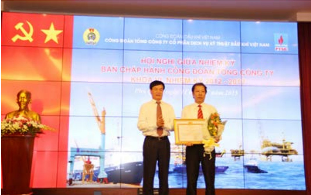
Công đoàn Tổng công ty PTSC khen thưởng các tập thể, cá nhân có thành tích trong phong trào thi đua