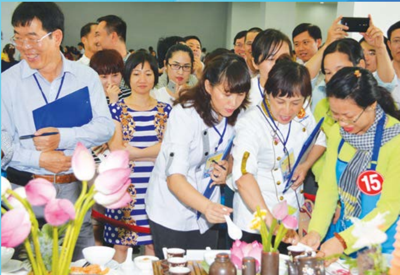
Hội thi "Bếp yêu thương" của Tổng công ty Khí Việt Nam (PVGas)