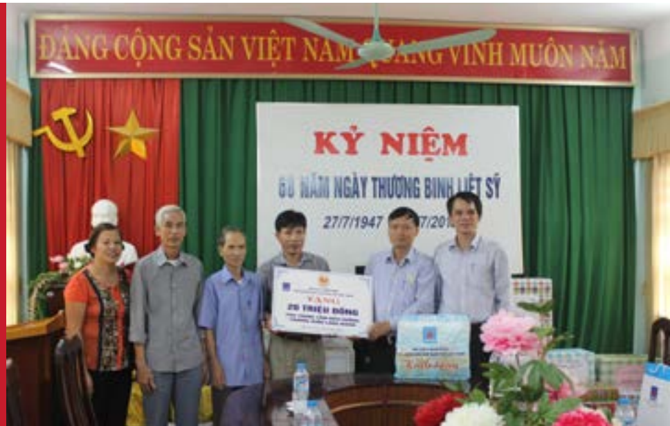
Đại diện Hội CCB Tập đoàn DKQGVN và CĐ DKVN trao quà cho các thương bệnh binh tại Trung tâm Điều dưỡng Thương bệnh binh Lạng Giang

Trong những ngày tháng 7 lịch sử, bày tỏ sự tri ân, tiếp nối đạo lý “Uống nước nhớ nguồn”, “Ăn quả nhớ kẻ trồng cây”, cũng như trên khắp các vùng miền của Tổ quốc đang diễn ra nhiều hoạt động thiết thực ý nghĩa đối với thương binh, người có công và gia đình liệt sỹ, Hội Cựu chiến binh Tập đoàn Dầu khí Quốc gia Việt Nam phối hợp với Công đoàn Dầu khí Việt Nam để cao đạo lý truyền thống “Uống nước nhớ nguồn” tổ chức các đoàn công tác đến thăm, động viên, tri ân các thương binh, bệnh binh nặng tại các trung tâm điều dưỡng thương, bệnh binh nặng.