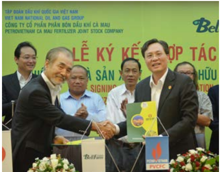
PVCFC ký kết hợp tác nghiên cứu và sản xuất phân hữu cơ vi sinh với Bellfarm - Nhật Bản

Thỏa thuận hợp tác giữa PVCFC và Bellfarm là một trong những