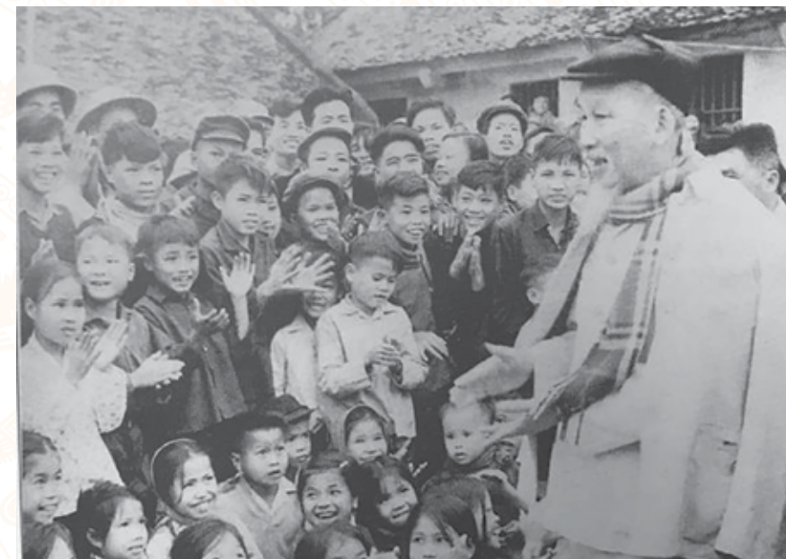
Bác Hồ nói chuyện với các cháu thiếu nhi trong dịp Người về thăm và chúc Tết đồng bào tỉnh Hà Bắc (Xuân Đình Mùi, ngày 9/2/1967)

Trong dịp Tết Nguyên đán Mậu Thân 1968, Bác không ở trong nước vì từ ngày 31/12/1967, Bác đã sang Trung Quốc để chữa bệnh ở một địa điểm gần