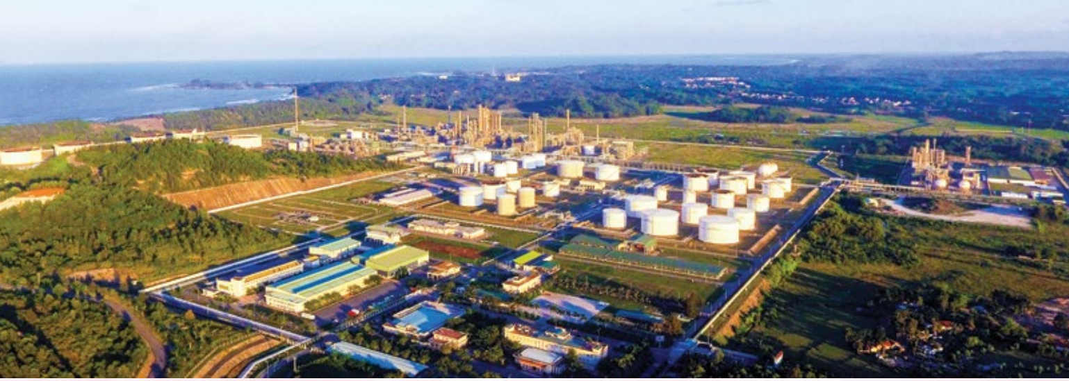
Toàn cảnh NMLD Dung Quất