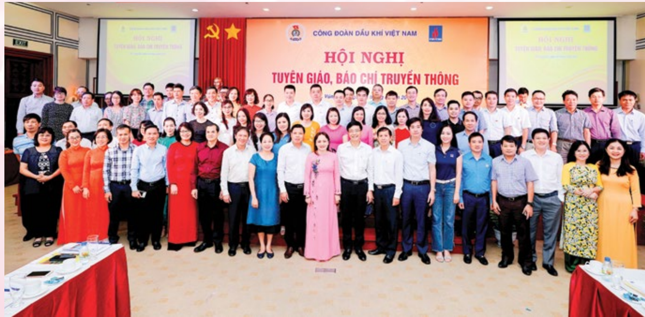
Các đại biểu tham dự Hội nghị Tuyên giáo, báo chí truyền thông chụp ảnh lưu niệm với lãnh đạo CĐ DKVN

Cổ vũ tinh thần người lao động vượt khó, tích cực thi đua là một nhiệm vụ quan trọng của tổ chức công đoàn, công tác tuyên giáo đã có những bước phát triển đáng kể, đóng góp không nhỏ vào hoạt động chung của CĐ DKVN. Đặc biệt trong bối cảnh nền kinh tế có nhiều khó khăn, tình hình giá dầu diễn biến phức tạp, việc Việt Nam tham gia Hiệp định Đối tác toàn diện và tiến bộ xuyên Thái Bình Dương (CP TPP)... công tác tuyên giáo lại càng trở nên quan trọng, giúp người lao động ổn định tư tưởng, góp phần giúp đơn vị và ngành Dầu khí vượt qua trở ngại trước mắt.