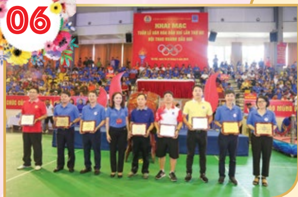
Khai mạc Tuần lễ Văn hóa Dầu khí lần thứ XII

Khai mạc Tuần lễ Văn hóa Dầu khí lần thứ XII, tôn vinh các giá trị Văn hóa Dầu khí trong suốt quá trình lịch sử mạnh mẽ truyền thống của những người đi tìm lửa, đã chung sức, đồng lòng thực hiện tốt mọi nhiệm vụ, hoàn thành vượt mức các chỉ tiêu, kế hoạch do Chính phủ giao. Trao tặng biểu trưng tuyên dương các đơn vị tiêu biểu trong phong trào xây dựng đời sống văn hóa cơ sở năm 2019.