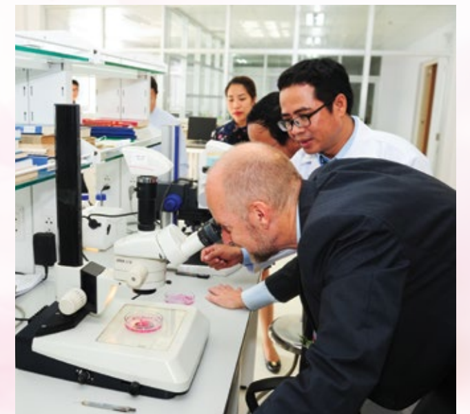
Các chuyên gia nước ngoài thăm Phòng Thí nghiệm của VPI