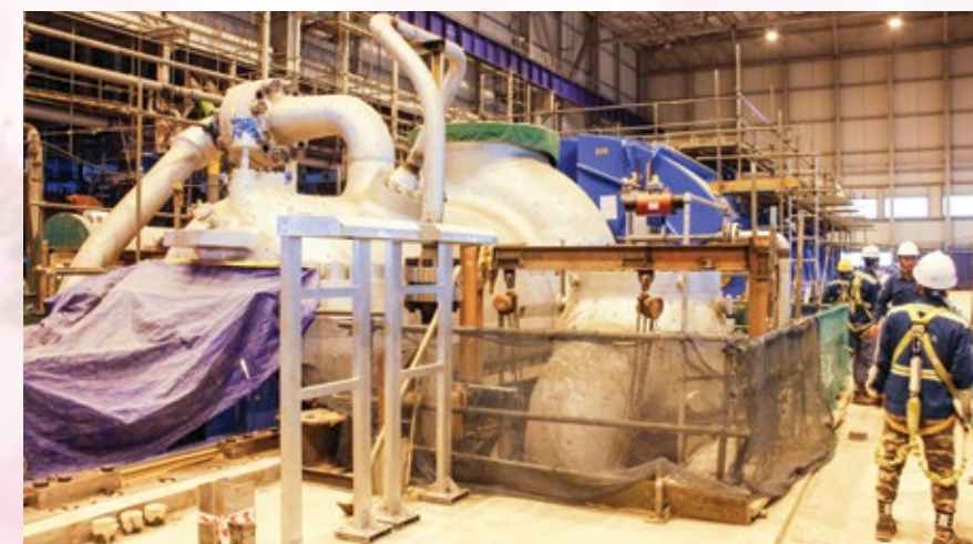
Trên công trường Dự án NMNĐ Sông Hậu 1