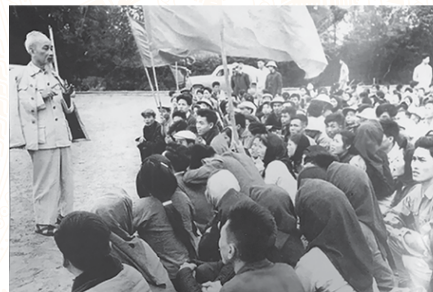
Bác Hồ nói chuyện với đồng bào xã Phú Diễn, huyện Từ Liêm, Hà Nội, sau buổi trồng cây mùa xuân, ngày 31/1/1965

Bắc Kinh nên Người đón Tết bên nước bạn. Đúng giao thừa, Người và đồng chí thư ký mở Đài Phát thanh nghe thơ chúc Tết và đợi tin của cuộc Tổng tấn công, nổi dậy của quân và dân miền Nam.