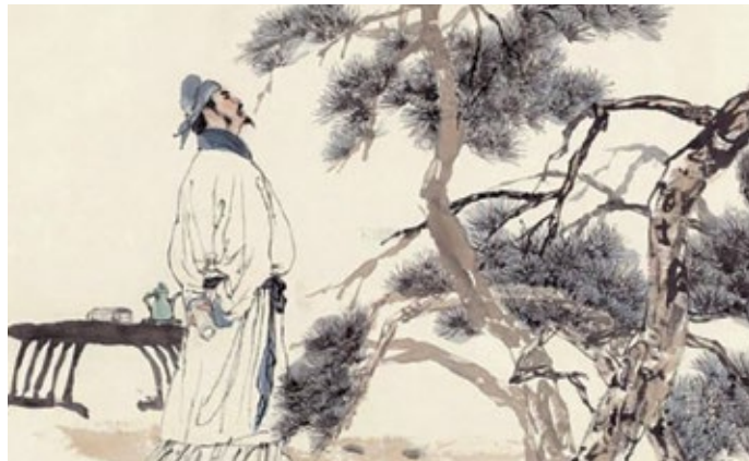
Tiên tiu Lý Bạch