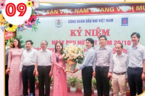
Lãnh đạo PVN chúc mừng nữ công nhân, viên chức lao động ngành Dầu khí nhân kỷ niệm 20/10

Tổ chức hiệu quả các hoạt động cho nữ công nhân lao động, kỷ niệm Ngày Quốc tế Phụ nữ (8/3), Ngày Quốc tế Hạnh phúc (20/3), Ngày Phụ nữ Việt Nam (20/10), ôn lại truyền thống lịch sử đầy tự hào của các thế hệ phụ nữ Việt Nam; nói chuyện chuyên đề "Bác Hồ với phụ nữ", đây là chuỗi các hoạt động sinh hoạt sâu rộng trong nữ CNLD ngành Dầu khí nhằm phát huy tinh thần, truyền thống văn hóa năng động, sáng tạo của những người đi tìm lửa để có những đóng góp quan trọng vào sự phát triển bền vững của các đơn vị và Tập đoàn.