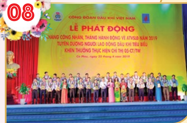
Lễ phát động Tháng Công nhân năm 2019 và Tuyên dương người lao động Dầu khí tiêu biểu

Đẩy mạnh phong trào thi đua yêu nước, lao động giỏi, lao động sáng tạo, trên các dự án, công trình trọng điểm và nhiều các phong trào thi đua chuyên đề, tạo động lực mạnh mẽ cho người lao động nỗ lực phấn đấu, vượt qua mọi khó khăn, quyết tâm thực hiện hoàn thành tốt mọi nhiệm vụ được giao. Biểu dương, tôn vinh 60 người lao động Dầu khí; tuyên dương, khen thưởng 26 cá nhân tiêu biểu trong thực hiện Chỉ thị 05-CT/TW của Bộ Chính trị về "Tiếp tục đẩy mạnh học tập và làm theo tư tưởng, đạo đức, phong cách Hồ Chí Minh".