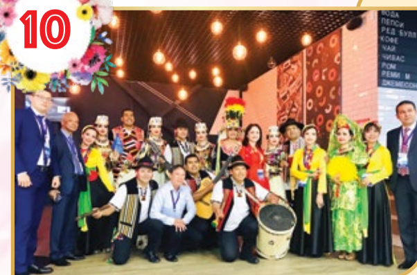
Lãnh đạo CĐ DKVN và đoàn văn nghệ Sen Việt tham gia Festival quốc tế Ngọn đuốc 2019 tại Sochi - Liên bang Nga

Phát huy hiệu quả hoạt động đối ngoại, tổ chức Đoàn văn nghệ "Sen Việt" tham gia và đạt 1 giải đặc biệt tại Festival quốc tế "Ngọn đuốc" 2019, thành phố Sochi - Liên bang Nga. Phối hợp với Công đoàn Công nghiệp và Sản xuất toàn cầu (IndustriALL) tổ chức tập huấn về tăng cường năng lực cho chủ tịch công đoàn cơ sở, cán bộ công đoàn chủ chốt. Tham dự Hội nghị Phụ nữ thế giới tại Geneve Thụy Sĩ, tại Hội nghị Phụ nữ thế giới, Chủ tịch Công đoàn Dầu khí Việt Nam đã làm việc với các đoàn của Nga, Belarus, Na Uy, Đan Mạch, Nhật Bản, Canada, Áo, Thổ Nhĩ Kỳ, trao đổi kinh nghiệm với Công đoàn các nước.