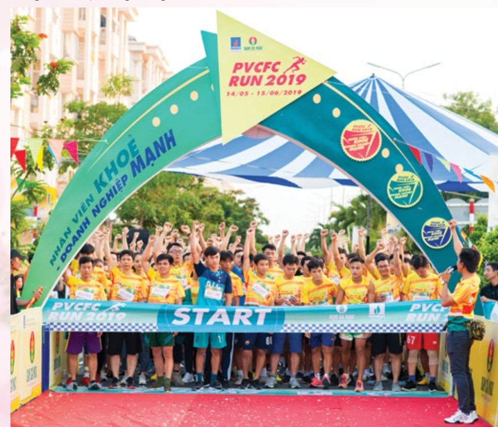
Các VĐV tham gia giải chạy PVCFC RUN

Một tinh thần minh mẫn trong một cơ thể tráng kiện. Đạm Cà Mau duy trì tốt công tác chăm sóc sức khỏe cho người lao động, thực hiện chế độ thăm khám định kỳ, các chương trình hội thao, trekking, câu lạc bộ, đội nhóm... nâng cao ý thức rèn luyện thể lực, giao lưu chia sẻ sau giờ làm việc căng thẳng.