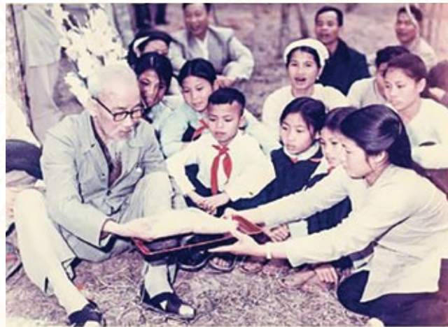
Bác Hồ và các cháu thiếu nhi Vật Lại, Ba Vì, Hà Tây (nay là Hà Nội) sau buổi trồng cây ngày mừng 1 Tết Kỷ Dậu 1969

Khi lên dốc xe không tiến, thậm chí còn tụt lùi, đồng