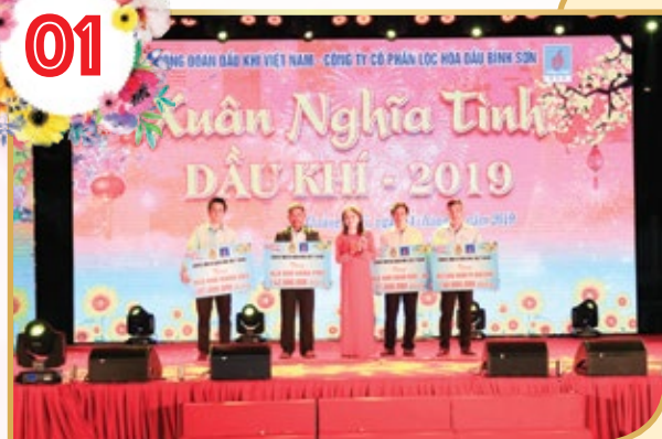
Tết Sum vầy - Xuân nghĩa tình Dầu khí năm 2019

Chương trình "Tết Sum vầy - Xuân nghĩa tình Dầu khí" năm 2019 được tổ chức tại 5 khu vực để chăm lo thăm hỏi, động viên, tặng quà cho đoàn viên, cán bộ hưu trí, người lao động có hoàn cảnh khó khăn, mắc bệnh hiểm nghèo, thăm tặng quà cho các gia đình chính sách, các Bà mẹ Việt Nam anh hùng, các hộ nghèo tại những địa phương nơi có nhà máy, dự án trọng điểm của Tập đoàn với tổng kinh phí gần 60 tỷ đồng.