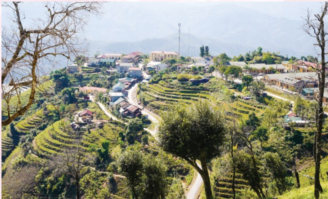
Trung tâm xã Thu Lũm

Tôi đến với Thần Đá Trắng ở bản Pá Thẳng, xã Thu Lũm, huyện Mường Tè, tỉnh Lai Châu vào một tiết nghiêm hàn. Gió bắc thổi hun hút lạnh rét tê tái.