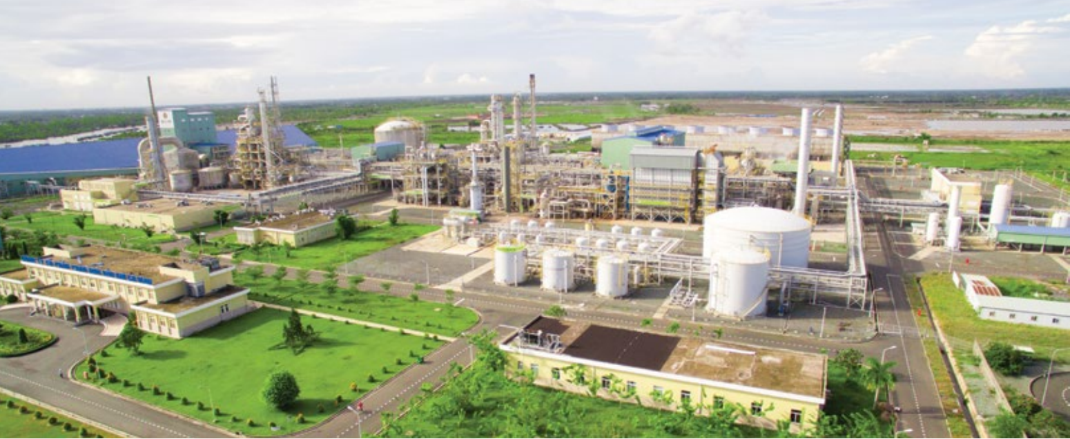
Nhà máy Đạm Cà Mau