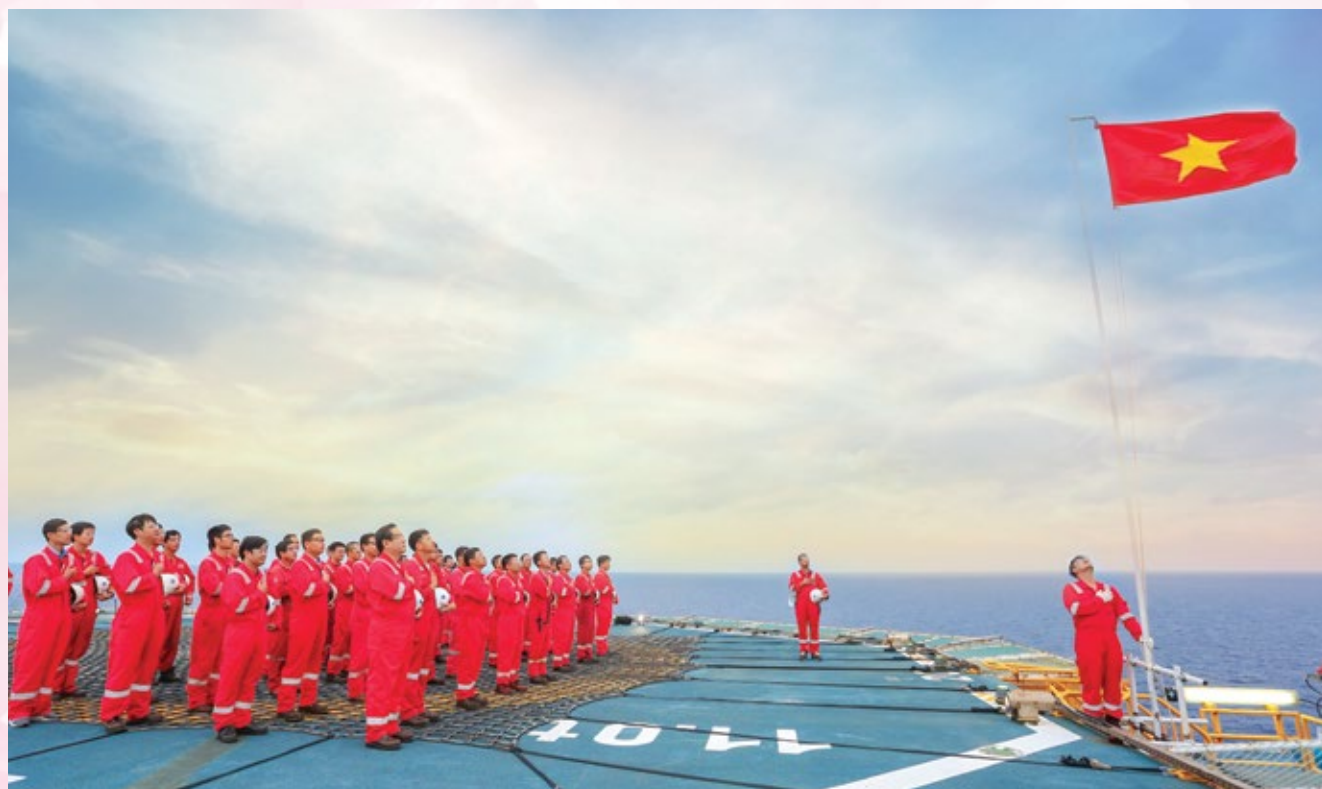
Lễ chào cờ trên giàn Hải Thạch - Mộc Tinh

Năm 2020, cả nước chào đón năm mới trong không khí vui tươi, tự hào hướng về kỷ niệm 90 năm Ngày Thành lập Đảng Cộng sản Việt Nam (1930 - 2020). Để có niềm tự hào trọn vẹn, một trách nhiệm trọn vẹn với Đảng, với Tổ quốc, với dân tộc, chúng ta cùng ôn lại những dấu mốc quan trọng về sự ra đời của Đảng Cộng sản Việt Nam, những thành tựu quý báu của cách mạng Việt Nam dưới sự lãnh đạo của Đảng trong 90 năm qua.