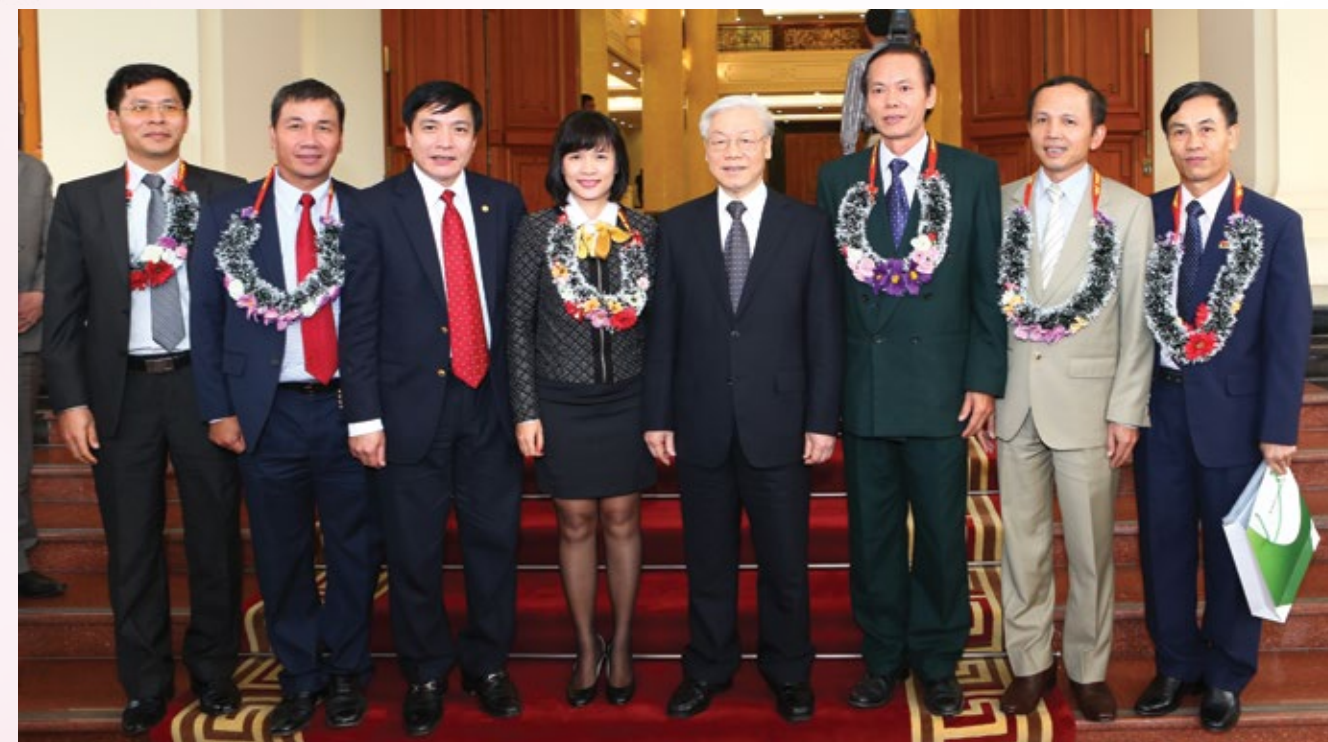
Tổng Bí thư Nguyễn Phú Trọng gặp mặt các Bí thư chi bộ Dầu khí tiêu biểu (2014)

Từ sau Đại hội VI (12/1986) Đảng và nhân dân ta tập trung thực