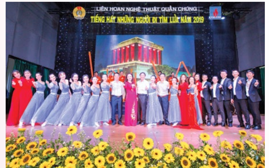
Đội văn nghệ Vietsovpetro tham gia Liên hoan Tiếng hát những người đi tìm lửa năm 2019

hoạt động thiết thực, từ đó tạo mối quan hệ đoàn kết, thống nhất trong Vietsovpetro như: Bước sang năm 2020, một năm có nhiều sự kiện quan trọng của đất nước, của ngành và của Vietsovpetro với nhiều cơ hội và thách thức. Từ thực tiễn hoạt động và dự báo tình hình, Công đoàn Vietsovpetro xác định nhiệm vụ trọng tâm năm 2020 gồm một số nội dung trọng tâm: