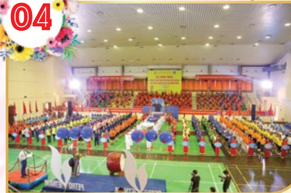
Toàn cảnh Khai mạc Hội thao ngành Dầu khí năm 2019 khu vực phía Bắc

Hội thao ngành Dầu khí năm 2019, khu vực phía Bắc và khu vực phía Nam, gồm 8 bộ môn thi đấu với sự tham gia của gần 800 vận động viên đến từ 23 đoàn với các nội dung: Kéo co nam, kéo co nữ, cờ tướng, cờ vua, cầu lông, bóng bàn, tennis, bơi lội và điền kinh. Hội thao ngành Dầu khí 2019 là sân chơi bổ ích có nhiều ý nghĩa, phát huy tinh thần đoàn kết, giao lưu kết nối, học tập kinh nghiệm giữa các đơn vị và là môi trường lành mạnh cho đội ngũ người lao động tích cực rèn luyện thân thể theo gương Bác Hồ vĩ đại, các hoạt động thể dục thể thao nhằm nâng cao thể trạng, tầm vóc và có thêm trí lực, động viên tinh thần người lao động hăng say trong lao động sản xuất, góp phần xây dựng và phát triển Tập đoàn Dầu khí Việt Nam.