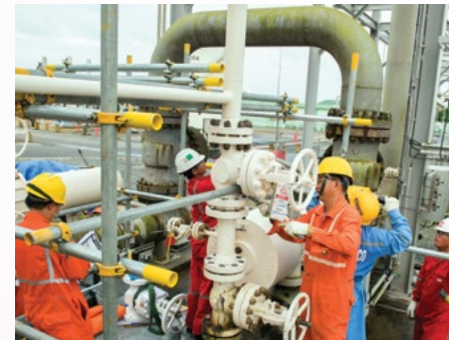
NLĐ Công ty NCSP thực hiện công tác bảo dưỡng sửa chữa định kỳ

Năm 2020 là năm vận hành liên tục thứ 18 của hệ thống đường ống khí Nam Côn Sơn, bên cạnh những thuận lợi về trình độ, năng lực của tập thể CBCNV NCSP sau 17 năm điều hành, vận hành hệ thống khí có quy mô lớn ngày càng được củng cố và nâng cao; Hệ thống quản lý, các quy trình, quy định liên quan đến an toàn, vận hành, bảo trì bảo dưỡng, nhân sự, mua sắm... đã cơ bản hoàn thiện và cập nhật phù hợp với tình hình mới; Sự ủng hộ tích cực của các đối tác trong việc duy trì một đơn vị vận hành trong lĩnh vực khí đạt đẳng cấp khu vực, quốc tế..., NCSP cũng đối mặt với không ít khó khăn, do tình hình chung của công nghiệp dầu khí trên thế giới hiện vẫn chưa ổn định và những khó khăn chung của ngành Dầu khí trong nước. Bên cạnh đó, nhiều hạng mục công trình chính của NCSP đã qua hơn 17 năm hoạt động, công việc bảo dưỡng sửa chữa lớn phát sinh ngày một nhiều.