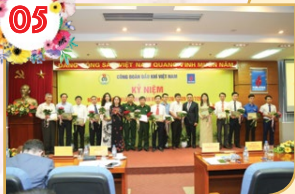
Lãnh đạo PVN và CĐ DKVN tặng kỷ niệm chương tôn vinh lãnh đạo công đoàn các đơn vị có thành tích và cống hiến xuất sắc

Chương trình kỷ niệm 90 năm Ngày Thành lập Công đoàn Việt Nam (28/7); 60 năm ngành Dầu khí thực hiện ý nguyện của Bác Hồ (23/7). Đây là đợt sinh hoạt chính trị sâu rộng, tuyên truyền giáo dục truyền thống, khơi dậy niềm tự hào của những người đi tìm lửa. Thực hiện chương trình an sinh xã hội tại tỉnh Thái Bình. Tri ân những cống hiến của các lớp thế hệ người Dầu khí, biểu dương, khen thưởng những tấm gương "người tốt, việc tốt" và tập thể, cá nhân điển hình trong CBCNLD.