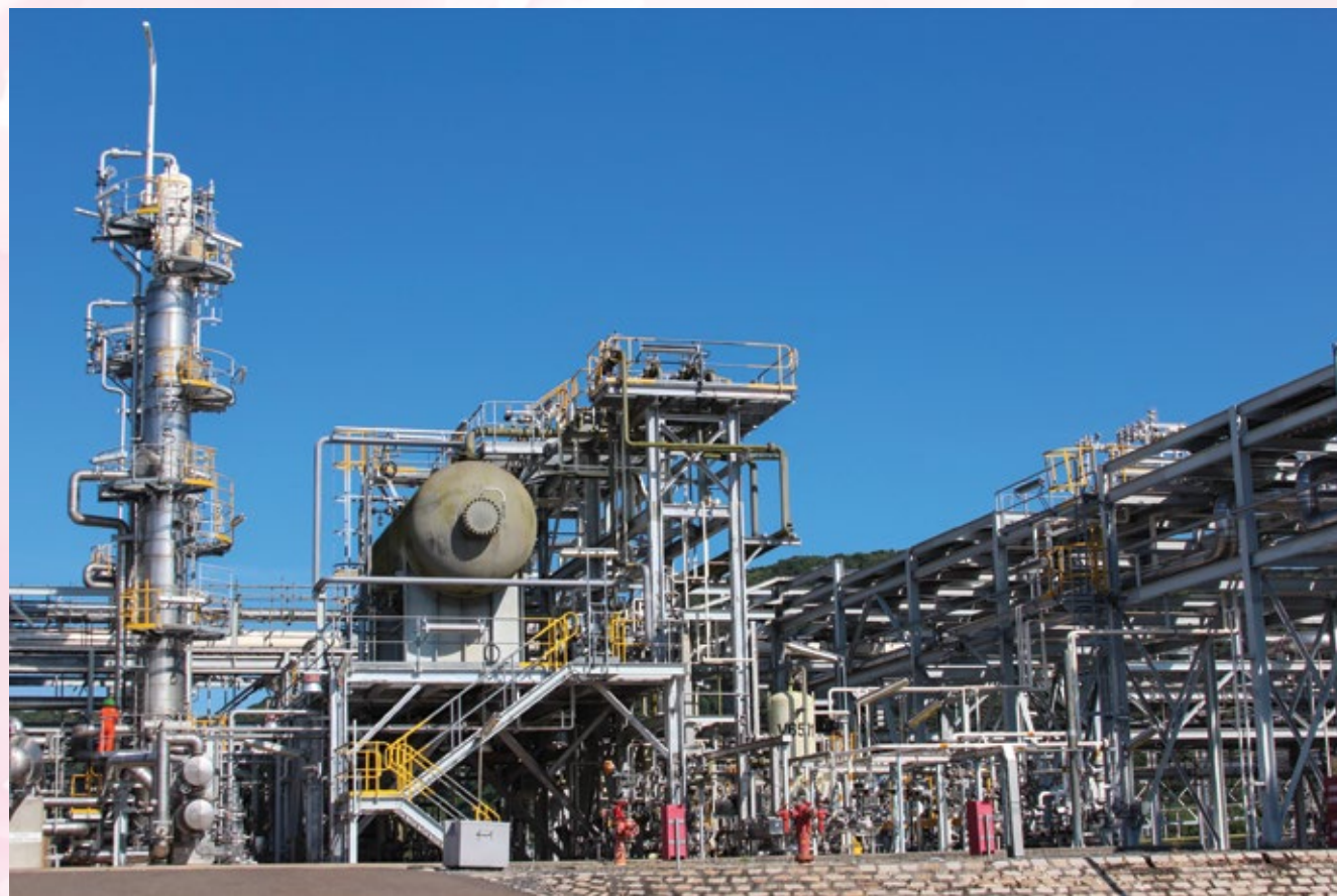
Nhà máy NCSP

Ngày 4/12/2019, Công ty Đường ống khí Nam Côn Sơn (NCSP) đã tổ chức Hội nghị Người lao động, tổng kết hoạt động sản xuất kinh doanh năm 2019 và triển khai kế hoạch năm 2020.