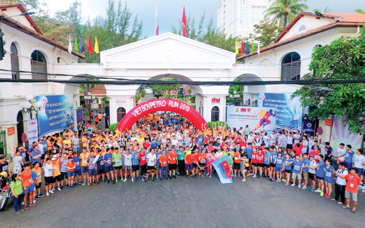
Giải thể thao "Vietsovpetro run 2019"