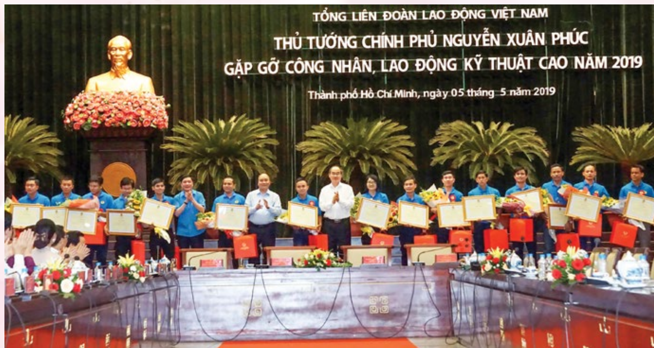
Các công nhân lao động kỹ thuật cao vinh dự được nhận quà của Thủ tướng Chính phủ và nhận Bằng khen của Tổng LĐLĐ Việt Nam