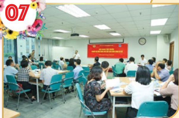
Hội nghị Tập huấn nghiệp vụ công tác công đoàn cho các chủ tịch CĐCS phía Bắc

Nâng cao chất lượng xây dựng tổ chức công đoàn vững mạnh, đẩy mạnh công tác đào tạo, bồi dưỡng nghiệp vụ cho đội ngũ cán bộ công đoàn cơ sở và công đoàn cấp trên trực tiếp cơ sở theo các chuyên đề đáp ứng yêu cầu trong tình hình mới. Tập trung nâng cao trình độ chuyên môn, chính trị, chuẩn hóa đội ngũ cán bộ công đoàn chuyên trách; tổ chức 16 lớp tập huấn cho hơn 1.100 cán bộ công đoàn các cấp về những điểm mới của Luật BHXH, kỹ năng sử dụng phần mềm quản lý điều hành, tư vấn pháp luật, đối thoại, đàm phán, thương lượng, đại diện bảo vệ quyền lợi người lao động.