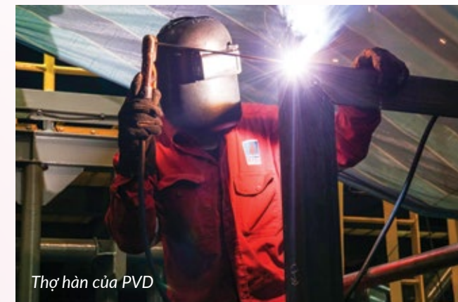
Thợ hàn của PVD

Kết thúc Hội thi, Tập đoàn Dầu khí Việt Nam và Công đoàn Dầu khí Việt Nam đã trao giải đồng đội như sau: Giải Nhất cho (PVD); giải Nhì cho (PTSC); giải