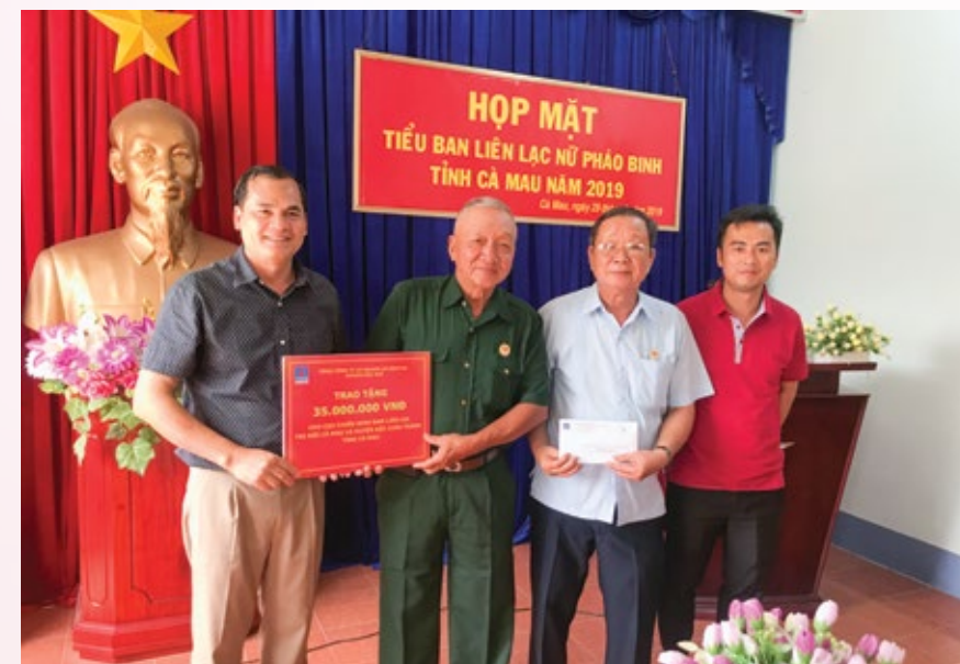
Công đoàn PV Drilling trao tặng quà cho các cựu chiến binh

Nhân chuyến công tác về Cà Mau, đoàn đã đến thăm hỏi, tặng quà để bày tỏ lòng biết ơn sâu sắc trước những cống hiến của các cô thuộc Trung đội nữ Pháo binh tỉnh Cà Mau và các cựu chiến binh (CCB) thuộc Ban Liên lạc Thị đội Cà Mau là những người trực tiếp tham gia chiến đấu chống giặc ngoại xâm đã xây đắp nên phẩm chất "Bộ đội Cụ Hồ", giá trị cao đẹp của người lính nhiệt huyết, gan dạ, góp phần không nhỏ vào công cuộc giải phóng đất nước và xây dựng bảo vệ Tổ quốc. Sau ngày miền Nam hoàn toàn giải phóng, mỗi người lính, mỗi CCB, mỗi hoàn cảnh... nhưng phần lớn còn nhiều khó khăn trong cuộc sống. Nhân dịp này Công đoàn PVD trao tặng 50 triệu đồng cho các CCB, trong đó 15 triệu cho các cô thuộc Trung đội nữ Pháo binh tỉnh Cà Mau và 35 triệu cho các CCB thuộc Ban Liên lạc Thị đội Cà Mau. Đây là hoạt động mang ý nghĩa nhân văn sâu sắc với tinh thần sẻ chia, đóng góp thiết thực trong công tác đền ơn đáp nghĩa của PVD đối với các CCB của tỉnh Cà Mau.