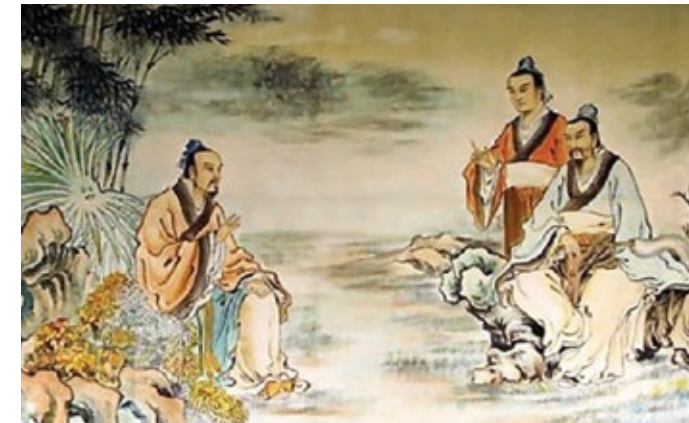
Bạch Cư Dị uống rượu luận thơ