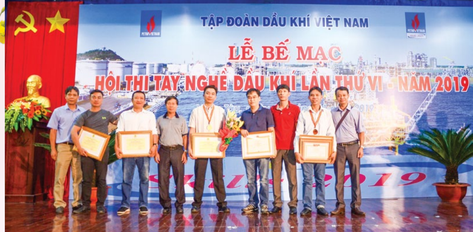
Lãnh đạo PV Drilling và các thí sinh trong Đội thi chụp hình lưu niệm tại lễ bế mạc Hội thi Tay nghề Dầu khí 2019

Về kết quả thi không nằm ngoài dự đoán của BTC Hội thi tay nghề của PV Drilling. Sau mỗi ngày thi, thấy các thí sinh đều rất rạng rỡ, vui vẻ, chúng tôi yên tâm rằng các thí sinh đã làm bài bằng hết khả năng, trí tuệ của mình. PV Drilling là một tập thể đoàn kết, cho dù thời gian thi của các thí sinh là khác nhau, trải dài trong 3 ngày từ 20 đến 22/11, các thí sinh dù chưa thi hay đã thi