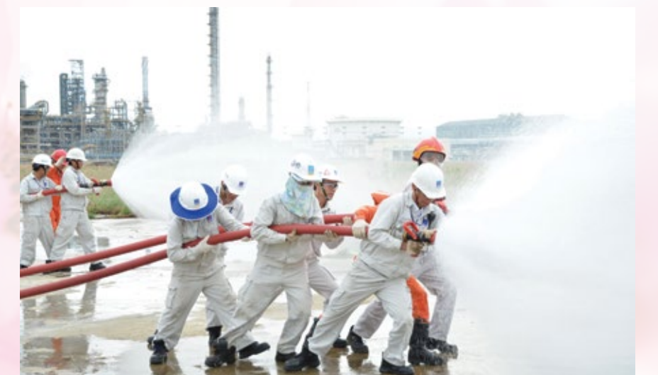
Luyện tập phòng cháy chữa cháy ở BSR