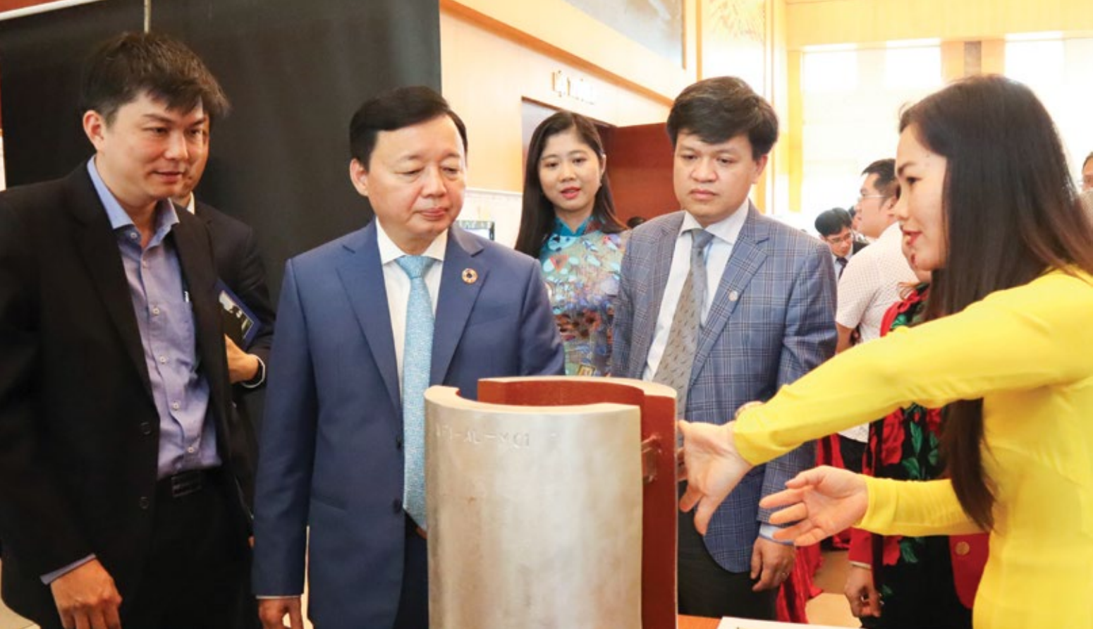
Bộ trưởng Bộ Tài nguyên và Môi trường Trần Hồng Hà nghe giới thiệu về sản phẩm Sacrificial anode do VPI nghiên cứu sản xuất