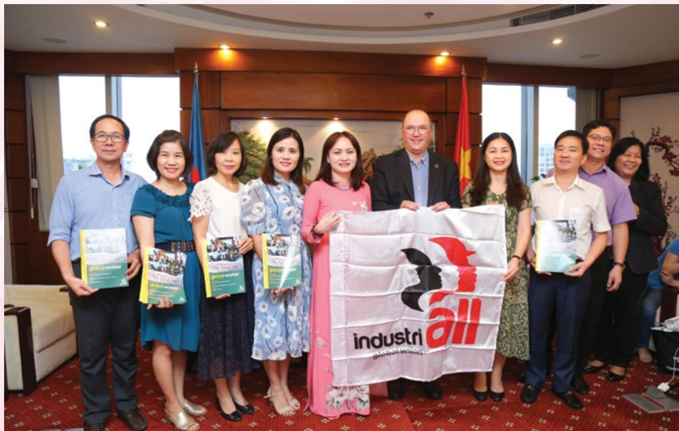
Lãnh đạo CĐ DKVN chụp ảnh lưu niệm với Tổng Thư ký Công đoàn IndustriALL