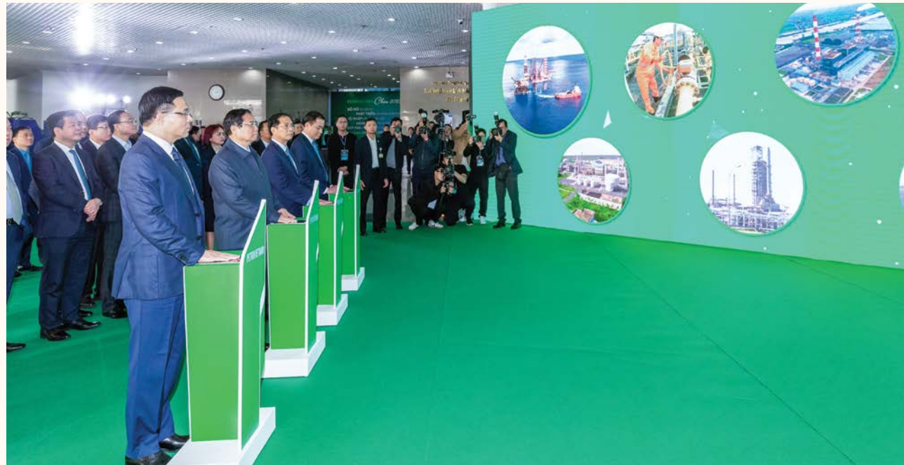
Thủ tướng Chính phủ Phạm Minh Chính, Phó Thủ tướng Chính phủ Bùi Thanh Sơn nghe lãnh đạo Petrovietnam giới thiệu về các lĩnh vực hoạt động của Tập đoàn và định hướng phát triển, chuyển dịch trong chặng đường mới

đẩy mạnh đổi mới sáng tạo, khoa học công nghệ, chuyển đổi số. Tập đoàn cần tái cấu trúc phù hợp với Tập đoàn Công nghiệp Năng lượng Quốc gia và hoàn thiện thể chế, cơ chế.