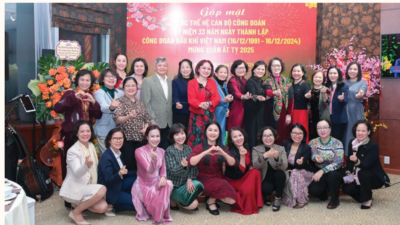
Lãnh đạo CĐ DKVN chụp ảnh cùng các thể hệ cán bộ công đoàn

Với niềm tự hào 33 năm xây dựng và phát triển, CĐ DKVN sẽ nắm bắt thời cơ, phát huy sức mạnh khối đại đoàn kết trong toàn ngành, giữ ngọn lửa truyền thống ngành Dầu khí luôn sáng mãi; cùng Tập đoàn Dầu khí Việt Nam phát huy vai trò, vị trí của ngành Dầu khí trong sự nghiệp xây dựng và bảo vệ Tổ quốc; tô thắm cho truyền thống vẻ vang của ngành và giai cấp công nhân Việt Nam; xứng đáng là một trong những lá cờ đầu của hệ thống Công đoàn Việt Nam./.