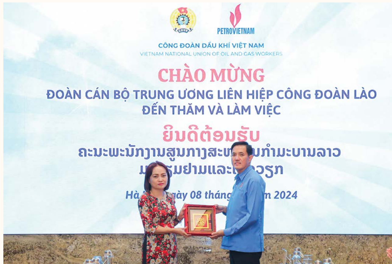
CĐ DKVN tặng quà lưu niệm cho đoàn cán bộ Trung ương Liên hiệp Công đoàn Lào

Trong bối cảnh thế giới đầy biến động và các quốc gia đã mở cửa hoàn toàn sau đại dịch Covid-19, công tác đối ngoại của Công đoàn Dầu khí Việt Nam (CĐ DKVN) đã đạt được nhiều thành tựu nổi bật, góp phần quan trọng vào việc nâng cao vị thế của tổ chức Công đoàn Việt Nam và Tập đoàn Dầu khí Việt Nam, tạo ra những giá trị thiết thực cho người lao động Dầu khí.