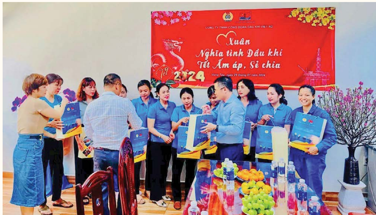
Lãnh đạo Công đoàn Vietsoupetro thăm và tặng quà tết cho CBNV, NLD có hoàn cảnh khó khăn

Năm 2024 đã khép lại, đánh dấu một hành trình đầy thách thức nhưng cũng rất đáng tự hào của Công đoàn Liên doanh Vietsoupetro. Là chỗ dựa vững chắc cho người lao động, Công đoàn không chỉ đồng hành cùng tập thể lao động quốc tế Vietsoupetro vượt qua khó khăn, hoàn thành xuất sắc nhiệm vụ SXKD, mà còn để lại nhiều dấu ấn trong các hoạt động chăm lo, thi đua lao động sáng tạo và văn hóa doanh nghiệp. Chào Xuân mới 2025, những thành tựu này sẽ là bệ phóng cho những khát vọng lớn hơn, vì sự phát triển bền vững của Vietsoupetro.