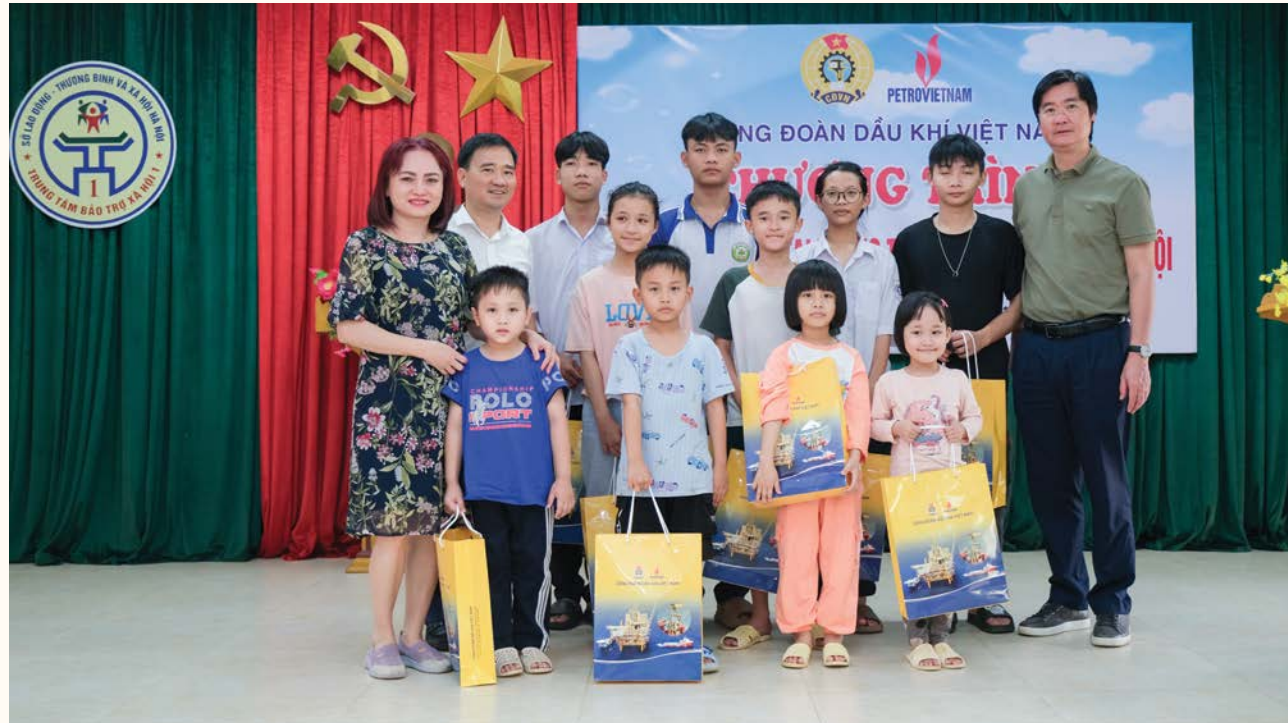
Lãnh đạo CĐ DKVN thăm hỏi, tặng quà các em thiếu nhi tại Trung tâm Bảo trợ xã hội số 1 (Ba Vi, Hà Nội)