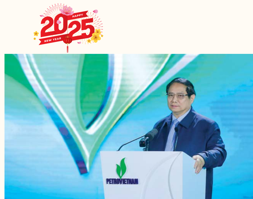
Thủ tướng Chính phủ Phạm Minh Chính phát biểu chỉ đạo Hội nghị

Đồng thời, Tập đoàn đã tối đa hiệu quả và tối ưu chi phí, năm 2024 đã tiết kiệm khoảng 3.480 tỷ đồng, vượt 54% kế hoạch tiết giảm