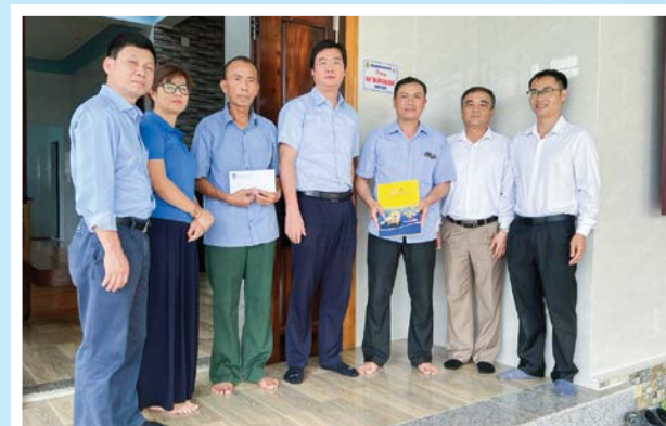
CĐ DKVN trao tặng nhà trong chương trình “Mái ấm Công đoàn” cho người lao động

Thỏa thuận hợp tác ưu đãi khi mua các sản phẩm với công ty, doanh nghiệp cho người lao động. Thực hiện Chương trình “Mái ấm Công đoàn”, thể hiện văn hóa “nghĩa tình” của người Dầu khí, CĐ DKVN xây mới căn 16 nhà “Mái ấm Công đoàn”, hỗ trợ sửa chữa, xây dựng thiết chế văn hóa, thể thao phục vụ người lao động với tổng số tiền gần 10 tỷ đồng.