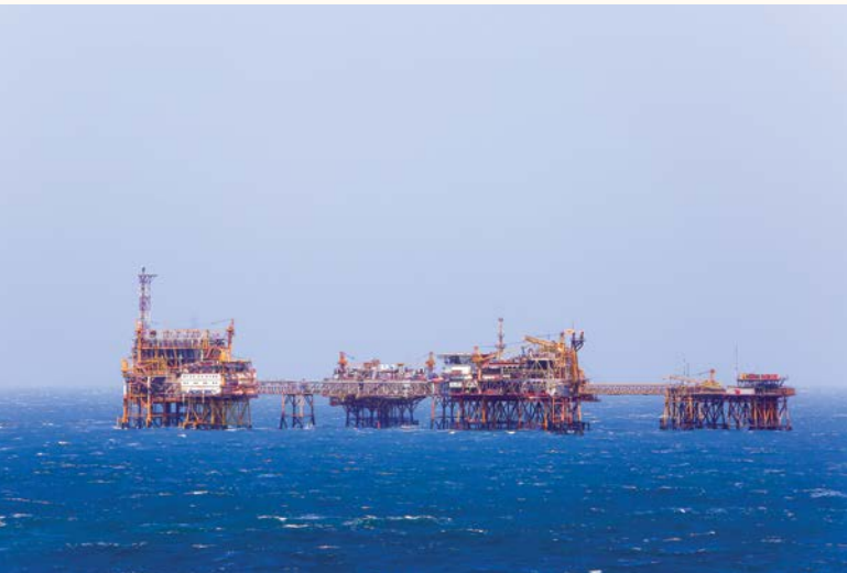
Petrovietnam đạt những kết quả SXKD ấn tượng một cách liên tục, ổn định và tăng trưởng cao trong giai đoạn vừa qua

Cụ thể, tổng doanh thu toàn Tập đoàn sau 4 năm (2021-2024) đạt trên 3,5 triệu tỷ đồng, đạt mức tăng trưởng 16,7%/năm; tổng nộp ngân sách Nhà nước toàn Tập đoàn sau 4 năm đạt trên 599 nghìn tỷ đồng, với mức tăng trưởng là 21,2%/năm; lợi nhuận hợp nhất trước thuế đạt trên 238 nghìn tỷ đồng sau 4 năm, đạt mức tăng trưởng trên 44,3%/năm. Bên cạnh đó, Tập đoàn đã hoàn thành rất nhiều công trình, các dự án tồn tại, khó khăn đã được tháo gỡ để đưa vào hoạt động, tạo ra doanh thu cho Tập đoàn, thông qua đó tạo ra tăng trưởng rất lớn về đầu tư so với giai đoạn trước.