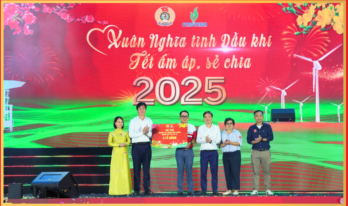
Lãnh đạo CĐ DKVN trao hỗ trợ cho người lao động có hoàn cảnh khó khăn