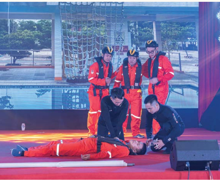
Đoàn Vietsovpetro tham dự Hội thi An toàn vệ sinh viên giỏi ngành Dầu khí lần thứ X năm 2024

Những nỗ lực này không chỉ tạo dấu ấn cho Vietsovpetro mà còn góp phần khẳng định vị thế của ngành Dầu khí Việt Nam trên trường quốc tế.