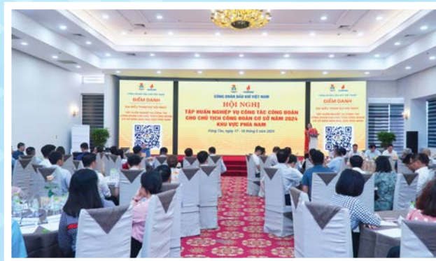
CD DKVN tổ chức tập huấn nghiệp vụ cho Chủ tịch công đoàn cơ sở năm 2024, khu vực phía Nam

Tổ chức 45 khóa đào tạo, bồi dưỡng, tập huấn cho hơn 4.000 cán bộ công đoàn, với tổng số tiền hơn 4 tỷ đồng. Tổ chức hội nghị, hội thảo trao đổi kinh nghiệm, mô hình hoạt động với các công đoàn ngành Trung ương, Liên đoàn Lao động các tỉnh, thành phố, công đoàn các nước.