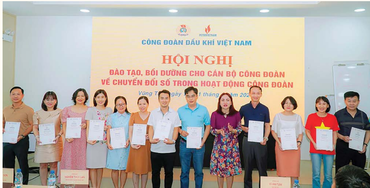
CĐ DKVN chú trọng đào tạo và phát triển kỹ năng công nghệ cho đoàn viên, NLD

tại Hội nghị Công đoàn IndustriALL đã nhấn mạnh rằng: Trong bối cảnh này, các tổ chức công đoàn cần phải linh hoạt và sáng tạo để vượt qua những thách thức mà kỷ nguyên AI đặt ra. Đồng thời, vai trò của công đoàn trở nên quan trọng hơn bao giờ hết trong việc bảo vệ quyền lợi, thúc đẩy sự phát triển của NLD và bảo đảm một thị trường lao động công bằng và nhân văn.