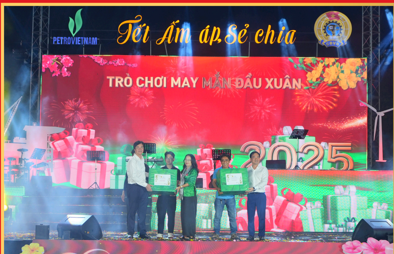
Lãnh đạo CĐ DKVN trao giải thưởng trò chơi may mắn đầu Xuân