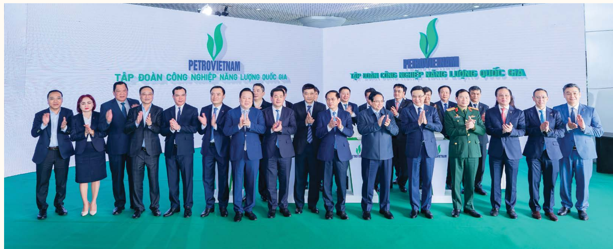
Thủ tướng Chính phủ Phạm Minh Chính, lãnh đạo các bộ, ngành, chụp ảnh lưu niệm cùng lãnh đạo Petrovietnam - Tập đoàn Công nghiệp Năng lượng Quốc gia