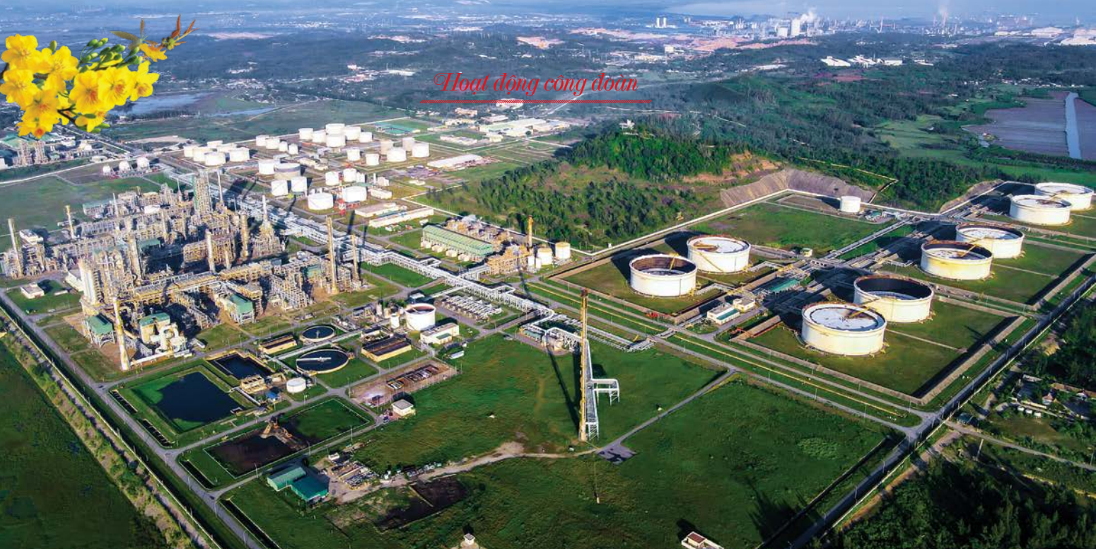
Toàn cảnh NMLD Dung Quất