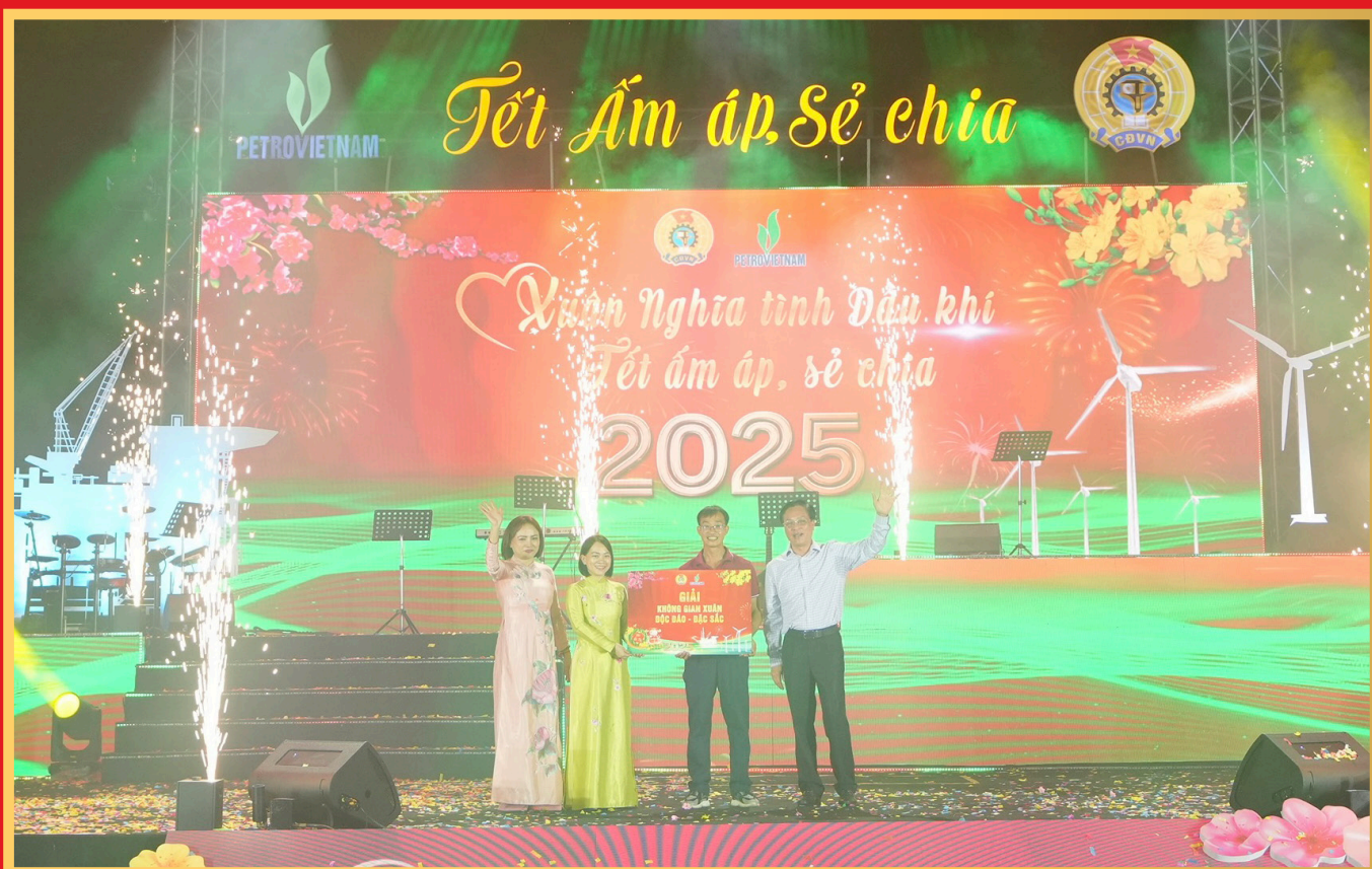
Lãnh đạo Petrovietnam và CĐ DKVN trao giải Không gian Xuân độc đáo, đặc sắc