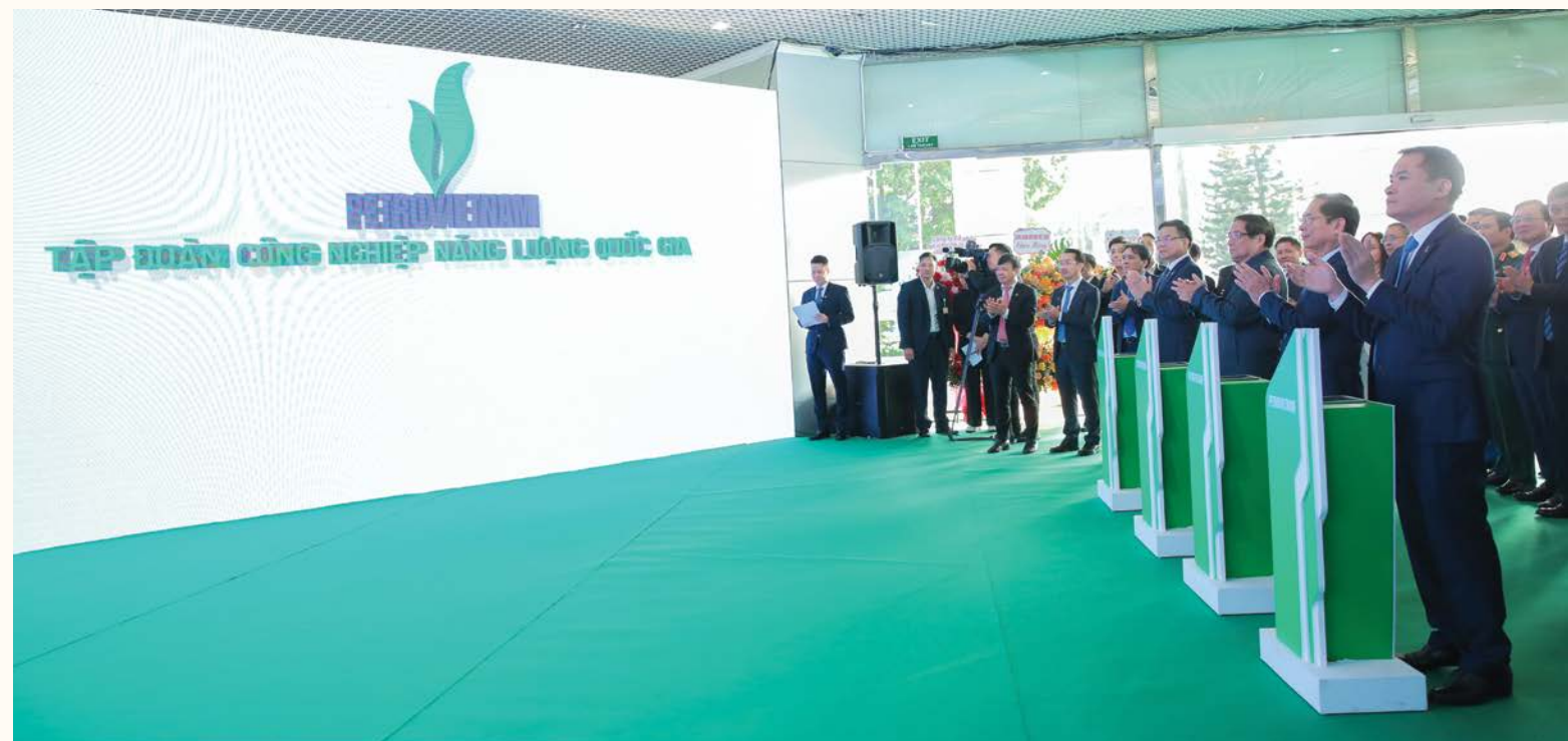
Thủ tướng Chính phủ Phạm Minh Chính, Phó Thủ tướng Chính phủ Bùi Thanh Sơn cùng lãnh đạo Tập đoàn thực hiện nghi thức chuyển dịch Petrovietnam - Tập đoàn Công nghiệp Năng lượng Quốc gia

Về giải pháp, Thủ tướng yêu cầu, Petrovietnam tổ chức thực hiện nghiêm túc, hiệu quả Kết luận 76-KL/TW của Bộ Chính trị, chuyển đổi hiệu quả thành Tập đoàn Công nghiệp Năng lượng Quốc gia. Petrovietnam phải phấn đấu trở thành tập đoàn năng lượng hàng đầu, có thương hiệu trong khu vực và thế giới, tham gia sâu chuỗi giá trị toàn cầu với tinh thần "nói được làm được", đi đầu trong