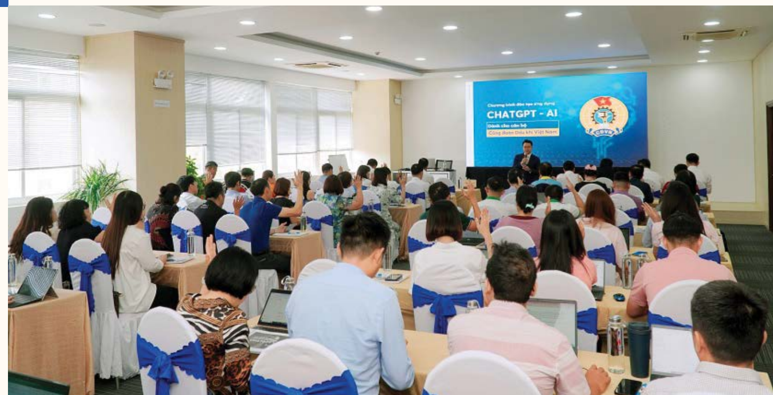
CĐ DKVN tổ chức tập huấn "Ứng dụng Chat GPT trong hoạt động công đoàn"

AI đang mang lại nhiều lợi ích vượt trội như tăng năng suất, cải thiện độ chính xác trong các nhiệm vụ phức tạp, giải phóng con người khỏi những công việc lặp đi lặp lại. Giúp tiết giảm chi phí, tạo ra các dịch vụ mới,