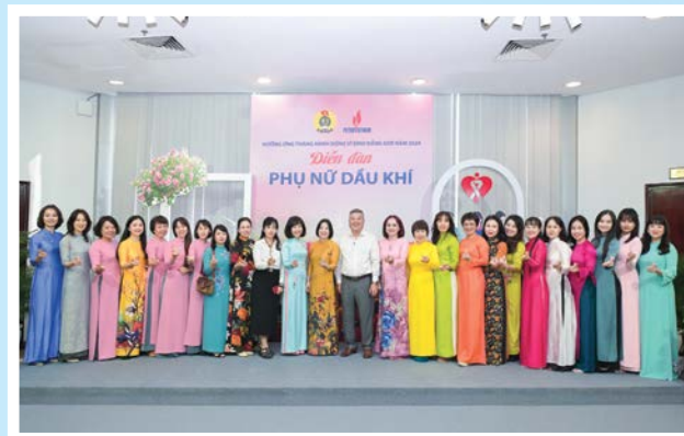
Lãnh đạo Tập đoàn, CD DKVN và các đại biểu nữ tham dự Hội nghị Vì sự tiến bộ Phụ nữ và công tác Nữ công năm 2024

CD DKVN phối hợp với Tập đoàn tổ chức Hội nghị Vì sự tiến bộ Phụ nữ và công tác Nữ công năm 2024; Diễn đàn phụ nữ Dầu khí. Trong chuỗi hoạt động, đã hỗ trợ người lao động nữ có hoàn cảnh khó khăn, chăm sóc sức khỏe lao động nữ, biểu dương những tập thể, cá nhân tiêu biểu trong công tác bình đẳng giới.