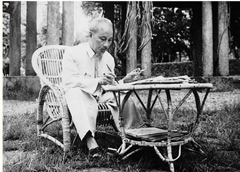
Chủ tịch Hồ Chí Minh

Chủ tịch Hồ Chí Minh (1890-1969), lãnh tụ vĩ đại của nhân dân Việt Nam đã được Tổ chức Văn hóa Giáo dục Liên Hiệp Quốc vinh danh Anh hùng giải phóng dân tộc, Danh nhân văn hóa Thế giới. Cùng với tư tưởng đạo đức sáng ngời, Người còn để lại cho dân tộc Việt Nam và cho nhân loại nhiều tác phẩm văn thơ có giá trị, trong đó có những bài thơ viết bằng chữ Hán, giúp chúng ta hiểu rõ hơn tinh cảm của Người với đất nước, con người Trung Quốc.