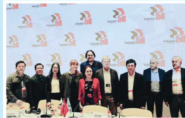
Đoàn đại biểu Công đoàn Việt Nam chụp ảnh lưu niệm cùng Chủ tịch, Phó Chủ tịch và Ban lãnh đạo Công đoàn IndustriALL

Tham dự Hội nghị Công đoàn Công nghiệp và Sản xuất toàn cầu của các nước trong khu vực và thế giới; Dẫn đầu Phụ nữ Á - Âu. Làm việc với công đoàn khu vực châu Á, Thái Bình Dương, các công đoàn ngành Dầu khí, Điện, Năng lượng; trao đổi đoàn với Công đoàn Nhật Bản, Hàn Quốc.