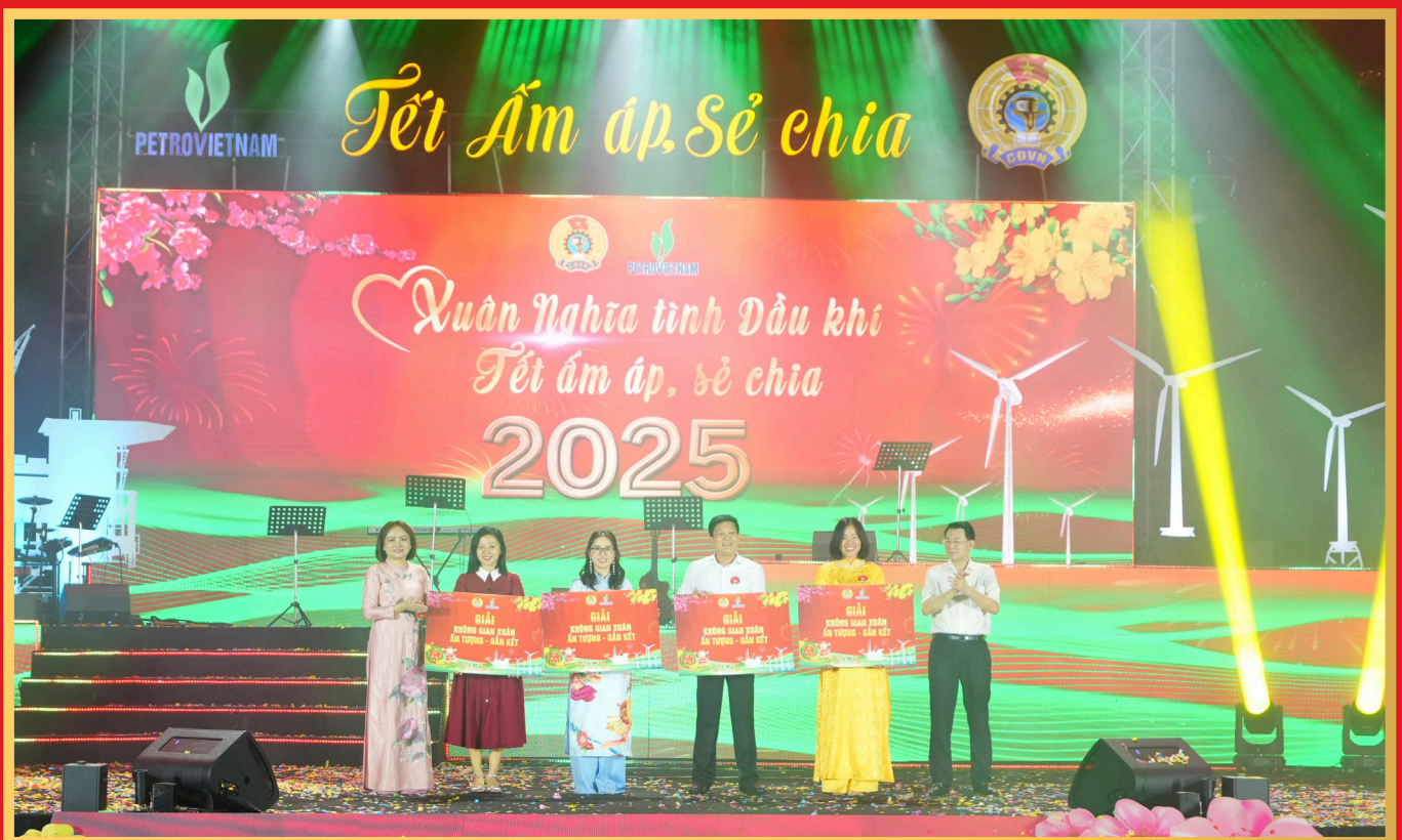
Lãnh đạo Petrovietnam và CĐ DKVN trao giải Không gian Xuân ấn tượng, gắn kết