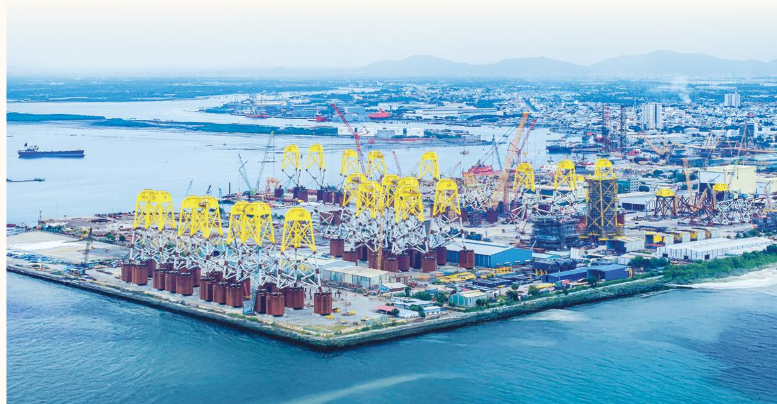
Petrovietnam tích cực thực hiện nâng cao công tác quản trị, chuyển đổi số và chuyển dịch năng lượng