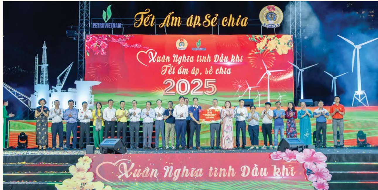
Lãnh đạo CĐ DKVN trao hỗ trợ các công đoàn tổ chức Tết cho người lao động