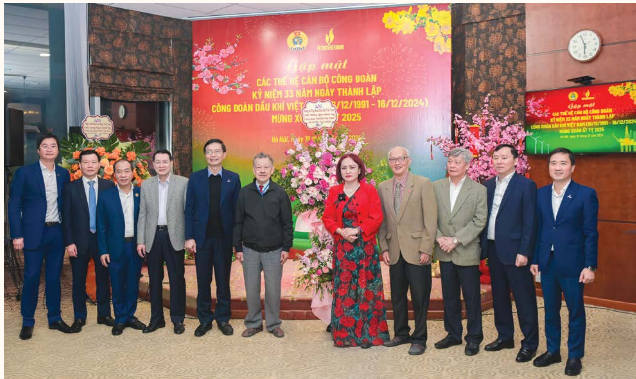
Lãnh đạo Tập đoàn tặng hoa chúc mừng CĐ DKVN nhân kỷ niệm 33 năm ngày thành lập

Trong suốt 33 năm xây dựng và phát triển, Công đoàn Dầu khí Việt Nam (CĐ DKVN) luôn thực hiện tốt chức năng đại diện, là mái nhà chung ấm áp, nghĩa tình của hơn 5 vạn cán bộ, đoàn viên, NLĐ Dầu khí và là một trong những lá cờ đầu trong hệ thống Công đoàn Việt Nam với những chương trình, hoạt động công đoàn sáng tạo, đổi mới, thiết thực.