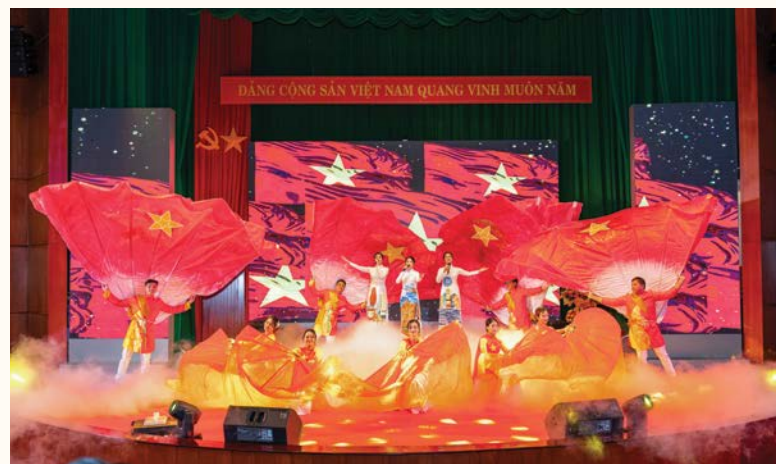
Tiết mục biểu diễn tại Liên hoan nghệ thuật quần chúng Vietsovpetro lần thứ 26 năm 2024

Và không thể không nhắc đến Ngày hội Gia đình Vietsovpetro, nơi tiếng cười trẻ thơ hòa cùng niềm vui của các bậc phụ huynh, mang lại những khoảnh khắc khó quên trong một không gian đầm ấm, đúng nghĩa của nhiều gia đình nhỏ hòa cùng một gia đình lớn Vietsovpetro.