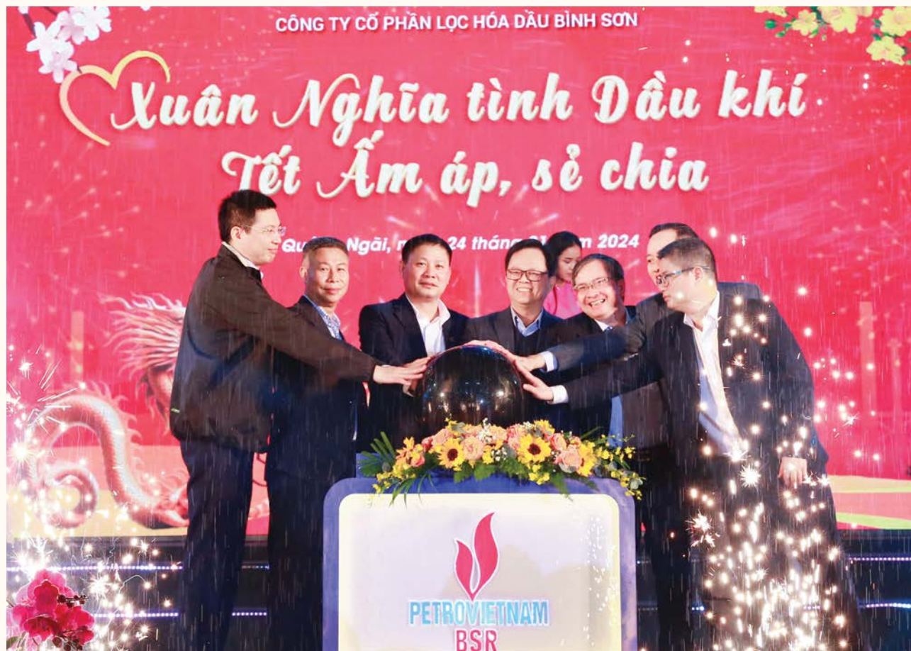
Lãnh đạo BSR tại lễ khai mạc chương trình Xuân nghĩa tình Dầu khí

Nhân dịp đón Xuân Ất Tỵ 2025, thực hiện chương trình công tác năm 2024, Công đoàn Công ty CP Lọc hóa dầu Bình Sơn (BSR) lên kế hoạch tổ chức, triển khai nhiều hoạt động chăm lo đời sống người lao động (NLĐ). Tiếp tục khẳng định vai trò là chỗ dựa tinh thần vững chắc cho NLĐ yên tâm công tác, hoàn thành tốt nhiệm vụ sản xuất kinh doanh.