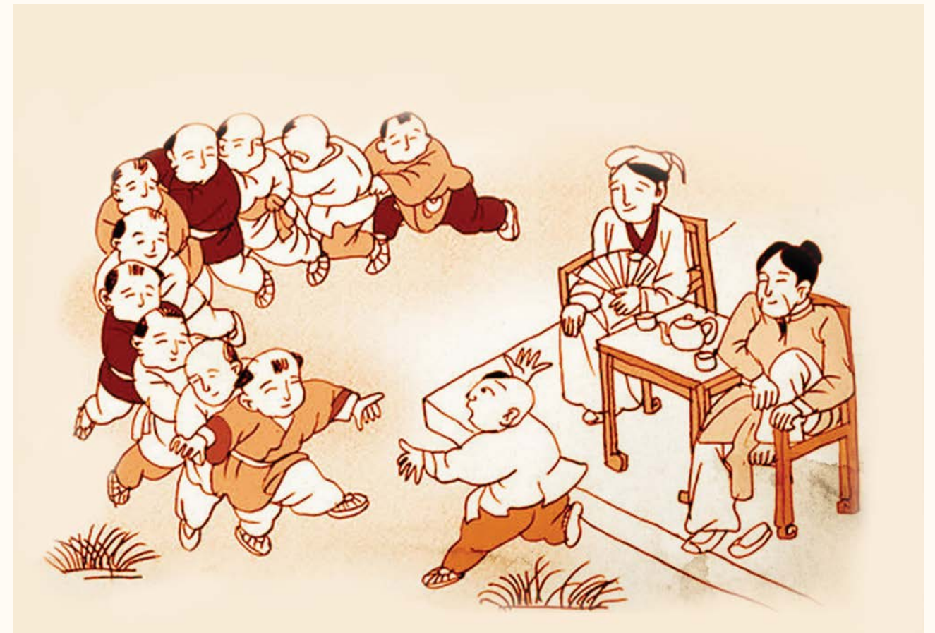
Tranh vẽ trò chơi dân gian "Rồng rắn lên mây"