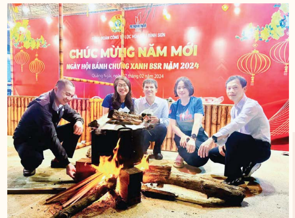
Ngày hội bánh chưng xanh

Chuỗi các hoạt động chăm lo cho NLĐ trong dịp Tết của Công đoàn BSR luôn mang nhiều ý nghĩa, nhân văn và mang đậm nét văn hóa Dầu khí, văn hóa BSR. Chính vì vậy, dịp xuân mới đang cận kề, những hoạt động chào đón năm mới luôn được đông đảo NLĐ hưởng ứng để được hòa mình vào không khí Tết, không khí gia đình, đặc biệt là những NLĐ xa quê./.