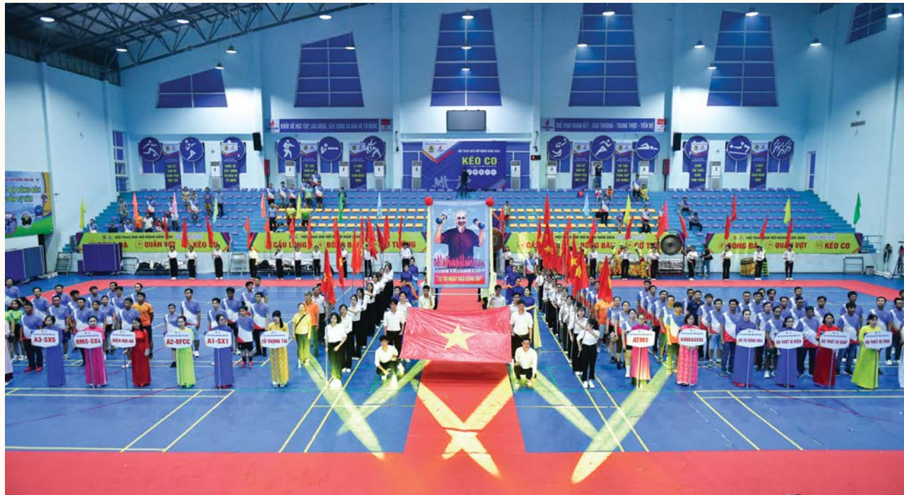
Toàn cảnh Hội thao BSR mở rộng năm 2024

Đoàn viên Công đoàn BSR luôn được tuyên truyền việc xây dựng văn hóa BSR thông qua việc học tập, nghiên cứu và chuyển hóa những thông điệp từ các chương trình "Một đội ngũ, một mục tiêu", "7 thói quen hiệu quả". Điều này, đã và đang mang lại hiệu quả rõ nét trong các hoạt động công đoàn và tinh thần hăng say lao động sáng tạo, tâm lý vui vẻ, năng lượng tích cực của mỗi người lao động ngày càng được nâng cao.