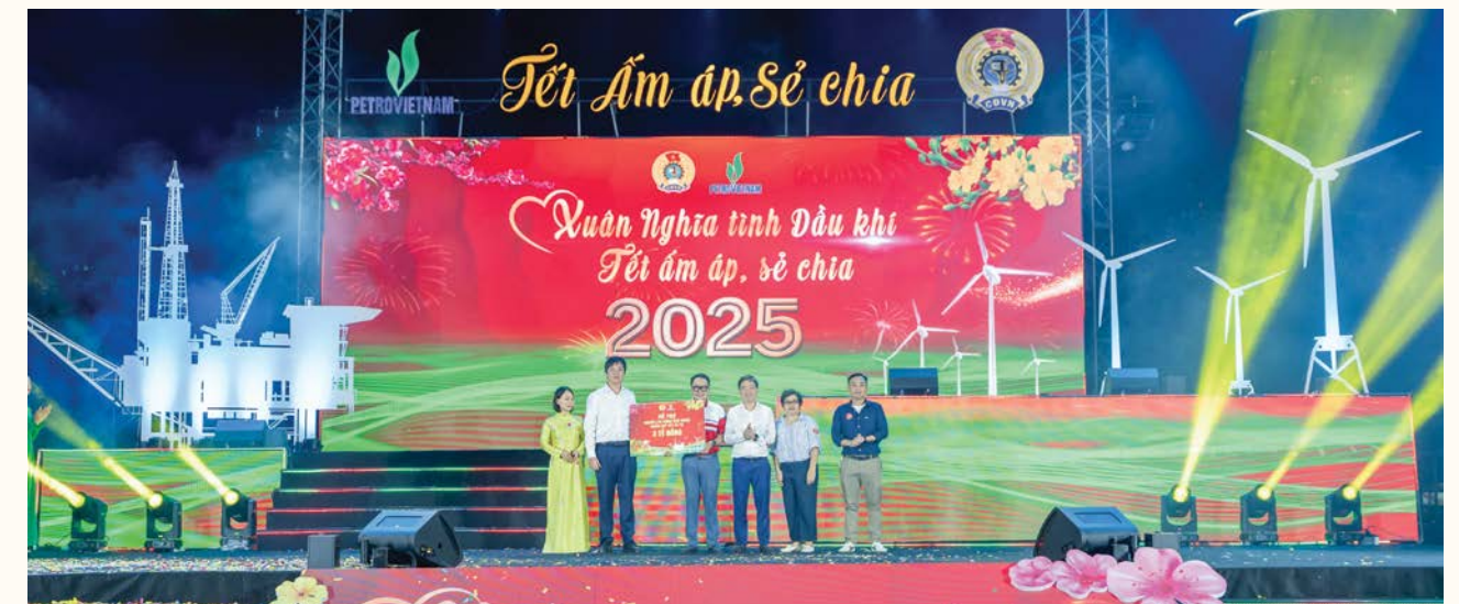
Lãnh đạo CĐ DKVN trao hỗ trợ cho người lao động có hoàn cảnh khó khăn