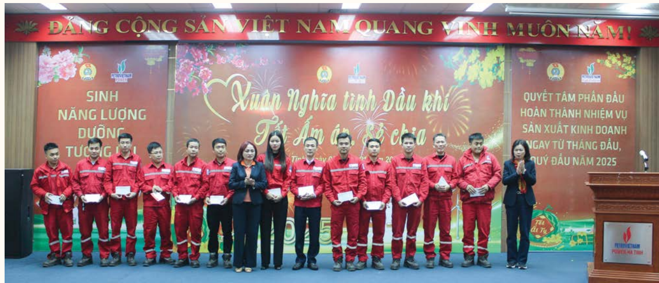
Lãnh đạo CĐ DKVN và Công đoàn PV Power tặng quà CBNV-NLĐ PV Power Hà Tĩnh có hoàn cảnh khó khăn nhân dịp Tết Nguyên đán Ất Tỵ 2025