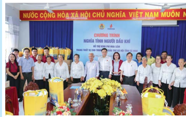
Lãnh đạo Tập đoàn và CD DKVN thăm hỏi sức khỏe và tặng quà các cụ tại Trung tâm Bảo trợ xã hội tỉnh Cà Mau

Hỗ trợ cán bộ hưu trí, đoàn viên, người lao động có hoàn cảnh khó khăn, tổ chức Chương trình "Nghĩa tình Dầu khí", đền ơn đáp nghĩa, uống nước nhớ nguồn. Với truyền thống tương thân, tương ái, Tập đoàn - CD DKVN phối hợp các tổ chức chính trị - xã hội kêu gọi các đơn vị thành viên, người lao động quyên góp, hỗ trợ người lao động Dầu khí, đồng bào nhân dân tại các vùng bị ảnh hưởng bởi cơn bão số 3 (Yagi) với tổng số tiền trên 100 tỷ đồng./.