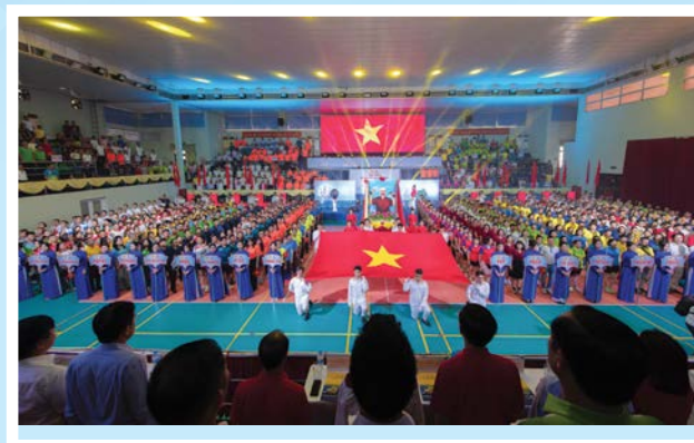
Khai mạc Hội thao ngành Dầu khí năm 2024 khu vực phía Nam

Tổ chức giải chạy bộ online Xuân Dầu khí, Hội thao ngành Dầu khí năm 2024 thu hút sự tham gia của 12.000 người lao động các đơn vị. CD DKVN đã trao 400 bộ huy chương với tổng số tiền thưởng hơn 2 tỷ đồng. Các hoạt động văn hóa, thể thao đã truyền cảm hứng, khơi dậy tinh thần đoàn kết, lan tỏa Văn hóa Dầu khí trong giai đoạn mới.