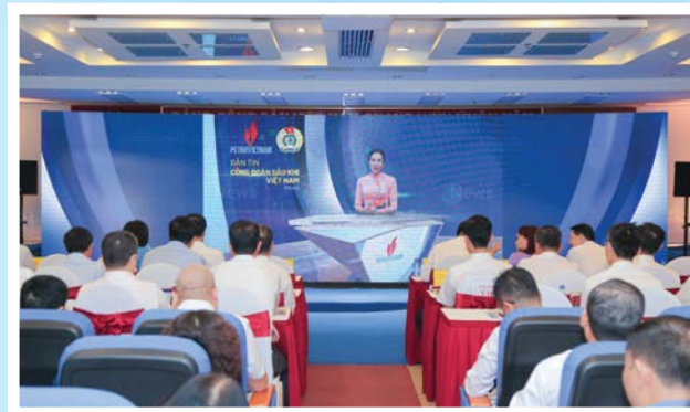
Ra mắt Bản tin truyền hình CD DKVN

CD DKVN ra mắt Bản tin truyền hình mỗi tháng 1 số, phát sóng trên hệ thống truyền thông công đoàn. Bản tin truyền hình đã truyền tải các tin/bài phản ánh về các hoạt động lớn của CD DKVN, mang đến cho người lao động những hình ảnh về các chuỗi sự kiện trong hoạt động sản xuất kinh doanh.