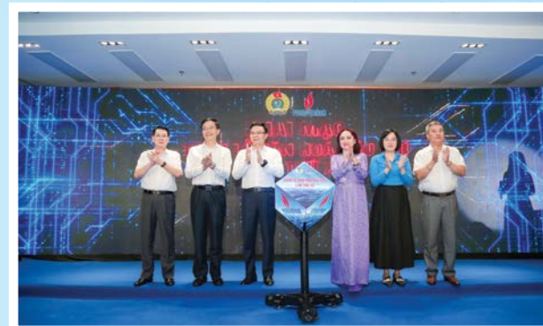
Lãnh đạo Tập đoàn, CĐ DKVN khai mạc Tuần lễ Văn hóa Dầu khí lần thứ XV, năm 2024

Tổ chức Tuần lễ Văn hóa Dầu khí lần thứ XV năm 2024 mang bản sắc đặc trưng, giá trị cốt lõi, thương hiệu của ngành Dầu khí, tạo sức mạnh đoàn kết, vượt qua khó khăn, thách thức. Văn hóa “nghĩa tình” được lan tỏa trên các công trình/nhà máy, dự án khó khăn, được chia sẻ thông qua các hoạt động xã hội. Thăm hỏi, hỗ trợ, tặng quà người lao động, tri ân các thế hệ Dầu khí.