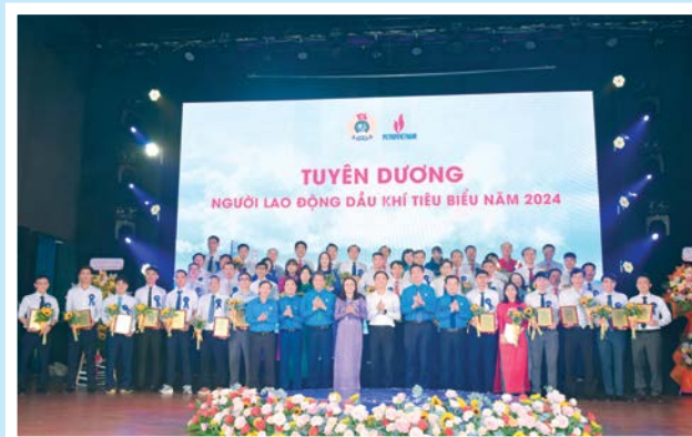
Lãnh đạo Tổng LĐLĐVN, Tập đoàn và CĐ DKVN tuyên dương người lao động Dầu khí tiêu biểu năm 2024 tại Lễ khai mạc Tháng Công nhân năm 2024

Tổ chức Tháng Công nhân gắn với Tháng hành động về An toàn vệ sinh lao động (ATVSLĐ) năm 2024 với mục tiêu “Mỗi công đoàn cơ sở, một lợi ích đoàn viên”, CĐ DKVN đã hoàn thành vượt mức trên 200%. Khen thưởng các tập thể, cá nhân tiêu biểu thực hiện an toàn lao động. Tuyên dương 102 người lao động Dầu khí tiêu biểu cùng các cá nhân xuất sắc thực hiện Chỉ thị 05-CT/TW. Hỗ trợ đoàn viên, người lao động với số tiền gần 3 tỷ đồng.