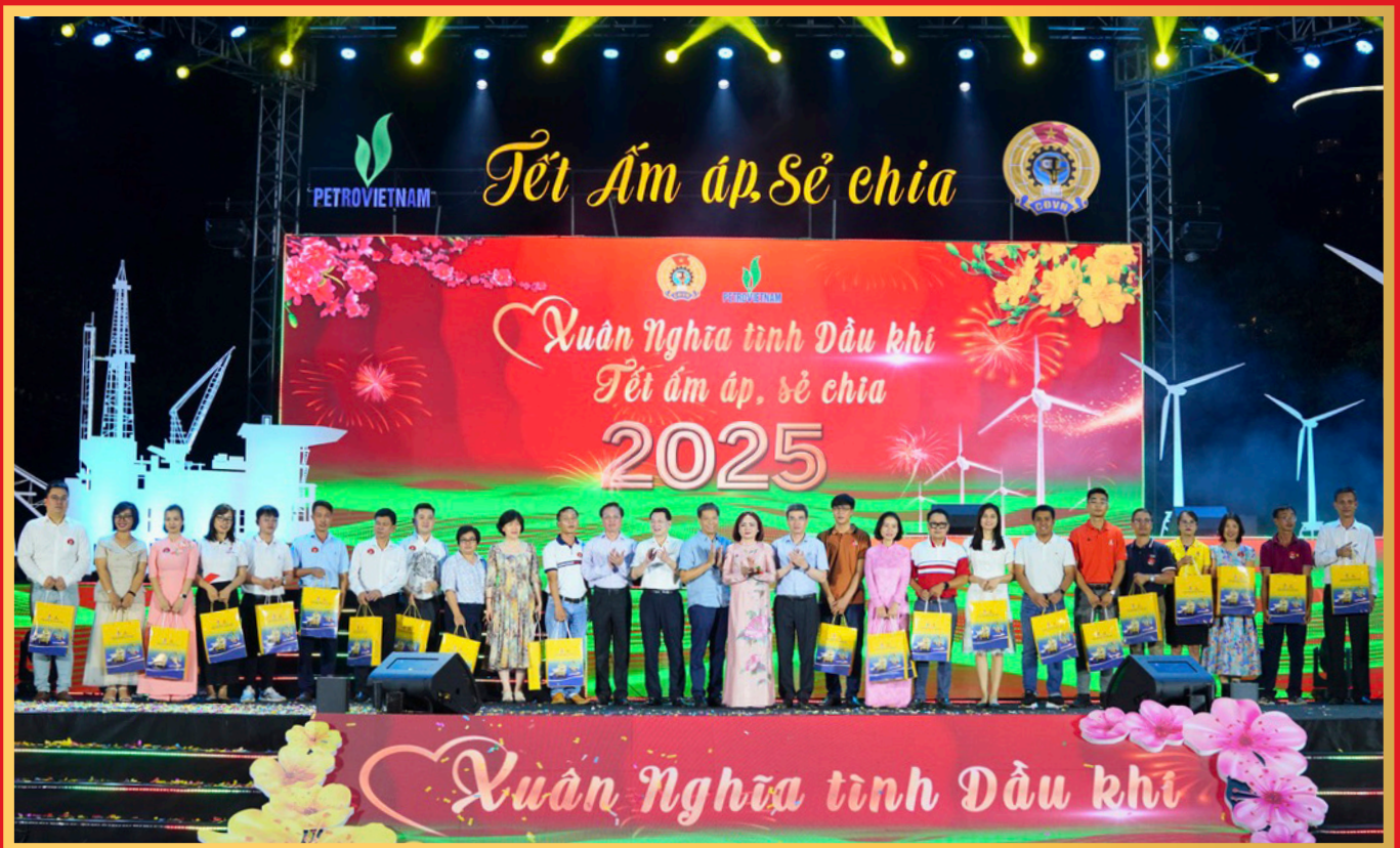
Lãnh đạo Petrovietnam và CĐ DKVN trao quà Tết cho người lao động