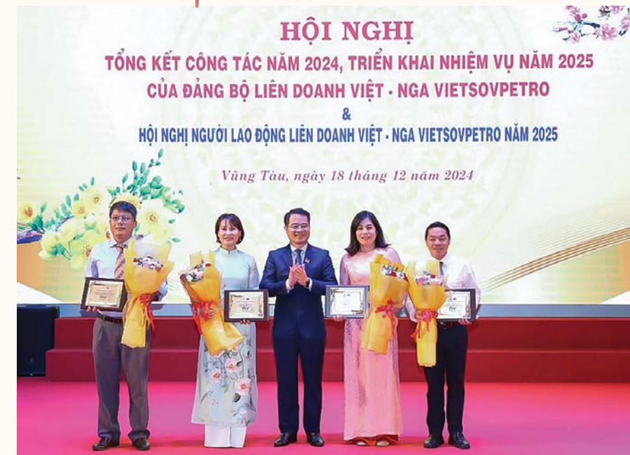
Lãnh đạo Công đoàn Vietsoupetro trao giấy khen cho công đoàn cơ sở thành viên hoàn thành xuất sắc nhiệm vụ năm 2024

động giỏi – Lao động sáng tạo" năm 2024 đã khơi dậy tinh thần đổi mới mạnh mẽ, giúp mọi ý tưởng dù nhỏ nhất cũng được hiện thực hóa.