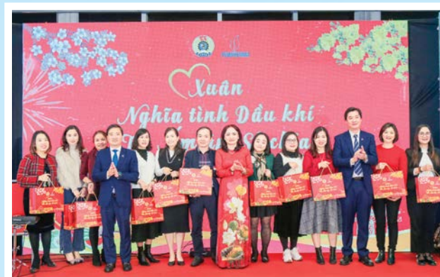
Lãnh đạo CĐ DKVN trao quà cho người lao động nhân dịp Tết Nguyên đán Giáp Thìn 2024

Chương trình “Xuân nghĩa tình Dầu khí - Tết ấm áp, sẻ chia” với phương châm “Tất cả đoàn viên, người lao động đón Tết đầm ấm, hạnh phúc và an toàn” đã trở thành chương trình đặc trưng, thiết thực để chăm lo cho đoàn viên, người lao động Dầu khí. Đồng thời, CĐ DKVN thăm hỏi, hỗ trợ, tặng quà cho người lao động trong các dịp lễ Tết, Tháng Công nhân, Tuần lễ Văn hóa Dầu khí với tổng số tiền trên 70 tỷ đồng.