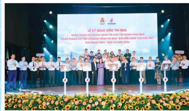
Lãnh đạo Tập đoàn – CĐ DKVN và lãnh đạo các đơn vị thành viên ký cam kết thi đua hoàn thành chỉ tiêu quản trị năm 2024

Với tinh thần đoàn kết “Một đội ngũ - Một mục tiêu”, Tập đoàn và CĐ DKVN tổ chức ký cam kết thi đua hoàn thành chỉ tiêu quản trị năm 2024, tổng doanh thu toàn Tập đoàn đạt hơn 1 triệu tỷ đồng, nộp NSNN toàn Tập đoàn là 165 nghìn tỷ đồng. Thực hiện chương trình “Đổi mới Sáng tạo Dầu khí”, trong năm 2024, đạt hơn 3.000 sáng kiến, vượt 256%.