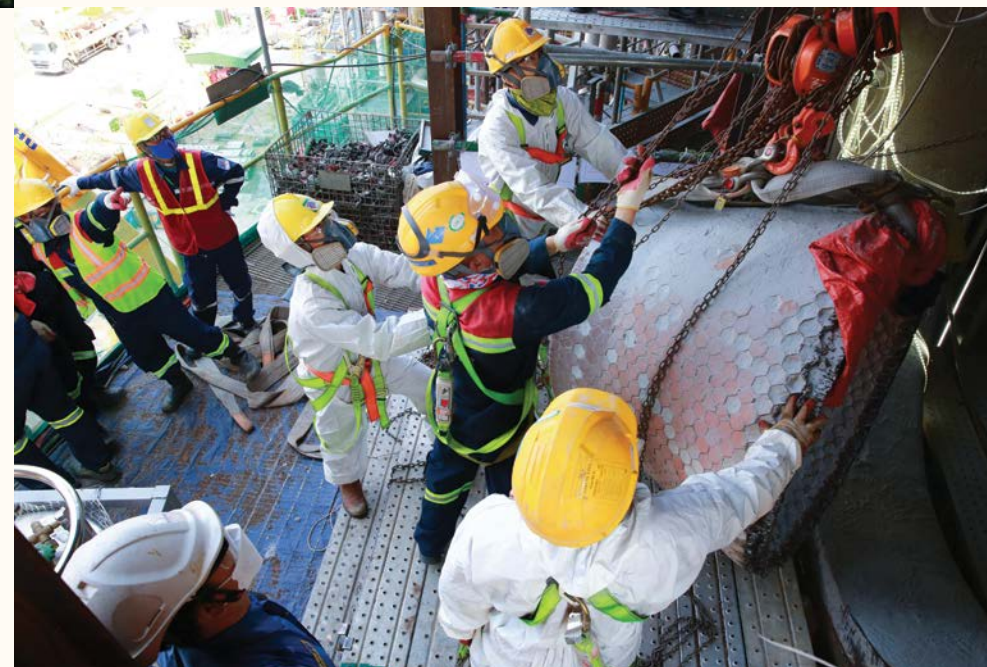
NLĐ BSR trong hoạt động bảo dưỡng tổng thể NMLD Dung Quất lần thứ 5

Tháng Công nhân năm 2024 đúng vào dịp BSR chào mừng kỷ niệm 16 năm thành lập Công ty, Công đoàn BSR đã tổ chức Lễ phát động Tháng Công nhân và Tháng hành động vì An toàn vệ sinh lao động và tham gia cùng chính quyền tổ chức nhiều hoạt động có ý nghĩa để tôn vinh NLĐ. Tại lễ tôn vinh, lãnh đạo Công ty và Công đoàn đã tôn vinh 30 "Người lao động BSR tiêu biểu" đã có nhiều thành tích xuất sắc trong hoạt động sản xuất kinh doanh và tích cực tham gia các phong trào lan tỏa văn hóa BSR. Nhiều hoạt động gắn kết thành viên đã được tổ chức nhân Tháng Công nhân năm 2024.