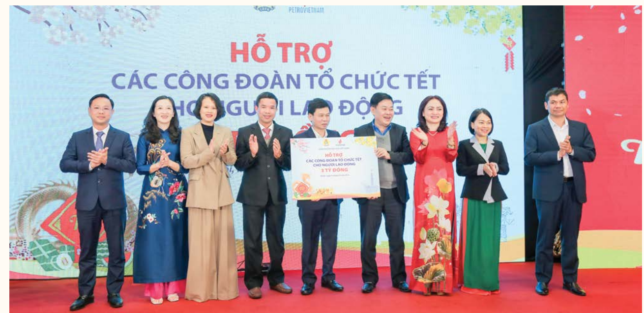
CĐ DKVN trao hỗ trợ cho các công đoàn tổ chức các hoạt động chăm lo Tết cho đoàn viên, người lao động Dầu khí nhân dịp Tết Nguyên đán Giáp Thìn 2024

1. Tổ chức Chương trình “Xuân nghĩa tình Dầu khí - Tết ấm áp sẻ chia” tập trung ở cơ sở và cấp trên trực tiếp cơ sở, nơi có đông ĐV, NLĐ; tại các đơn vị gặp khó khăn, bảo đảm thuận lợi, thu hút nhiều ĐV, NLĐ tham gia, an toàn, tiết kiệm, hiệu quả; hỗ trợ các đơn vị khó khăn, công trình dự án, vùng sâu, vùng xa tổ chức chương trình “Xuân nghĩa