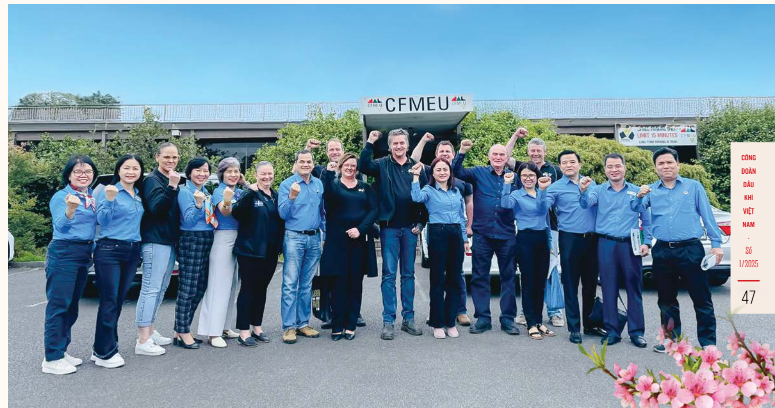
CĐ DKVN thăm và làm việc với Công đoàn Khai thác Mỏ và Năng lượng Australia