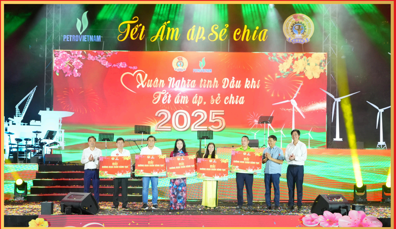
Lãnh đạo Petrovietnam và CĐ DKVN trao giải Không gian Xuân sáng tạo