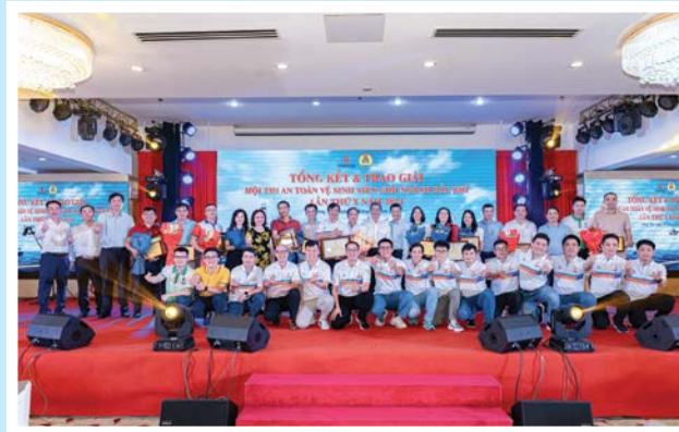
Các đội thi đạt giải tại Hội thi An toàn vệ sinh viên giỏi ngành Dầu khí lần thứ X năm 2024

CD DKVN phối hợp với Tập đoàn tổ chức Hội thi Tay nghề Dầu khí, Hội thi An toàn vệ sinh viên giỏi năm 2024, thu hút gần 500 thí sinh đến từ 20 đơn vị. Qua đó, nâng cao chuyên môn, nghiệp vụ, nhận thức về văn hóa an toàn, đây là nhiệm vụ quan trọng, sống còn của ngành Dầu khí. CD DKVN đã trao trên 1,1 tỷ đồng tiền thưởng cho 2 hội thi.