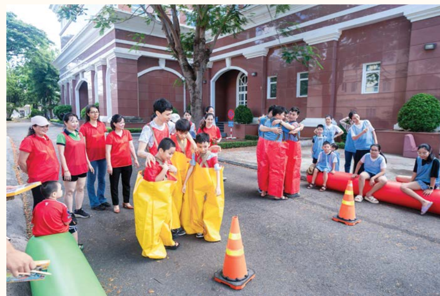
Những khoảnh khắc vui nhộn trong Ngày hội gia đình Vietsovpetro năm 2024

Năm 2024 đã chứng kiến vai trò nổi bật của Công đoàn Vietsovpetro trong việc chăm lo đời sống, thúc đẩy phong trào thi đua lao động sáng tạo và xây dựng văn hóa đoàn kết trong tập thể người lao động. Không chỉ dừng lại ở việc bảo vệ quyền lợi của người lao động, các hoạt động của công đoàn còn gắn bó chặt chẽ với mục tiêu chung của Liên doanh Vietsovpetro, góp phần quan trọng vào thành công trong sản xuất kinh doanh.