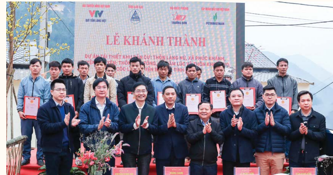
Lãnh đạo tỉnh Lào Cai, lãnh đạo Petrovietnam và CĐ DKVN cùng chung vui với người dân thôn Kho Vàng nhận Giấy chứng nhận quyền sử dụng đất