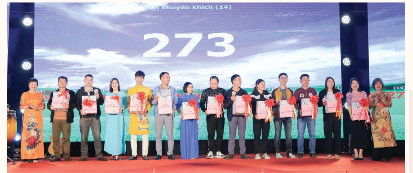
Người lao động nhận phần quà khuyến khích trong vòng quay số may mắn tại chương trình Xuân nghĩa tình Dầu khí năm 2024