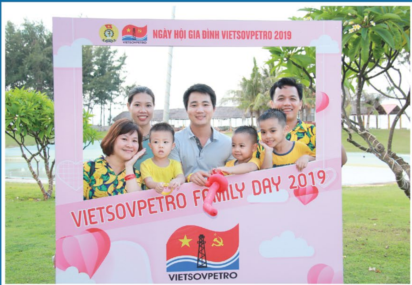
Chụp ảnh lưu niệm tại Ngày hội Gia đình của Công đoàn Vietsovpetro