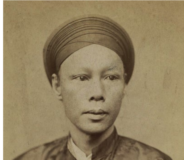
Trương Vĩnh Ký

Nhưng đáng nói nhất là công lao to lớn, vai trò quan trọng của Trương Vĩnh Ký trong lịch sử báo chí nước nhà. Ông thành lập và làm tổng biên tập những tờ báo tiếng Việt đầu tiên, đồng thời là cây bút chủ chốt của rất nhiều báo