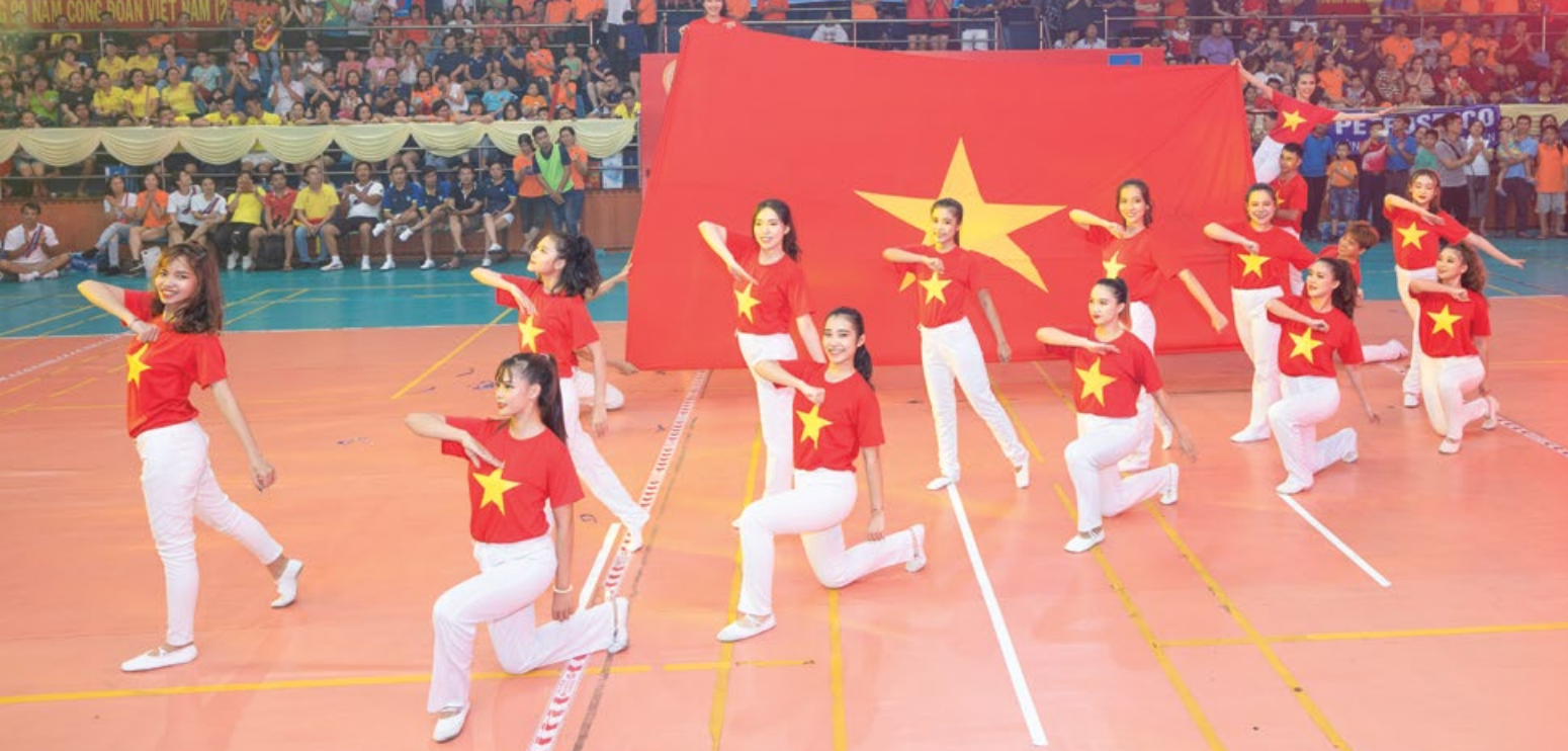
Văn nghệ chào mừng Hội thao