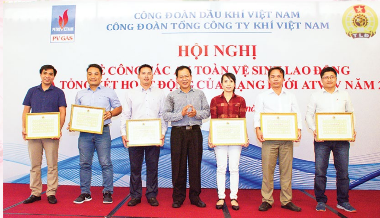
Trao giải cá nhân