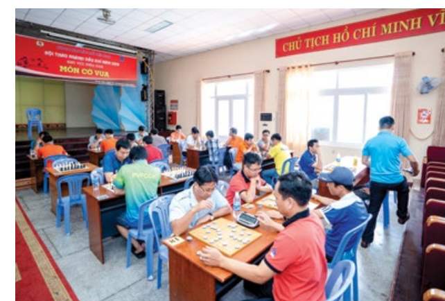
Các VĐV tham gia thi đấu môn cờ vua

môn kéo co và thi đấu Games Teambuilding. Cuộc thi đấu diễn ra sôi nổi, thu hút sự hứng khởi từ các VĐV và các cổ động viên có mặt tại nhà thi đấu, mở màn cho chuỗi ngày tranh tài thú vị tại hội thao ngành Dầu khí khu vực phía Nam./.