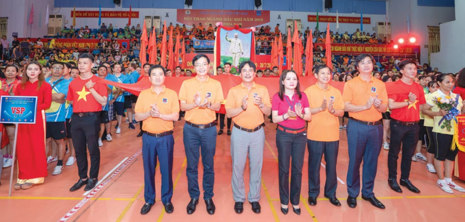
Lãnh đạo Tập đoàn và CĐ DKVN tại lễ khai mạc Hội thao ngành Dầu khí năm 2019