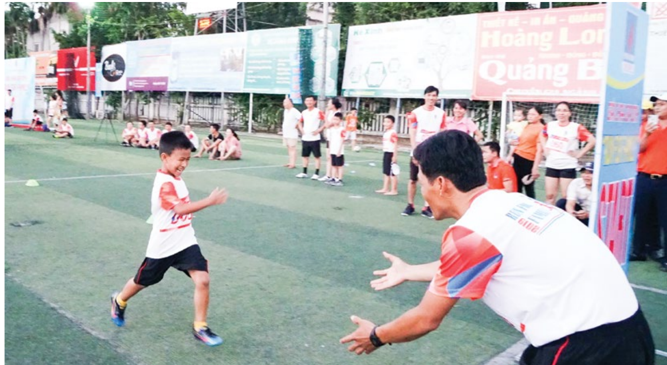
Khoảnh khắc đầy ắp đón con thân yêu về đích hoàn thành cự ly 200m