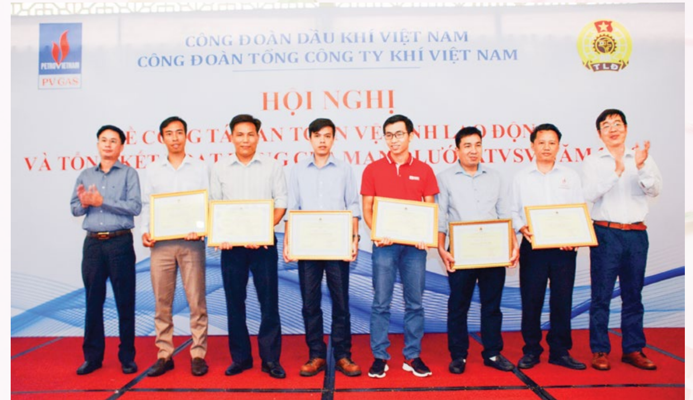
Trao giải tập thể