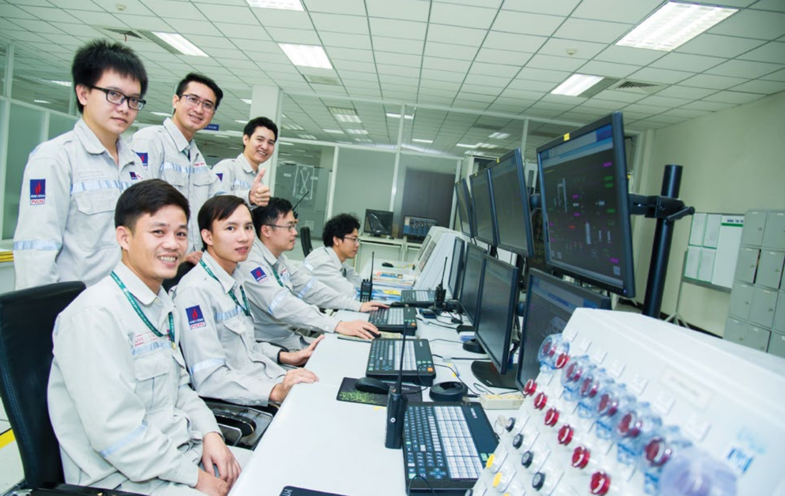
Đội ngũ kỹ sư vận hành giàu kinh nghiệm tại Đạm Cà Mau