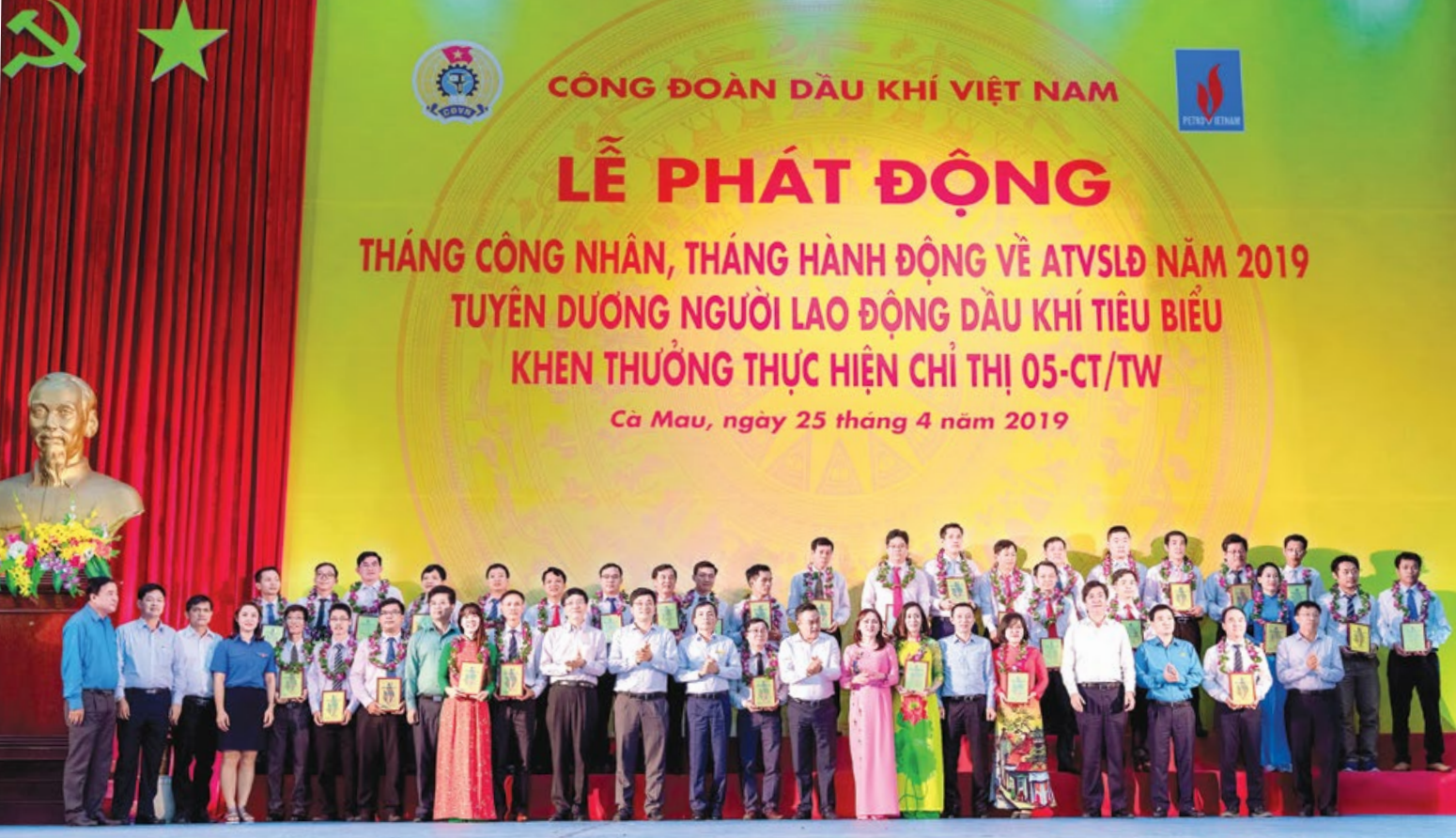
Lãnh đạo Tập đoàn và CĐ DKVN chụp ảnh lưu niệm cùng các cá nhân được tuyên dương Người lao động Dầu khí tiêu biểu