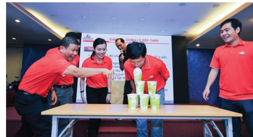
Trò chơi "Dùng ly xếp tháp"

Với hình thức Rung chuông vàng ở vòng 2, 60 người chơi phải dùng tất cả khả năng của mình để tìm ra đáp án đúng, tranh 30 suất bước vào vòng 3. Sau vòng 2, BTC đã tìm ra Top 30 người may mắn nhất để bước