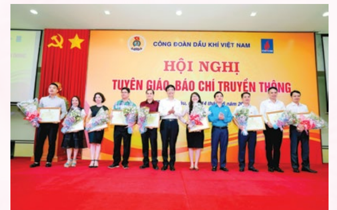
Đại diện Đảng ủy Tập đoàn và lãnh đạo CĐ DKVN tặng hoa các cá nhân tích cực viết bài