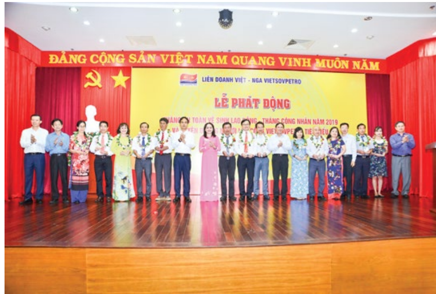
Tuyên dương Người lao động Vietsovpetro tiêu biểu 2019

Năm 2019 được coi là năm có nhiều sự kiện quan trọng đối với tổ chức công đoàn các cấp, chính vì thế ngay từ đầu năm, công tác thi đua, khen thưởng đã được triển khai đến các cấp công đoàn cơ sở thành viên, nổi bật là phong trào "Lao động giỏi, lao động sáng