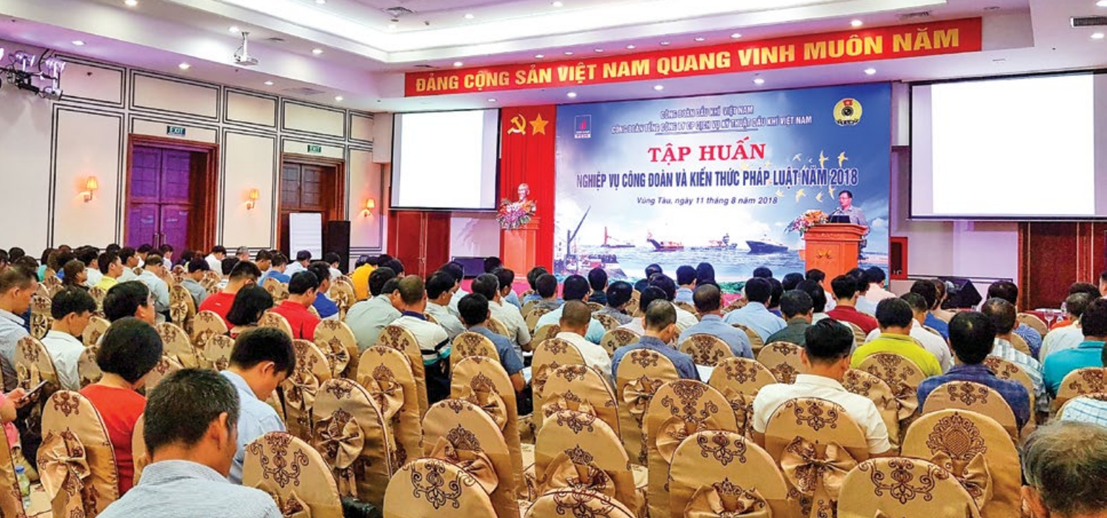
Toàn cảnh Hội nghị tập huấn nghiệp vụ công đoàn và kiến thức pháp luật năm 2018