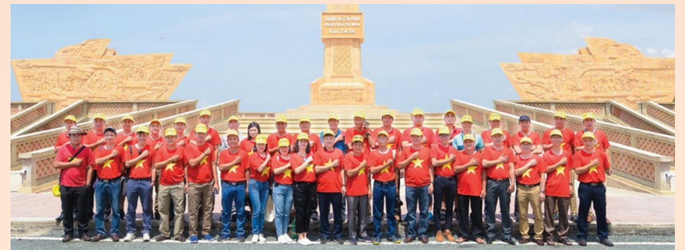
Các đại biểu là Người lao động Dầu khí tiêu biểu và cá nhân xuất sắc trong thực hiện Chỉ thị 05 về nguồn tại Đất mũi Cà Mau nhân dịp Tháng Công nhân 2019