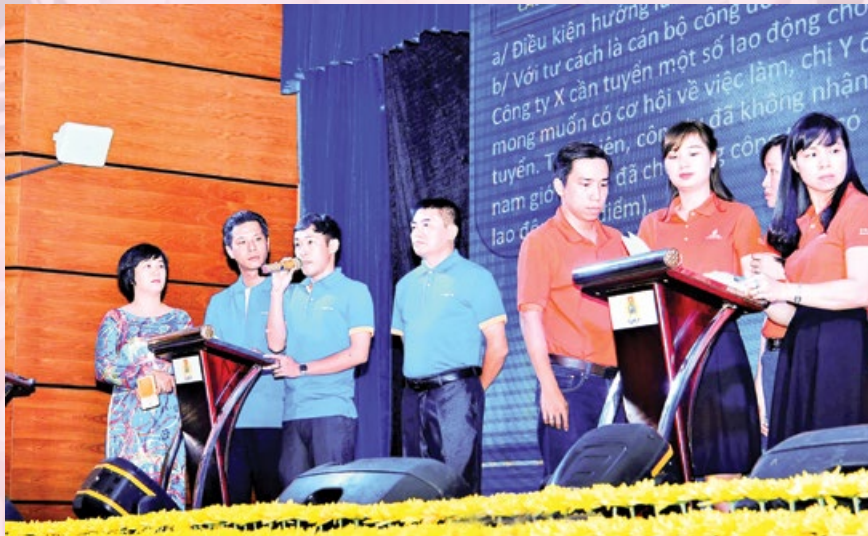
Các cán bộ công đoàn đang trả lời phần thi lý thuyết

Rà soát, sửa đổi, bổ sung, hoàn thiện hệ thống các quy định về công tác cán bộ của tổ chức công đoàn đảm bảo đồng bộ, thống nhất và phù hợp với các quy định của Đảng, pháp luật của Nhà nước. Thống nhất thực hiện đồng bộ các quy định về công tác cán bộ trong tổ chức công đoàn, trong đó: Đối với cán bộ công đoàn chuyên trách phải thực hiện đầy đủ các khâu của công tác cán bộ, trong đó chú trọng khâu đánh giá cán bộ, quy hoạch cán bộ, luân chuyển cán bộ và đào tạo, bồi dưỡng cán bộ; đối với cán bộ công đoàn không chuyên trách, nhất là cán bộ công đoàn cơ sở ở khu vực ngoài nhà nước cần đặc biệt quan tâm việc phát hiện, lựa chọn và đào tạo, bồi dưỡng. Trong đó, lựa chọn, giới thiệu người có năng