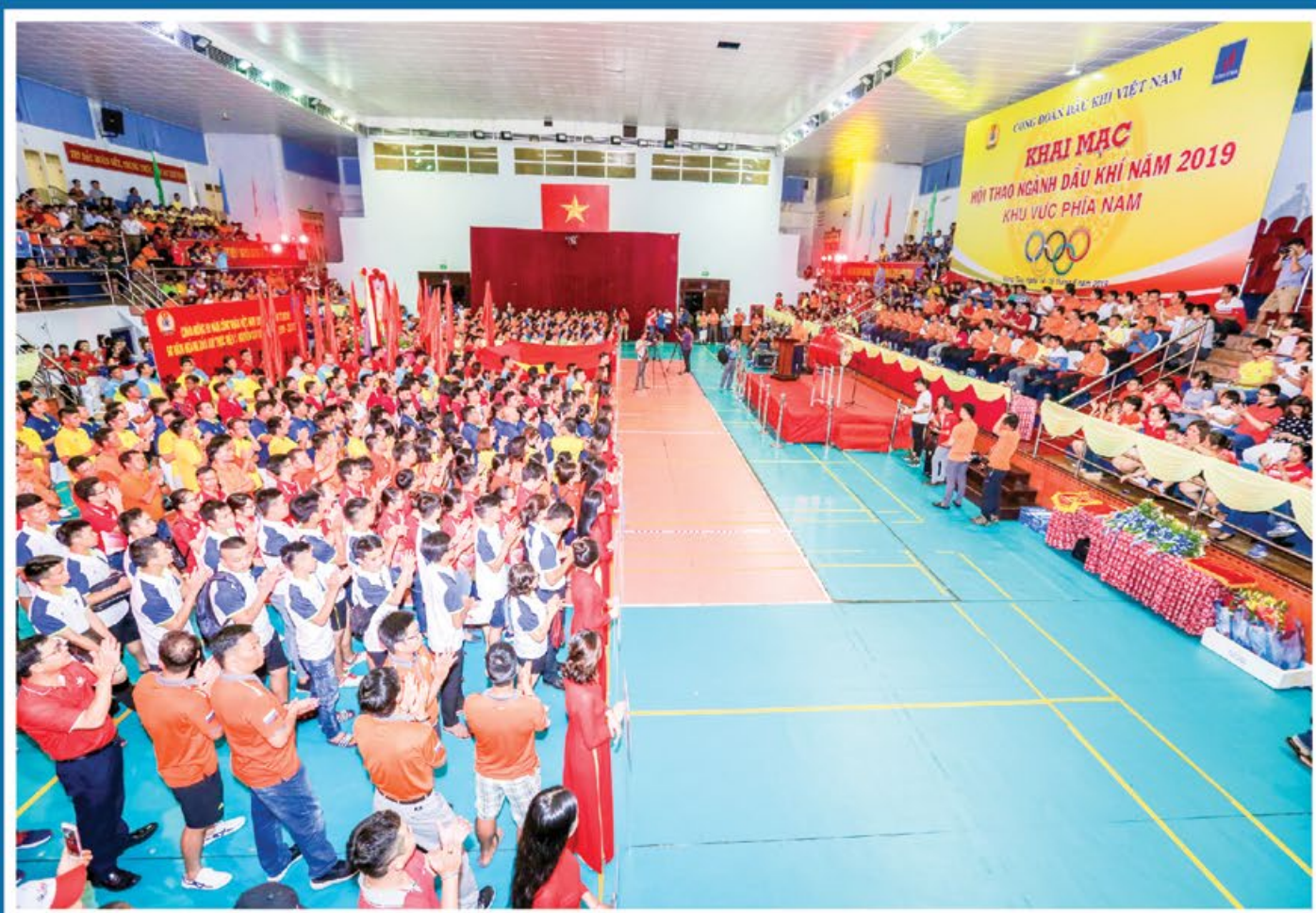
Toàn cảnh hội thao ngành Dầu khí năm 2019 khu vực phía Nam