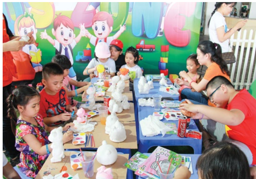
Các cháu thiếu nhi tham gia thi tô tượng

hạnh phúc, quý giá với gia đình, với đồng nghiệp, cùng nhau vượt qua những khó khăn, thử thách trong cuộc sống. Chính vì ý nghĩa đặc biệt này nên hầu hết các đội chơi đều hào hứng, thỏa sức sáng