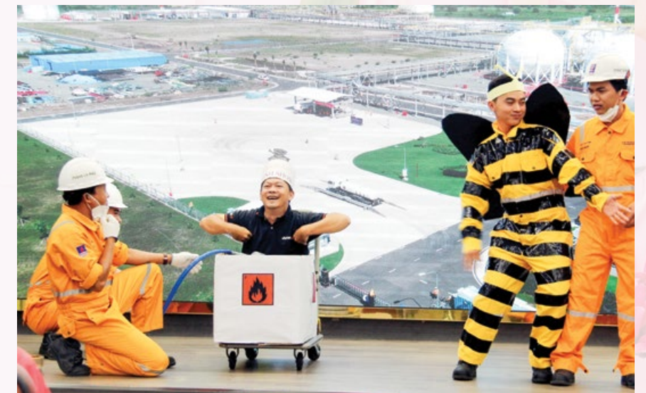
Các hoạt động huấn luyện, bảo đảm an toàn tại PV GAS