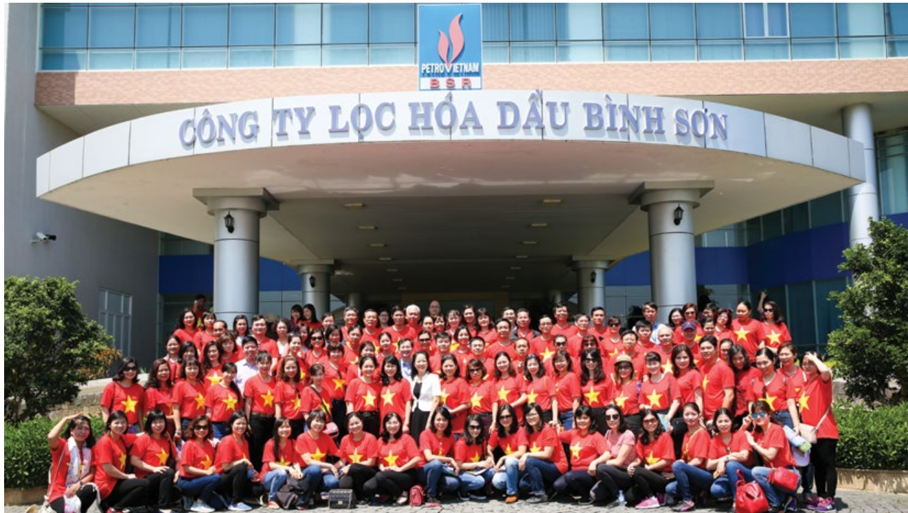
Đoàn đại biểu nữ CNLĐ tham gia chương trình giáo dục truyền thống và lòng yêu ngành tại NMLD Bình Sơn, Quảng Ngãi