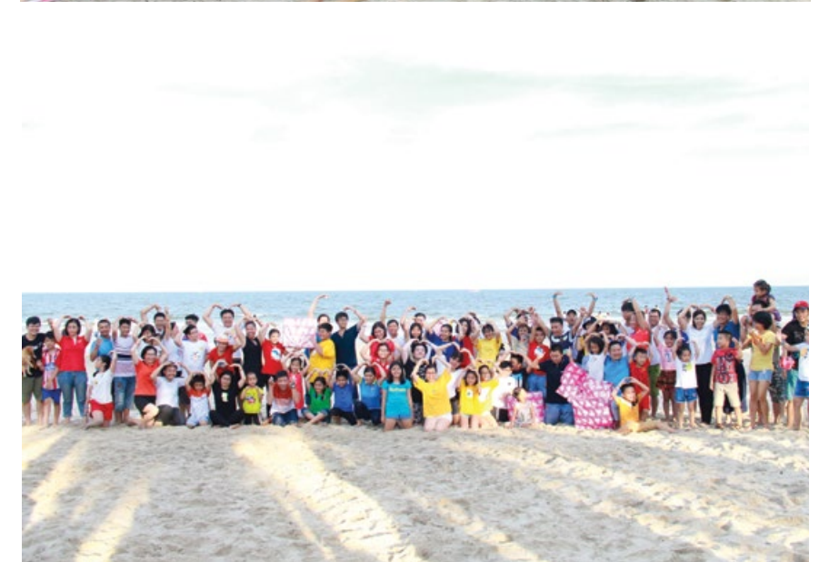
Sôi nổi các trò chơi teambuilding