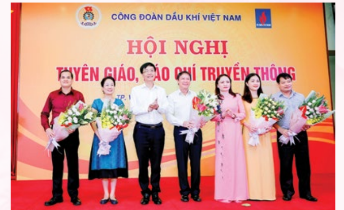
Đại diện Đảng ủy Tập đoàn tặng hoa chúc mừng Ban Biên tập Tạp chí và website CĐ DKVN nhân Ngày Báo chí Cách mạng Việt Nam

Tại hội nghị, CĐ DKVN đã tặng bằng khen cho các tập thể và cá nhân đã tích cực đóng góp trong công tác