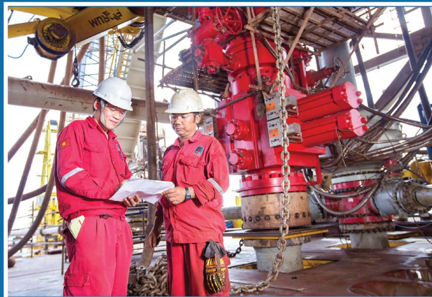
Người lao động PV Drilling trao đổi công việc