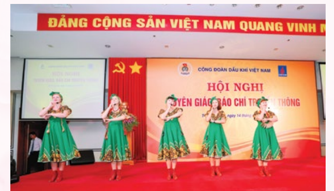
Cán bộ người Nga tại Liên doanh Vietsovpetro biểu diễn văn nghệ chào mừng

báo chí tuyên truyền của CĐ DKVN trong năm qua.