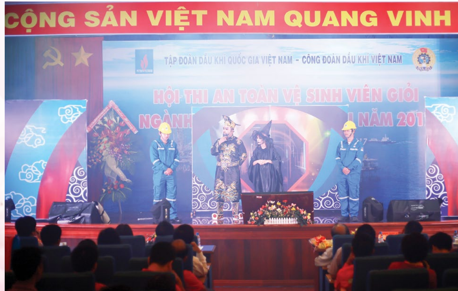
Phần thi tiểu phẩm tại Hội thi ATVSV giỏi năm 2017