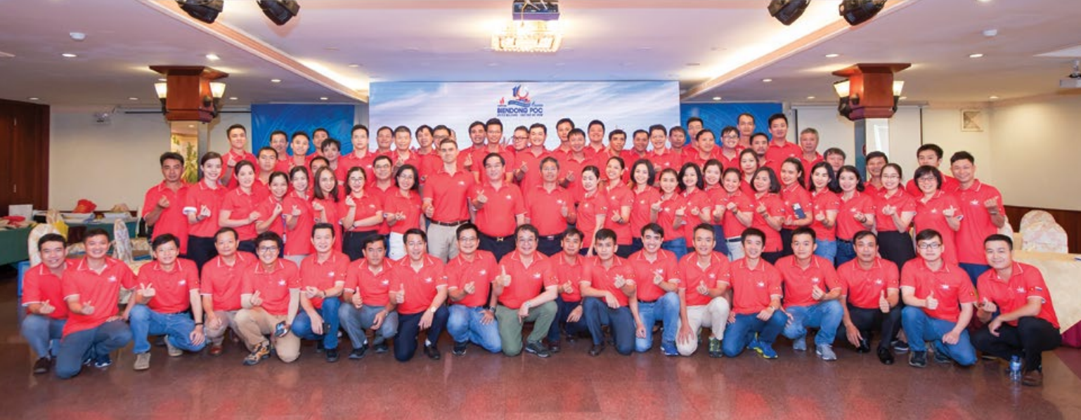
Tập thể CBNV BIENDONG POC chụp ảnh lưu niệm