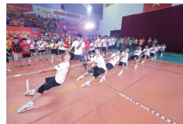
Các đội tham gia thi đấu môn kéo co

Ngay sau Lễ Khai mạc đã diễn ra các cuộc thi đấu