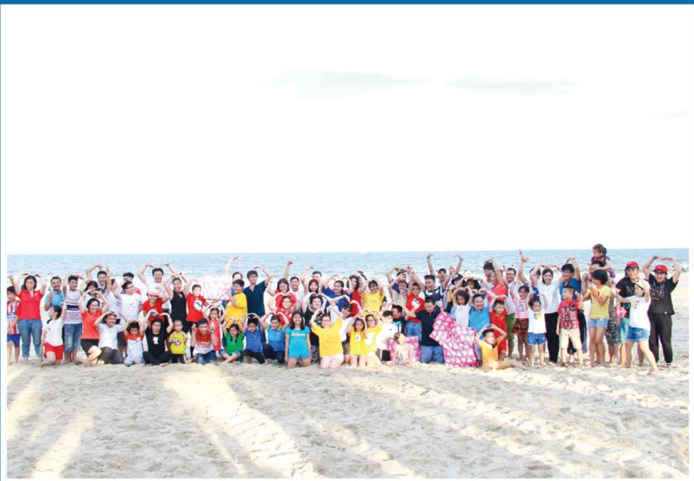
Ngày hội Gia đình của Công đoàn Vietsovpetro