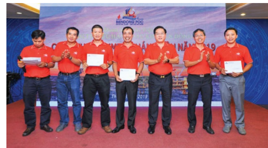
Ban lãnh đạo Công ty trao giải cho các đội tham gia