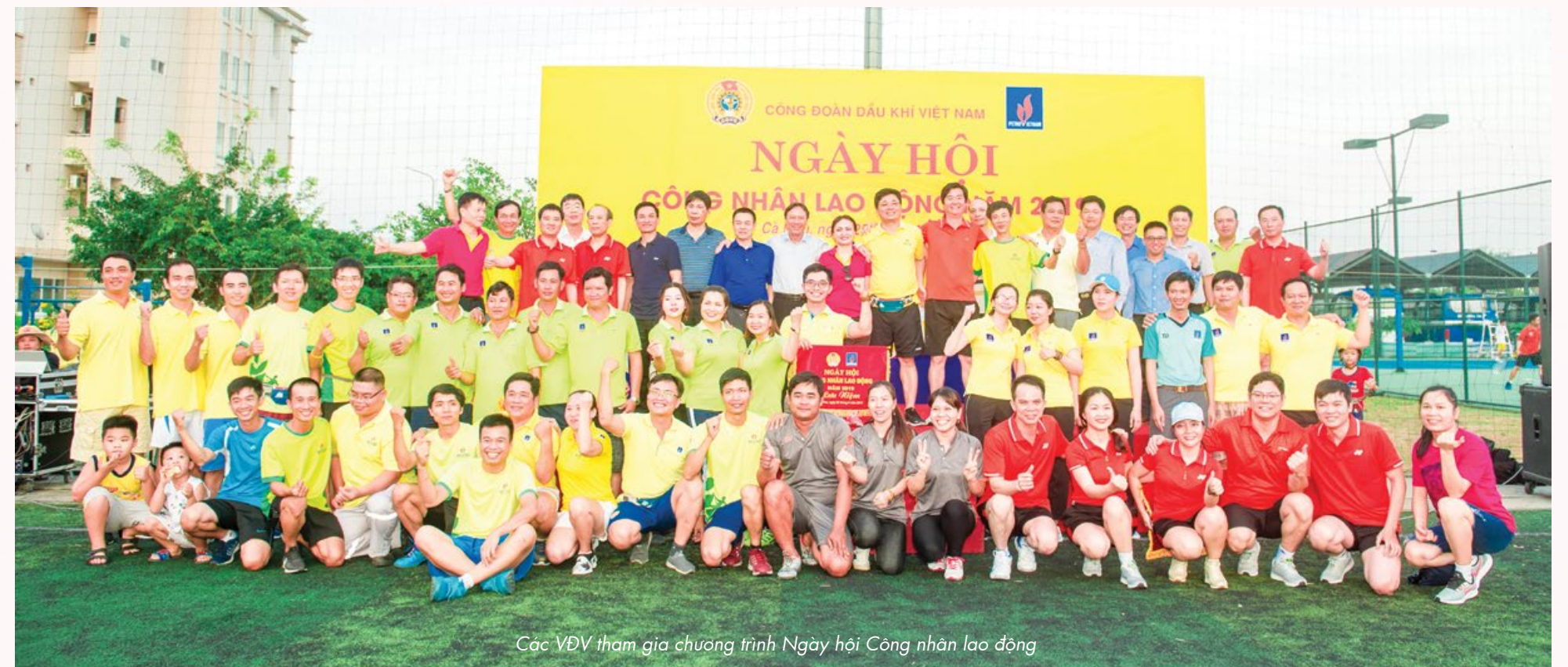
Các VĐV tham gia chương trình Ngày hội Công nhân lao động