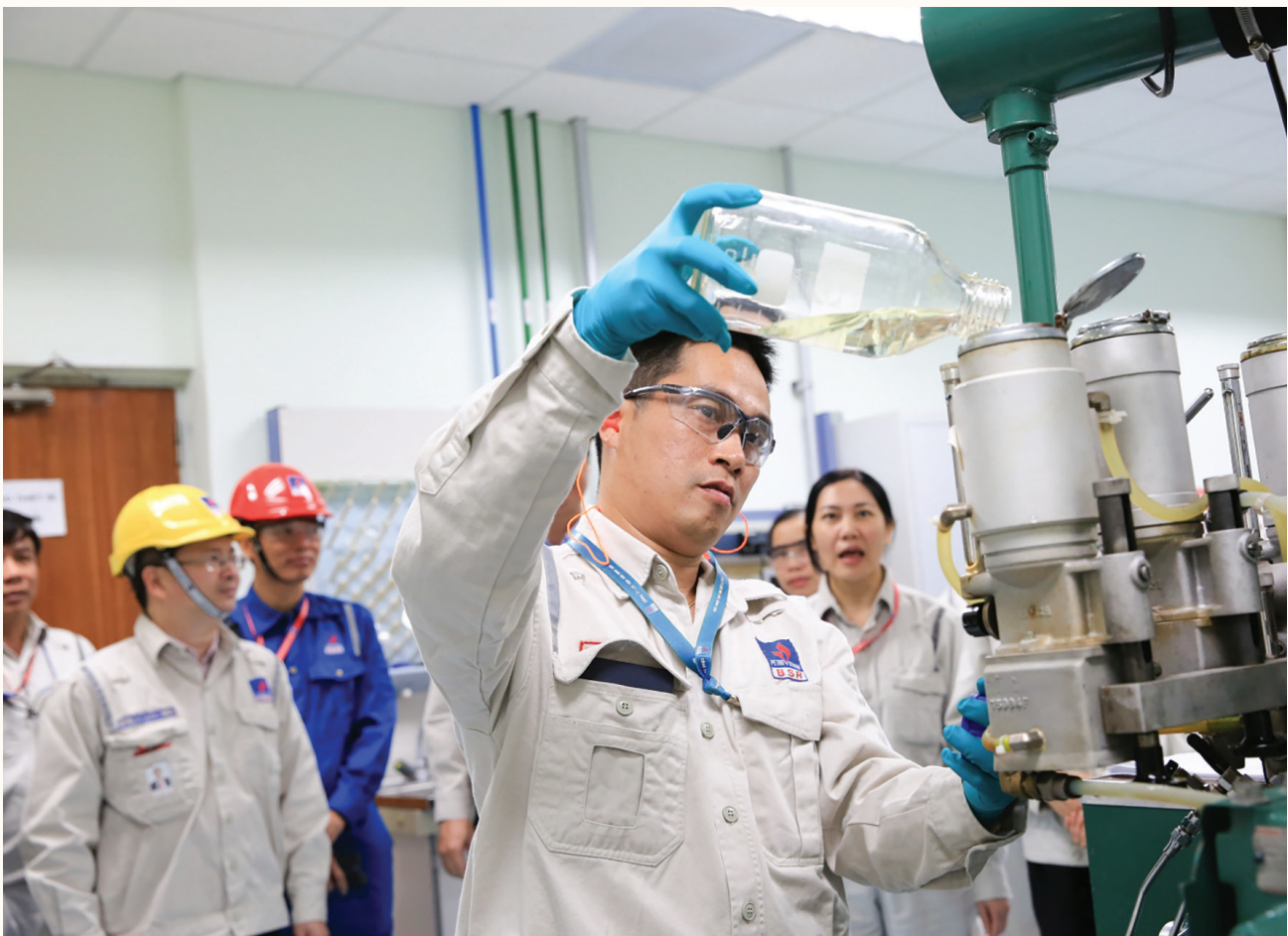
Đẩy mạnh phong trào sáng kiến, sáng chế là một trong những nhiệm vụ quan trọng được CĐ DKVN tích cực đẩy mạnh thực hiện

Sáng tạo: Luôn trăn trở, tìm tòi, đề xuất, nhân rộng mô hình mới, cách làm mới, giải pháp mới; quan tâm nghiên cứu lý luận và tổng kết thực tiễn; cụ thể hóa một cách sáng tạo các chủ trương, nghị quyết của Đảng, của công đoàn cấp trên vào các chương trình, kế hoạch hoạt động của công đoàn cấp mình; đề xuất các giải pháp, biện pháp mới, khoa học, khả thi, sát thực tế để giải quyết các vấn đề của tổ chức công đoàn và của đoàn viên, NLĐ; linh hoạt trong xử lý các tình huống thực tế; ứng dụng mạnh mẽ công nghệ