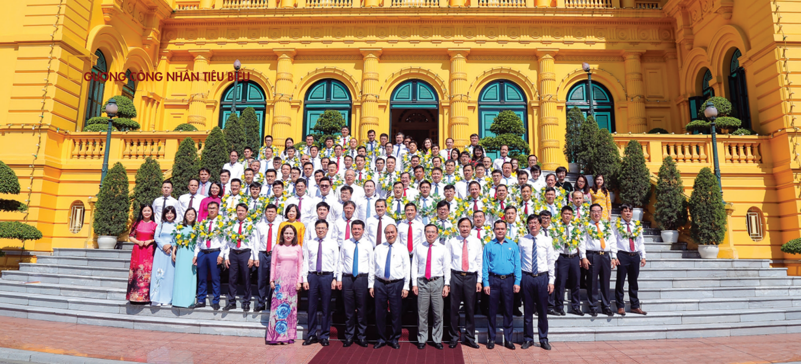
Chủ tịch nước Nguyễn Xuân Phúc với các đại biểu lãnh đạo, cán bộ, người lao động tiêu biểu ngành Dầu khí