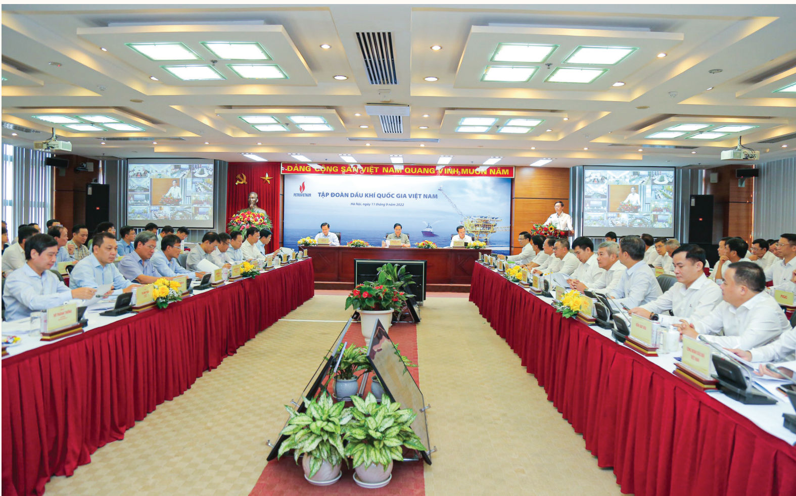
Buổi làm việc của Thủ tướng Chính phủ Phạm Minh Chính với Petrovietnam