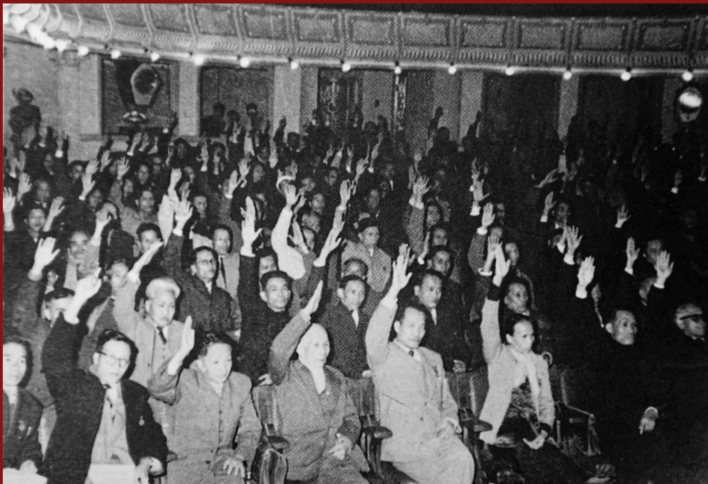
Trong phiên họp của Kỳ họp thứ 11, Quốc hội khóa I đã thông qua Hiến pháp 1946