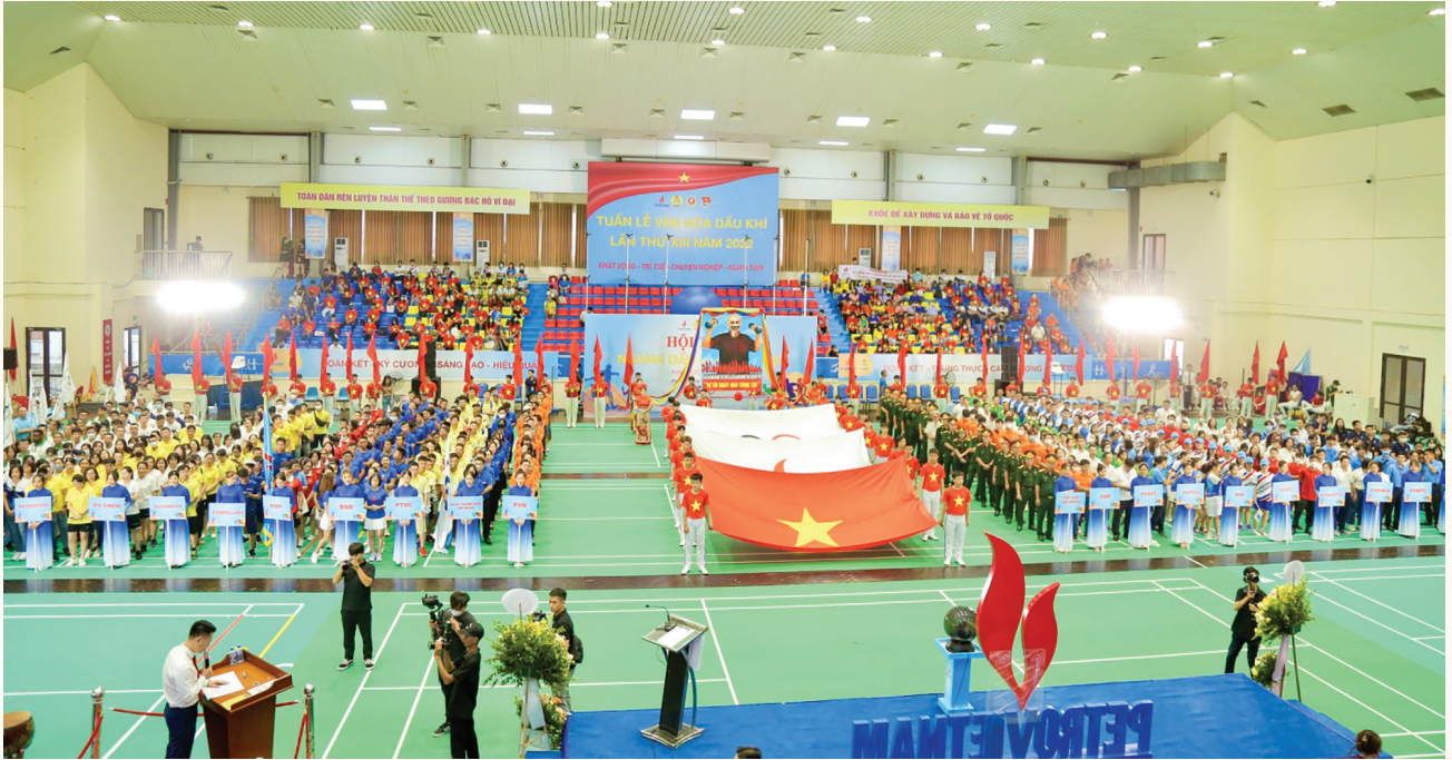
Lễ khai mạc Tuần lễ Văn hóa Dầu khí lần thứ XIII

“ Tuần lễ Văn hóa Dầu khí là một trong những giá trị văn hóa truyền thống được Tập đoàn Dầu khí Việt Nam (Petrovietnam) phát triển, giao Công đoàn Dầu khí Việt Nam (CD DKVN) làm đầu mối tổ chức trong suốt nhiều năm qua. Các hoạt động của Tuần lễ Văn hóa Dầu khí thể hiện khao khát xây dựng Petrovietnam phát triển vững bền dựa trên nền tảng văn hóa Dầu khí và con người Dầu khí với thể chất, trí tuệ, tinh thần và tình cảm phát triển song hành.