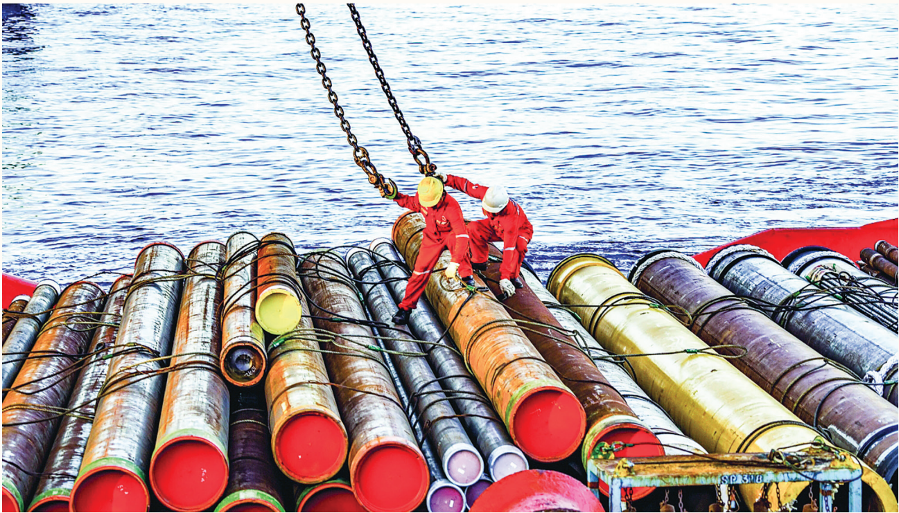
Người lao động Dầu khí làm việc trên biển

phối, nay đã có rất nhiều công ty thành viên của Petrovietnam chuyển sang công ty cổ phần, liên doanh, liên kết... Nguồn nhân lực cũng có sự biến động. Các thể hệ tiếp nối thay thế nhau, các thời kỳ khó khăn, thuận lợi cũng thay đổi theo thời gian.