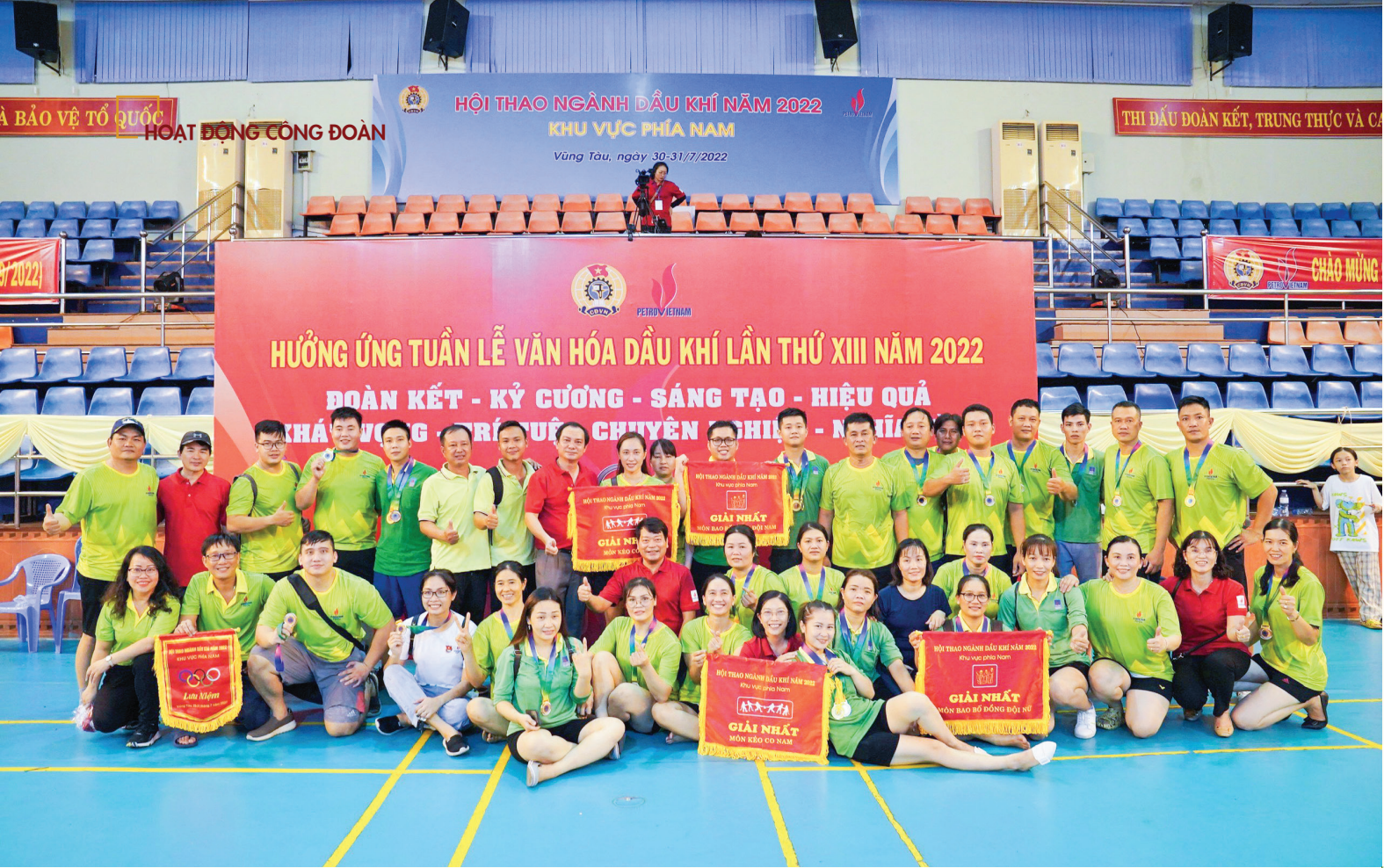
Đoàn VĐV PVFCCo chụp hình lưu niệm tại Hội thao