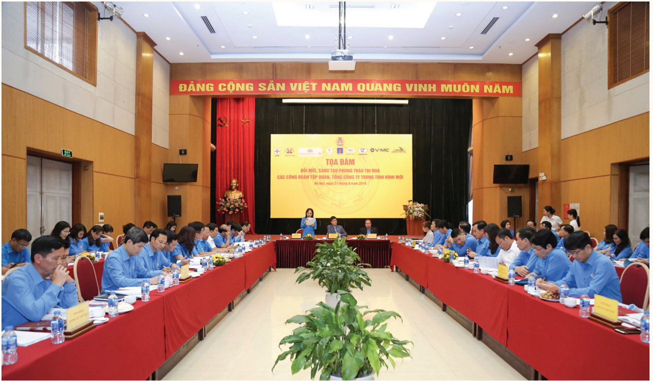
Toàn cảnh tọa đàm “Đổi mới, sáng tạo phong trào thi đua các công đoàn Tập đoàn, Tổng công ty trong tình hình mới”