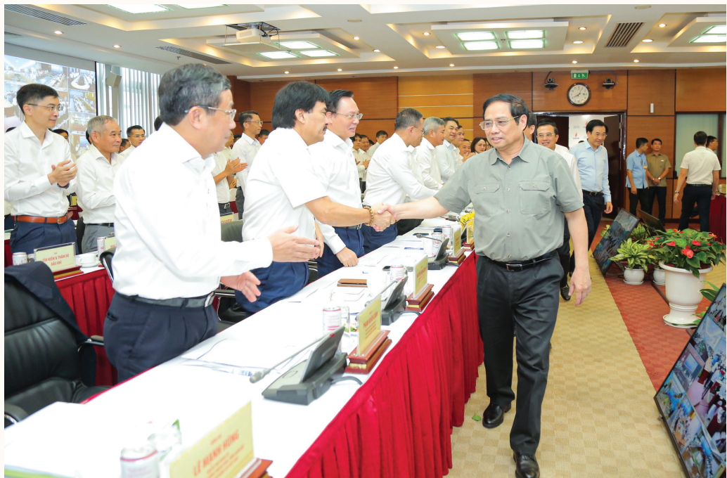
Thủ tướng Chính phủ Phạm Minh Chính thăm và làm việc tại Petrovietnam

B uổi làm việc được tổ chức theo hình thức trực tiếp kết hợp trực tuyến với sự tham gia của người lao động tại các điểm cầu ở các đơn vị thành viên, các công trình dầu khí, giàn khai thác ngoài khơi biển Việt Nam và tại Liên bang Nga.