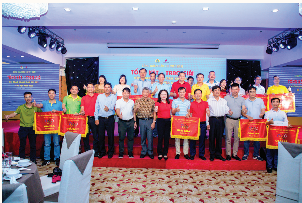
Các đại biểu chụp hình lưu niệm cùng các đoàn tham dự hội thao tại lễ bế mạc Hội thao ngành Dầu khí năm 2022 khu vực phía Nam

hóa Dầu khí lần thứ XIII và Hội thao ngành Dầu khí năm 2022, CĐ DKVN đã tổ chức Giải bóng đá Cup Công đoàn Dầu khí lần thứ I. Qua đó, chức vô địch giải năm nay thuộc về PV GAS.