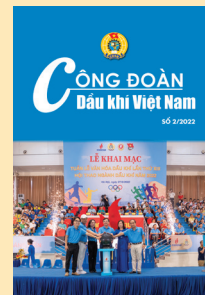
Các đại biểu thực hiện nghi thức khai mạc Tuần lễ Văn hóa Dầu khí lần thứ XIII