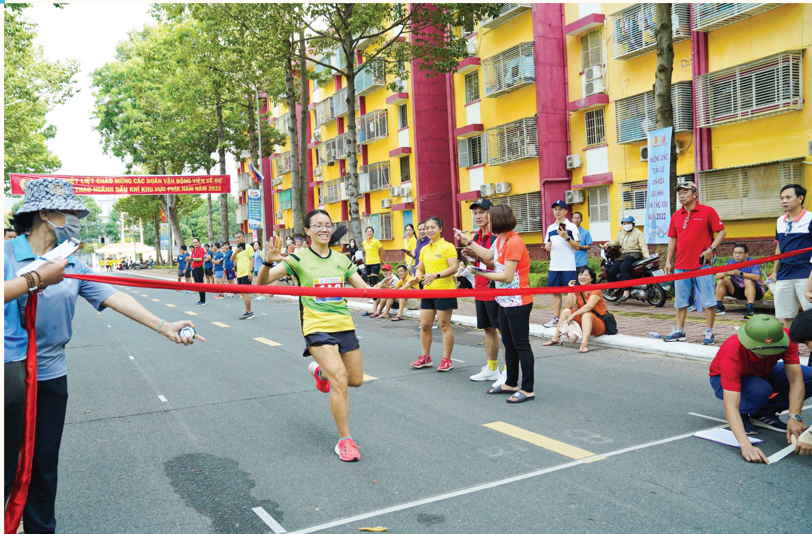
Hình ảnh thi đấu của VĐV PVFCCo tại Hội thao