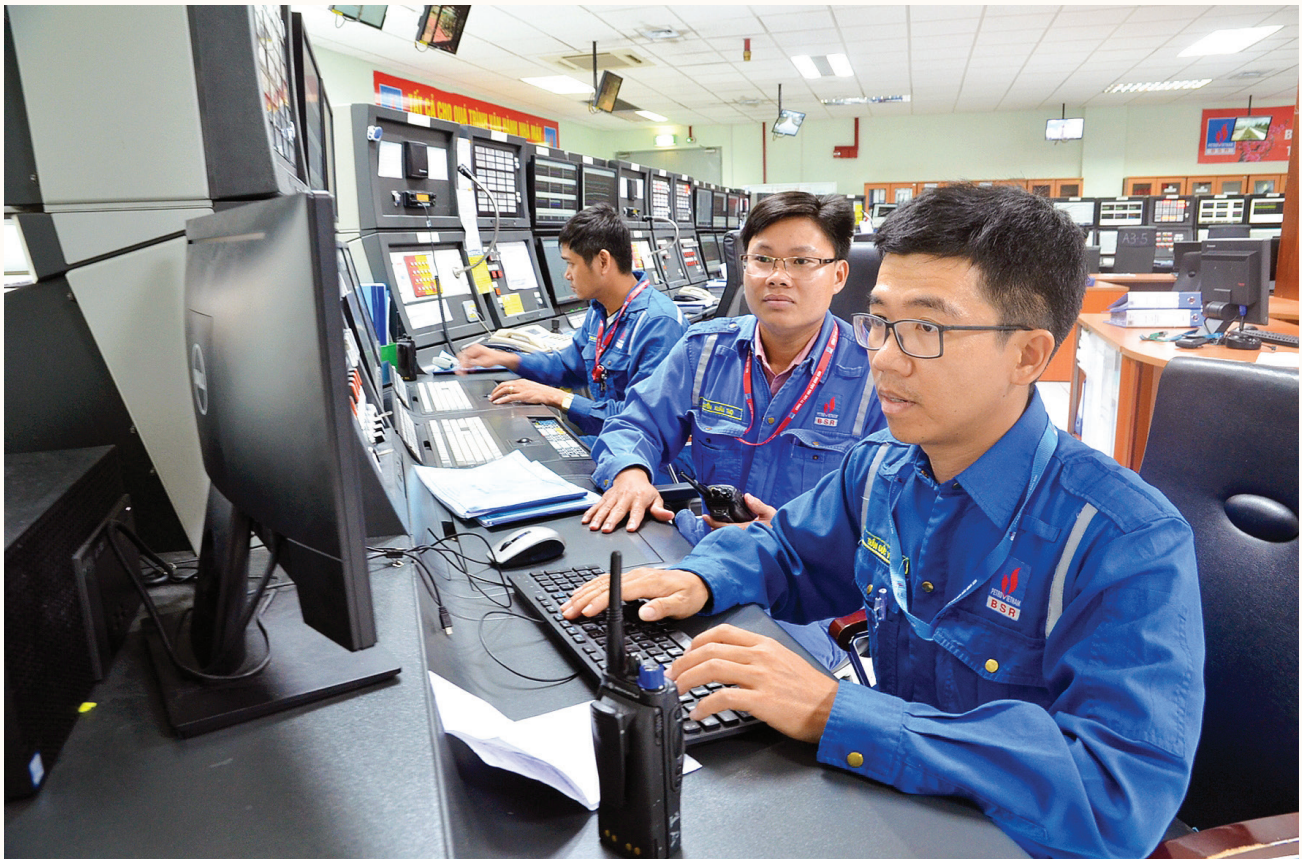
Người lao động BSR