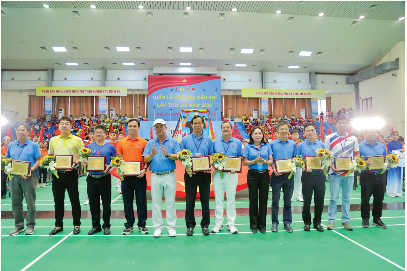
Tuyên dương các đơn vị tiêu biểu trong phong trào xây dựng đời sống văn hóa cơ sở

những giá trị cốt lõi của văn hóa và con người Dầu khí; tạo sân chơi, không khí phấn khởi, tạo điều kiện giao lưu học hỏi giữa các đơn vị để đội ngũ người lao động thêm sức khỏe, năng lượng, thêm động lực để gắn bó với tập thể, hăng say lao động sản xuất, cống hiến cho sự phát triển của ngành.