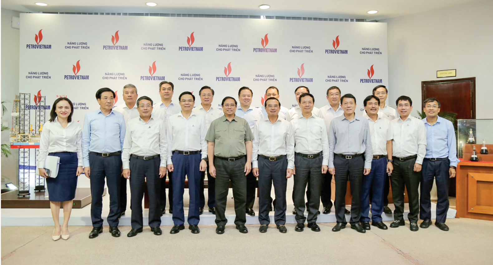
Thủ tướng Chính phủ và lãnh đạo các bộ, ngành chụp ảnh lưu niệm với tập thể lãnh đạo Petrovietnam

nhiệm vụ cụ thể cho các bộ, ngành để giải quyết các kiến nghị còn lại của Petrovietnam, khẩn trương trình cấp có thẩm quyền xem xét, quyết định, tạo điều kiện tốt nhất cho Petrovietnam phát triển.