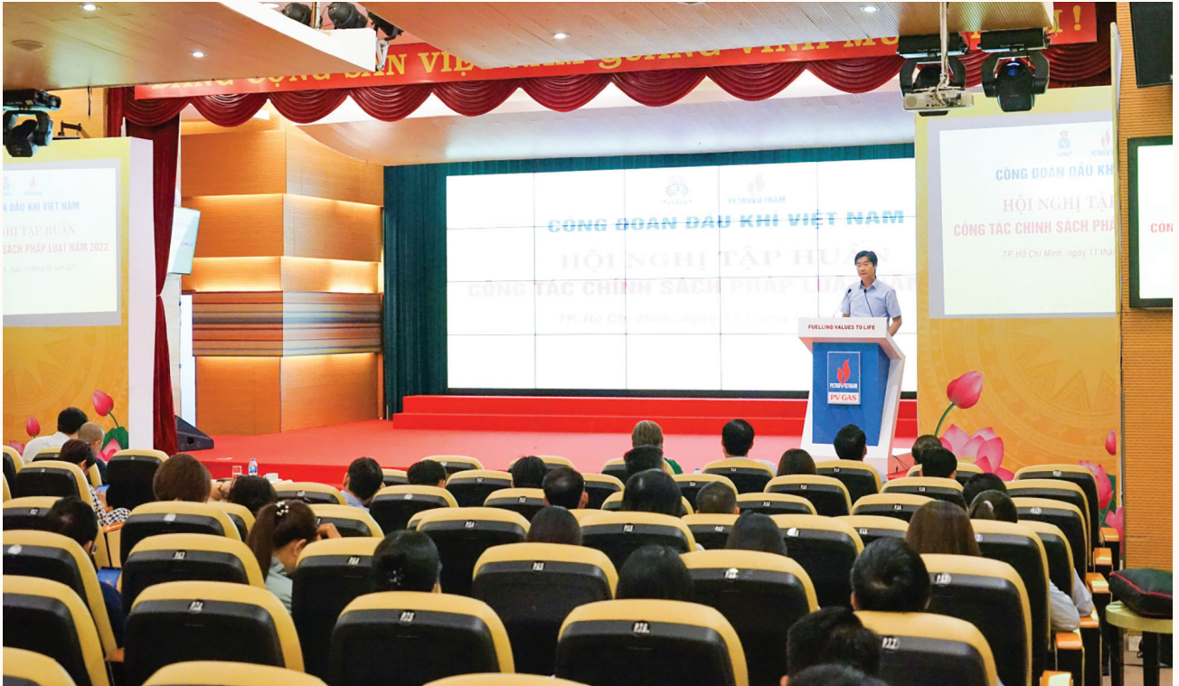
Hội nghị tập huấn công tác chính sách pháp luật năm 2022 phía Nam