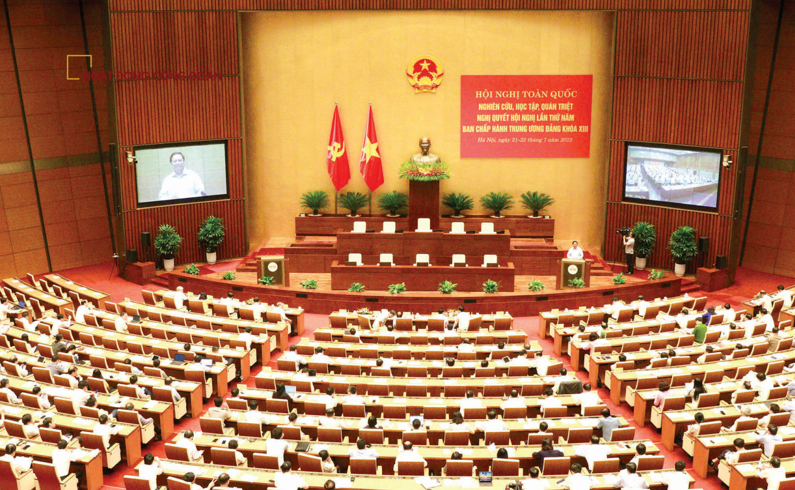
Toàn cảnh hội nghị