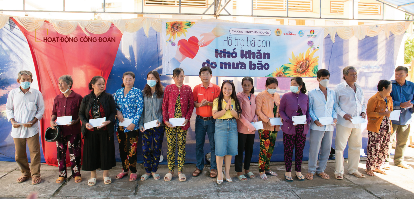
Ban Nữ công PVCFC trao quà hỗ trợ bà con khó khăn do mưa bão