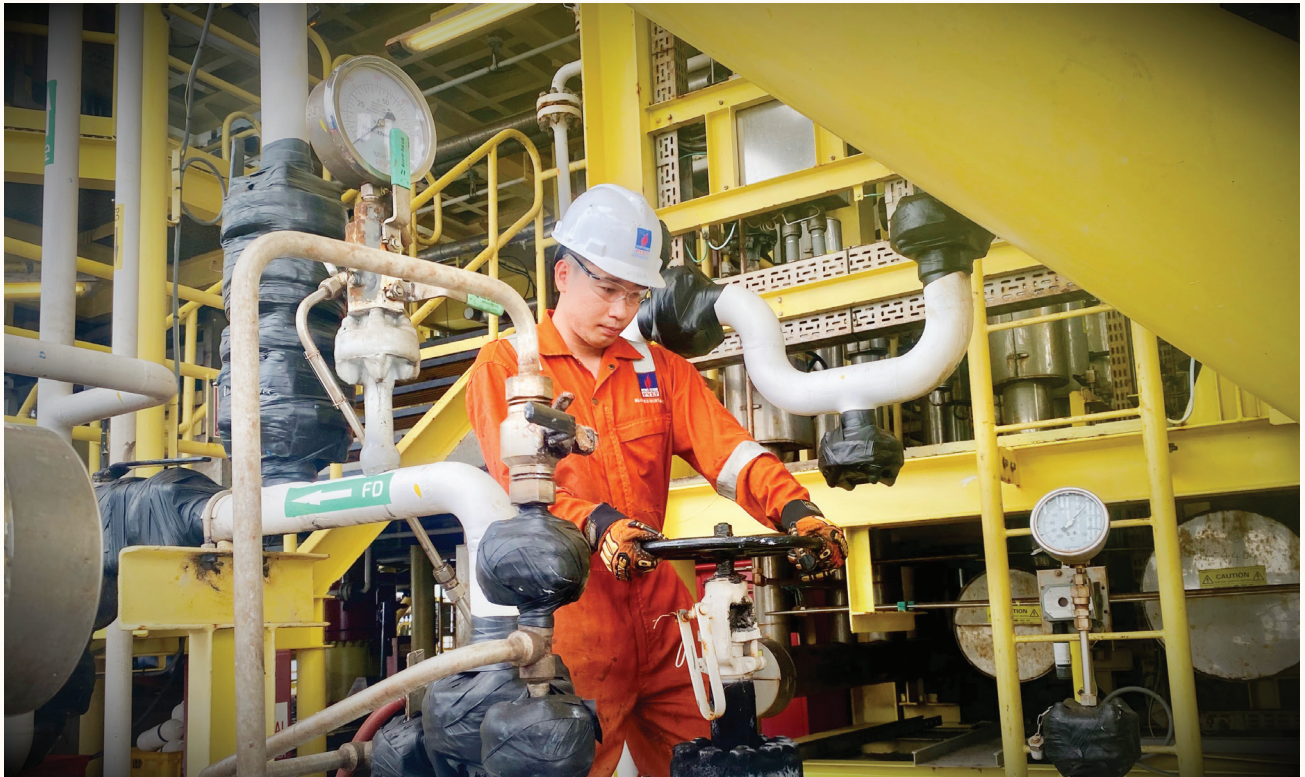
Người lao động PVEP

Qua quá trình này, Petrovietnam đã phổ quát được nhận thức về CDS và vai trò của CDS trong toàn hệ thống, biến nó thành một phần của văn hóa dầu khí.