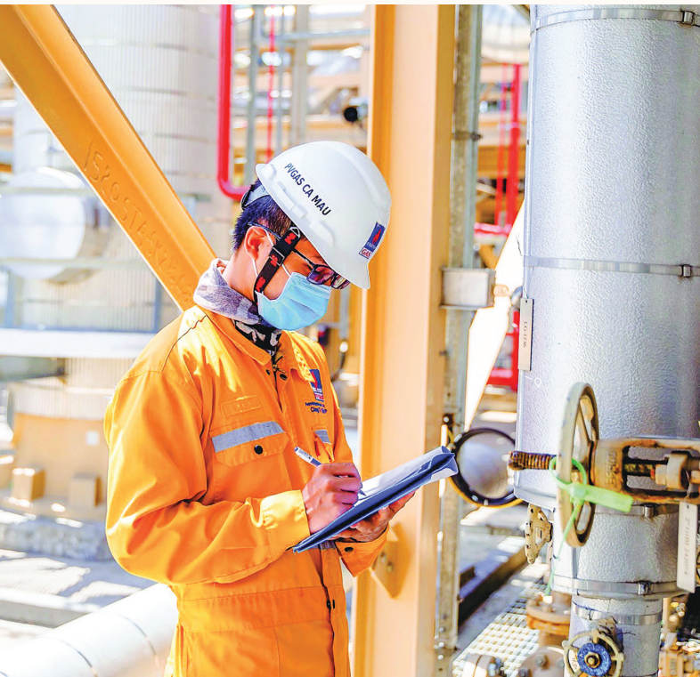
Người lao động PV GAS

Đầu năm 2022, chúng ta đã kịp thời dự báo được các hệ lụy từ cuộc chiến Nga - Ukraine, các xung đột tác động đến kinh tế vĩ mô sẽ khiến giá dầu thô tăng mạnh. Thị trường biến động sẽ dẫn đến khan hiếm nguồn cung xăng dầu trong nước, đứt gãy các chuỗi cung ứng. Nhờ quản trị biến động, Petrovietnam có thể tận dụng cơ hội đẩy mạnh sản lượng lọc dầu, tận dụng được thời kỳ biên lợi nhuận của ngành lọc dầu rất cao. Ngành phân bón cũng có hiệu quả tốt do giá thị trường thuận lợi và sản xuất an toàn, ổn định. Đó là thành quả đến từ quản trị biến động, dự báo, xây dựng kịch bản, quyết liệt hành động mang tính hệ thống trong cả khối sản xuất và khối thương mại.