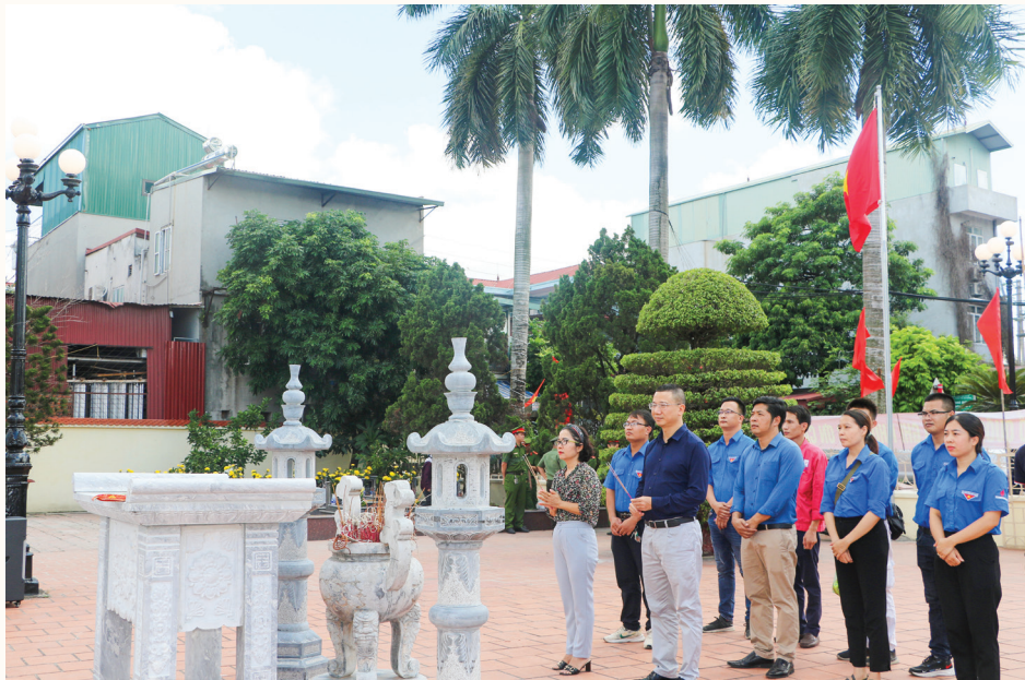
Tháng 7 hằng năm VNPOLY đều dâng hương, dâng hoa tưởng nhớ công ơn của các Anh hùng liệt sĩ

H ưởng ứng Tuần lễ Văn hóa Dầu khí năm 2022 và 47 năm Ngày Thành lập Tập đoàn Dầu khí Việt Nam (3/9/1975 - 3/9/2022), VNPOLY đã có nhiều hoạt động cụ thể và thiết thực. Ban Tổng giám đốc, Công đoàn và Đoàn Thanh niên VNPOLY đã kêu gọi toàn thể CBCNV Công ty thể