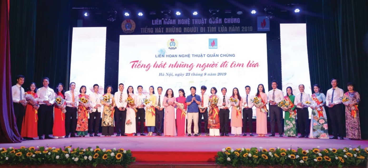
Lãnh đạo Tập đoàn, CĐ DKVN tặng hoa, cúp lưu niệm cho đại diện các đoàn tham gia hội diễn