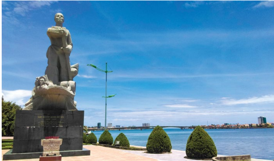
Tượng mẹ Suốt bên sông Nhật Lệ, Đồng Hới, Quảng Bình

Một ngày giữa tháng 8, chúng tôi - những cán bộ, đảng viên, CNVLD ngành Dầu khí - được đến Quảng Bình trong dịp Đảng ủy Tập đoàn Dầu khí Quốc gia Việt Nam đã tổ chức Tập huấn nghiệp vụ cấp ủy, nghiệp vụ công tác đảng viên năm 2019. May mắn cho tôi được tham gia với thành phần là chuyên viên trực tiếp tham mưu, xử lý các nghiệp vụ công tác đảng. Đến Quảng Bình thăm bến sông Nhật Lệ, được đứng trước tượng đài uy nghi của mẹ Suốt, để tự tay mình thấp nén hương, nghiêng mình tưởng nhớ đến mẹ, lòng bồi ngùi xúc động, bao cảm xúc dâng trào, tự hào quá đỗi người phụ nữ Việt Nam.