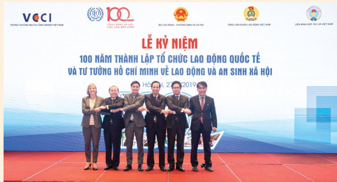
Đại diện ILO, lãnh đạo Bộ, ngành, TLD tham gia Lễ kỷ niệm 100 năm thành lập ILO

100 năm trước, vào năm 1919, đứng lên từ tro tàn của Thế chiến thứ I, các đại biểu tại Hội nghị Hòa bình Paris quyết tâm không bao giờ để lặp lại trải nghiệm đó, đã cùng khẳng định niềm tin rằng “một nền hòa bình phổ quát và bền vững chỉ có thể được thiết lập trên cơ sở công bằng xã hội”.