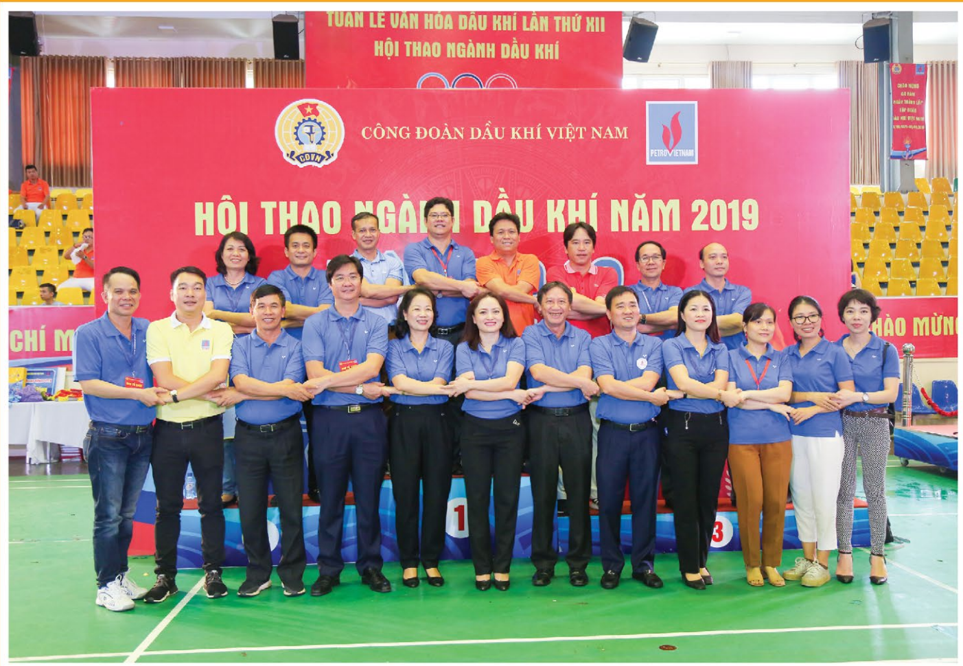
Lãnh đạo CĐ DKVN và các lãnh đạo công đoàn cơ sở chụp ảnh lưu niệm tại Tuần lễ Văn hóa Dầu khí năm 2019