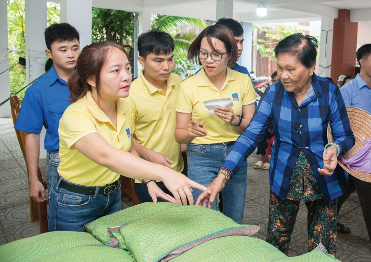
Ban Nữ công chuyển gạo về tận các vùng ven biển hỗ trợ bà con