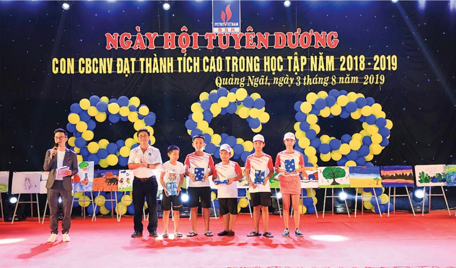
Trao quà cho các cháu đạt thành tích cao ở phần thi bơi

năm học 2018 - 2019. Đây là dịp tuyên dương, động viên tinh thần nỗ lực trong học tập trong suốt năm học qua và tạo sân chơi bổ ích nhằm trang bị cho con CBCNV những kỹ năng mềm và tham gia các hoạt động giao lưu, gắn kết, tự tin trong các hoạt động sinh hoạt tập thể.