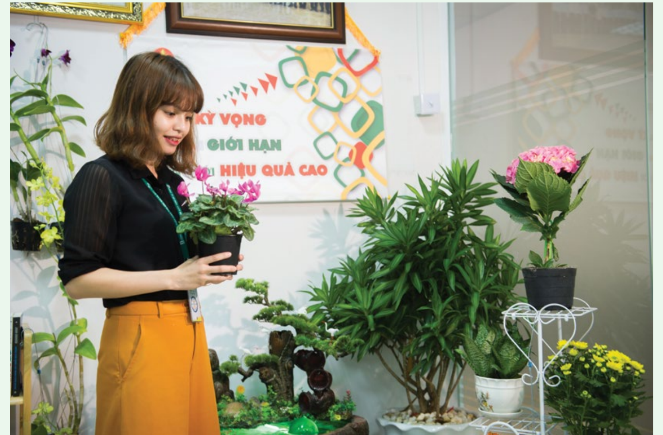
Một góc xanh văn phòng tại Đạm Cà Mau