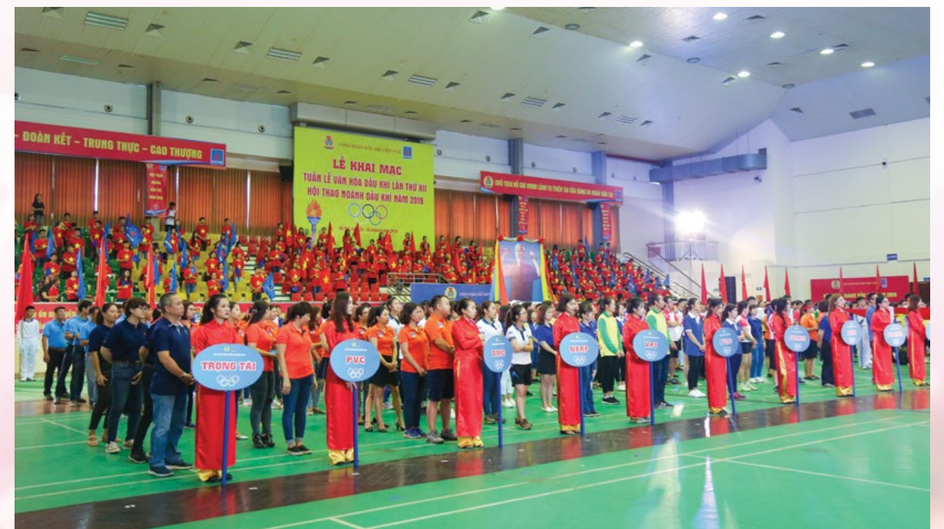
Toàn cảnh lễ khai mạc Tuần lễ Văn hóa Dầu khí lần thứ XII