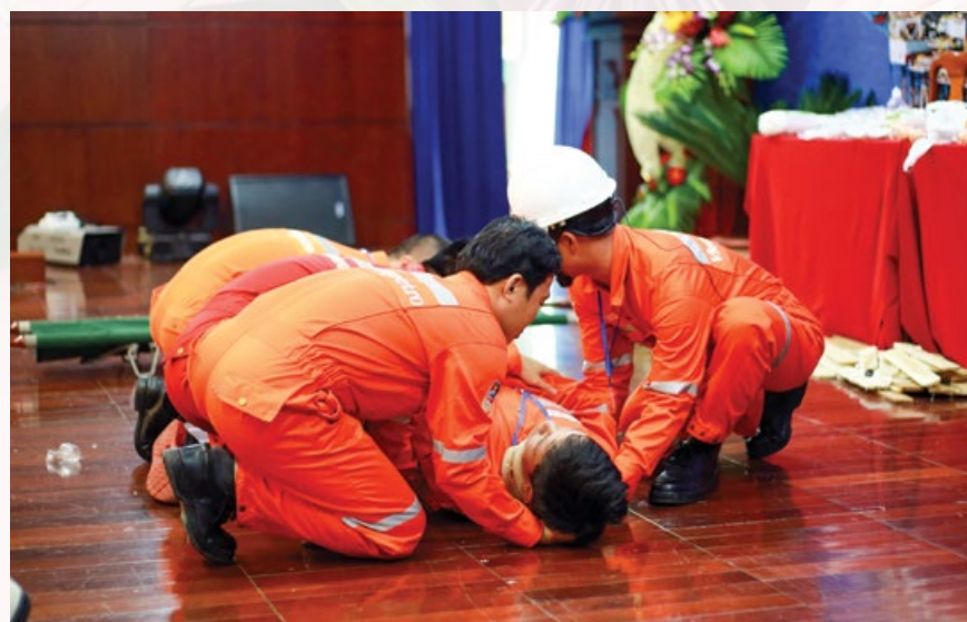
Phần thi sơ cấp cứu tại Hội thi ATVSV giỏi năm 2017

Hội thi là dịp để các đơn vị nâng cao kỹ năng, phương pháp hoạt động trong công tác ATVSLĐ, công tác phòng chống cháy nổ (PCCN) cho đội ngũ cán bộ làm công tác ATVSLĐ và phát huy tốt hơn nữa vai trò hoạt động của mạng lưới an toàn vệ sinh viên (ATVSV) tại các cấp đơn vị; đẩy mạnh công tác tuyên truyền, phổ biến các văn bản pháp luật về chế độ chính sách ATVSLĐ, PCCN nhằm nâng cao nhận thức của người sử dụng lao động và người lao động tại các đơn vị tích cực tham gia công tác ATVSLĐ, tạo thành phong trào quần chúng rộng rãi, xây