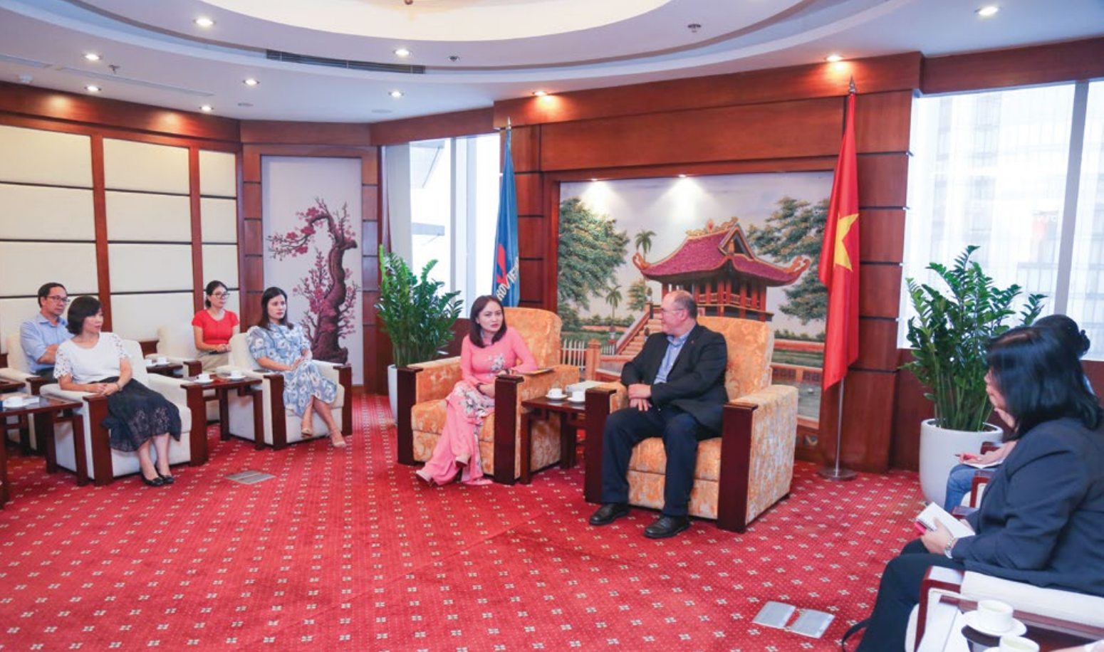
Toàn cảnh buổi tọa đàm