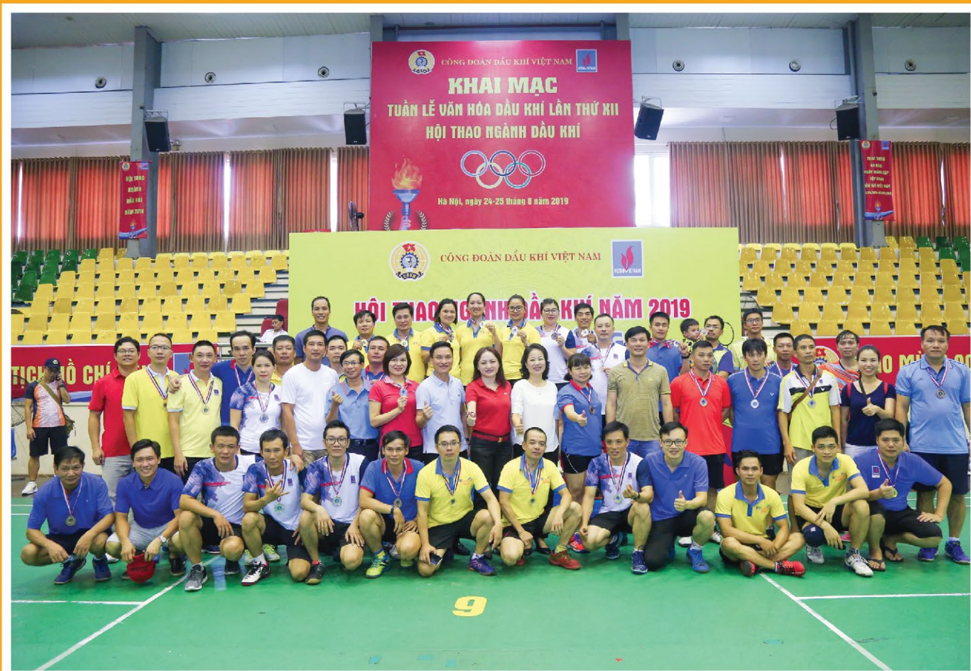
Lãnh đạo CĐ DKVN cùng các vận động viên tham gia môn kéo co chụp ảnh lưu niệm