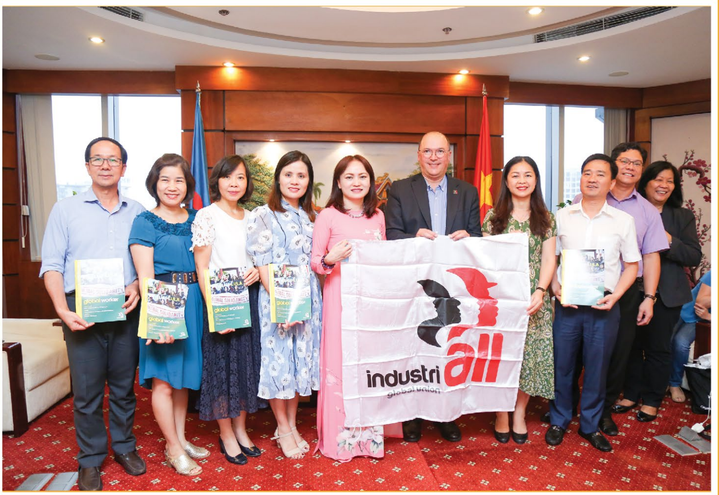
Lãnh đạo Công đoàn Dầu khí Việt Nam chụp ảnh lưu niệm với Tổng Thư ký Công đoàn IndustriALL