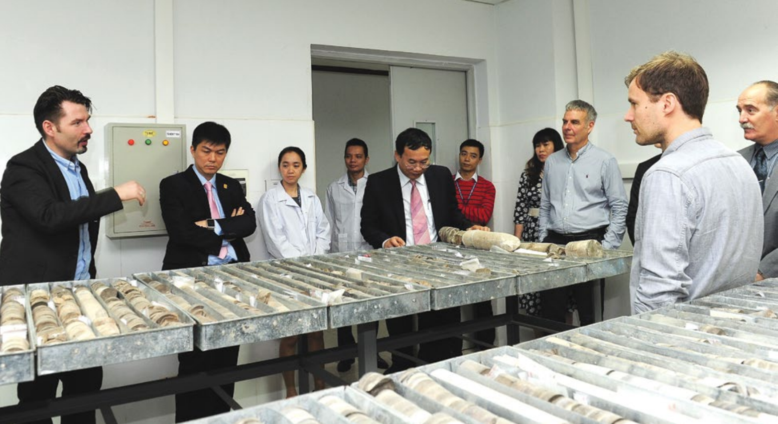
Các chuyên gia của Cục Địa chất Đan Mạch và Greenland thăm kho lưu trữ mẫu của VPI