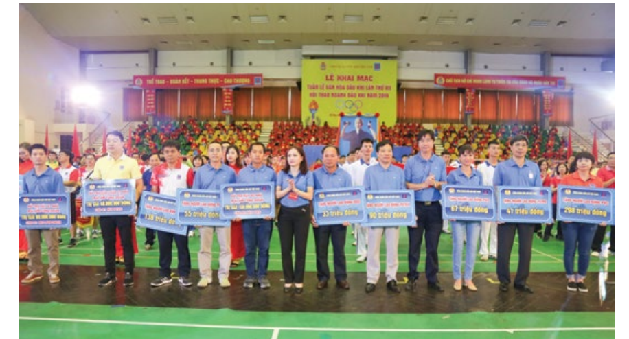
Lãnh đạo CĐ DKVN trao hỗ trợ NLĐ khó khăn của các đơn vị

Hàng năm cứ mỗi dịp Tuần lễ Văn hóa Dầu khí đến với người lao động Dầu khí, Công đoàn Dầu khí Việt Nam (CĐ DKVN) luôn luôn quan tâm và chăm lo tốt đời sống vật chất, tinh thần cho đoàn viên, người lao động với tinh thần vui tươi, phấn khởi, an toàn và tiết kiệm.