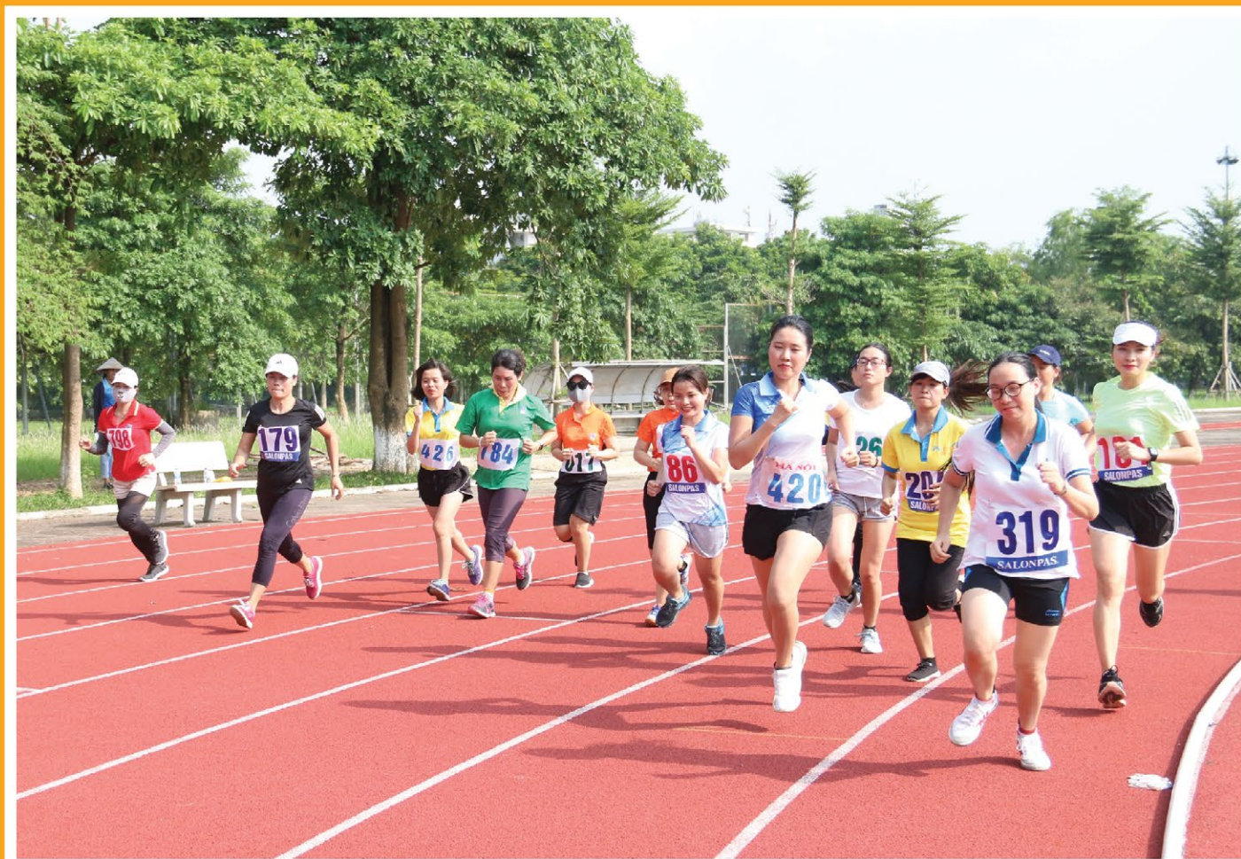
Các vận động viên tham gia phần thi điền kinh