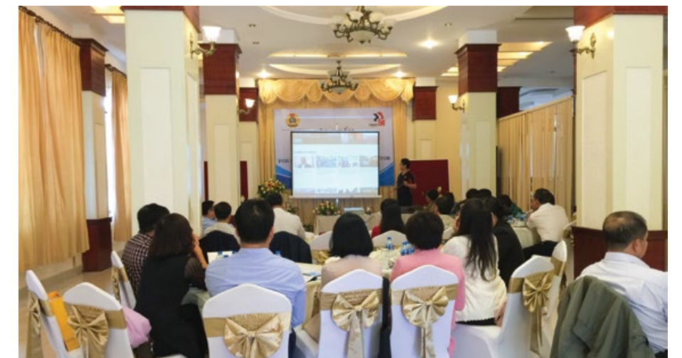
Toàn cảnh buổi Tập huấn