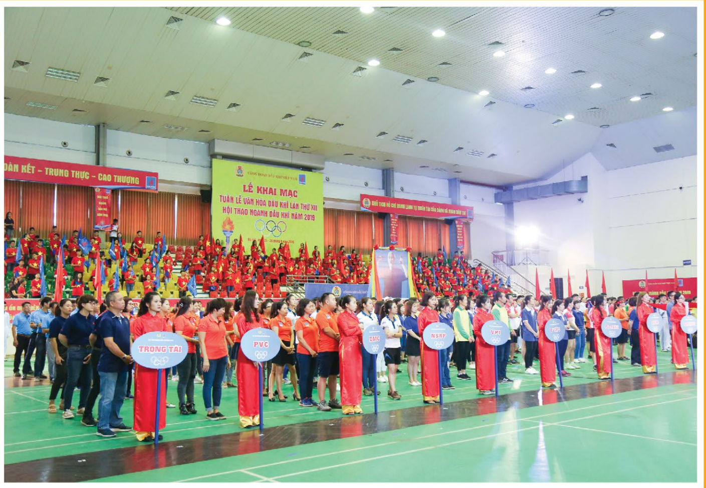
Toàn cảnh Lễ khai mạc Tuần lễ Văn hóa Dầu khí phía Bắc năm 2019