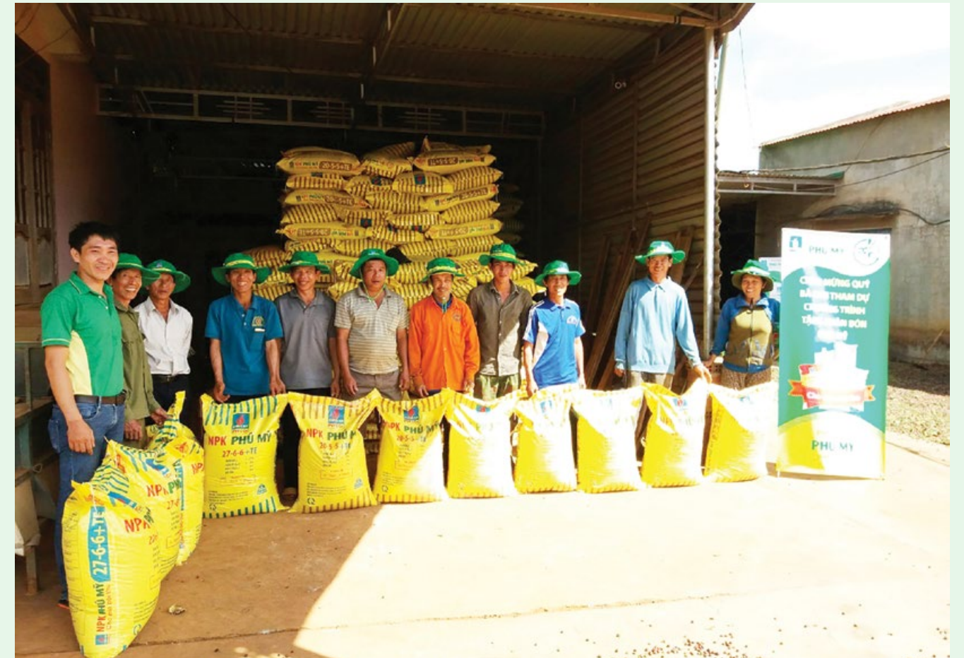
Thương hiệu Phân bón Phú Mỹ có giá trị nhất trong lĩnh vực nông nghiệp

Để đảm bảo năng suất, chất lượng của thương hiệu trái cây Khánh Sơn, các cơ quan chức năng và bà con nông dân Khánh Sơn rất quan tâm lựa chọn các sản phẩm vật tư nông nghiệp uy tín, có hướng dẫn quy trình sử dụng phù hợp. Với bộ sản phẩm chất lượng cao, đa dạng, hệ thống