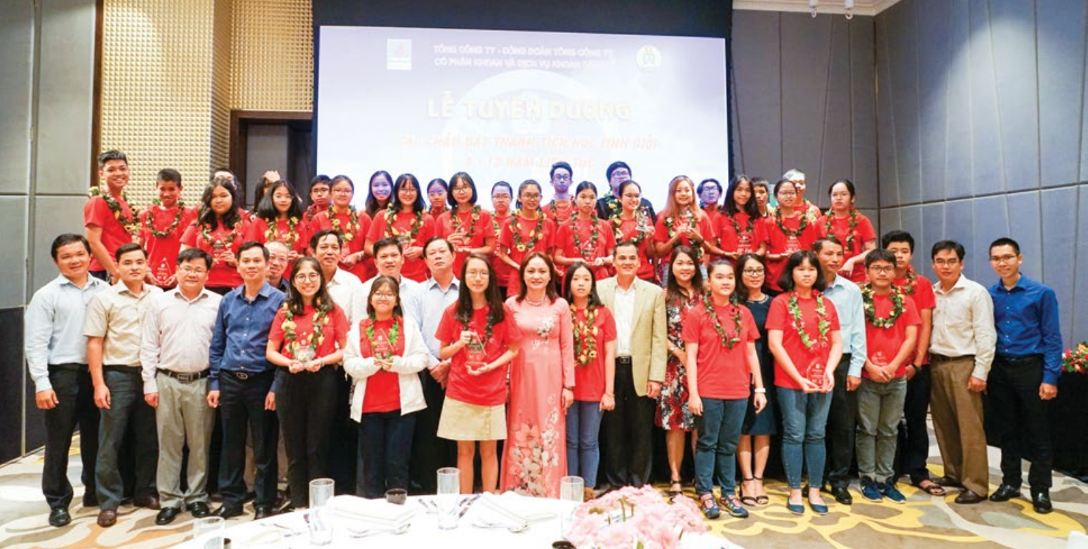
44 học sinh giỏi từ 8 - 12 năm liên tục và gương "Người tốt việc tốt" được tuyên dương