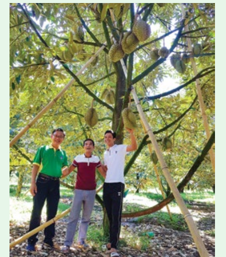
Vườn sầu riêng sử dụng Phân bón Phú Mỹ

Danh hiệu này chỉ là một trong "hat-trick" danh hiệu uy tín do các nhà đầu tư và báo chí tài chính dành cho PVFCCo trong năm 2019. Ngoài danh hiệu Top 50 DN niêm yết tốt nhất Việt Nam, PVFCCo cũng được chính Tạp chí Forbes Việt Nam đánh giá là một trong 50 thương hiệu dẫn đầu Việt