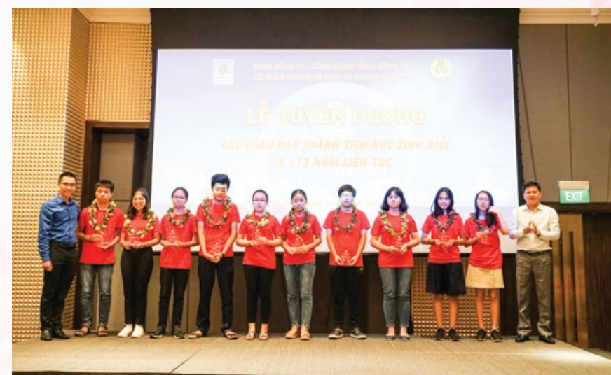
Năm học 2018 - 2019, toàn PV Drilling có tổng cộng 43 cháu đạt danh hiệu học sinh giỏi từ 8 - 12 năm liên tục