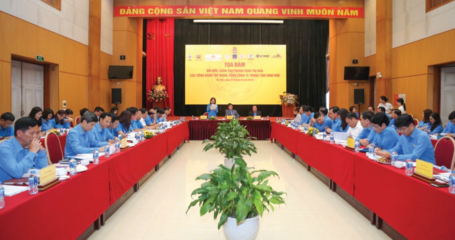
Toàn cảnh buổi tọa đàm