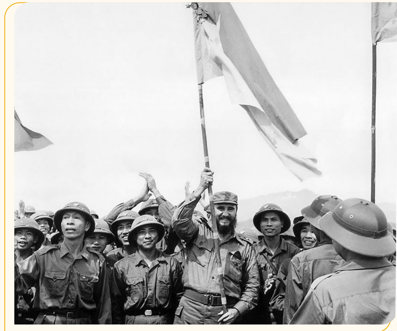
Đồng chí Fidel Castro phát cao lá cờ Bách chiến, bách thắng lập lách Huân chương của Quân Giải phóng Trị Thiên - Huế

Đồng chí Hoàng Tùng, nguyên Bí thư Trung ương Đảng, Chủ tịch đầu tiên của Hội Hữu nghị Việt Nam - Cuba nhận định mối quan hệ Việt Nam - Cuba là tình bạn lý tưởng: "Việt Nam và Cuba trở thành hai đội quân xung kích cách mạng chống một tên đế quốc khổng lồ... Hai dân tộc đã gặp nhau, tình hữu nghị tuy mới mẻ nhưng nồng nàn, đượm vẻ truyền thuyết, chiến đấu bên nhau, sẵn sàng hy sinh vì nhau, chia sẻ cho nhau những của cải vật chất ít ỏi của mình, không hề tính toán đến sự trả thù của Mỹ... Lý tưởng cao đẹp, động lực quan trọng của hai dân tộc chúng ta là giải phóng dân tộc và cả loài người khỏi mọi hình thức áp bức bóc lột, xây dựng một thế giới tự do, tất cả dân tộc đều bình đẳng, sống trong tình hữu nghị vĩ đại, người trong bốn biển đều là nhà".