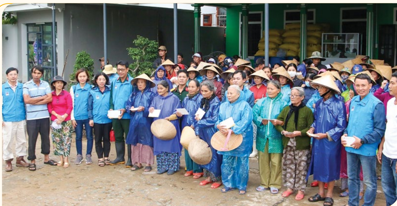
Bà con xã Quảng An, huyện Quảng Điền, tỉnh Thừa Thiên - Huế nhận tấm lòng từ CBCNV BSR

Kiểu sinh sống - rất khó khăn, xã bị cô lập hoàn toàn. Ngày 14/11, Đoàn cứu trợ PV Drilling có mặt tại Quảng Ngãi trao 300 phần quà với tổng trị giá 150 triệu đồng cho người dân bị thiệt hại do bão lụt vừa qua.