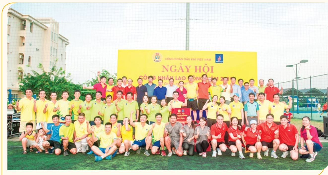
Các VĐV tham gia chương trình Ngày hội Công nhân lao động