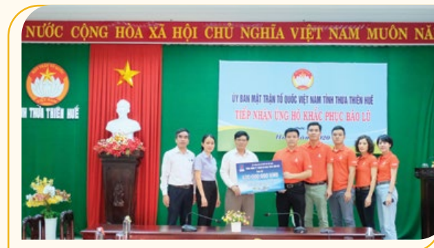
Đoàn công tác PVEP trao 400 triệu đồng ủng hộ của CBNV thông qua UBMTTQ tỉnh Thừa Thiên Huế

Đoàn đã tới làm việc với Ủy ban Mặt trận Tổ quốc tỉnh Thừa Thiên Huế và tỉnh Quảng Trị, trao tượng trưng số tiền 400 triệu đồng cho mỗi tỉnh từ nguồn quyên góp, ủng hộ của cán bộ, nhân viên PVEP cùng các đơn vị thành viên, liên doanh.