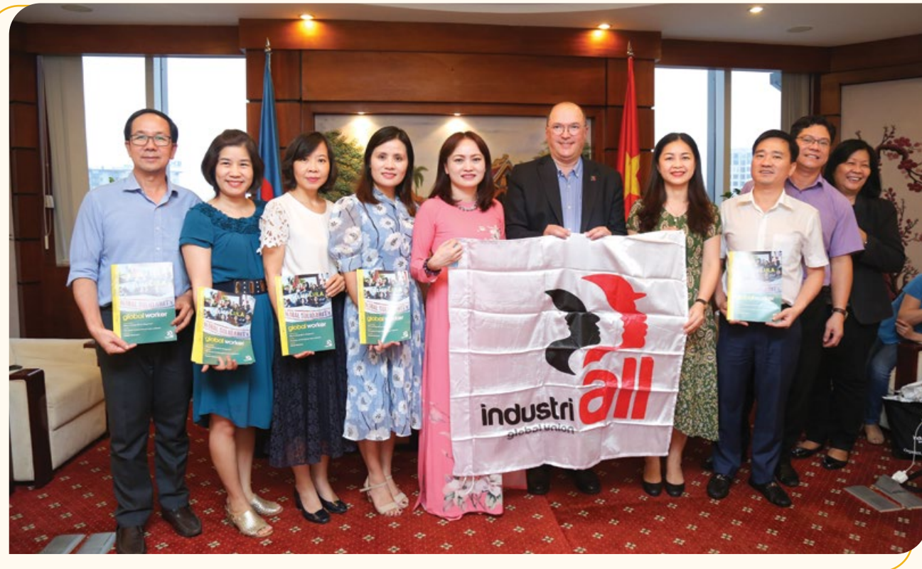
Lãnh đạo CĐ DKVN chụp ảnh lưu niệm với Tổng Thư ký Công đoàn IndustriALL

CĐ DKVN và các cấp công đoàn đã bám sát nhiệm vụ của đơn vị để lựa chọn phương thức hoạt động phù hợp, thiết thực, đáp ứng yêu cầu nhiệm vụ. CĐ DKVN luôn phát huy truyền thống uống nước nhớ nguồn; với phương châm hướng về NLD, vì NLD, vận động và kết nối tất cả những tấm lòng vàng của ngành Dầu khí để xây dựng các Quỹ hỗ trợ các thể hệ cán bộ, CNLD Dầu khí có hoàn cảnh khó khăn, bệnh nặng.