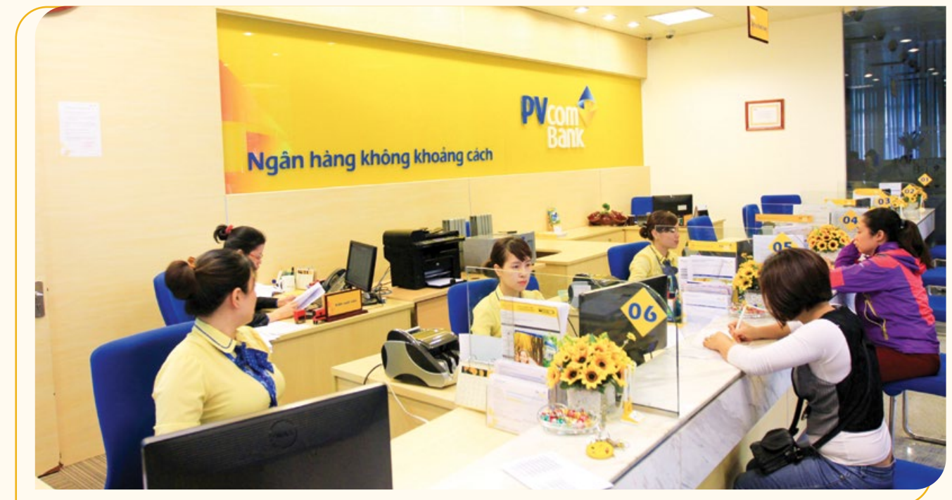
Ngân hàng không khoảng cách - mỗi CBNV PVcomBank đều ý thức việc cho đi là còn mãi, tạo nên nét đẹp trong văn hóa ứng xử, chung tay góp sức những hoàn cảnh khó khăn