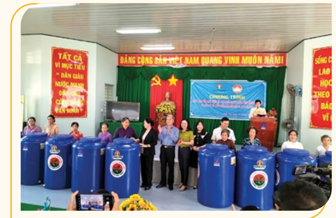
Buổi lễ trao tặng bồn nước cho bà con tỉnh Bến Tre

vụ Đông Xuân. Năm 2021 sắp đến với dự báo thời tiết cực đoan tiếp diễn đòi hỏi nhà nông tăng cường công tác ứng phó. Việc đón nhận bồn chứa nước kịp thời từ DCM giúp bà con thêm niềm tin, thiết thực chuẩn bị kỹ lưỡng cũng như ổn định sinh hoạt.