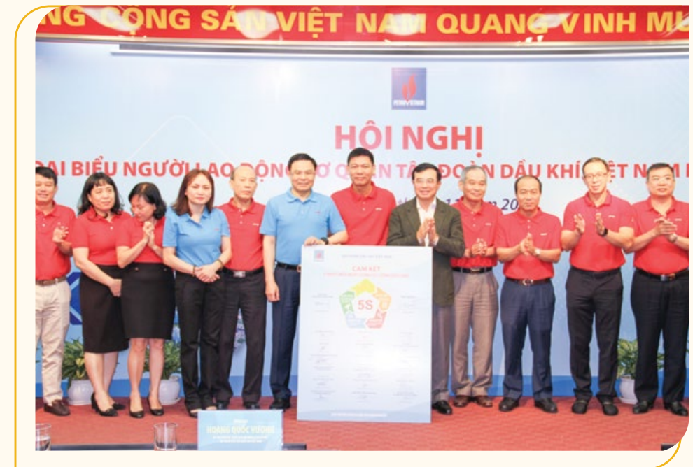
Lãnh đạo Tập đoàn chứng kiến lễ ký giao ước thực hiện 5S tại Cơ quan Tập đoàn

Phát biểu chỉ đạo tại hội nghị, Chủ tịch HĐTV Petrovietnam