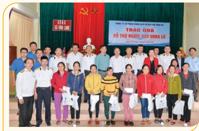
Tặng quà hỗ trợ cho người dân vùng lũ

dân miền Trung khắc phục khó khăn do thiên tai, bão lụt. Đây cũng là hoạt động thể hiện tinh thần đoàn kết trong cộng đồng, góp phần xây dựng hình ảnh tương thân tương ái trong mái nhà chung PTSC./.