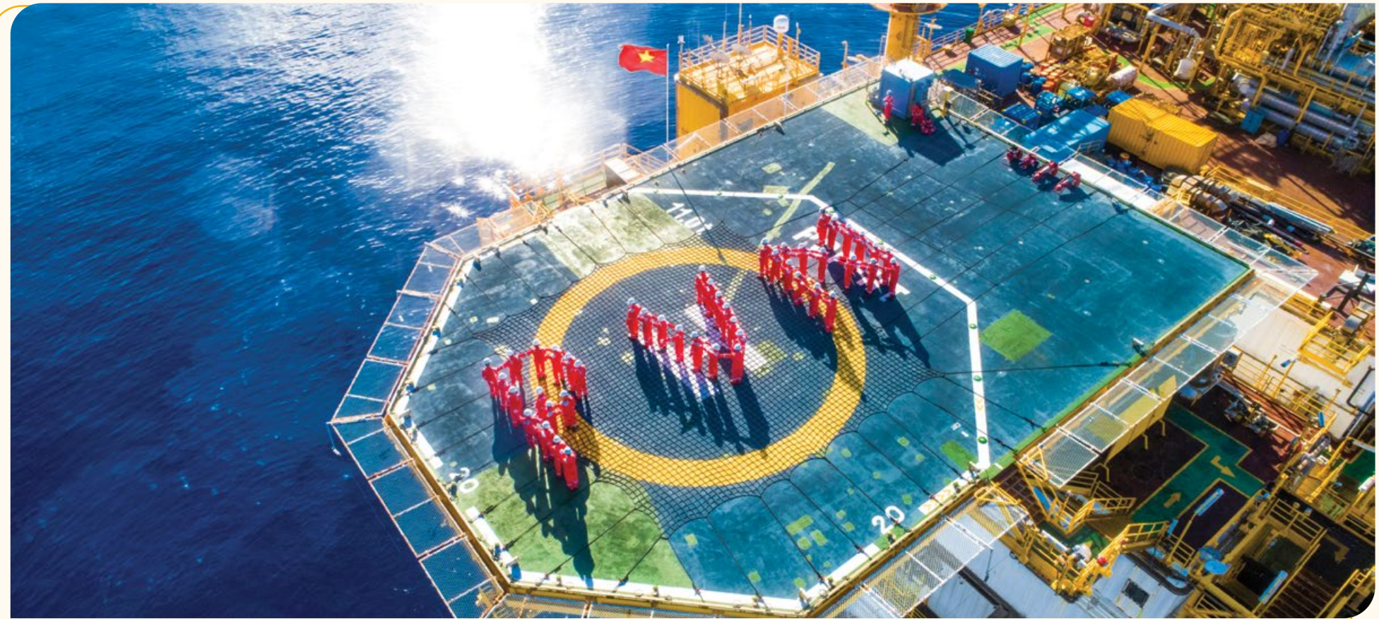
Người lao động Dầu khí trên giàn PQP - HT thuộc Dự án Biển Đông 01

Năm là, Petrovietnam đã xây dựng được đội ngũ những người làm dầu khí hùng hậu, với số lượng lao động hiện có gần 60 nghìn người có trình độ cao,