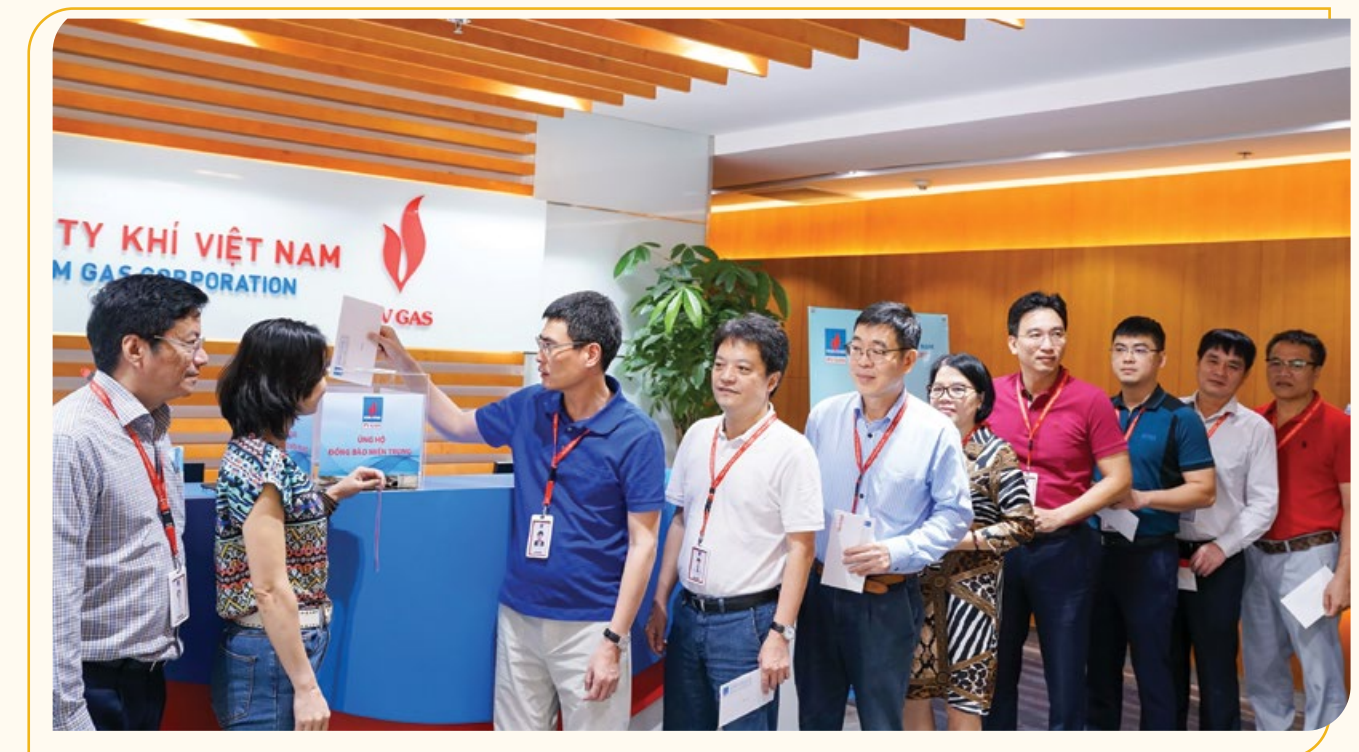
Lãnh đạo, cán bộ, công nhân viên PV GAS tham gia ủng hộ miền Trung. Thùng thiện nguyện được đặt tại Tòa nhà PV GAS đến tháng 11/2020

thiết thực nhằm giúp đỡ các gia đình chịu thiệt hại nặng nề do lụt bão gây ra. Trước đó, PV Drilling phối hợp cùng chính quyền địa phương, thiết lập danh sách người dân khó khăn cùng nhu cầu thực tế của họ, tránh tình trạng đỡ cứu trợ vừa thừa vừa thiếu. Đoàn cũng đã trực tiếp đến thăm hỏi, động viên đối với các hộ gia đình, cá nhân bị thiệt hại nặng nề. Ngày 31/10, đoàn đã trao 400 phần quà tương đương với 200 triệu đồng, mỗi phần quà trị giá 500.000 đồng tại 5 xã tỉnh Quảng Trị bao gồm xã Tà Long (100 phần), xã Cam Thủy (100 phần), xã Hải Thượng (100 phần) và xã Triệu Phong (100 phần). Ngày 1 đến 2/11, đoàn đã trao 400 phần quà, tương đương với 200 triệu đồng, mỗi phần quà trị giá 500.000 đồng tại 2 xã thuộc tỉnh Thừa Thiên Huế là Quảng Phú (200 phần) và Quảng Vinh (200 phần). Đây là các xã đều bị ngập nặng. Bà con nơi đây phải sống chung với lũ hơn hai tuần qua. Lũ chồng lũ càng khiến cuộc sống của họ gặp rất nhiều khó khăn, giao thông bị chia cắt. Tất cả các ngôi nhà đều bị ngập từ 1-2 m hơn 10 ngày nay, lương thực, thực phẩm cạn kiệt. Đặc biệt khu vực xã Tà Long - nơi người đồng bào dân tộc Vân