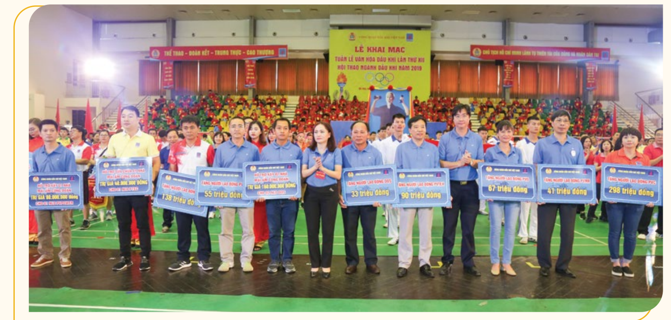
Lãnh đạo CĐ DKVN luôn chăm lo và có hỗ trợ kịp thời đến đời sống của các cán bộ, nhân viên Dầu khí có hoàn cảnh khó khăn

Giáo dục, nâng cao đời sống tinh thần cho đoàn viên NLĐ là nhiệm vụ được CĐ DKVN rất quan tâm. Trong từng giai đoạn phát triển của ngành,