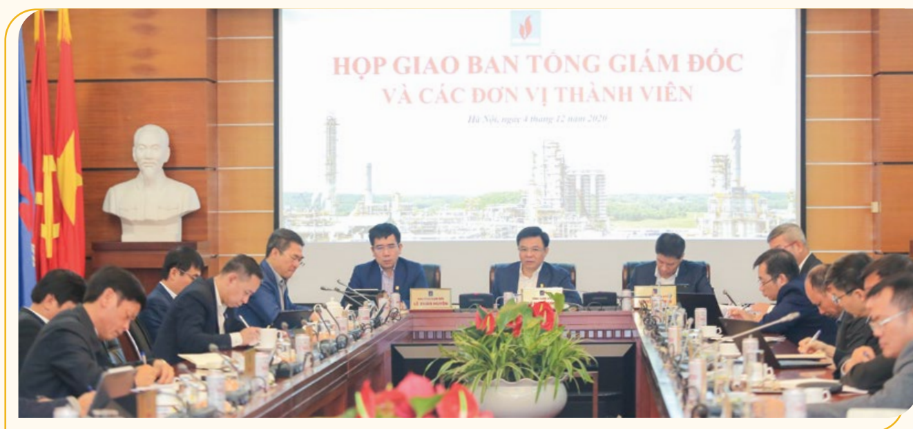
Toàn cảnh buổi làm việc