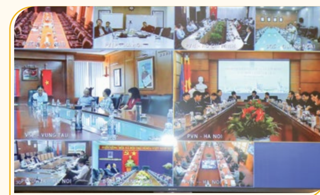
Lãnh đạo các đơn vị tham gia giao ban trực tuyến

dầu bình quân 11 tháng đạt 43,8 USD/thùng, thấp hơn rất nhiều so với giá kế hoạch là 60 USD/thùng. Tính đến hết quý III/2020, các tập đoàn dầu mỏ lớn như: Shell, BP, Chevron... đều ghi nhận các khoản thua lỗ tới hàng chục tỷ USD. Trong đó, BP (Anh) đã báo cáo khoản lỗ khổng lồ tới 16,8 tỷ USD trong quý II và tiếp tục ghi nhận lỗ ròng 450 triệu USD trong quý III; Chevron, "đại gia" dầu mỏ của Mỹ báo cáo khoản lỗ 8,3 tỷ USD trong quý II và khoản lỗ 207 triệu USD trong quý III; Shell (Hà Lan) ghi nhận khoản lỗ 18,15 tỷ USD trong 6 tháng đầu năm 2020. Cùng chung cảnh ngộ, hàng loạt các công ty dầu khí lớn thế giới đã ghi nhận kết quả kinh doanh âm như: ConocoPhillips lỗ 1,5 tỷ USD, Total lỗ 8,3 tỷ USD và ENI lỗ 7,35 tỷ EUR... Trong 3 khu vực kinh tế lớn là Mỹ, Eurozone và Trung Quốc, duy nhất chỉ Trung Quốc có tăng trưởng, còn lại Mỹ, châu Âu đều có dấu hiệu rất tiêu cực.