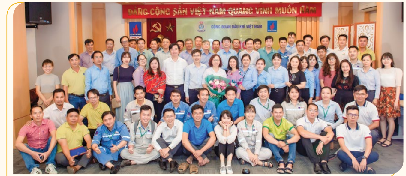
Các đại biểu PVCFC tham dự tập huấn khu vực Tây Nam Bộ chụp ảnh lưu niệm