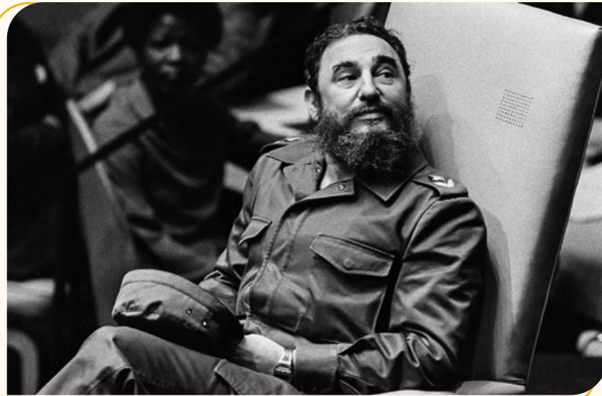
Thủ tướng Chính phủ Cách mạng nước Cộng hòa Cuba Fidel Castro

Đồng chí Fidel Castro (1926 - 2016) là một trong những nhà lãnh đạo chủ chốt của Cách mạng Cuba và nước Cộng hòa Cuba đã nhận định: "Quan hệ Việt Nam - Cuba là mối quan hệ đặc biệt, không có tiền lệ, là hình mẫu của quan hệ quốc tế".