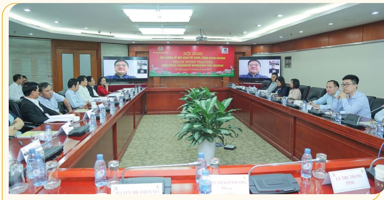
Toàn cảnh hội nghị