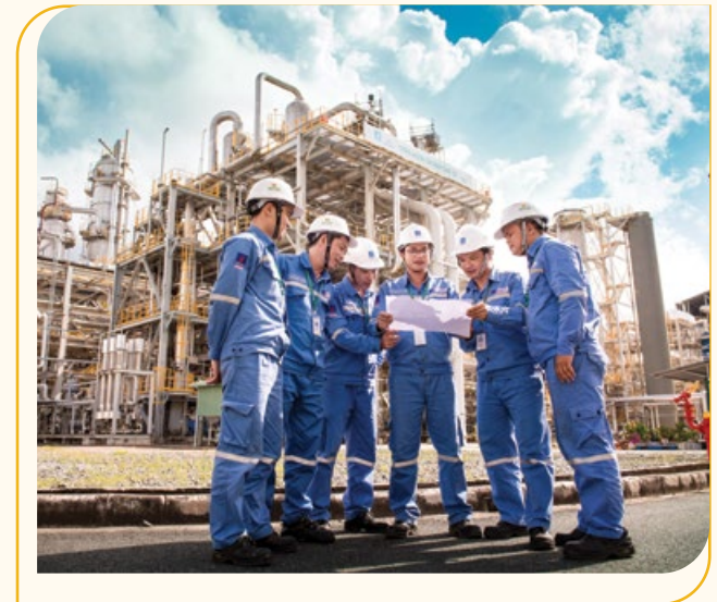
Lao động sáng tạo ở Nhà máy Đạm Cà Mau

Giang học từ những anh công nhân làm việc trực tiếp ngoài công trường trong những ngày đầu, đến những kỹ sư, chuyên gia, những tài liệu trong nước, quốc tế. Mấy năm trước, vào những ngày nghỉ cuối tuần, anh lại khăn gói lên TP HCM học tiếp