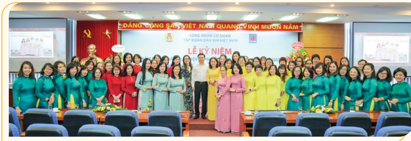
Lãnh đạo Tập đoàn, CĐ DKVN chụp ảnh lưu niệm với toàn thể nữ cán bộ, nhân viên Cơ quan Tập đoàn