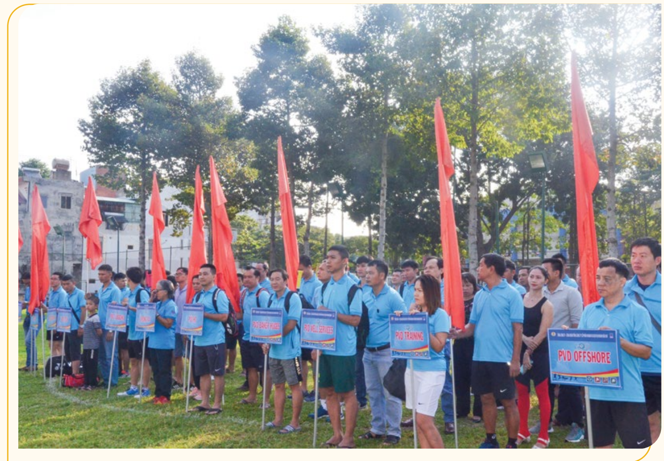
Toàn cảnh Hội thao PV Drilling lần thứ 19

Nhân buổi khai mạc, nhằm hỗ trợ cho các gia đình người lao động trước ảnh hưởng bởi lũ lụt, thiên tai trong tháng 10 vừa qua và đẩy mạnh thực hiện các chương trình "Phúc lợi cho đoàn viên" giúp người lao động an tâm lao động sản xuất và tiếp tục đồng hành cùng PV Drilling, Tổng công ty và Công đoàn PV Drilling đã trao phần quà hỗ trợ cho các gia đình CBCNV đang làm việc tại PV Drilling bị thiệt hại bởi bão lũ tại miền Trung với tổng số tiền hỗ trợ lên đến hơn 140 triệu đồng.