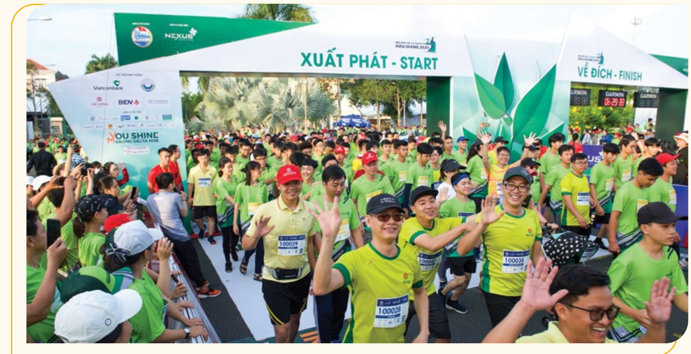
CBCNV PVCFC hứng khởi tham gia Giải Hậu Giang Marathon 2020