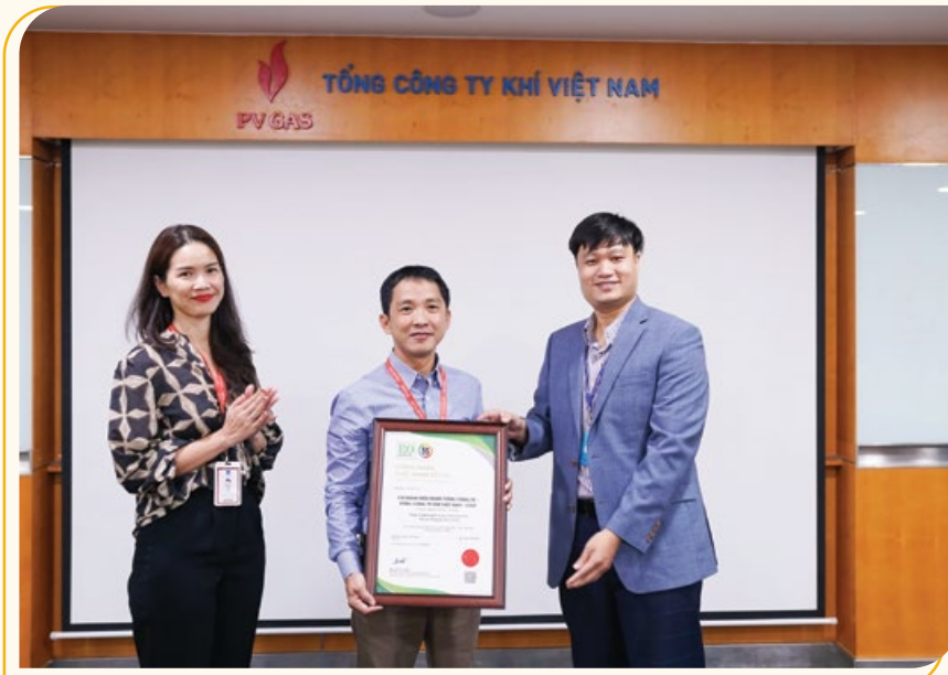
Viện Năng suất Việt Nam cấp chứng nhận thực hành tốt 5S cho Cơ quan Điều hành PV GAS