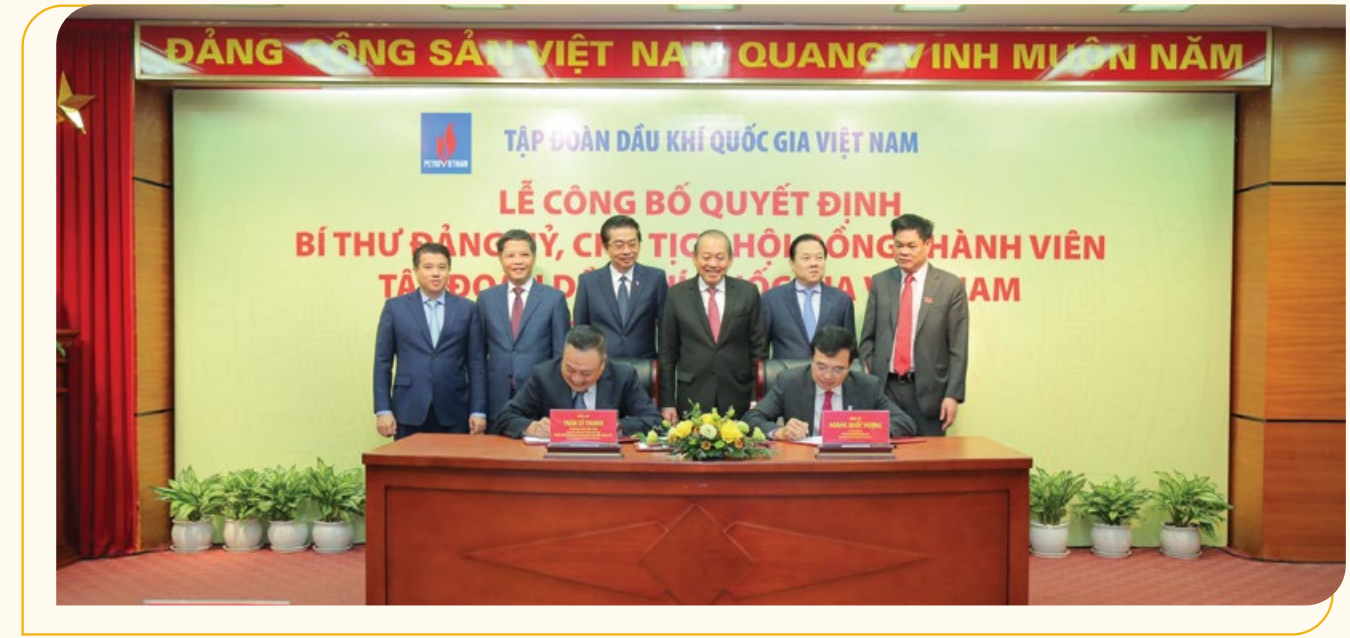
Phó Thủ tướng Thường trực Trương Hòa Bình và các đồng chí lãnh đạo Đảng, Nhà nước chứng kiến lễ ký bàn giao nhiệm vụ

Nhắc lại truyền thống vẻ vang của Tập đoàn Dầu khí Việt Nam, đồng chí Hoàng Quốc Vượng khẳng định các thế hệ lãnh đạo và cán bộ, công nhân viên ngành Dầu khí nói chung, Tập đoàn Dầu khí Việt Nam nói riêng đã có những đóng góp to lớn, không thể phai nhạt