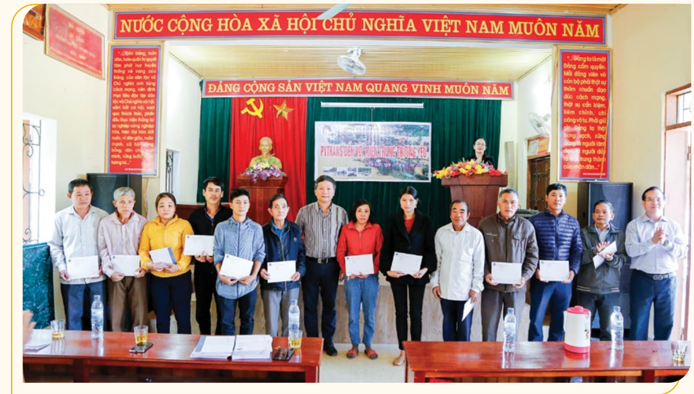
Chủ tịch Công đoàn PVTrans tặng quà hỗ trợ cho người dân chịu ảnh hưởng thiên tai