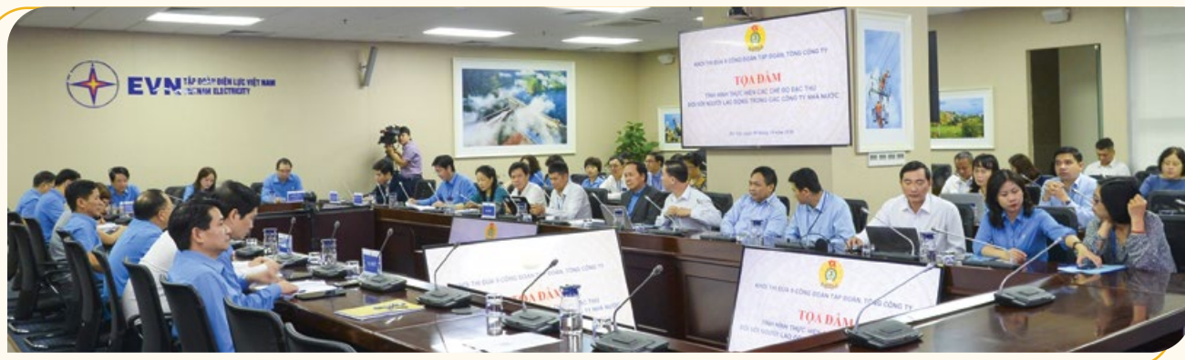
Toàn cảnh buổi tọa đàm