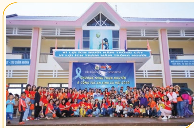
Tổ chức các hoạt động an sinh xã hội tại Trường Tiểu học Ngô Gia Tự, xã Đắk Môi, huyện Đắk Song, tỉnh Đắk Nông

để "Ứng dụng công nghệ 4.0 nâng cao hiệu quả công việc", cùng với tập huấn kỹ năng làm việc nhóm, gắn kết sức mạnh tập thể với chủ đề "Vượt gian nan, đập tan thách thức" nhằm cung cấp và hướng dẫn cách sử dụng hiệu quả những tiện ích của công cụ ứng dụng và mạng xã hội hiện nay để gửi mail, cách ghi chú nhắc lịch, lên kế hoạch, họp trực tuyến, lưu trữ & chia sẻ thông tin dữ liệu. Chương trình đã kết thúc thành công tốt đẹp, tạo thêm sự đoàn kết gắn bó, giao lưu học hỏi giữa cán bộ nữ công và đoàn viên thanh niên tại các đơn vị, qua đó giúp các thành viên tham gia được đào tạo, trau dồi các kỹ năng, kiến thức để nâng cao hiệu quả cho công việc, cũng như kinh nghiệm để tổ chức các hoạt động thiết thực của đơn vị mình trong thời gian tới./.