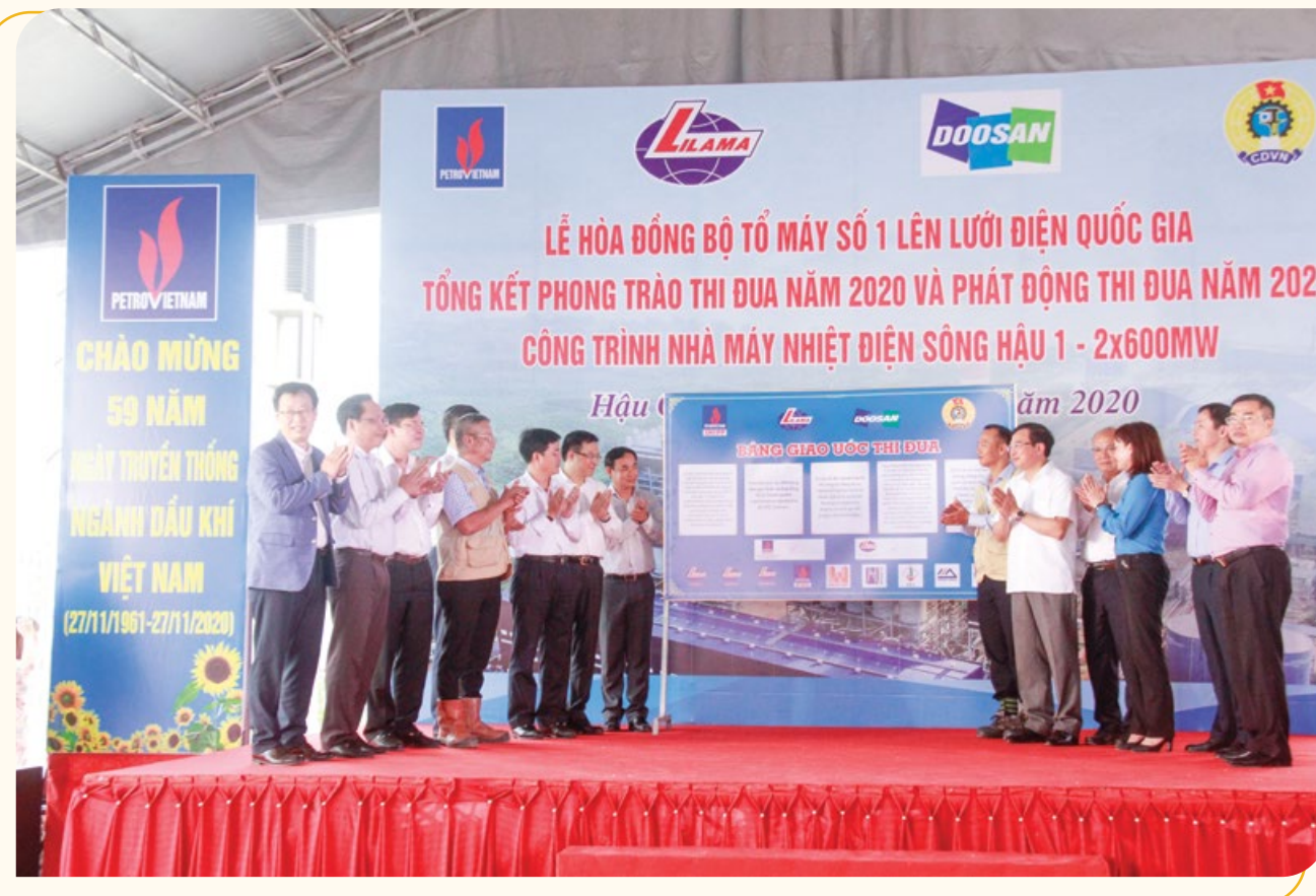
Nghi thức Ký kết giao ước thi đua năm 2021

Sáng ngày 26/11/2020, trên công trường Dự án Nhà máy Nhiệt điện (NMNĐ) Sông Hậu 1 (ấp Phú Xuân, thị trấn Mái Dầm, huyện Châu Thành, tỉnh Hậu Giang), Chủ đầu tư Tập đoàn Dầu khí Việt Nam (Petrovietnam), Ban QLDA Điện lực Dầu khí Sông Hậu 1 đã tổ chức thành công sự kiện hòa đồng bộ Tổ máy số 1 vào hệ thống điện quốc gia 500kV, tổ chức Lễ tổng kết các phong trào thi đua năm 2020 của NMNĐ Sông Hậu 1.