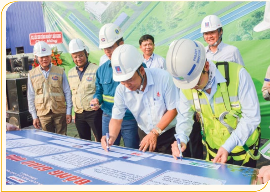
Ký cam kết, giao ước thi đua trên công trường NMND Sông Hậu 1

Thấy rõ được đặc điểm đặc thù hoạt động của ngành và những định hướng của Đảng, trong những năm qua, Công đoàn Dầu khí Việt Nam luôn trú trọng bám sát việc tổ chức phong trào thi đua yêu nước trong CNLĐ, trong đó phong trào lao động sáng tạo luôn là điểm nhấn nổi bật và có giá trị thiết thực nhất. Công đoàn Dầu khí Việt Nam tập trung chỉ đạo, hướng dẫn các cấp công đoàn trong toàn ngành tranh thủ sự lãnh đạo của cấp ủy Đảng, sự phối hợp và tạo điều kiện của chuyên môn cùng cấp, bằng nhiều hình thức đa dạng, phong phú, bám sát mục tiêu nhiệm vụ của Tập đoàn và các cấp đơn vị, xây dựng thành chương trình kế hoạch, nội dung thi đua phù hợp, động viên CNLĐ phát huy năng động, sáng tạo, cải tiến kỹ thuật, cải tiến quản lý, ứng dụng hiệu quả khoa học, công nghệ tiên tiến, góp phần vào thúc đẩy sản xuất, nâng cao chất lượng sản phẩm, hoàn thành các mục tiêu nhiệm vụ đơn vị; đồng thời góp phần quan trọng giúp doanh nghiệp vượt qua những khó khăn trong sản xuất kinh doanh, để