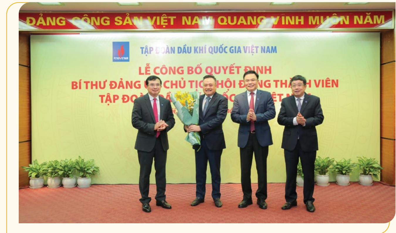
Đồng chí Hoàng Quốc Vượng và lãnh đạo Tập đoàn tặng hoa tri ân đồng chí Trần Sỹ Thanh

Tới dự buổi lễ, có các đồng chí Ủy viên Trung ương Đảng: Trần Tuấn Anh, Bộ trưởng Bộ Công Thương; Huỳnh Tấn Việt, Bí thư Đảng ủy Khối các cơ quan Trung ương; Võ Văn Dũng, Phó Trưởng ban Thường trực Ban Nội chính Trung ương; Nguyễn Hoàng Anh, Chủ tịch Ủy ban Quản lý vốn Nhà nước tại doanh nghiệp; Trần Sỹ Thanh, Phó Chủ nhiệm Văn phòng Quốc hội, nguyên Bí thư Đảng ủy, Chủ tịch Hội đồng Thành viên Tập đoàn Dầu khí Việt Nam; đồng chí Y Thanh Hà Niê Kđăm,