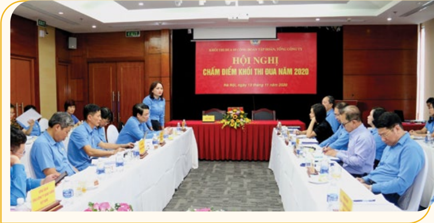
Toàn cảnh hội nghị

Ngày 13/11, Khối Thi đua 9 công đoàn Tập đoàn, Tổng công ty (Khối Thi đua) đã tổ chức Hội nghị chấm điểm Khối Thi đua năm 2020.