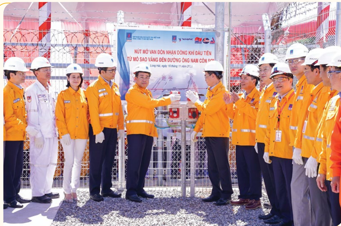
Nghi thức đón nhận dòng khí đầu tiên từ mỏ Sao Vàng - Đại Nguyệt đến đường ống Nam Côn Sơn 2