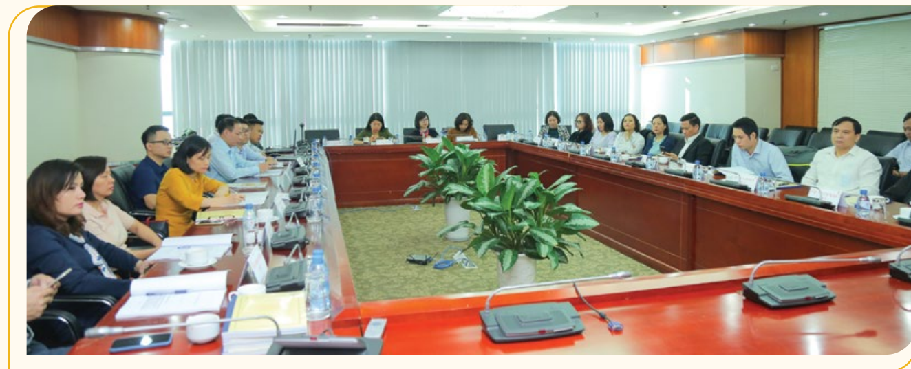
Các đại biểu dự hội nghị tập huấn về mô hình tổ chức công đoàn ngành