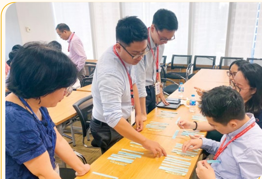
Toàn bộ nhân viên CQĐH TCT đều được tập huấn thực hành 5S

Nam - CTCP (PV GAS), chương trình 5S đã sớm được triển khai và áp dụng rộng rãi tại nhiều đơn vị thành viên, trực thuộc như: