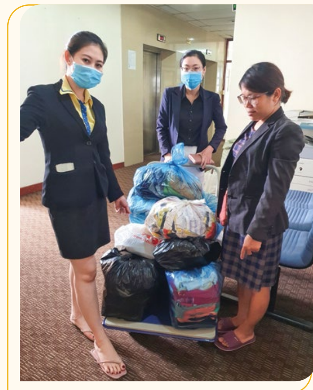
Công đoàn PVcomBank hỗ trợ đồ dùng thiết yếu cho người dân chịu ảnh hưởng bởi thiên tai

Bên cạnh việc quyên góp hơn 30 triệu đồng theo