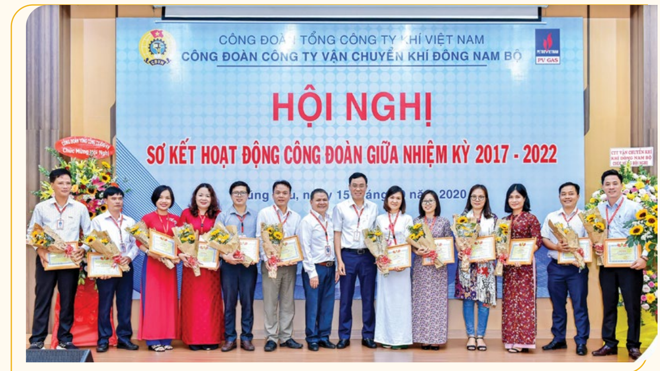
Khen thưởng các cán bộ công đoàn xuất sắc

Công đoàn PV GAS cũng đã trao khen thưởng cho các tập thể đã có thành tích trong phong trào thi đua triển khai các dự án trọng điểm; phối hợp