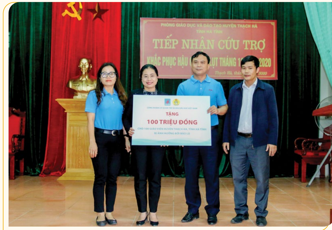
Đoàn công tác Công đoàn Cơ quan Tập đoàn trao quà hỗ trợ các giáo viên huyện Thạch Hà bị thiệt hại do mưa lũ