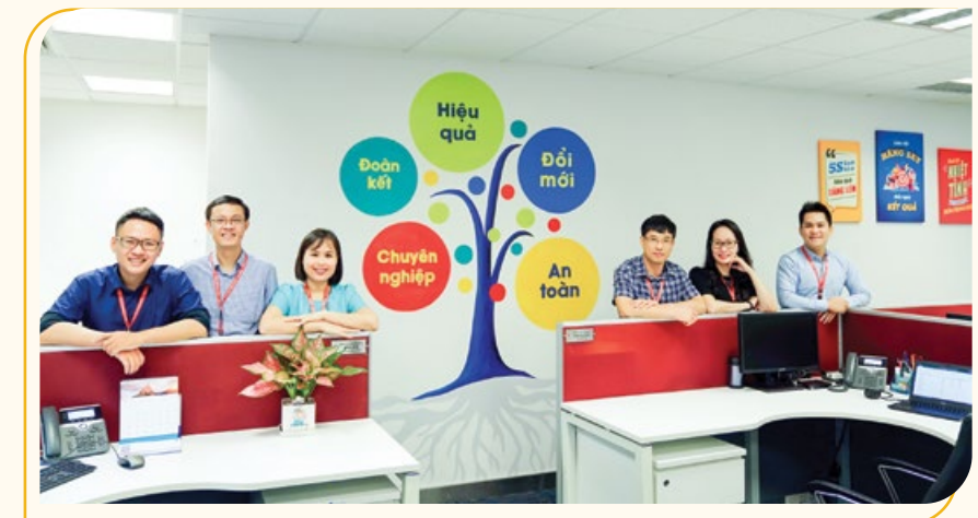
Một góc đổi mới mang tinh thần đoàn kết và tuyên truyền Văn hóa PV GAS

Ban 5S được thành lập và được đào tạo về phương pháp triển khai, đặt mục tiêu và lập kế hoạch cụ thể, cùng hệ thống tài liệu, chính sách 5S, quy định thực hành tốt 5S được xây dựng và ban hành. 16 CBNV từ các ban được đào tạo trở thành đánh giá viên nội bộ 5S. 100% CBNV CQĐH TCT được đào tạo để