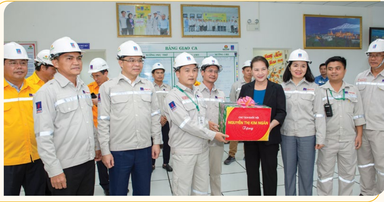
Chủ tịch Quốc hội Nguyễn Thị Kim Ngân thăm, làm việc và tặng quà cho CBCNV tại Nhà máy Đạm Cà Mau