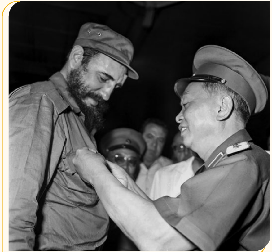
Đại tướng Võ Nguyên Giáp và đồng chí Fidel Castro

Tại buổi chiêu đãi từ biệt của Đoàn đại biểu Đảng và Chính phủ Cuba, tối ngày 16/9/1973 tại Hà Nội, Tổng Bí thư Lê Duẩn nhận định: "Mối tình hữu nghị Việt Nam - Cuba xây dựng trên