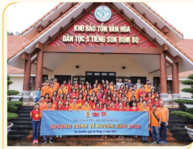
Đoàn chụp hình lưu niệm tại khu bảo tồn văn hóa dân tộc S'Tiếng Sok Bom Bo

Cùng với các hoạt động về nguồn và kết hợp an sinh xã hội là chương trình tập huấn với chuyên