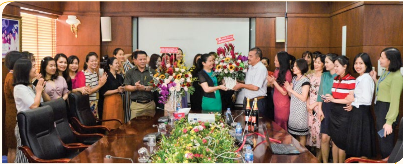
Ban lãnh đạo PVC-MS chúc mừng nữ CBCNV nhân kỷ niệm 90 năm Ngày thành lập Hội LHPNVN