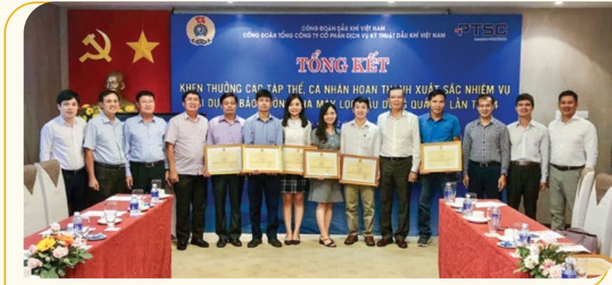
Khen thưởng các điển hình xuất sắc trong Dự án Bảo dưỡng NMLD Dung Quất

Vừa qua, Công đoàn Tổng công ty Cổ phần Dịch vụ Kỹ thuật Dầu khí Việt Nam (PTSC) đã tổ chức tổng kết khen thưởng các tập thể, cá nhân hoàn thành xuất sắc nhiệm vụ tại Dự án Bảo dưỡng Nhà máy Lọc dầu (NMLD) Dung Quất lần thứ 4 theo hình thức trực tuyến tại hai điểm cầu PTSC Quảng Ngãi và Khách sạn Dầu khí PTSC. Đây là dự án do PTSC Quảng Ngãi, PPS và POS triển khai.