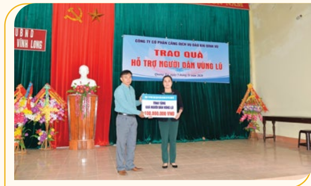
PTSC Đình Vũ trao hỗ trợ tại tỉnh Quảng Trị