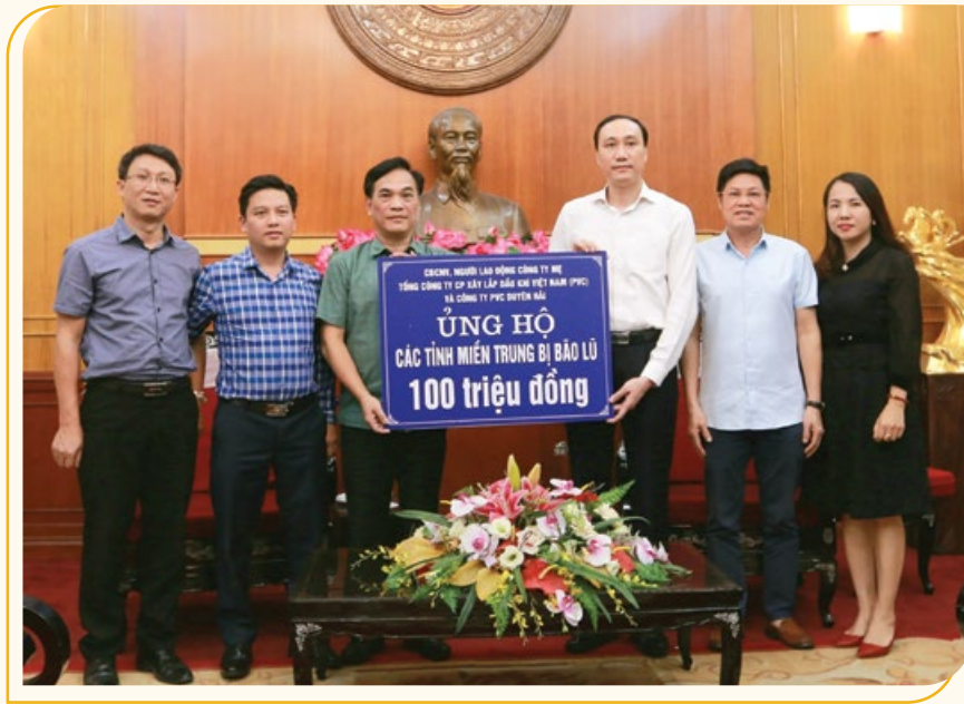
Lãnh đạo PVC trao 100 triệu đồng ủng hộ đồng bào miền Trung khắc phục hậu quả lũ lụt

Theo thống kê chưa đầy đủ, đến nay Vietsovpetro đã ủng hộ 4 tỷ đồng, PVI ủng hộ 1 tỷ đồng, Phú Quốc POC ủng hộ 580 triệu đồng; PVTrans ủng hộ 400 triệu đồng; BIENDONG POC ủng hộ 530 triệu đồng... Công ty Cổ phần Lọc hóa dầu Bình Sơn (BSR) đã tài trợ tỉnh Quảng Ngãi 1 tỷ đồng để khắc phục hậu quả bão số 9; PETROSETCO đã phát động và trích từ nguồn kinh phí an sinh xã hội, nguồn đóng góp của người lao động trên 1,5 tỷ đồng dành ủng hộ đồng bào miền Trung; Viện Dầu khí Việt Nam (VPI) quyên góp ủng hộ số tiền hơn 160 triệu đồng; cán bộ, công nhân viên PVU ủng hộ hơn 30 triệu đồng; Tổng công ty Cổ phần Xây lắp Dầu khí - (PVC) ủng hộ 100 triệu đồng; PVChem quyên góp từ CBCNV ủng hộ hơn 56 triệu đồng; VNPOLY ủng hộ 18 triệu đồng, 40 áo phao, 20 phao cứu sinh và hàng trăm bộ quần áo ấm cho đồng bào vùng lũ; Ban QLDA Điện lực Dầu khí Thái Bình 2 ủng hộ số tiền là 50,9 triệu đồng và nhiều vật dụng, nhu yếu phẩm, bao gồm: 45 thùng quần áo, 52 thùng mì tôm, áo phao... thăm hỏi, động