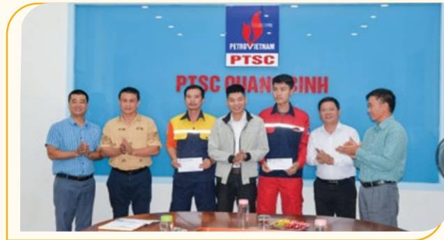
Trao hỗ trợ tại PTSC Quảng Bình

Chuỗi hoạt động lần này của PTSC Đình Vũ thể hiện tinh thần chung của cả nước "Vì một miền Trung thân yêu", chung tay góp sức, giúp đỡ người