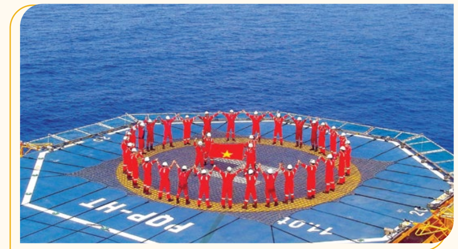
Người lao động Dầu khí trên giàn PQP - HT

Ngày 20/7/1975 - nghĩa là chưa đầy ba tháng sau khi Giải phóng miền Nam thống nhất đất nước, Bộ Chính trị họp tại