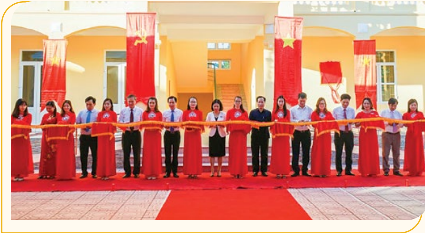
Các đại biểu cắt băng khánh thành Trường THCS Bàng La

Ngày 20/11/2020, Tổng công ty Điện lực Dầu khí Việt Nam - CTCP (PV Power) đã long trọng tổ chức Lễ khánh thành nhà học 2 tầng 8 phòng học Trường Trung học cơ sở Bàng La, quận Đồ Sơn, thành phố Hải Phòng.