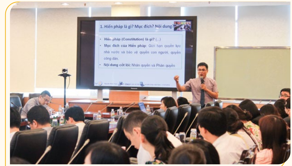
Công đoàn viên PVcomBank tại lớp đào tạo kiến thức pháp luật