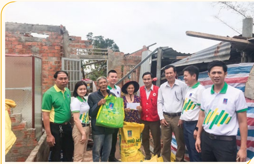
Đại diện Ban lãnh đạo PVFCCo thăm hỏi và tặng quà bà con nông dân vùng lũ

Theo đó, tổng số tiền các CBCNV PVFCCo quyên góp được là trên 1 tỷ đồng. Trong tháng 10 và tháng 11, TCT đã phối hợp với các đơn vị vùng miền, Hội Chữ thập đỏ tổ chức nhiều đoàn trực tiếp đi tặng quà và động viên bà con nông dân bị thiệt hại. Đặc biệt, không chỉ chung tay giúp đỡ "người ngoài", Công đoàn PVFCCo còn thực hiện hỗ trợ người thân của CBCNV PVFCCo đang sinh sống giữa vùng lũ. Tính đến nay, Công đoàn PVFCCo và