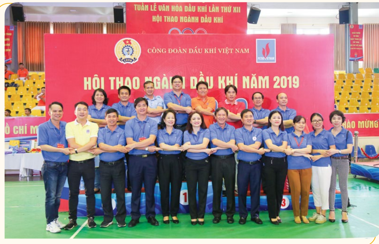
CĐ DKVN luôn động viên đoàn viên, người lao động Dầu khí sống nghĩa tình, chung sức đồng lòng để xây dựng Tập đoàn ngày càng phát triển

Trong suốt 29 năm xây dựng và phát triển, Công đoàn Dầu khí Việt Nam (CĐ DKVN) luôn phát huy vai trò của mình, nỗ lực bảo vệ quyền và lợi ích hợp pháp, chính đáng, chăm lo tốt đời sống vật chất, tinh thần cho người lao động (NLĐ), luôn sáng tạo, đổi mới, thể hiện tính tiên phong trên nhiều lĩnh vực. Vị thế, vai trò của CĐ DKVN đã dần được khẳng định, trở thành chỗ dựa đáng tin cậy của 6 vạn NLĐ Dầu khí, là một trong những đơn vị dẫn đầu trong hệ thống Công đoàn Việt Nam trong suốt thời gian qua.