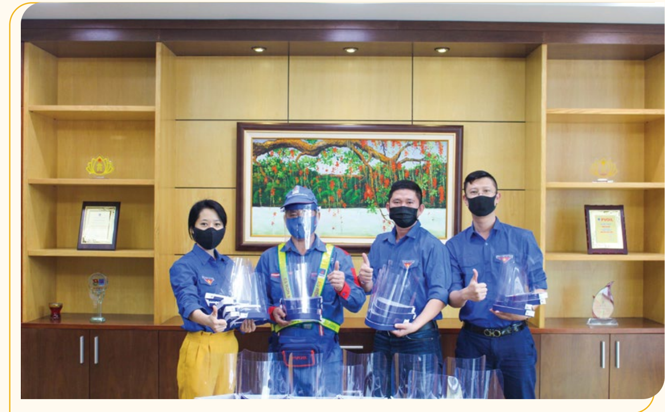
CĐ DKVN đã đẩy mạnh thi đua "lao động giỏi, lao động sáng tạo" và quyết định khen thưởng đột xuất trong phòng chống dịch Covid-19 ngay từ đầu năm

Đối với các đảng viên thuộc chi bộ cơ quan CĐ DKVN phối hợp lồng ghép tuyên truyền học tập và làm theo tư tưởng, đạo đức, phong cách của Bác Hồ trong các hoạt động chuyên môn, các hoạt động phối hợp. Tiếp tục nghiên cứu học tập tư tưởng, đạo đức, phong cách Hồ Chí Minh trong các cuộc sinh hoạt thường kỳ của chi bộ. Xây dựng tinh thần đoàn kết, tương thân tương ái, ý thức tiết kiệm, chống tham ô, lãng phí, xa hoa; Xây dựng tinh thần lao động, sáng tạo cần cù, chất lượng cao, chống chây lười ỷ lại, vô kỷ luật. Xây dựng ý thức công dân, ý thức cộng đồng gắn kết ứng xử văn hóa Dầu khí. Cấp ủy chi bộ, tổ chức công đoàn chủ động xây dựng nội dung học tập và làm theo tư tưởng, đạo đức, phong cách Hồ Chí Minh vào chương trình hành động cụ thể trong tổ chức thực hiện các nhiệm vụ chính trị.