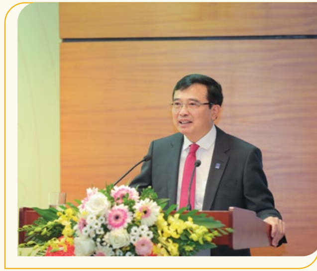
Chủ tịch HĐTV Petrovietnam Hoàng Quốc Vượng phát biểu tại buổi lễ

Trong năm 2020, khi mà ngành công nghiệp dầu khí thế giới chịu tác động nặng nề, sâu rộng bởi dịch Covid-19 và giá dầu giảm sâu, nhiều tập đoàn, công ty dầu khí quốc tế lâm cảnh thua lỗ, phá sản, giải thể..., với tinh thần và quyết tâm cao nhất, phát huy truyền thống Anh hùng của "Những người đi tìm lửa", toàn Tập đoàn đã tập trung mọi nguồn lực để thực hiện đồng bộ, có hiệu quả gói giải pháp ứng phó tác động kép của đại dịch Covid-19 và giá dầu giảm sâu. Nhờ đó, đến thời điểm hiện tại, có thể khẳng định toàn Tập đoàn đã vượt qua những khó khăn từ tác động kép để hoàn thành tốt nhất các nhiệm vụ, chỉ tiêu được Đảng, Chính phủ giao. Hoạt động sản xuất kinh doanh của Petrovietnam tiếp tục có lãi, nhịp độ sản xuất kinh doanh được giữ vững, ổn định, đảm bảo an toàn ngay cả trong thiên tai trầm trọng, kéo dài vừa qua. Các chỉ tiêu sản xuất thuộc lĩnh vực cốt lõi của Tập đoàn như gia tăng trữ lượng dầu khí, khai thác dầu ở trong nước, khai thác dầu ở nước ngoài, sản xuất đạm... đều hoàn thành vượt mức kế hoạch đề ra; dòng tiền của Tập đoàn được đảm bảo thông suốt, đáp